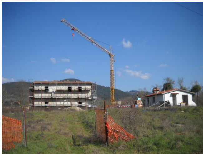
- Edificio A -