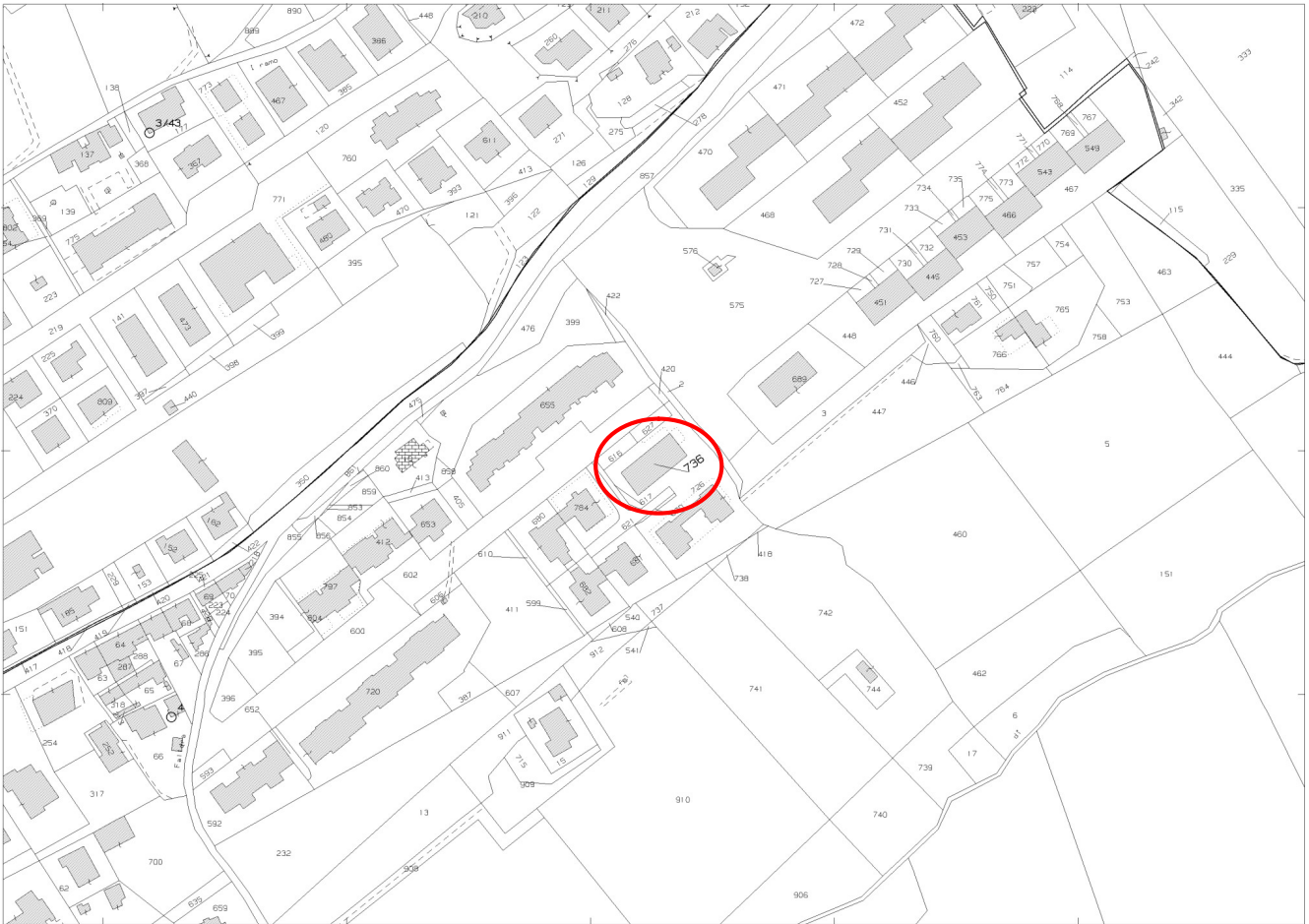
Estratto di mappa catastale – Foglio 44 del Catasto di Fermo

Categoria F/3 (Fabbricati in costruzione) – Via Pietro Paolo Rubens SNC – Piano S1