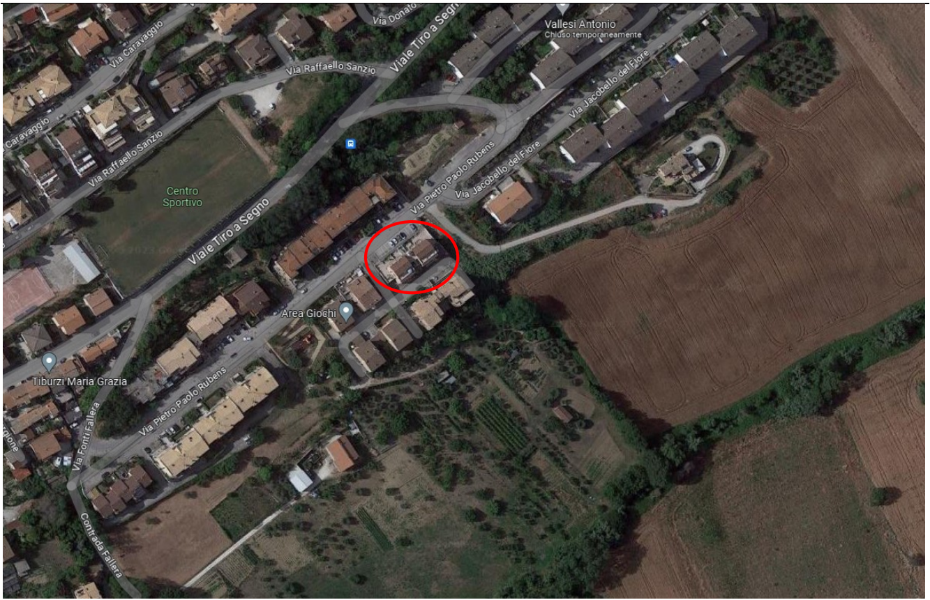
Figura n°1 – Inquadramento territoriale

Da accesso agli atti presso il Comune di Fermo, si è presa visione della seguente documentazione autorizzativa dell'immobile: