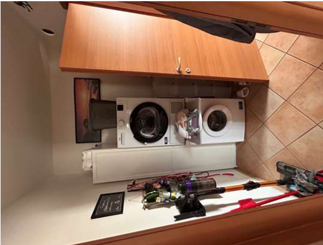
Figura 8: disimpegno