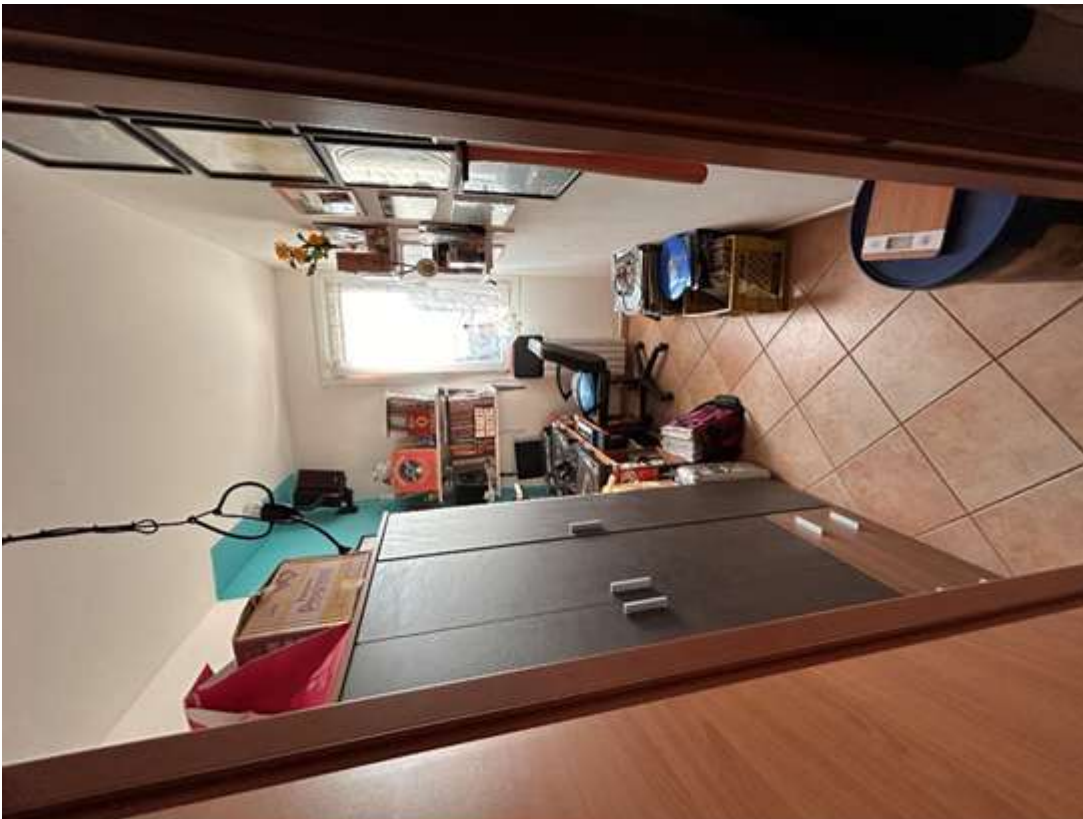
Figura 11: guardaroba