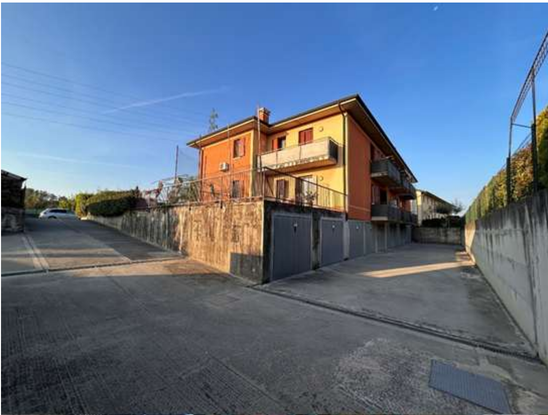
Figura 5: esterni e autorimesse