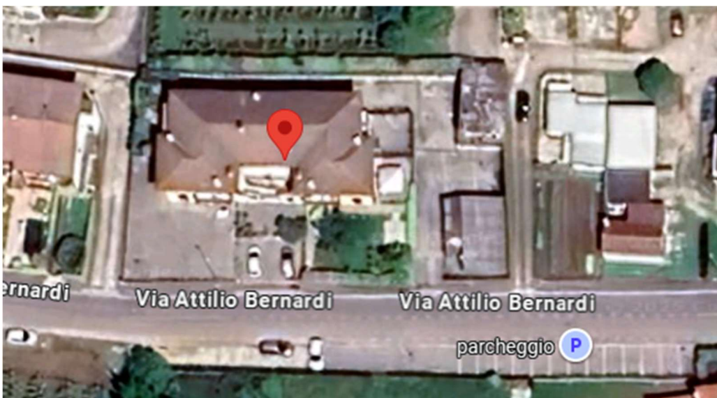
Figura 1: individuazione dei beni con Google Maps

La particella 1393 risulta avere come confini in senso NESO: mn 944, 1544, 21, 646, Via Attilio Bernardi (1421, 1051), 1210, 1351, tutti nel foglio 4.