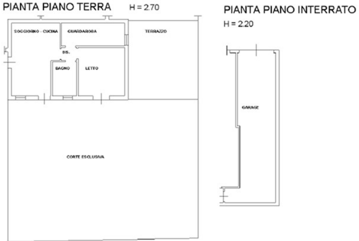
Figura 14: estratto da planimetria catastale