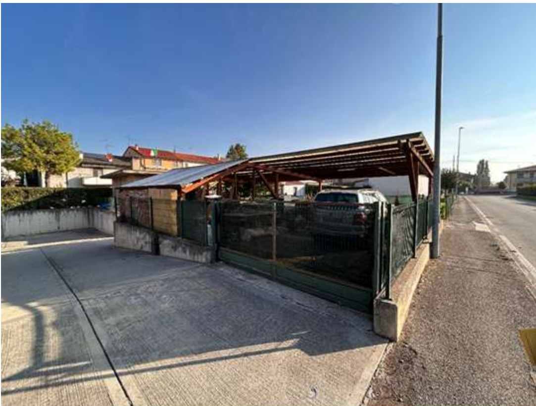
Figura 13: sub 22