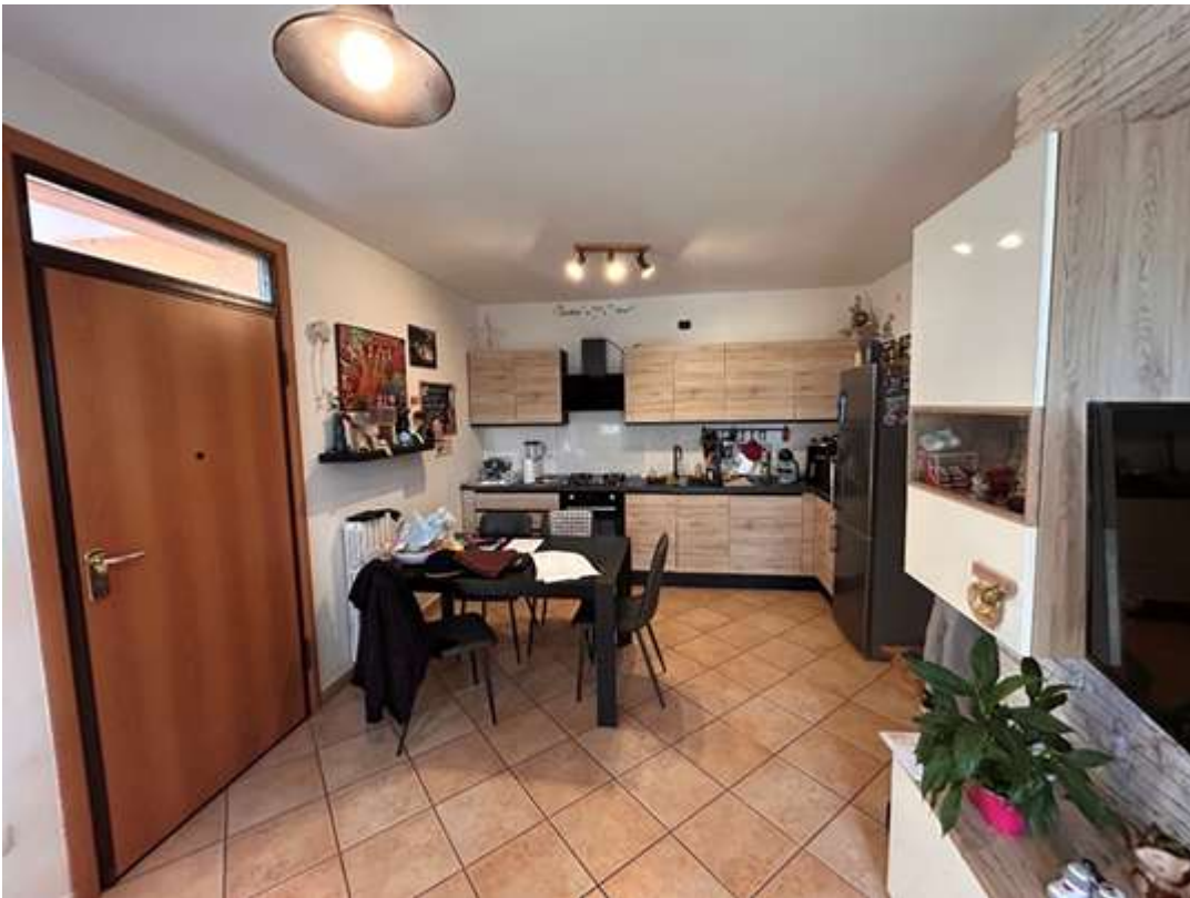
Figura 6: zona giorno