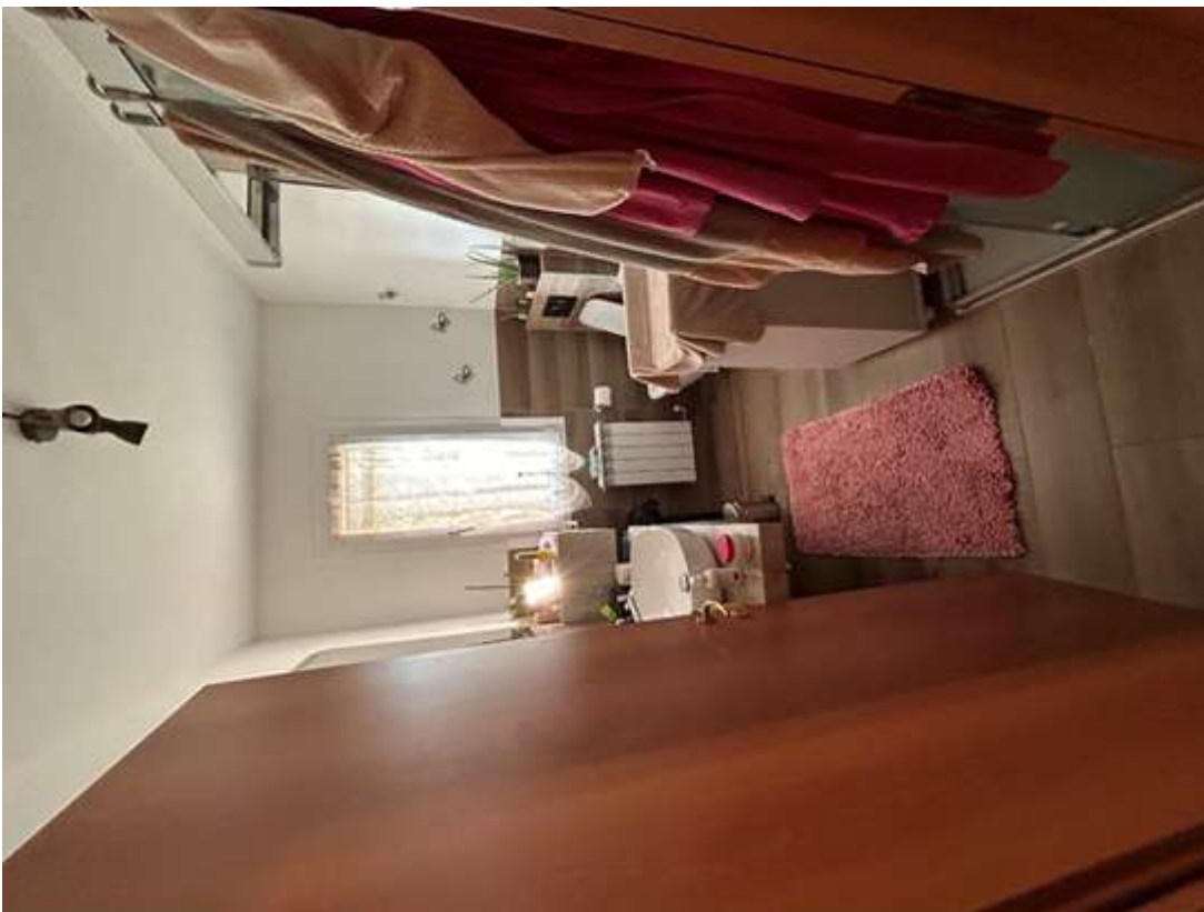
Figura 9: bagno