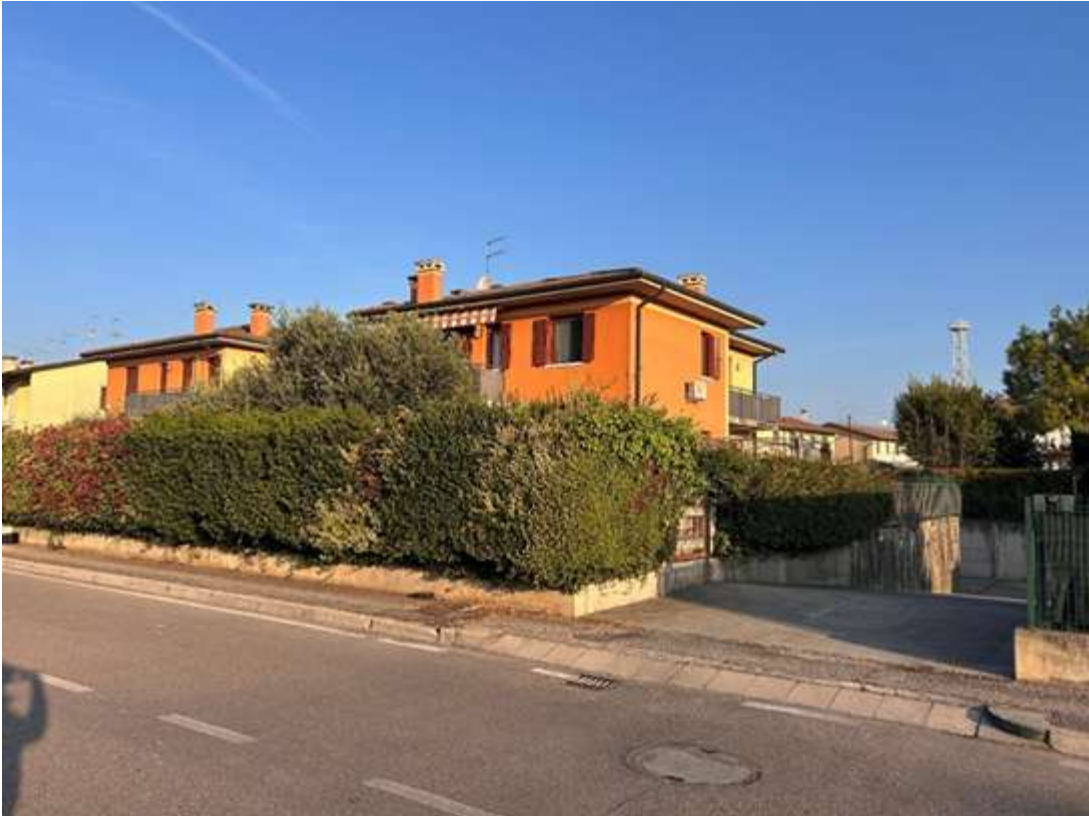
Figura 2: esterni e scivolo autorimesse