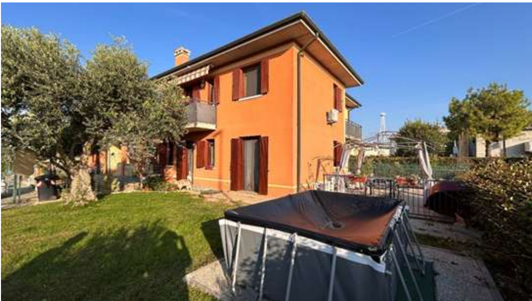
Figura 3: giardino