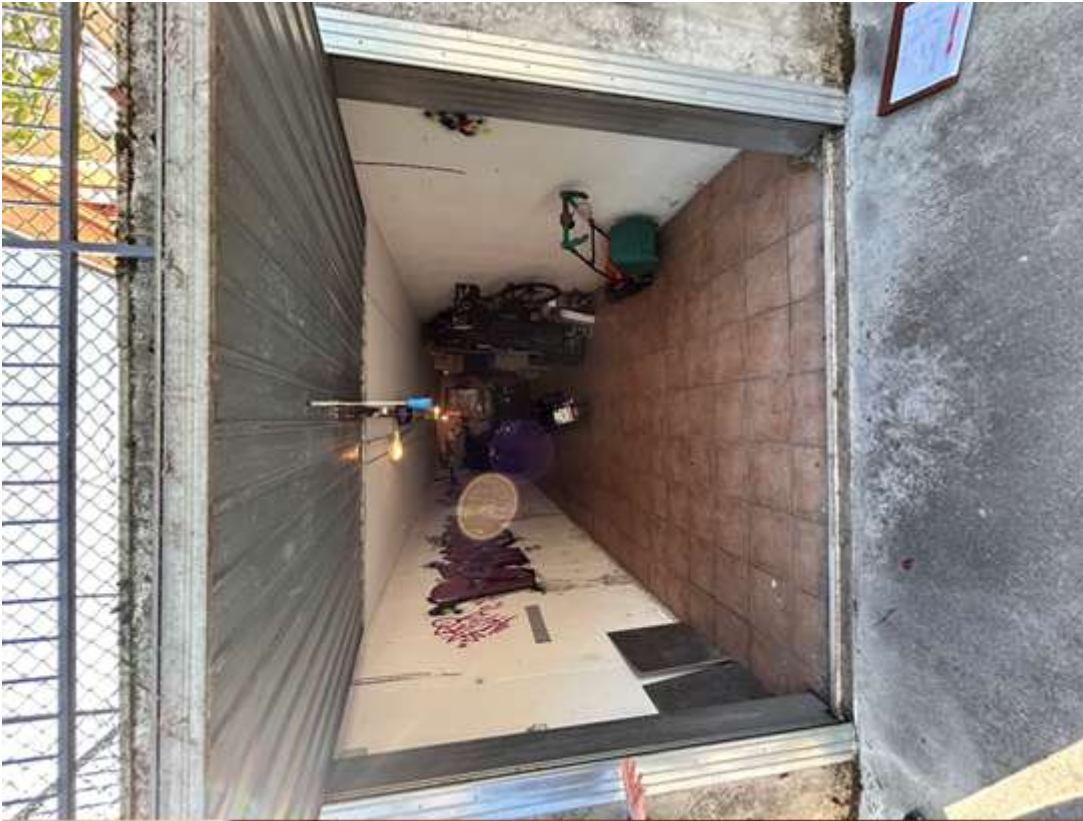
Figura 12: autorimessa