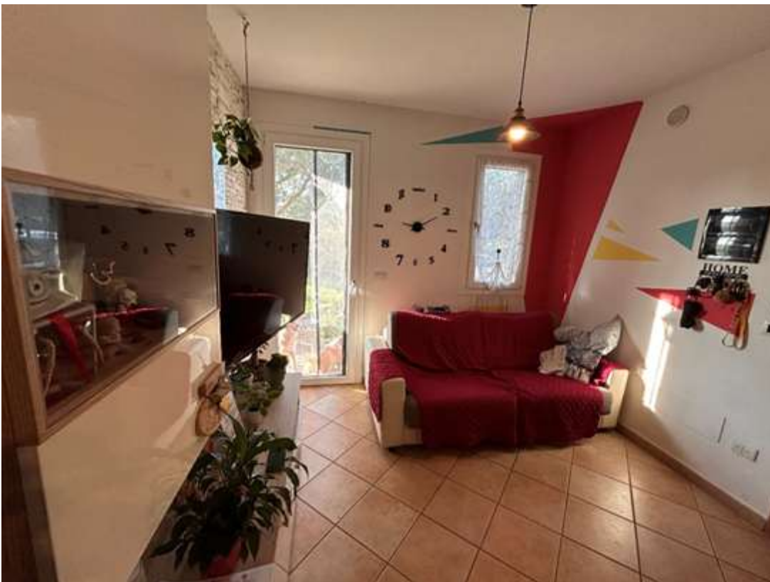
Figura 7: zona giorno