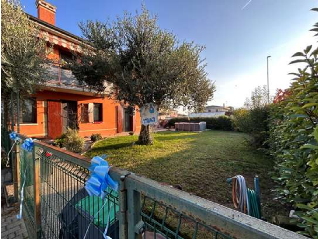
Figura 4: giardino