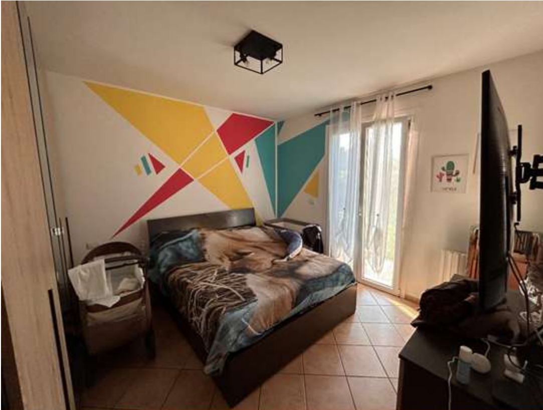
Figura 10: camera