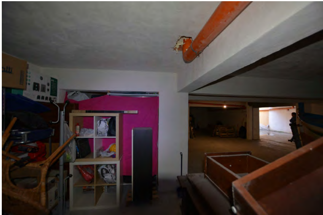
Foto 11 - Magazzino di piano S1