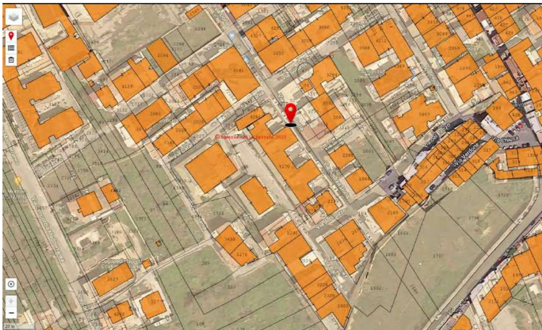
Foto 5 – Foto satellitare di Bagheria e del bene