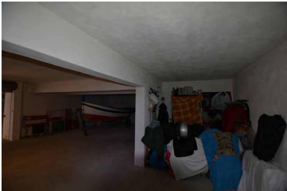
Foto 10 - Magazzino di piano S1