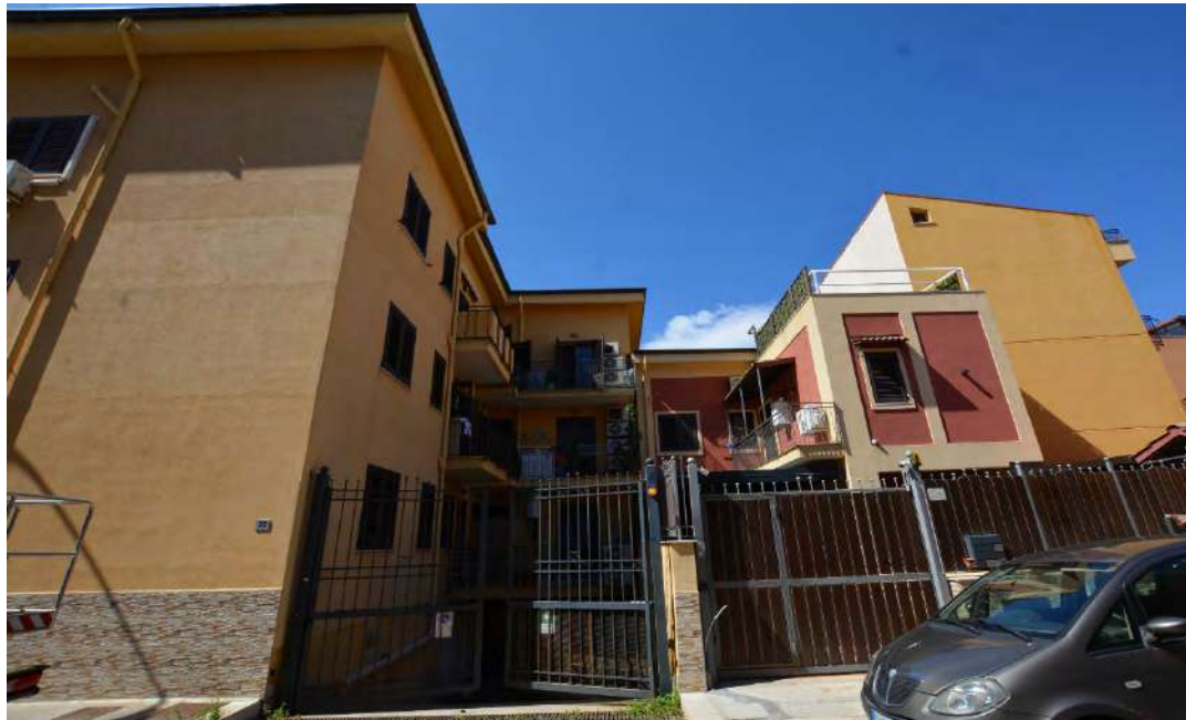
Foto 1 – Edificio di Via Bari n. 18 / Via Andrea Doria, 22 a Bagheria Frazione di Aspra