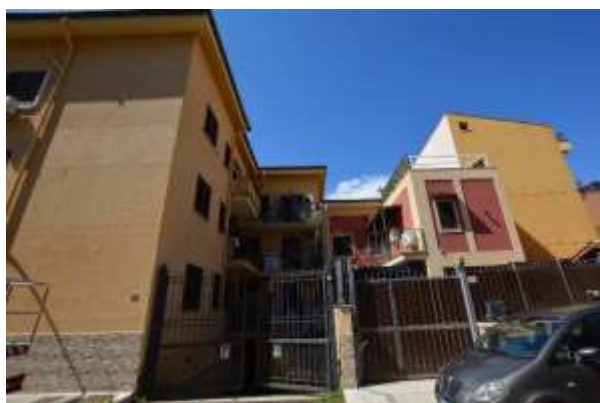
Foto 3 - Ingresso carrabile di Via Andrea Doria, 22