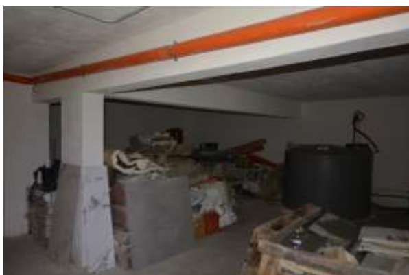
Foto 11 - Magazzino