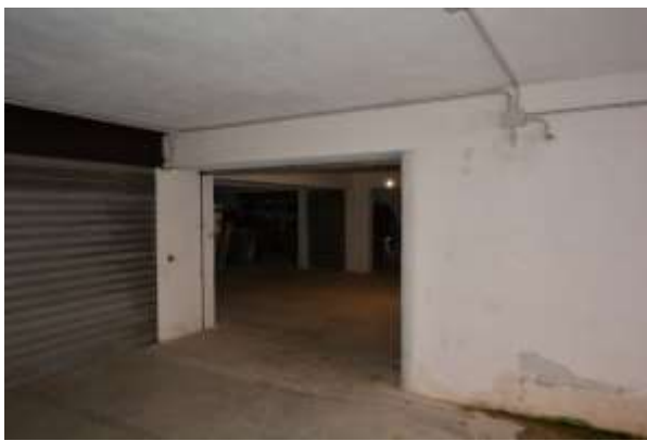
Foto 7 - Ingresso magazzino da corsia di manovra