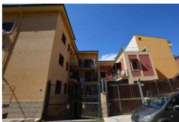
Foto 2 - Ingresso carrabile di Via Andrea Doria, 22