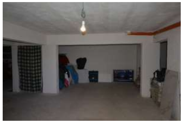
Foto 8 - Magazzino