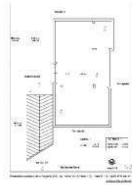
Planimetria di rilievo