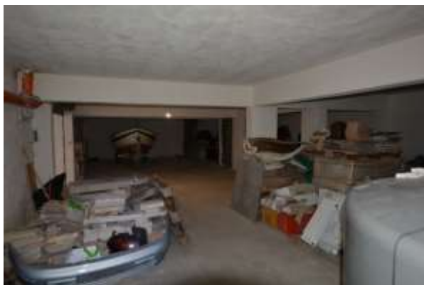
Foto 9 - Magazzino