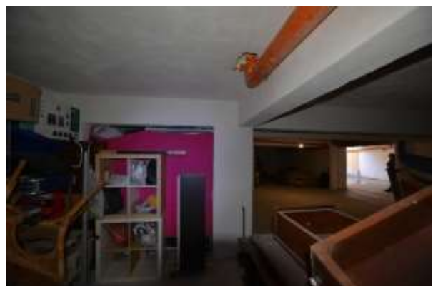
Foto 12 - Magazzino