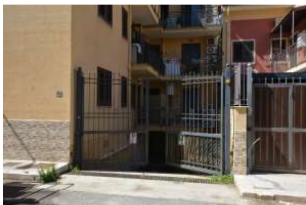
Foto 3 - Ingresso carrabile da Via Andrea Doria, 22