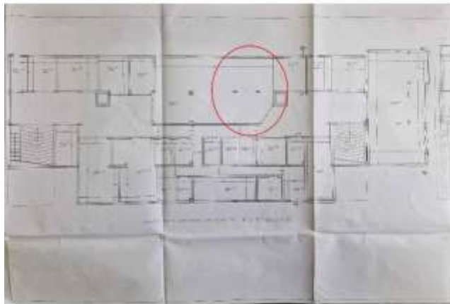
Planimetria allegata alla SCIA 2/11