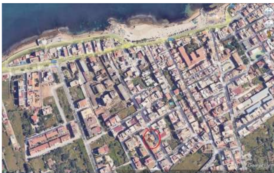
Foto 5 – Immagine satellitare con indicazione del bene.

L'immobile dista circa 300 metri del lungomare di Aspra con buona presenza di servizi e di esercizi commerciali.