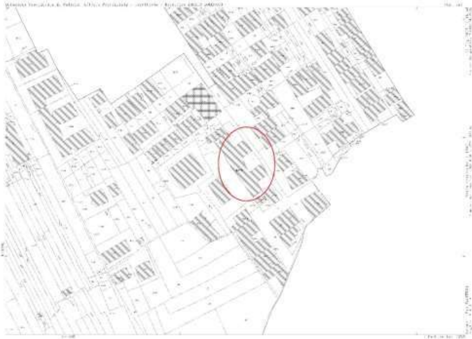
Estratto di mappa