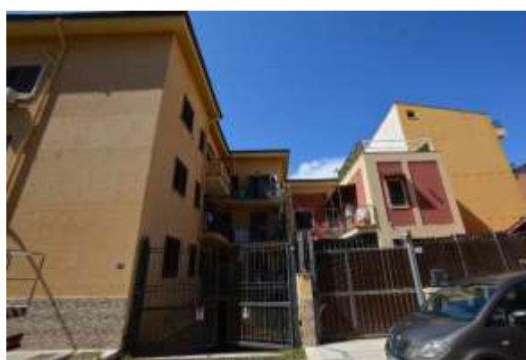
Foto 2 - Ingresso carrabile da Via Andrea Doria, 22