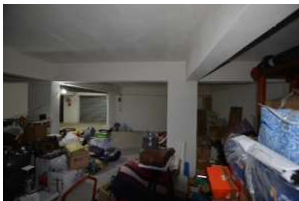
Foto 11 - Magazzino