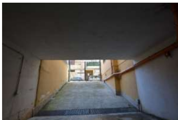
Foto 4 - Rampa carrabile di Via Andrea Doria, 22