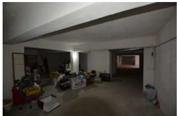
Foto 12 - Magazzino