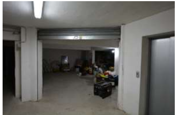
Foto 8 - Ingresso magazzino