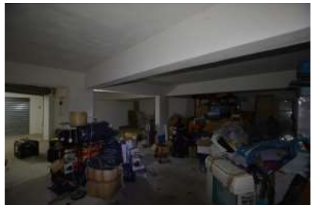
Foto 10 - Magazzino