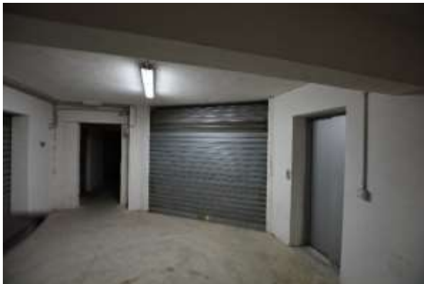
Foto 7 - Ingresso magazzino da corsia di manovra