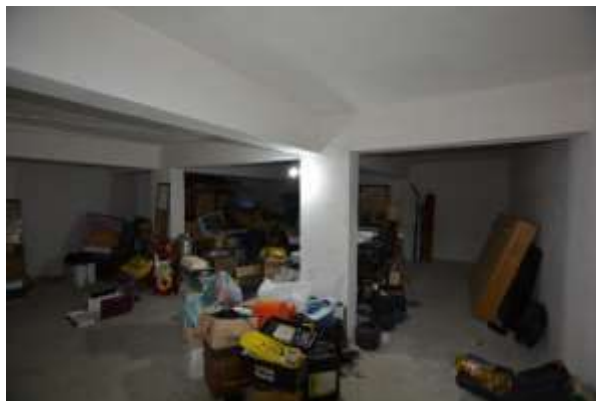
Foto 9 - Magazzino