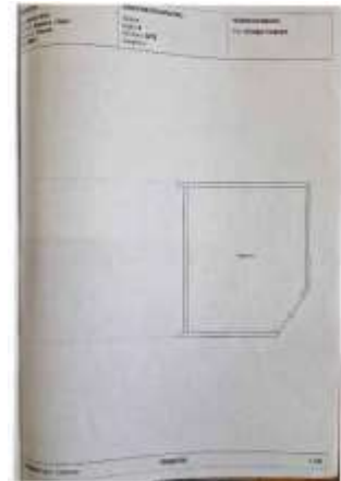
Planimetria allegata alla SCIA 132/16