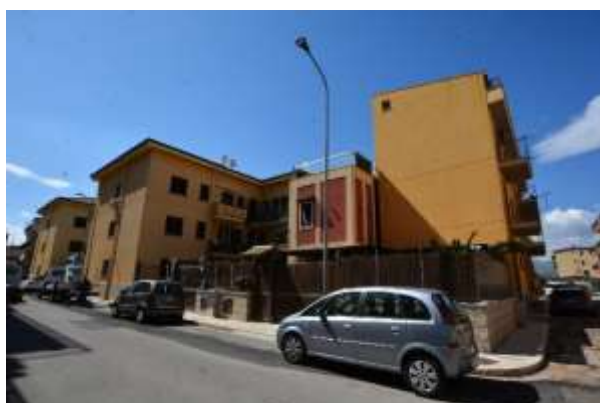
Foto 1 - Palazzina di Via Andrea Doria

U.I. 13 - PERIZIA DI STIMA RELATIVA AL MAGAZZINO SITO NEL COMUNE DI BAGHERIA, VIA ANDREA DORIA 22, UBICATO AL PIANO S1, ISCRITTO AL N.C.E.U. AL FOGLIO 8, PARTICELLA 4270, SUBALTERNO 85.