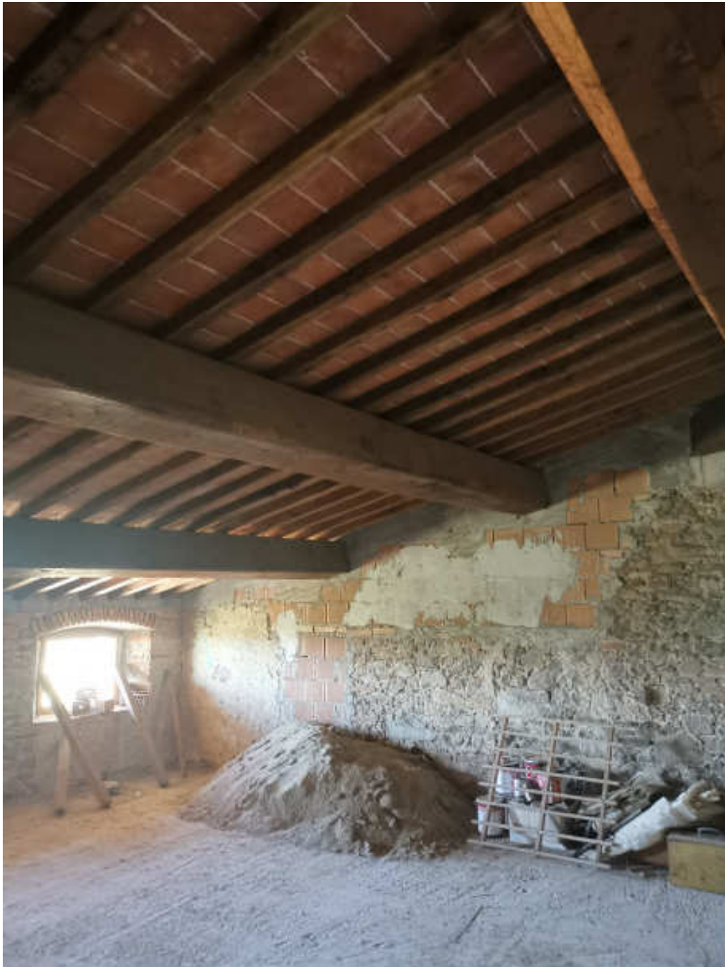
FOTO INTERNI - PIANO SOTTOTETTO