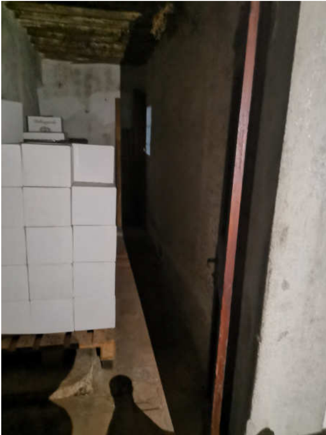
FOTO INTERNI PIANO TERRA