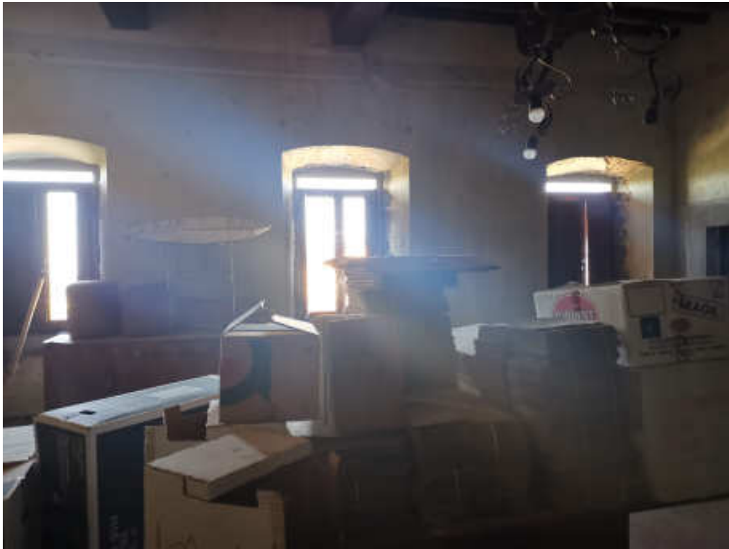
FOTO INTERNI - PIANO PRIMO