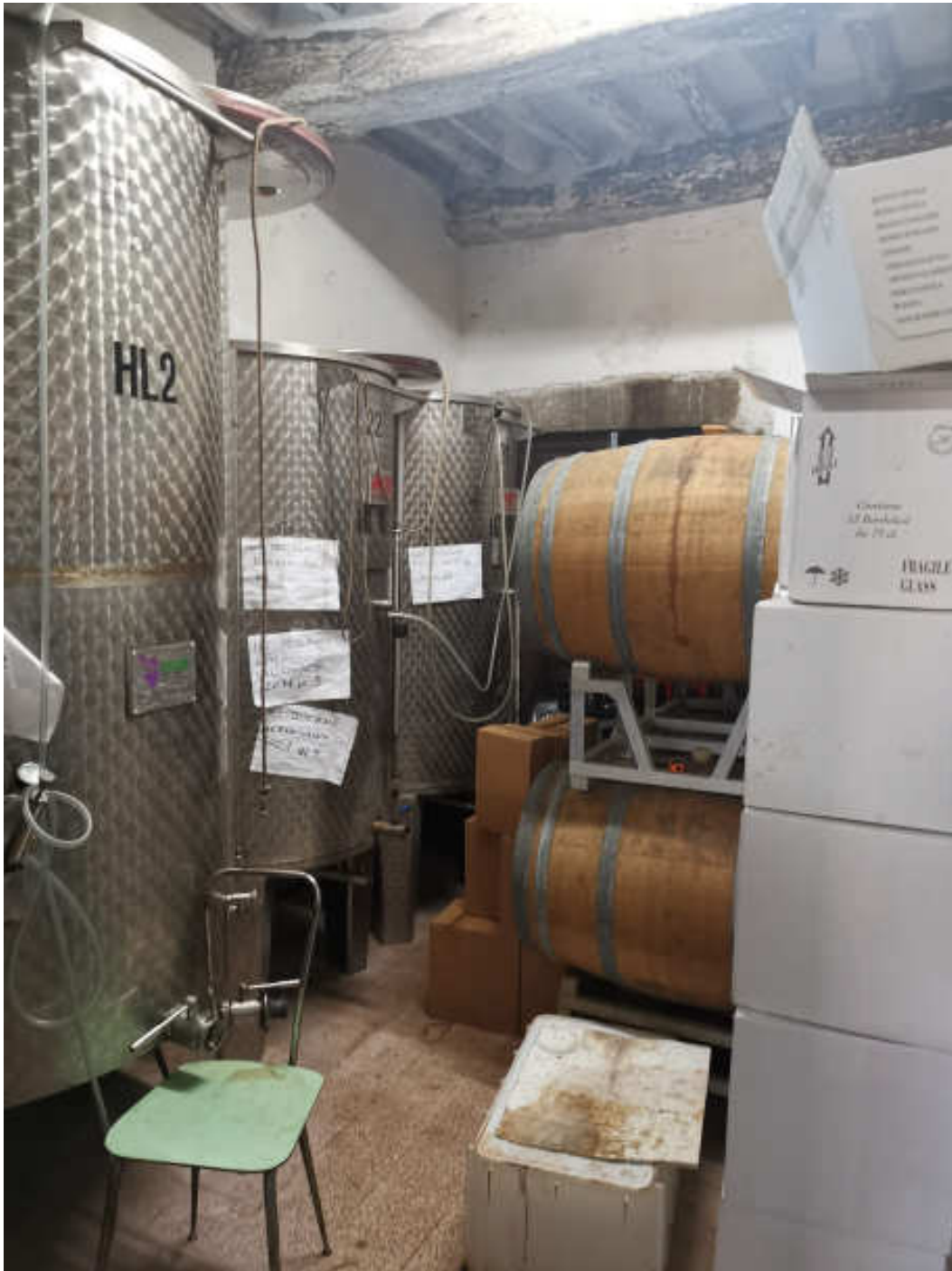
FOTO LOCALE DI SBATTO-CANTINA