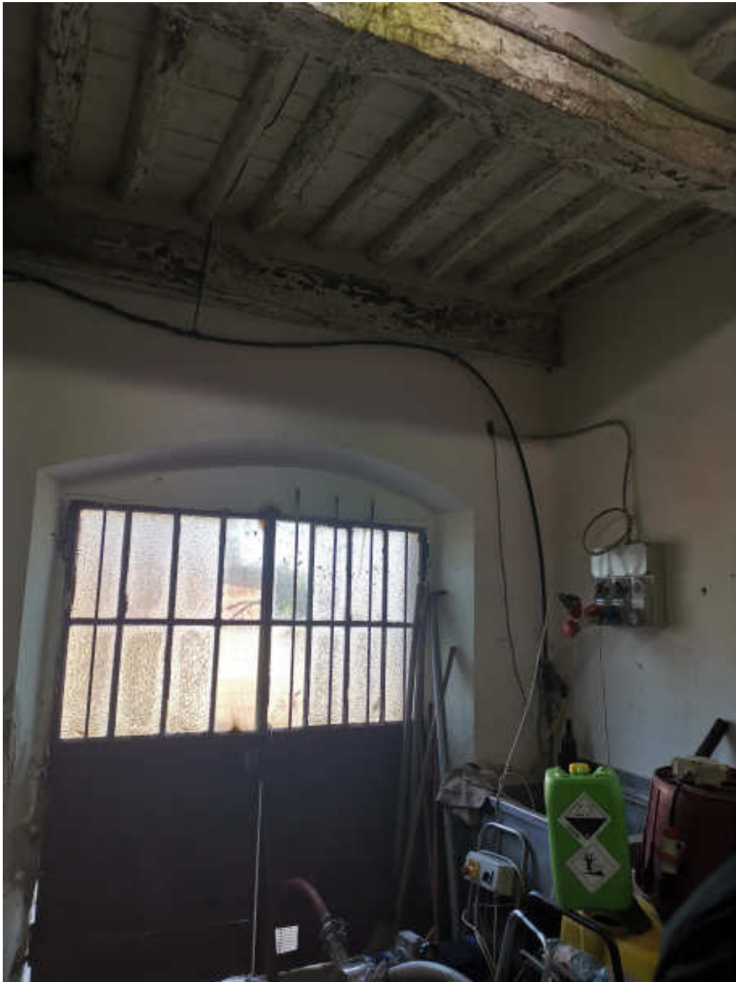
FOTO LOCALE DI SBATTO-CANTINA