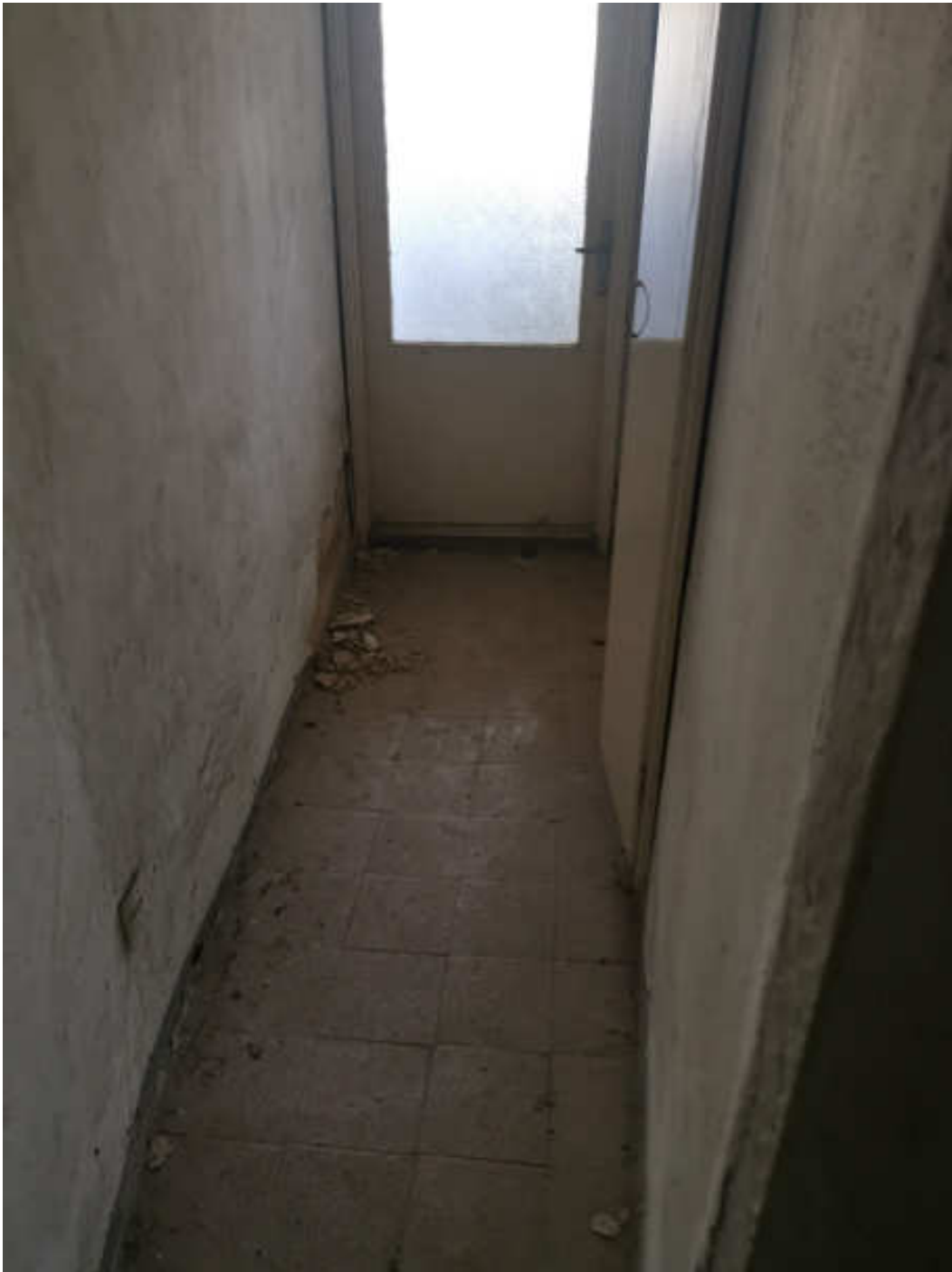
FOTO INTERNI - ANTI BAGNO PIANO PRIMO