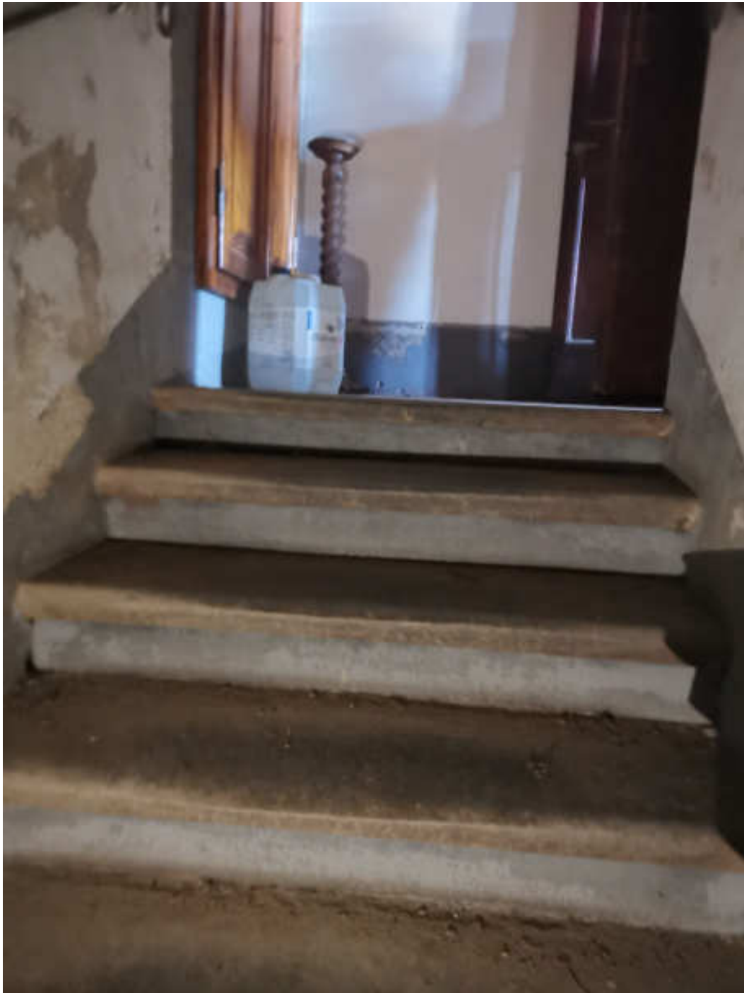
FOTO INTERNI PIANO TERRA