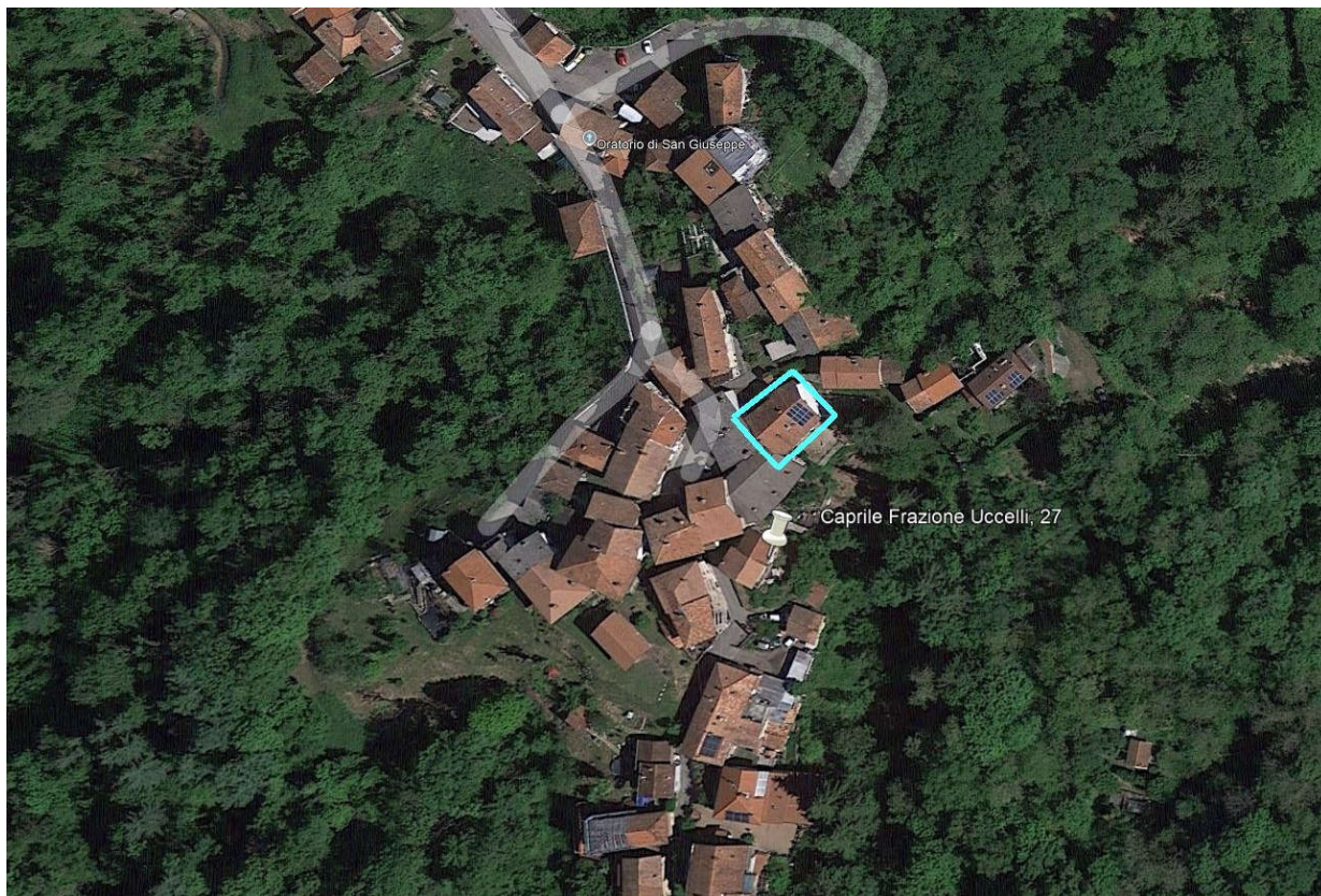
Vista zenitale ed inquadramento del bene oggetto di perizia