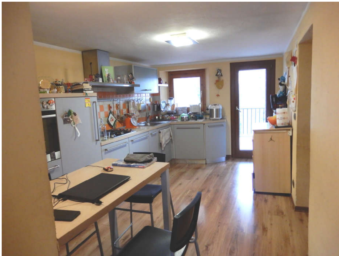
Piano rialzato (catastalmente definito piano terreno): cucina