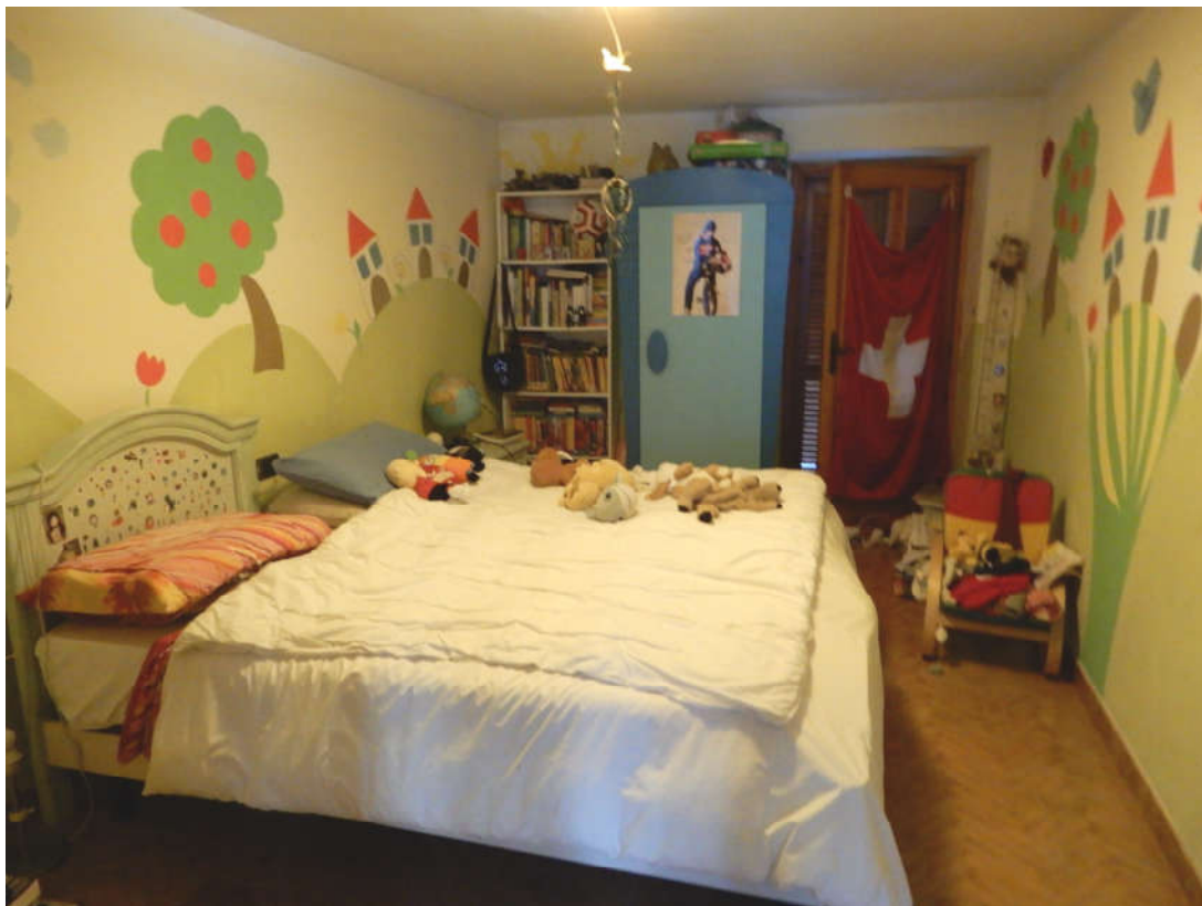
Piano superiore (catastalmente definito piano primo) - camera