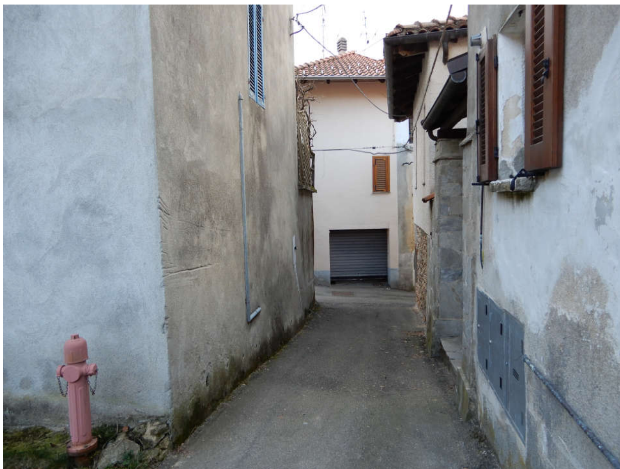
Via di accesso carraio al fabbricato oggetto di stima