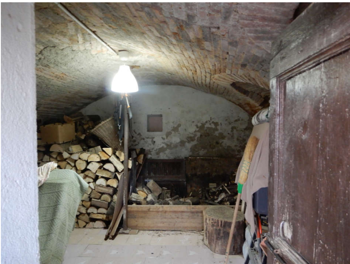
Piano seminterrato – cantina fruibile esclusivamente da cortile in proprietà