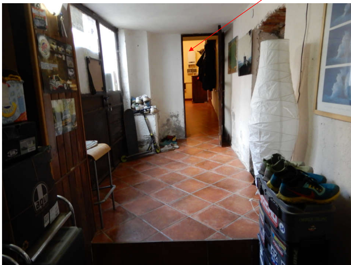
Piano seminterrato - disimpegno