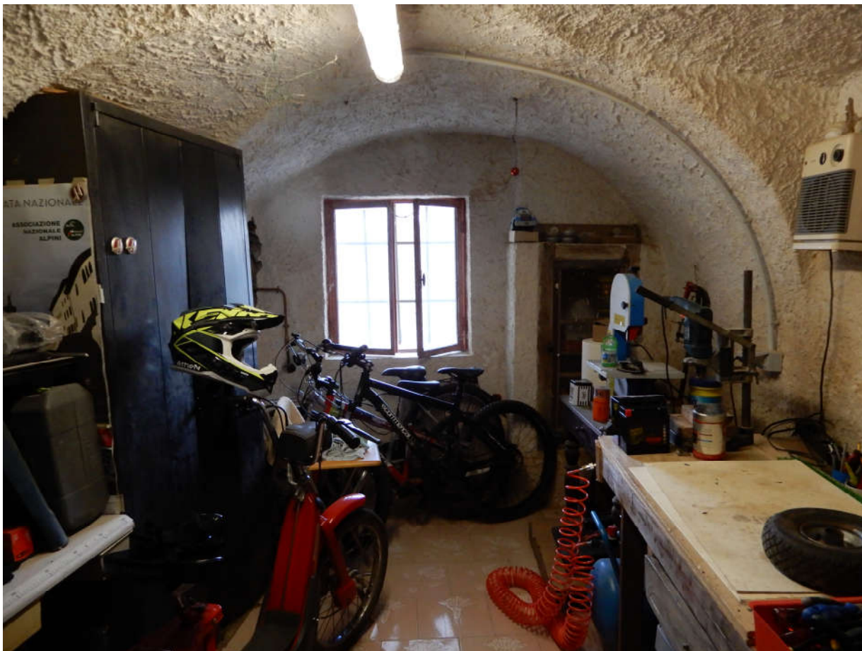
Piano seminterrato - cantina