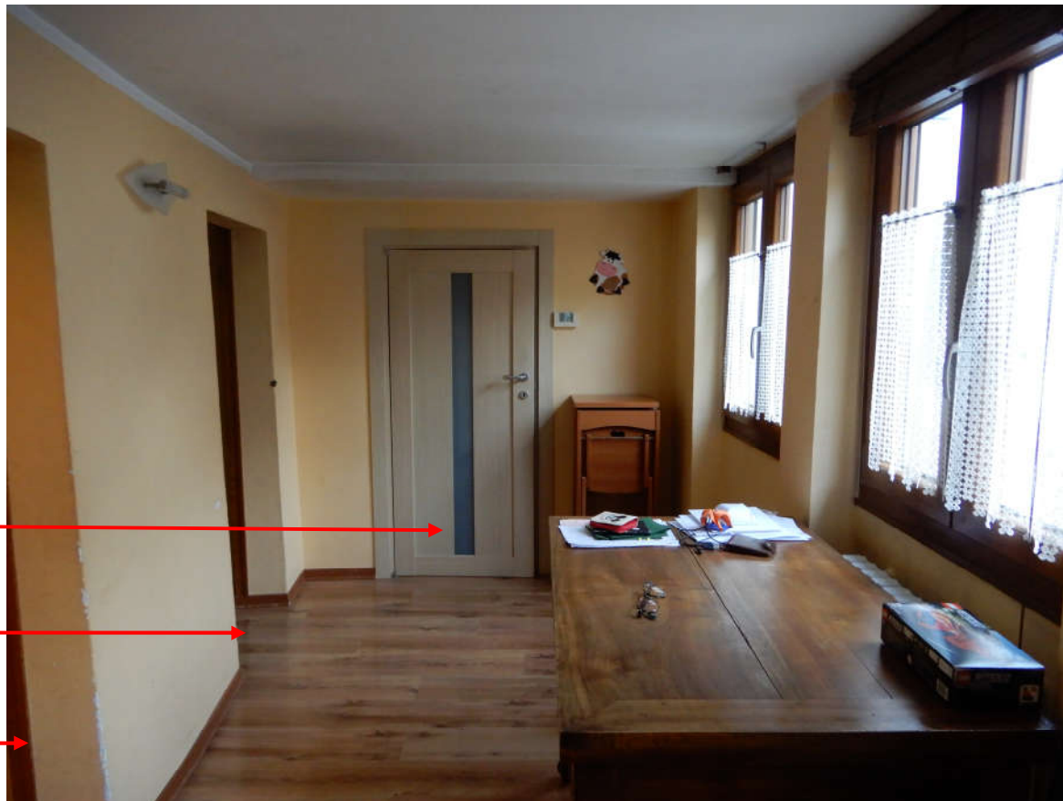
Piano rialzato (catastalmente definito piano terreno): disimpegno raggiungibile dalla scala di pochi gradini (foto precedente)