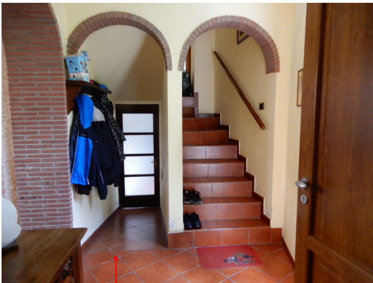
Piano terra – ingresso