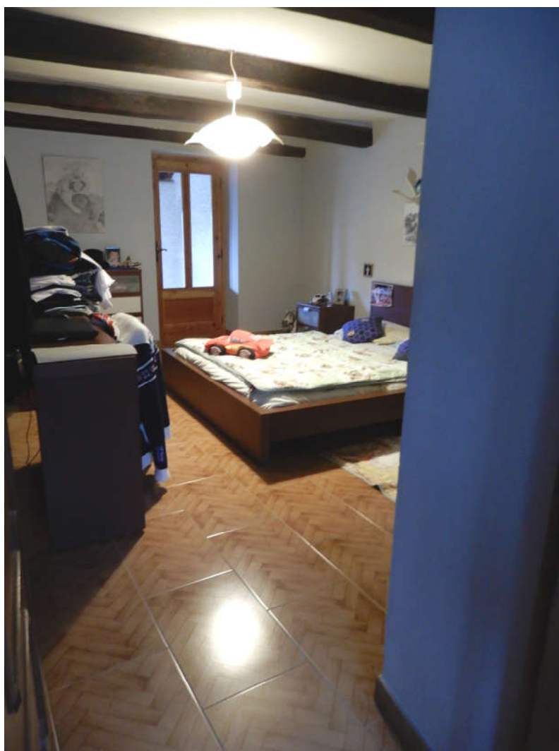
Piano superiore (catastalmente definito piano primo) - camera