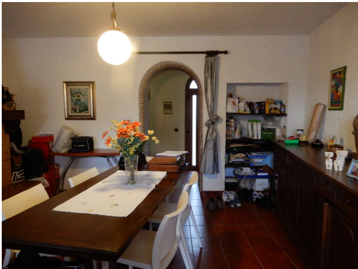
Piano terra – soggiorno