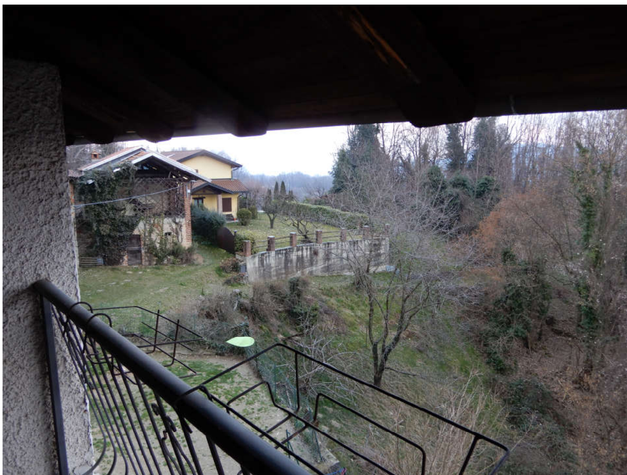
Cortile interno ripreso da terrazzo a servizio dell'ultimo piano