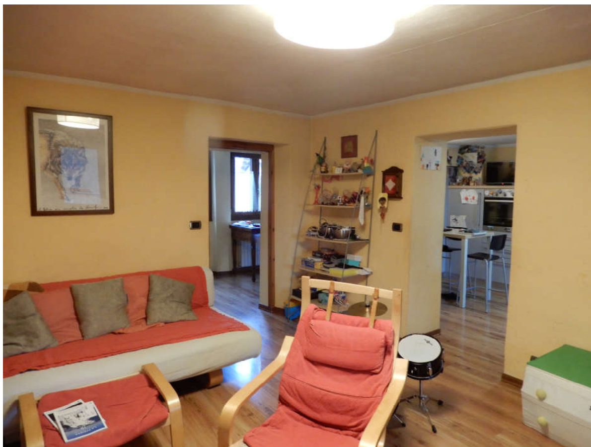
Piano rialzato (catastalmente definito piano terreno): soggiorno