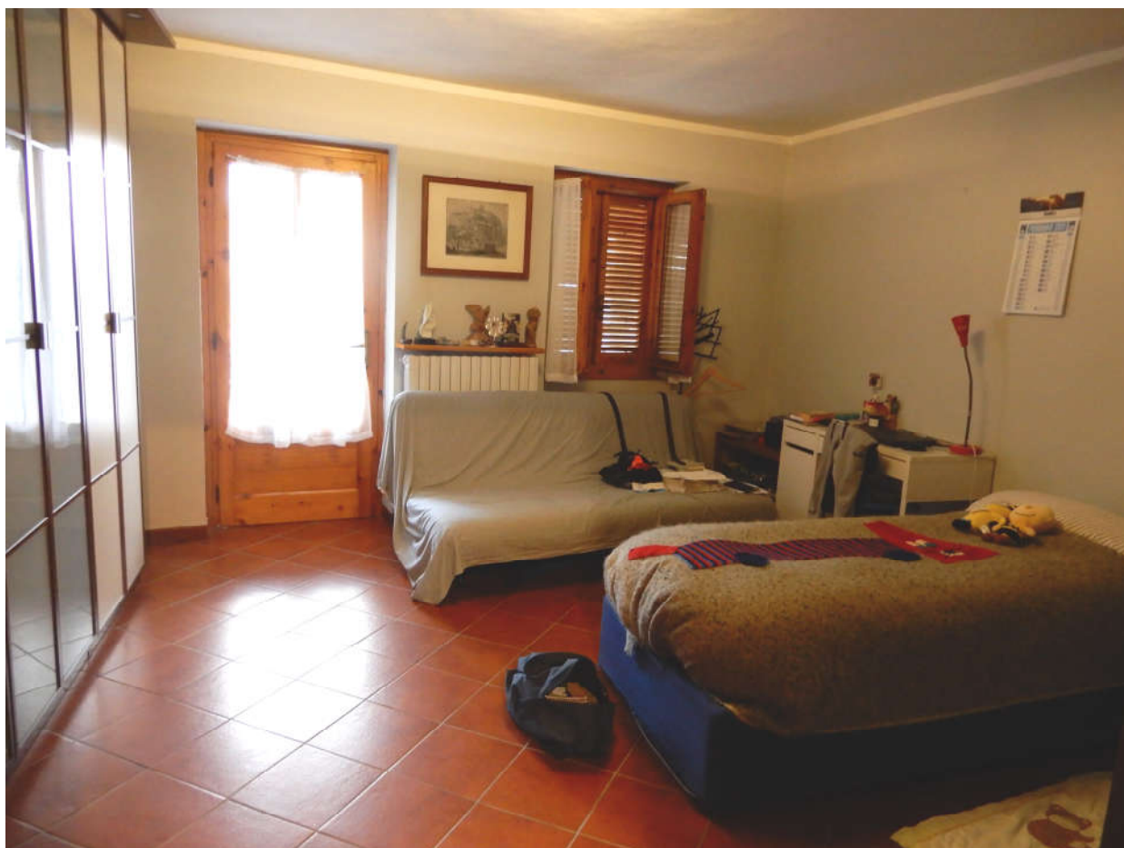
Piano primo - camera