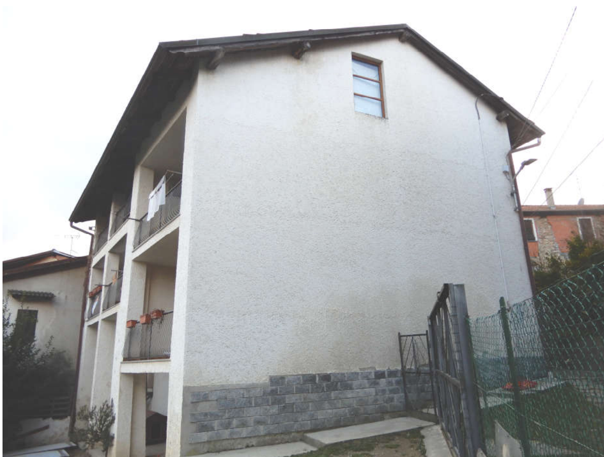
Prospetto Nord - Est