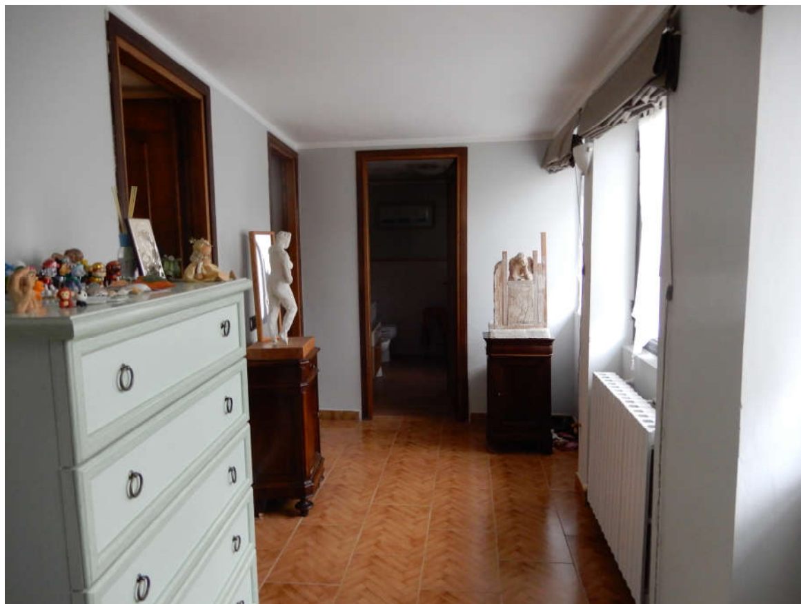
Piano superiore (catastalmente definito piano primo) - disimpegno