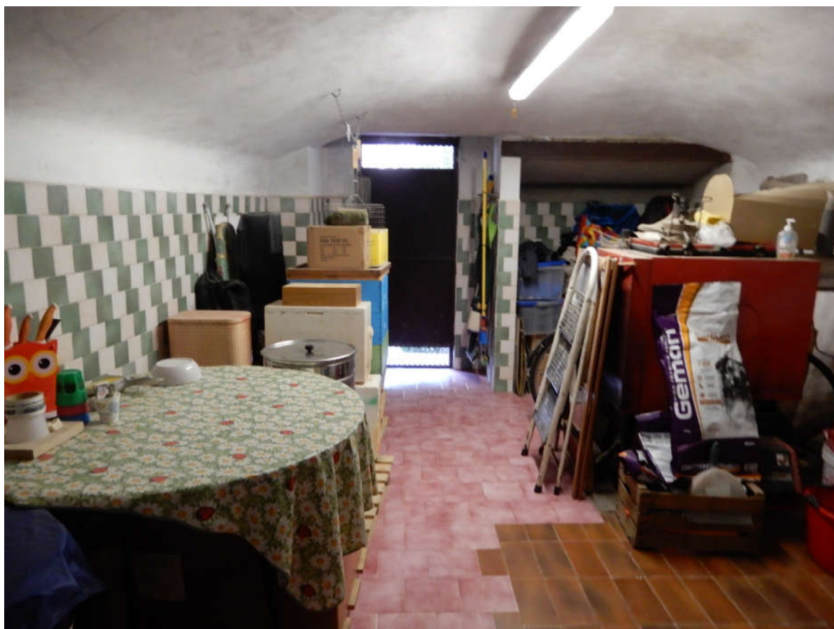
Piano seminterrato – cantina raggiungibile anche da scala esterna insistente su cortile in proprietà