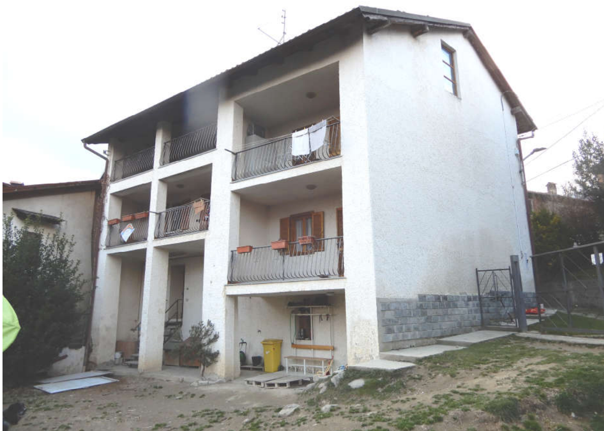
Prospetto Sud - Est