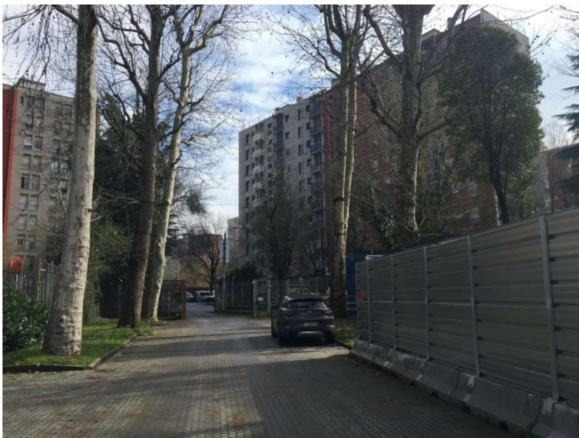
Foto 05 - Vialetto di ingresso interno all'area di via Costantino Baroni al civico 190