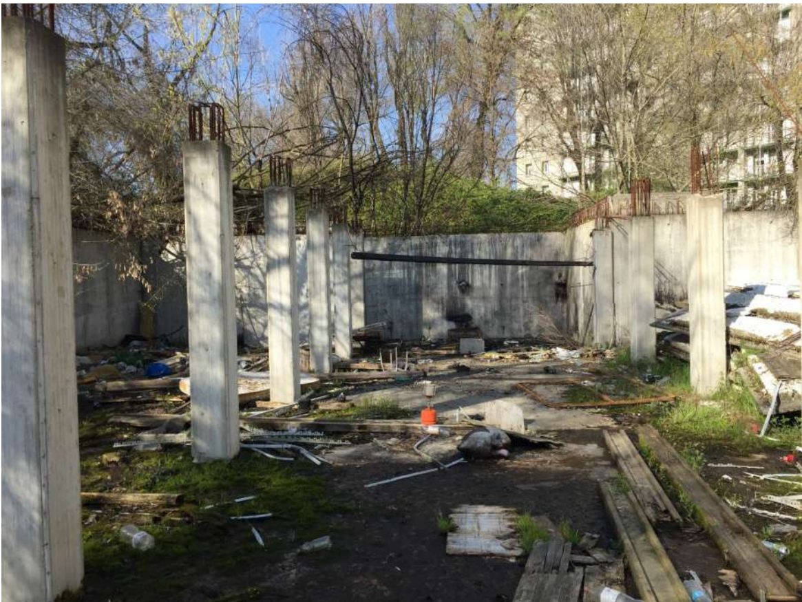
Foto 29 - Area urbana in corso di costruzione