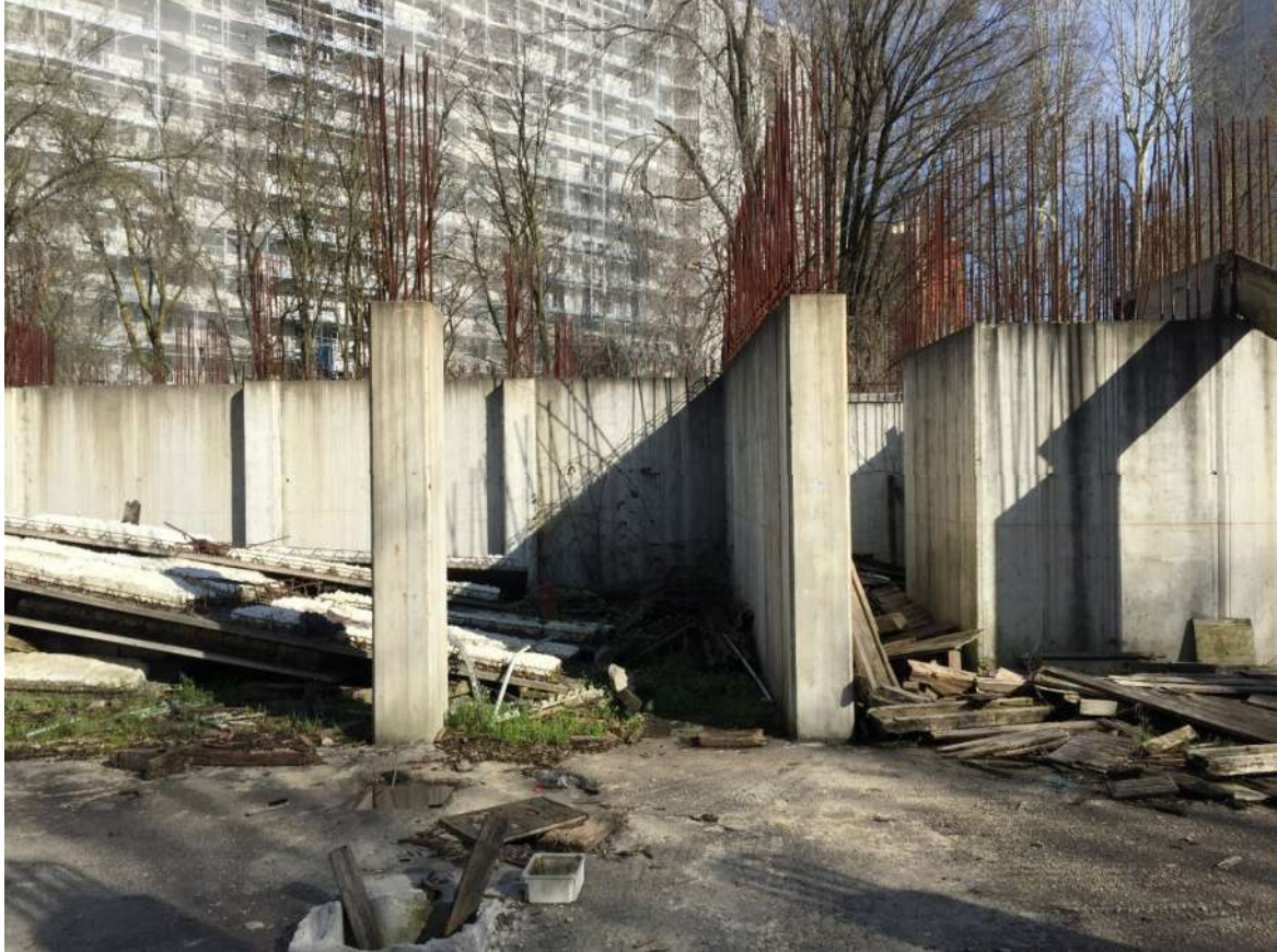
Foto 32 - Area urbana in corso di costruzione