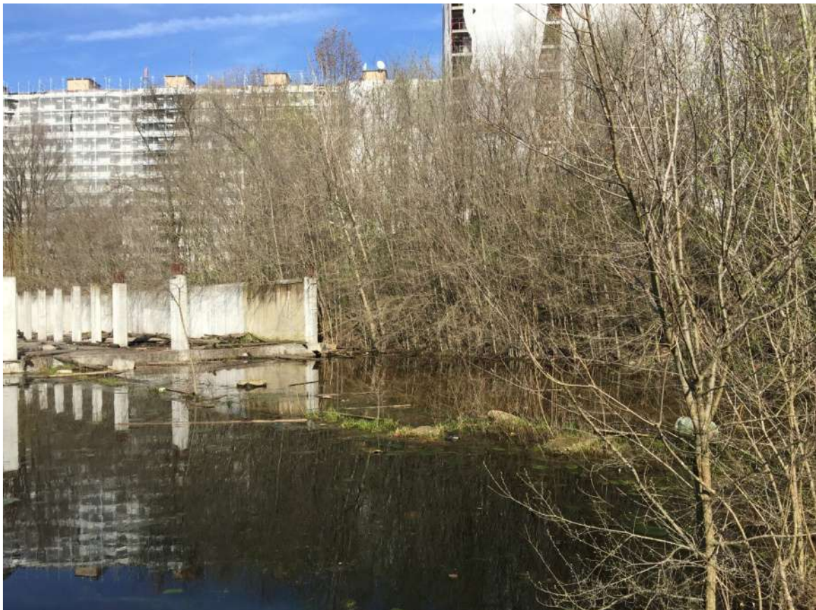
Foto 09 - Area urbana in corso di costruzione