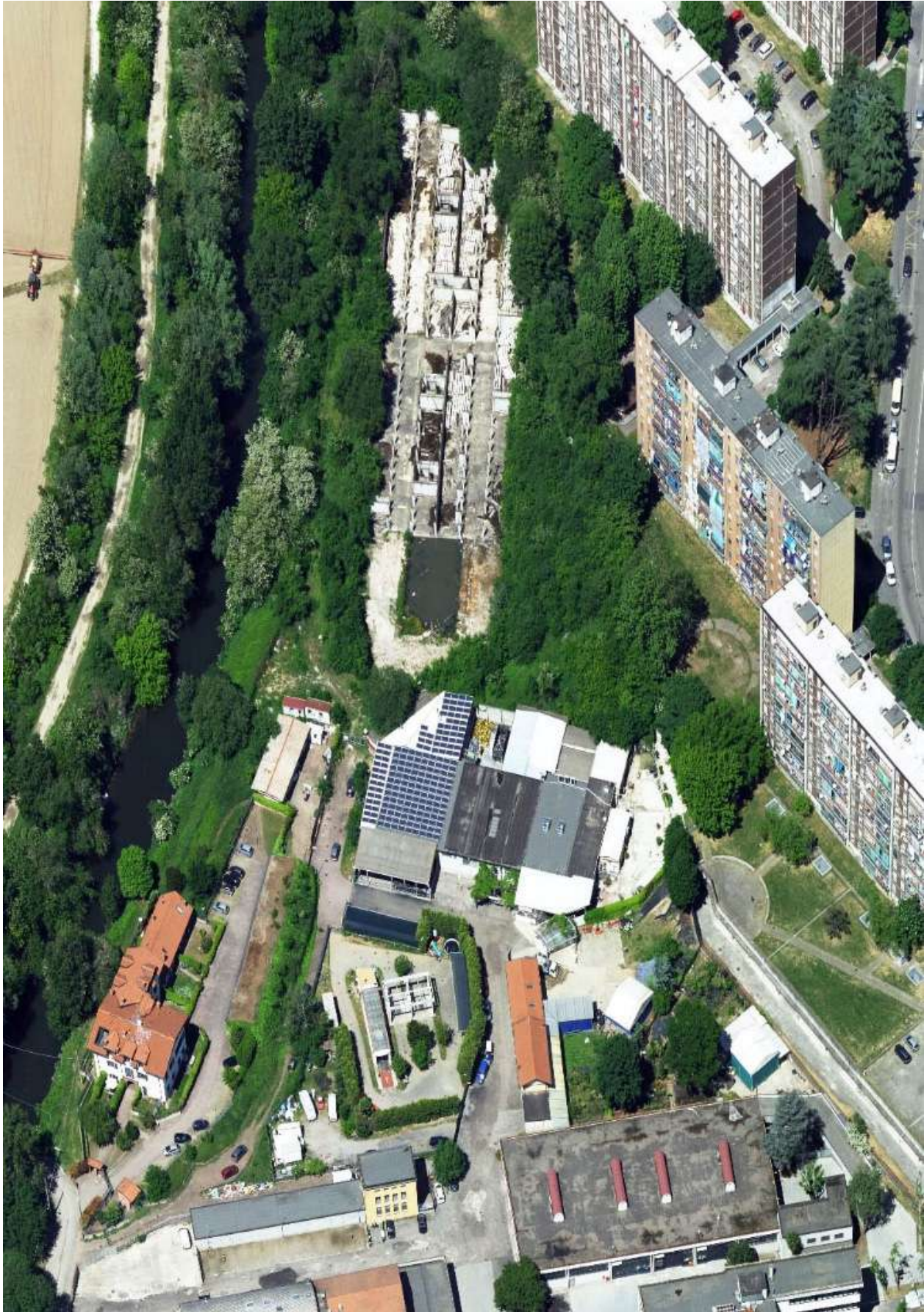
Foto 01 - Vista aerea dell'area urbana in corso di costruzione