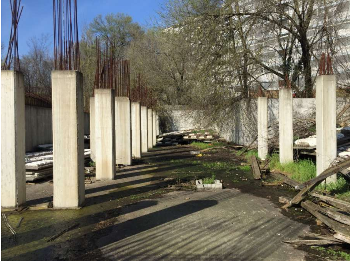
Foto 24 - Area urbana in corso di costruzione