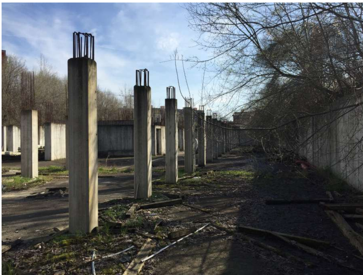
Foto 31 - Area urbana in corso di costruzione