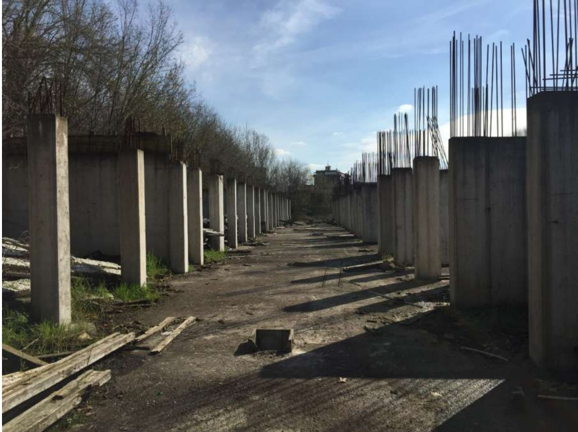
Foto 26 - Area urbana in corso di costruzione