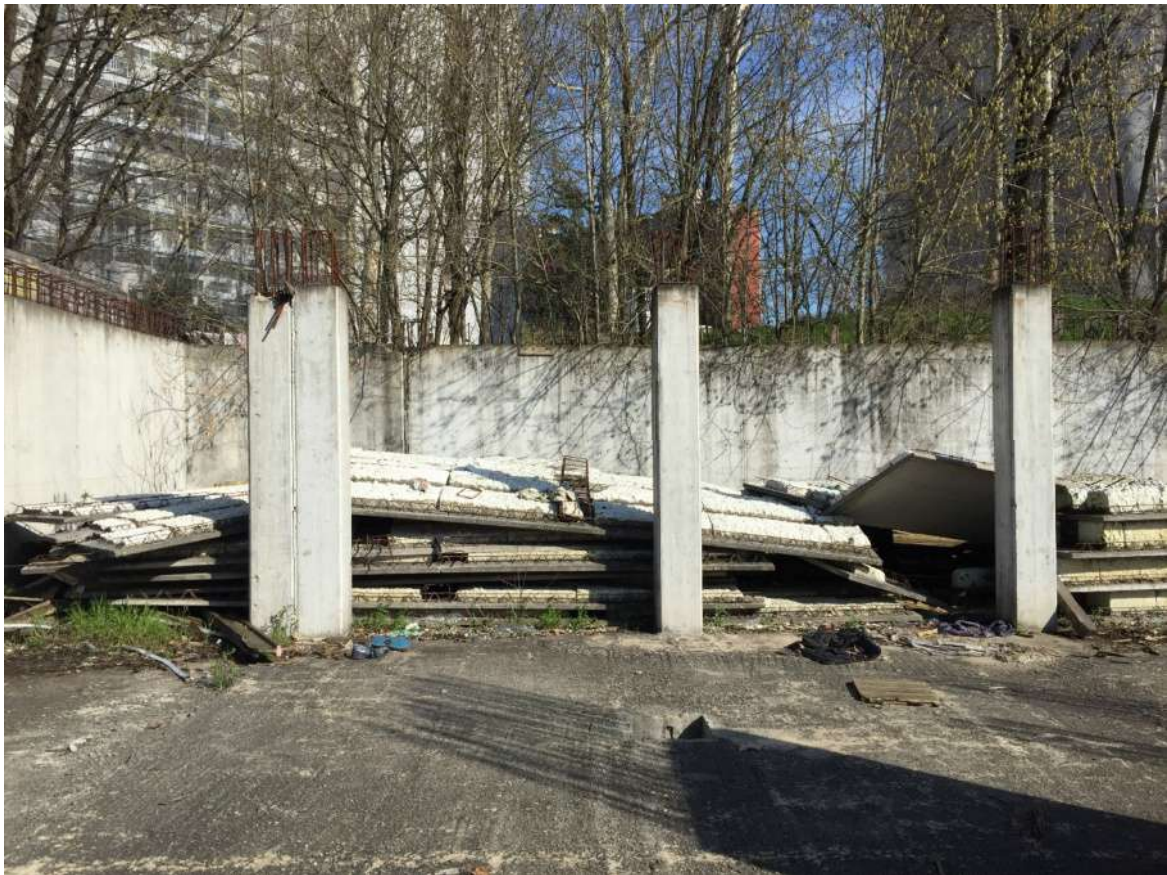
Foto 21 - Area urbana in corso di costruzione