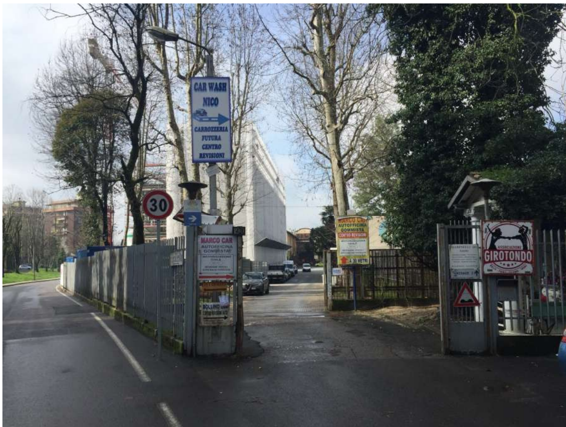
Foto 04 - Accesso all'area recintata di via Costantino Baroni al civico 190