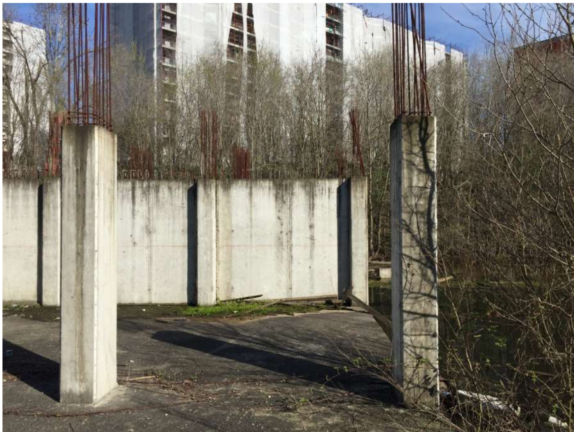
Foto 36 - Area urbana in corso di costruzione