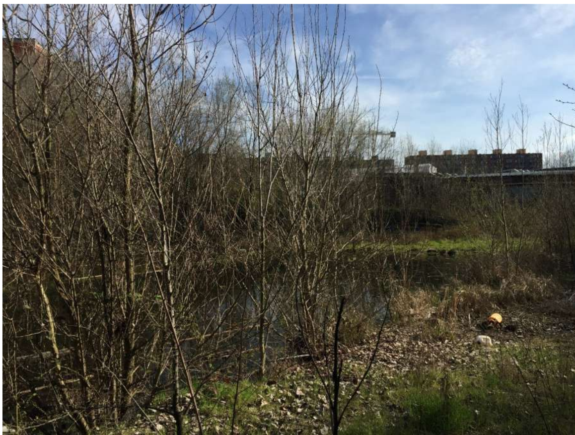
Foto 37 - Area urbana in corso di costruzione