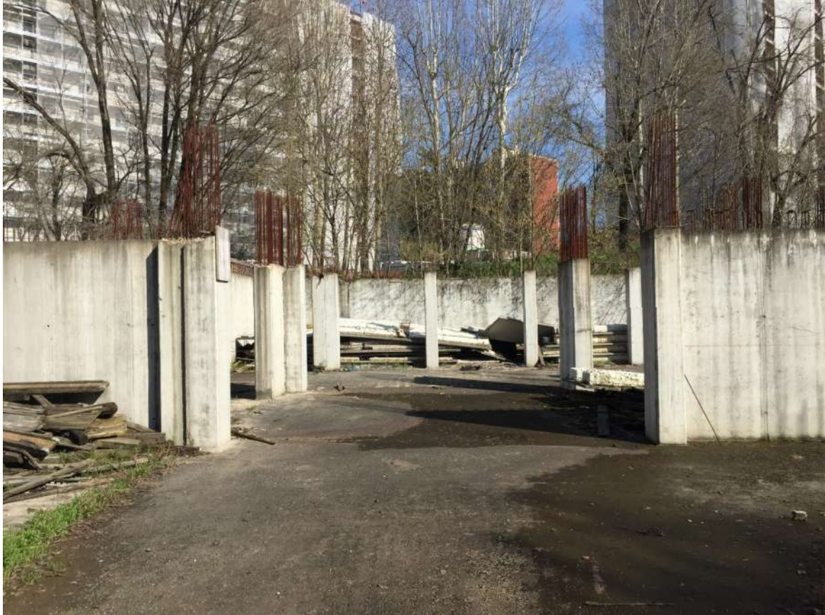
Foto 18 - Area urbana in corso di costruzione