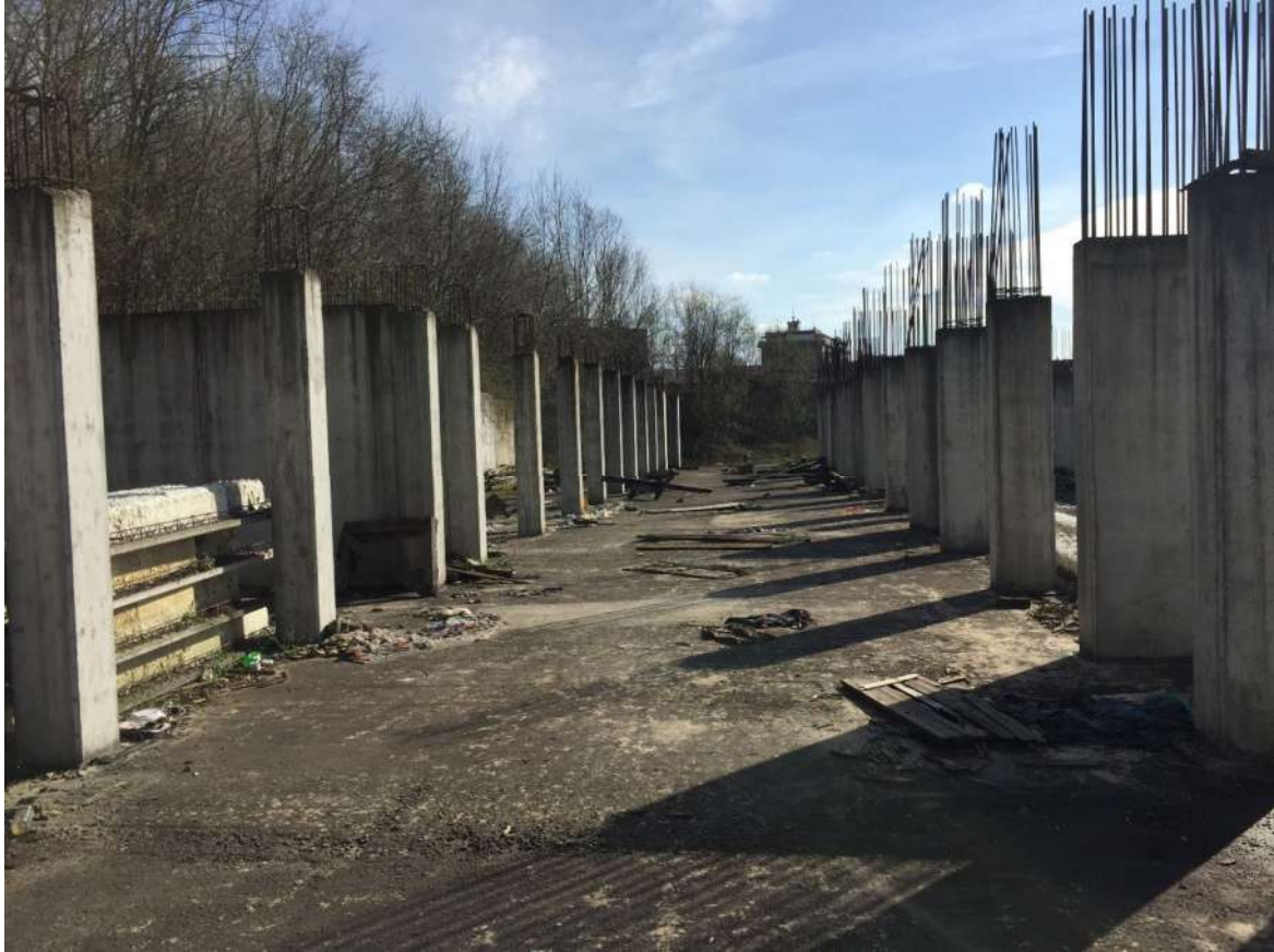
Foto 20 - Area urbana in corso di costruzione