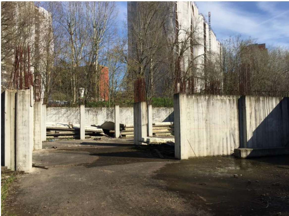
Foto 35 - Area urbana in corso di costruzione