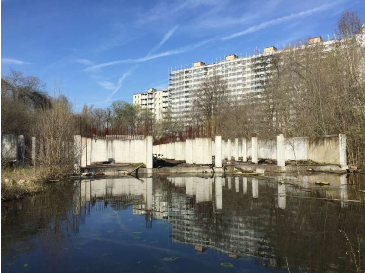
Foto 08 - Area urbana in corso di costruzione