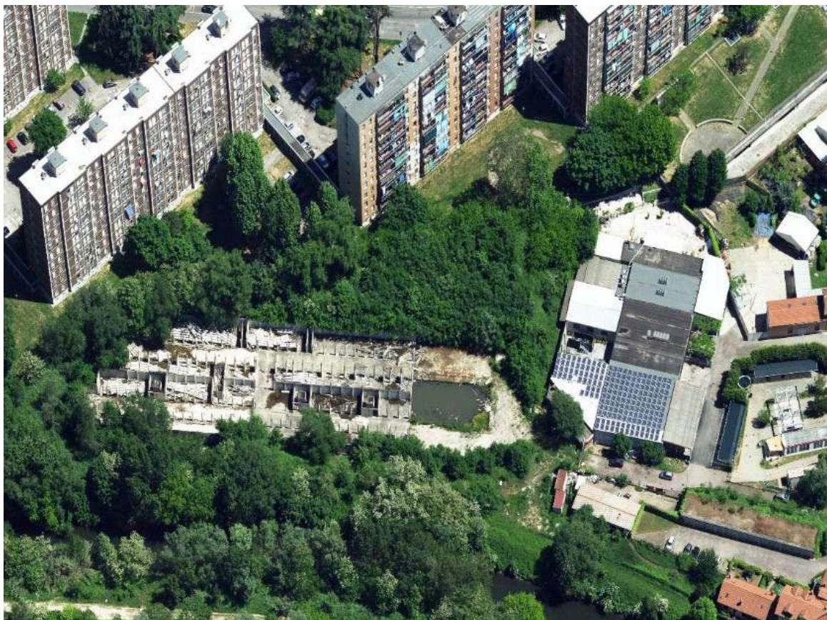
Foto 02 - Vista aerea dell'area urbana in corso di costruzione