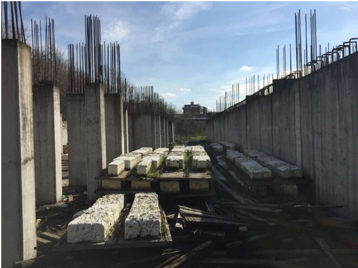
Foto 19 - Area urbana in corso di costruzione