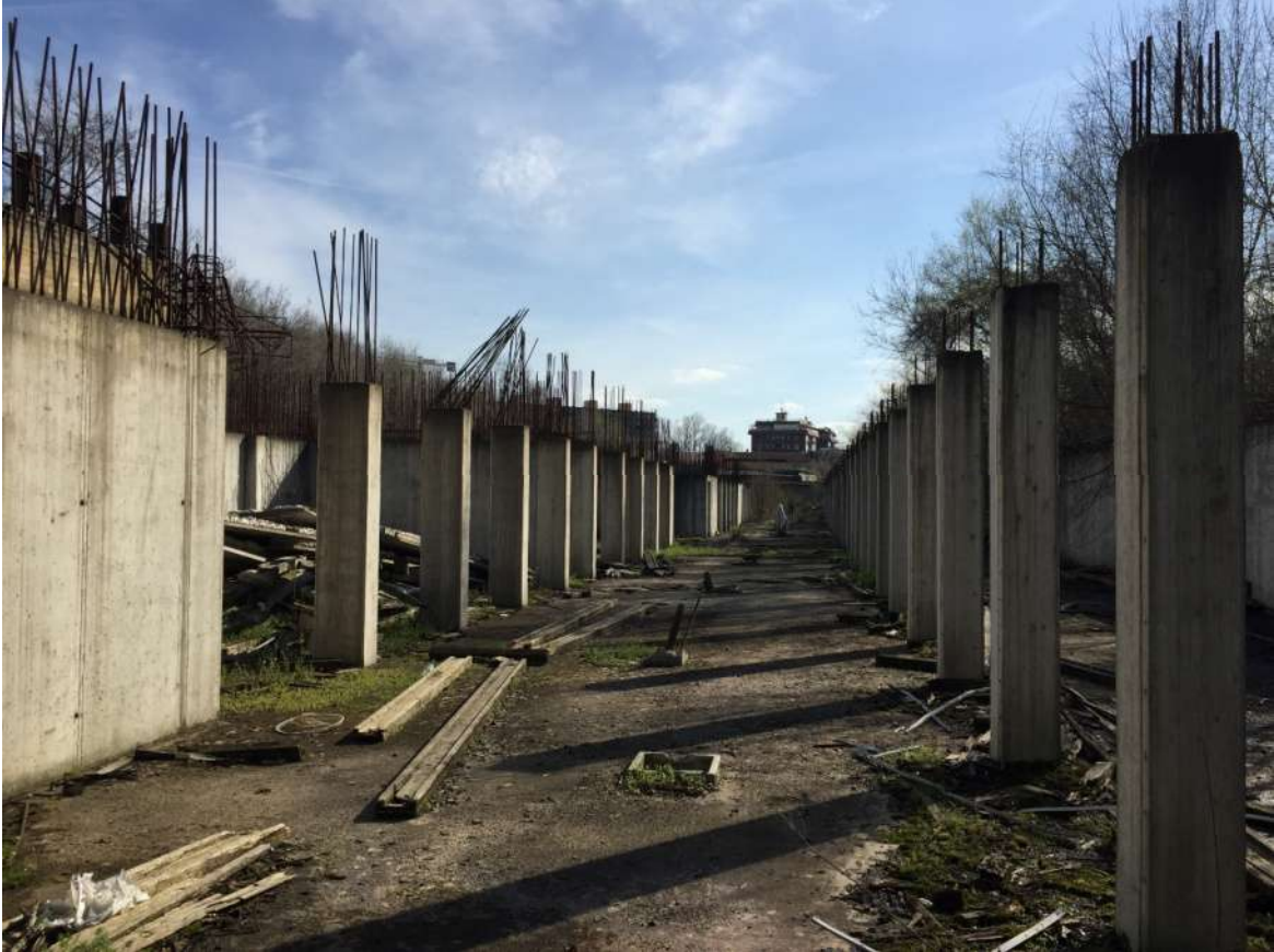
Foto 28 - Area urbana in corso di costruzione