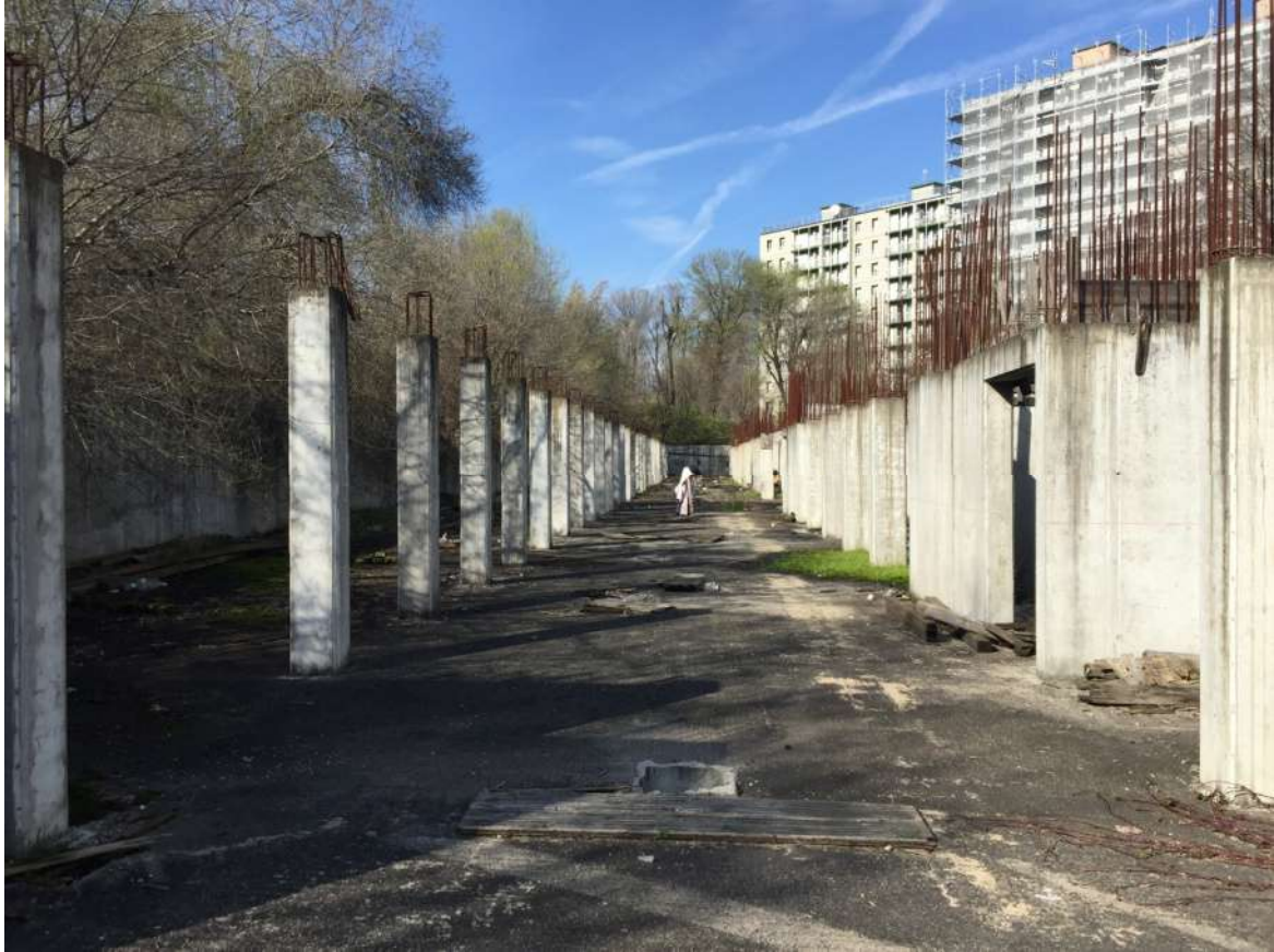
Foto 12 - Area urbana in corso di costruzione