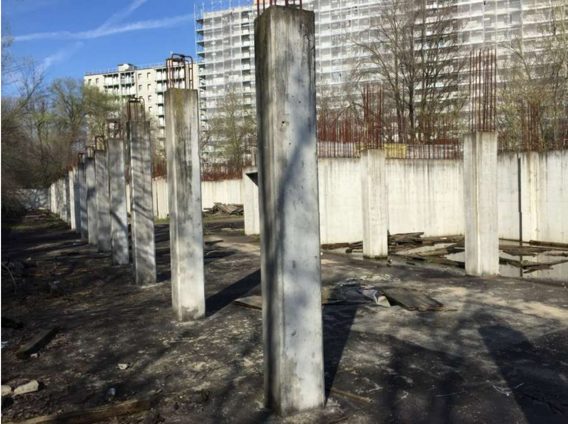
Foto 14 - Area urbana in corso di costruzione