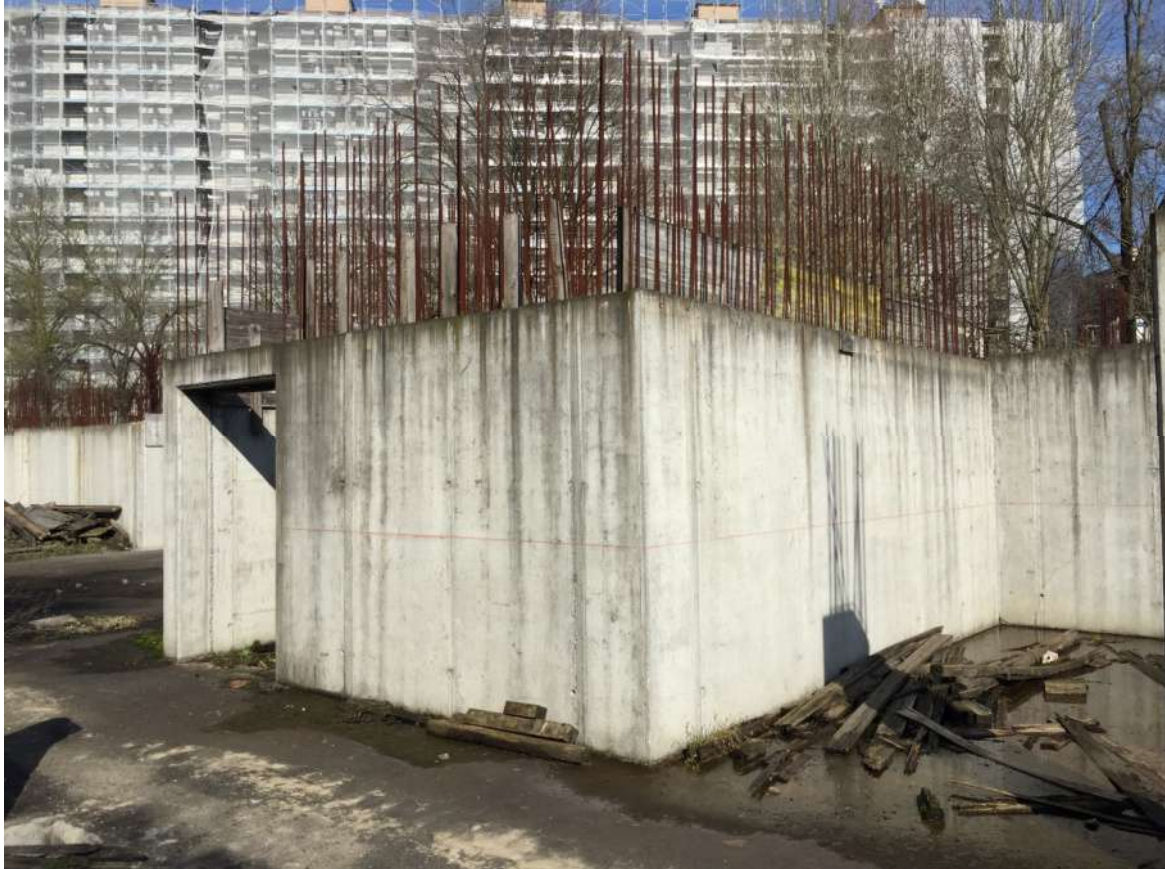
Foto 16 - Vano scale in corso di costruzione