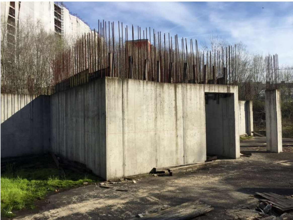
Foto 15 - Vano scale in corso di costruzione