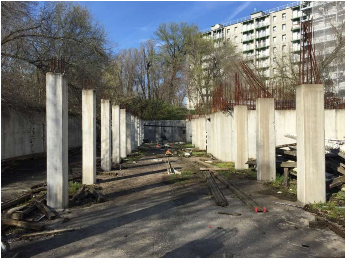
Foto 27 - Area urbana in corso di costruzione