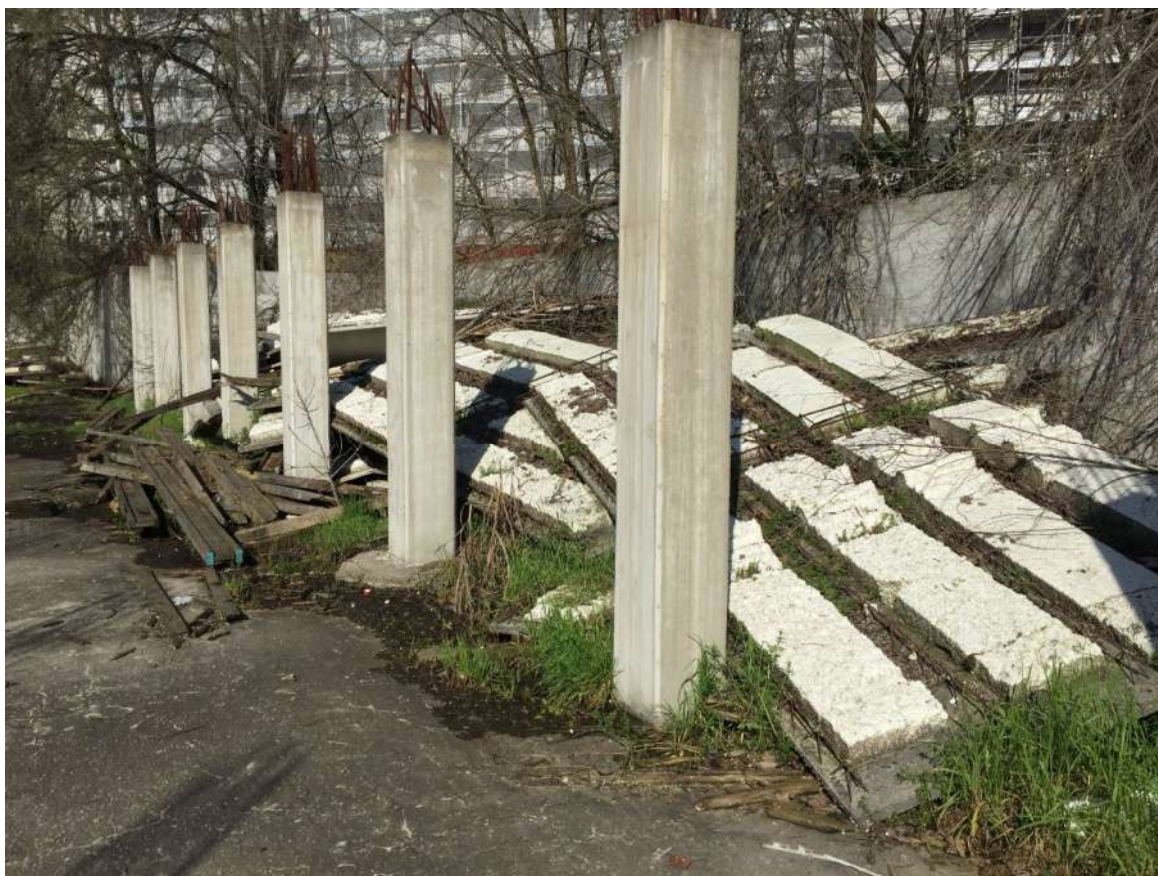
Foto 23 - Area urbana in corso di costruzione