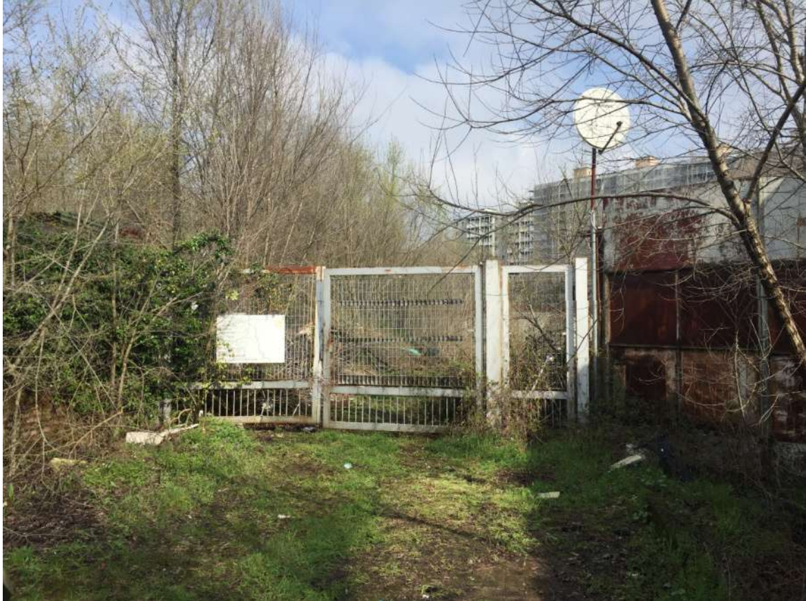
Foto 06 - Accesso all'area e ai terreni