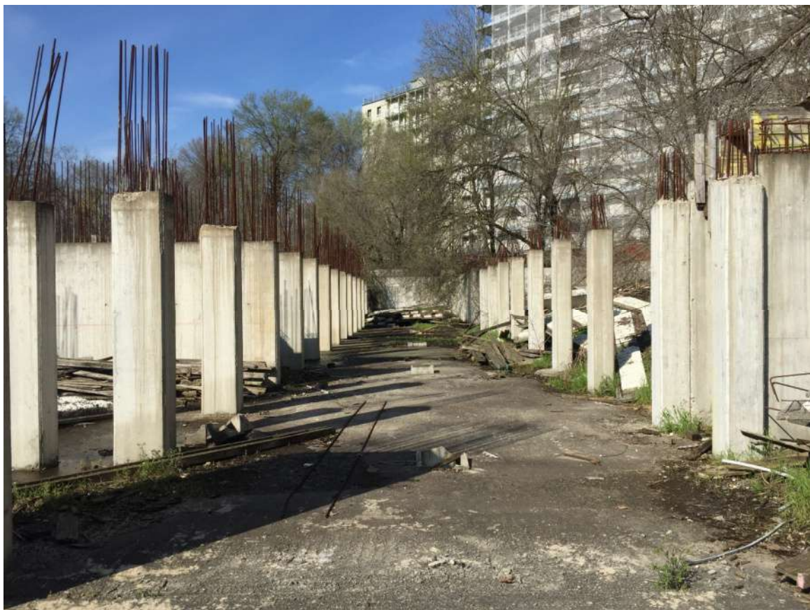
Foto 22 - Area urbana in corso di costruzione