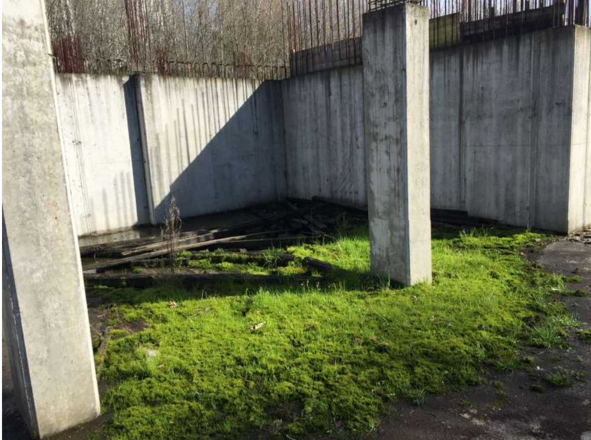
Foto 34 - Area urbana in corso di costruzione