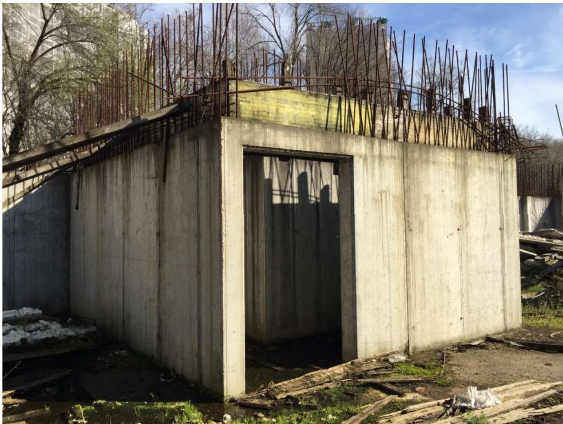
Foto 30 - Vano scale in corso di costruzione