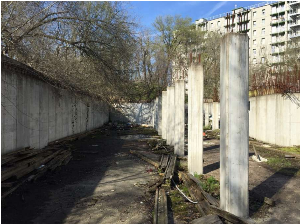
Foto 33 - Area urbana in corso di costruzione