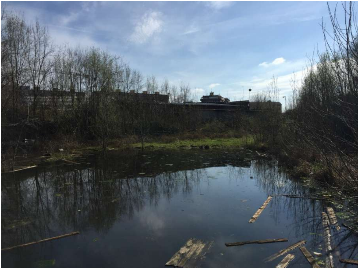
Foto 11 - Area urbana in corso di costruzione