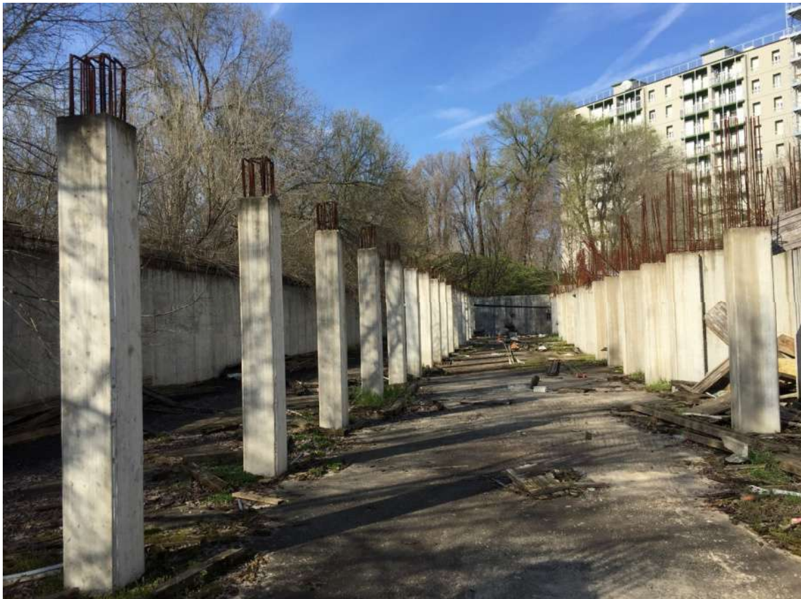
Foto 17 - Area urbana in corso di costruzione