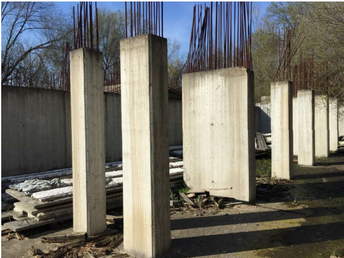
Foto 25 - Area urbana in corso di costruzione