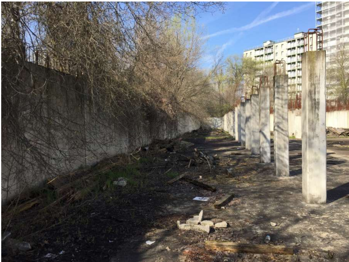
Foto 13 - Area urbana in corso di costruzione