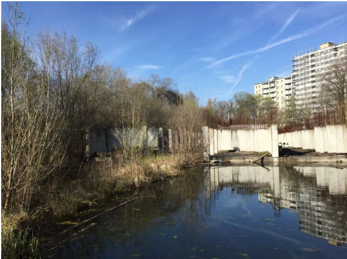
Foto 07 - Area urbana in corso di costruzione