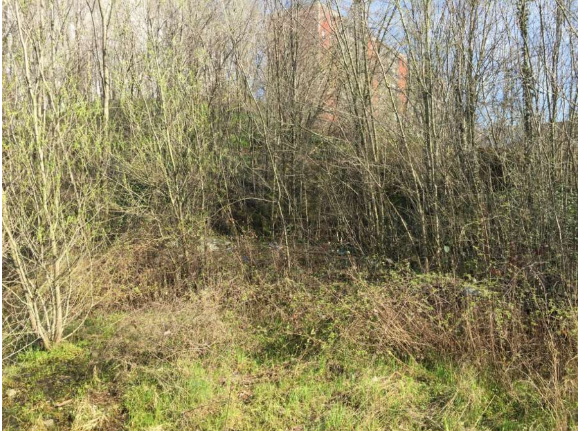
Foto 10 - Area urbana in corso di costruzione