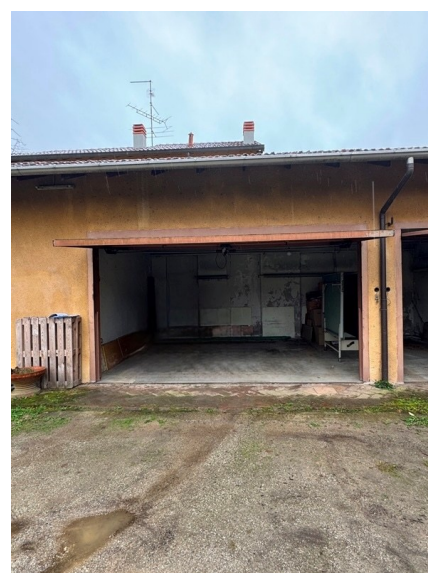
Vista garage doppio