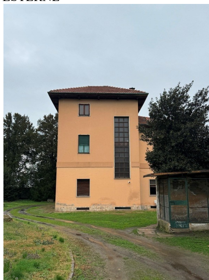
Vista esterna Villa