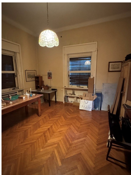
Vista locale hobby 2