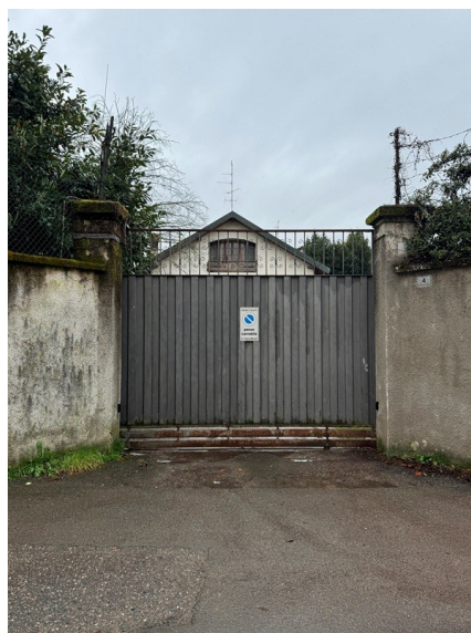
Vista accessi pedonale e carroio