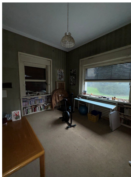
Vista locale hobby 1