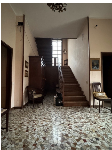
Vista scala interna