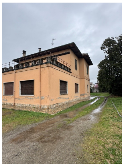
Vista esterna Villa