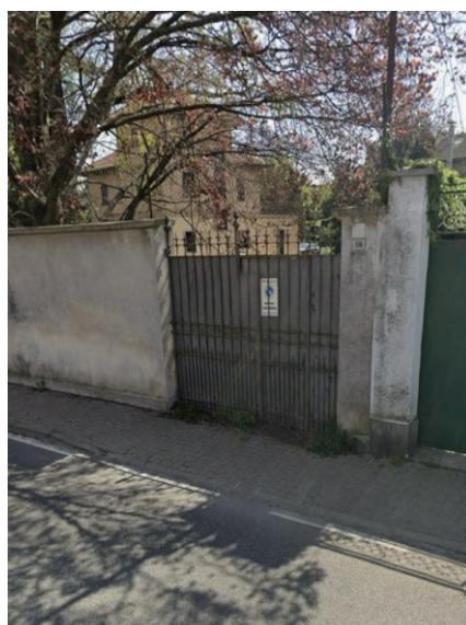
Vista accessi pedonale e carroio in disuso