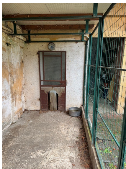
Vista serraglio cani