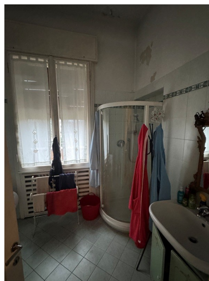
Vista bagno 2