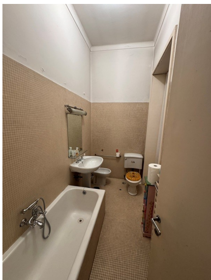
Vista bagno 3