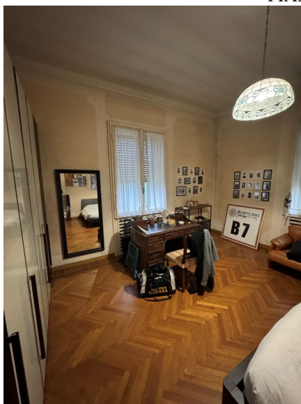
Vista camera 1