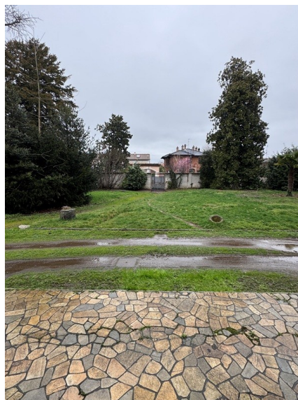
Vista corte comune