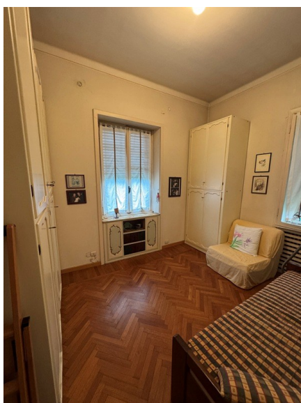
Vista camera 4