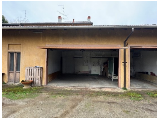
Vista generale immobile e garage