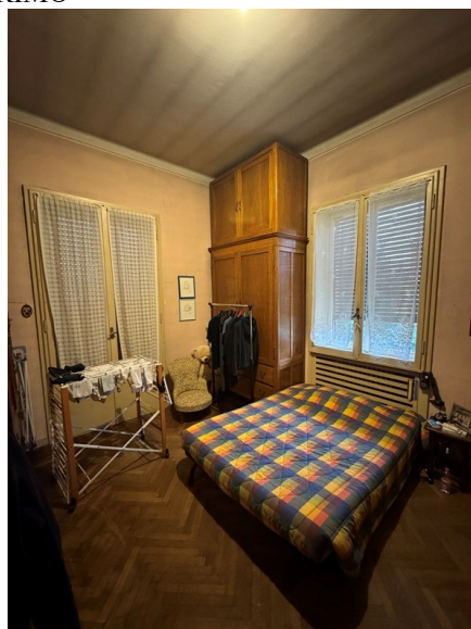
Vista camera 2