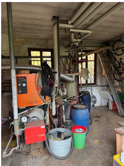
Vista centrale termica