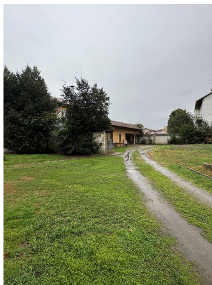
Vista corte comune