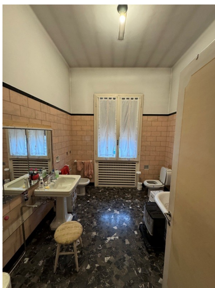
Vista bagno 1