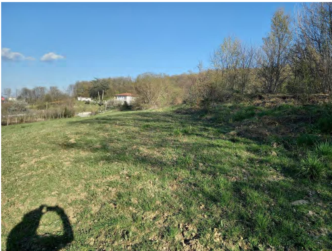
COMUNE DI BUSSO - TERRENO AGRICOLO: foglio 14 part. 37