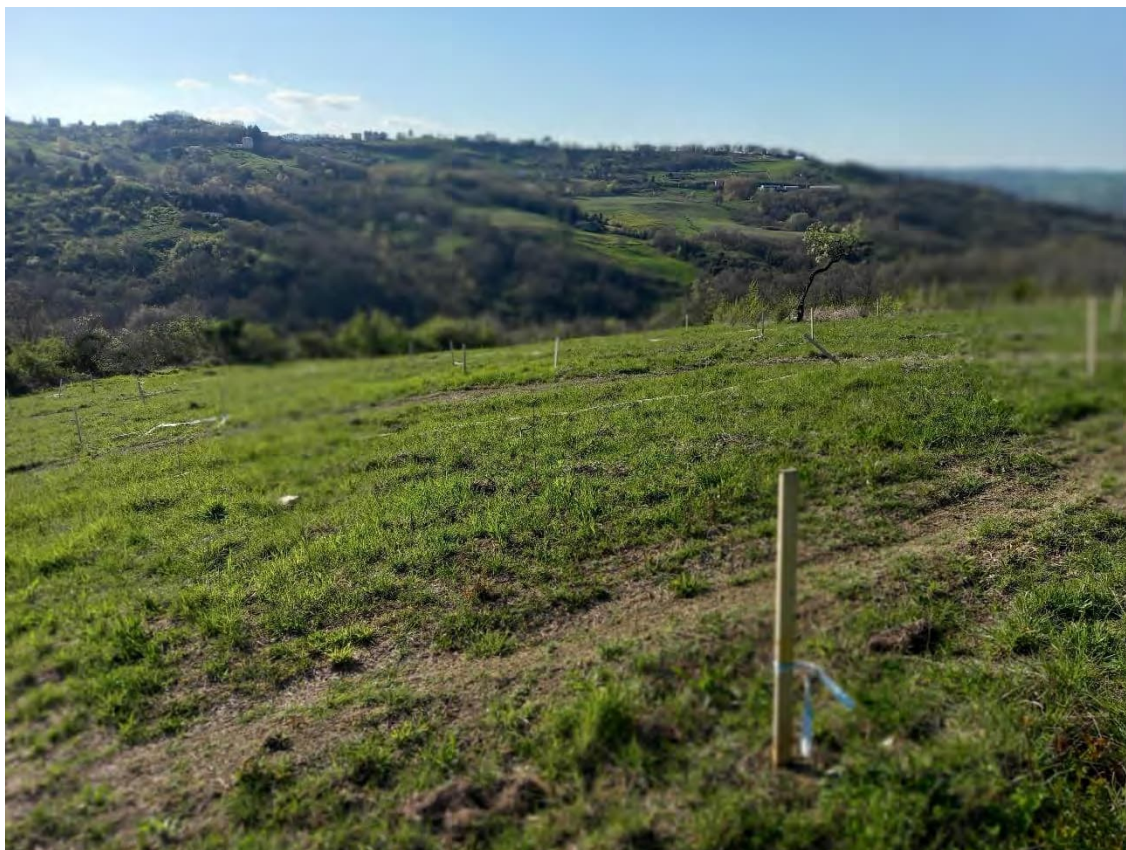
COMUNE DI BUSSO - TERRENO AGRICOLO - UTILIZZATO COME PISTA MOTO CROSS: foglio 12 part. 340