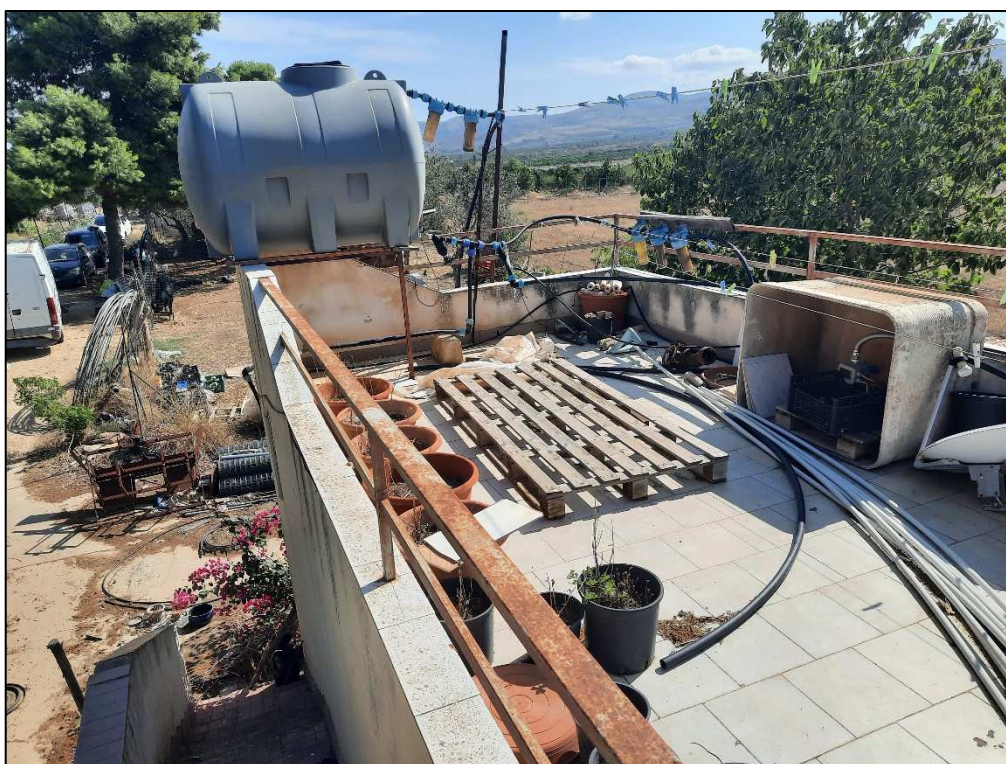
Unità immobiliare F. 61 p.lla 190 terrazzo