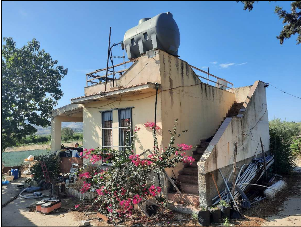
Unità immobiliare F. 61 p.lla 190