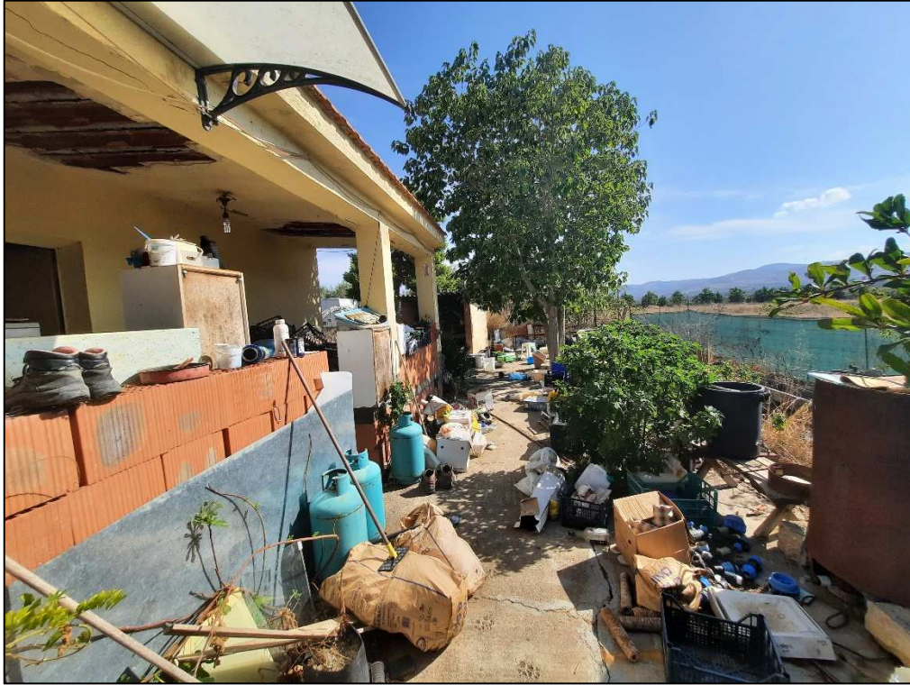
Unità immobiliare F. 61 p.lla 190 esterno