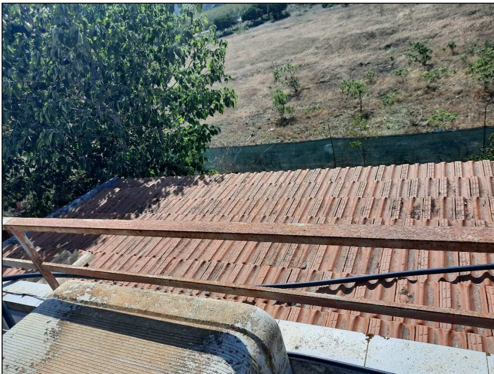
Unità immobiliare F. 61 p.lla 190 copertura pensilina