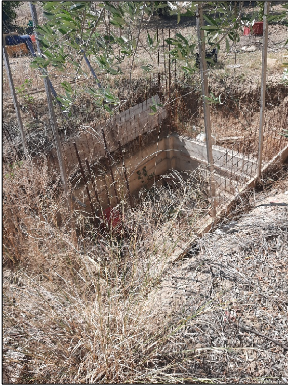
F. 61 p.lla 189 dispersore imp. scarico non completato