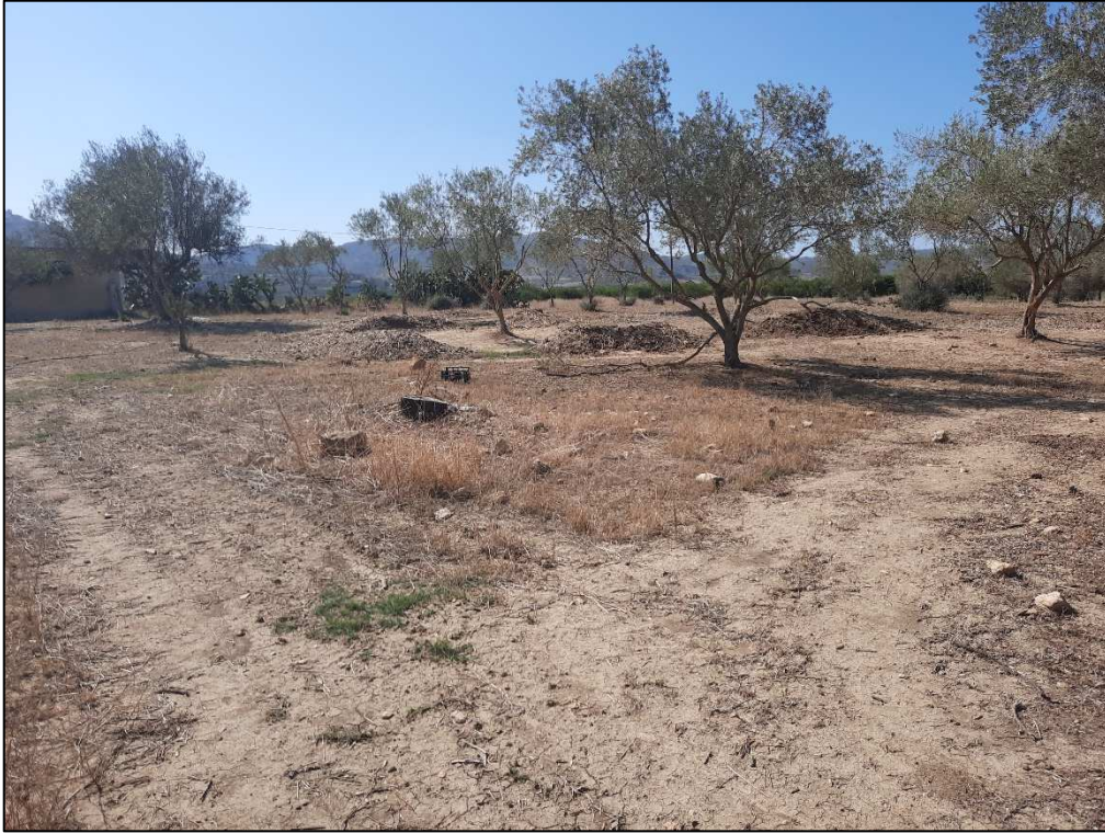
F. 161 p.lla 56 Uliveto