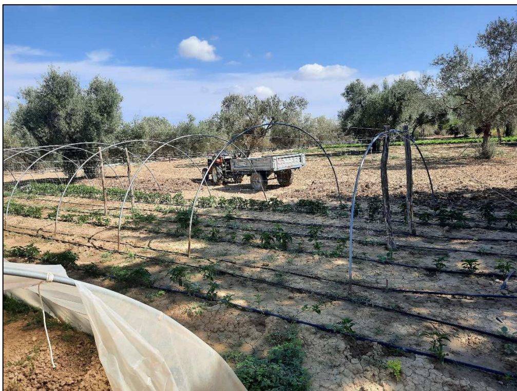
F. 161 p.lla 36 Porzione orto irriguo