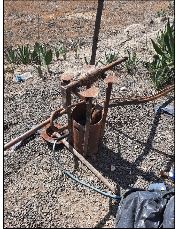
F. 161 p.lla 189 Pozzo artesiano