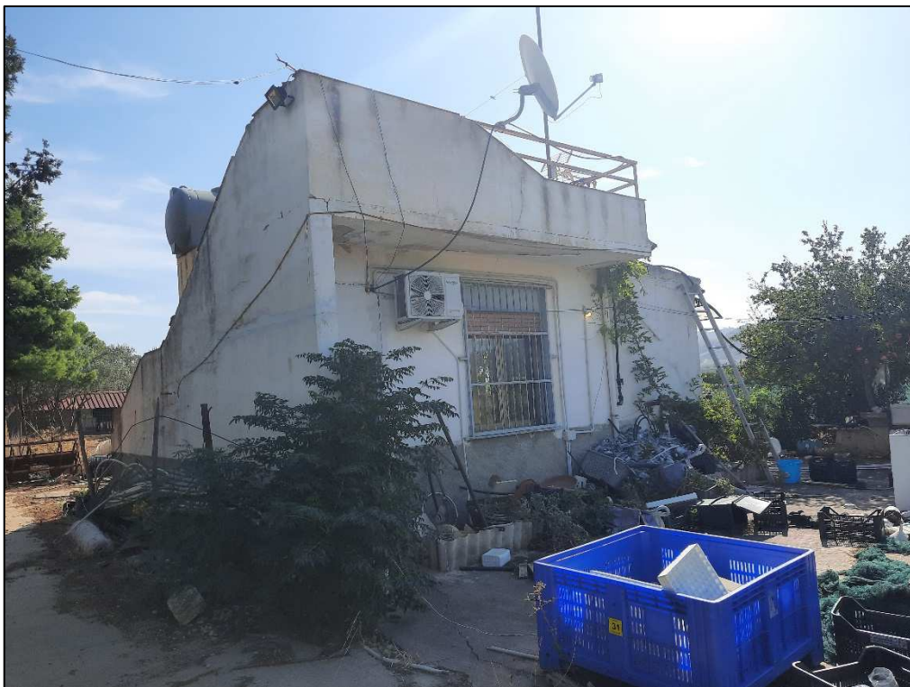
Unità immobiliare F. 61 p.lla 190