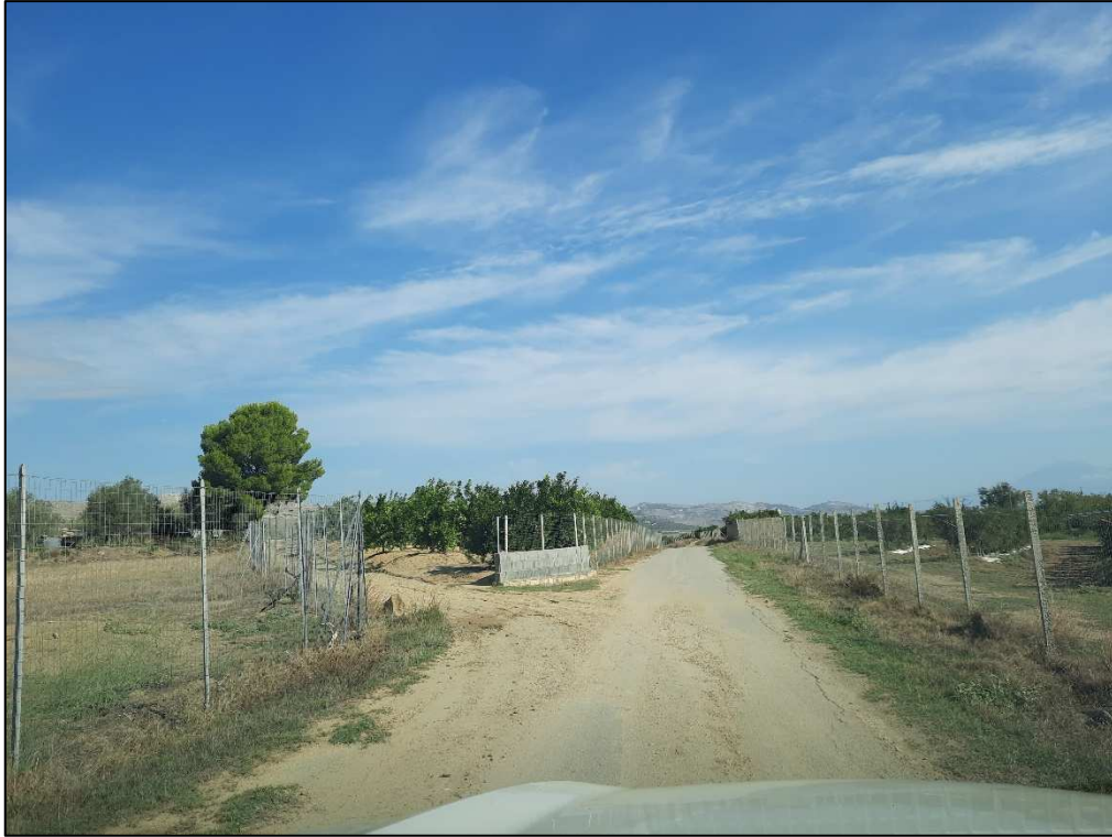
Strada di accesso in terra battuta: