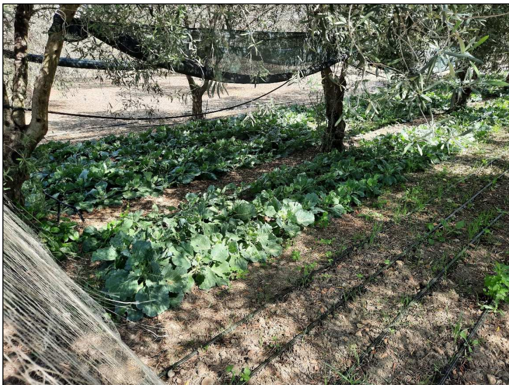
F. 61 p.lla 36 Porzione orto irriguo