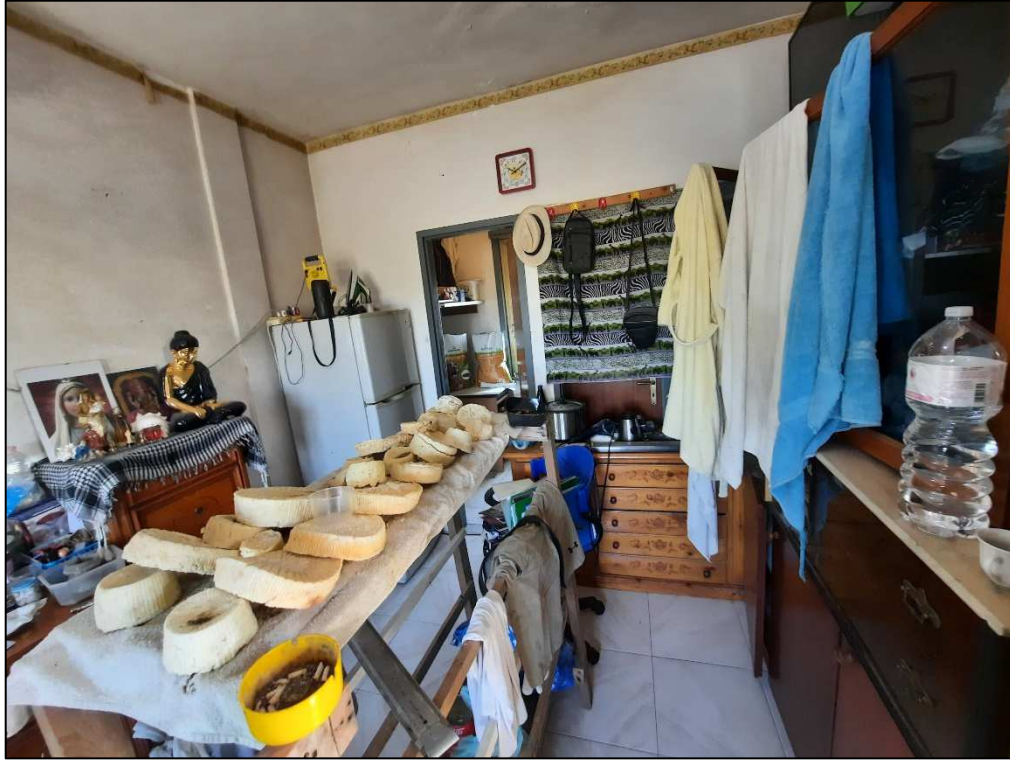
Unità immobiliare F. 61 p.lla 190 vano ingresso