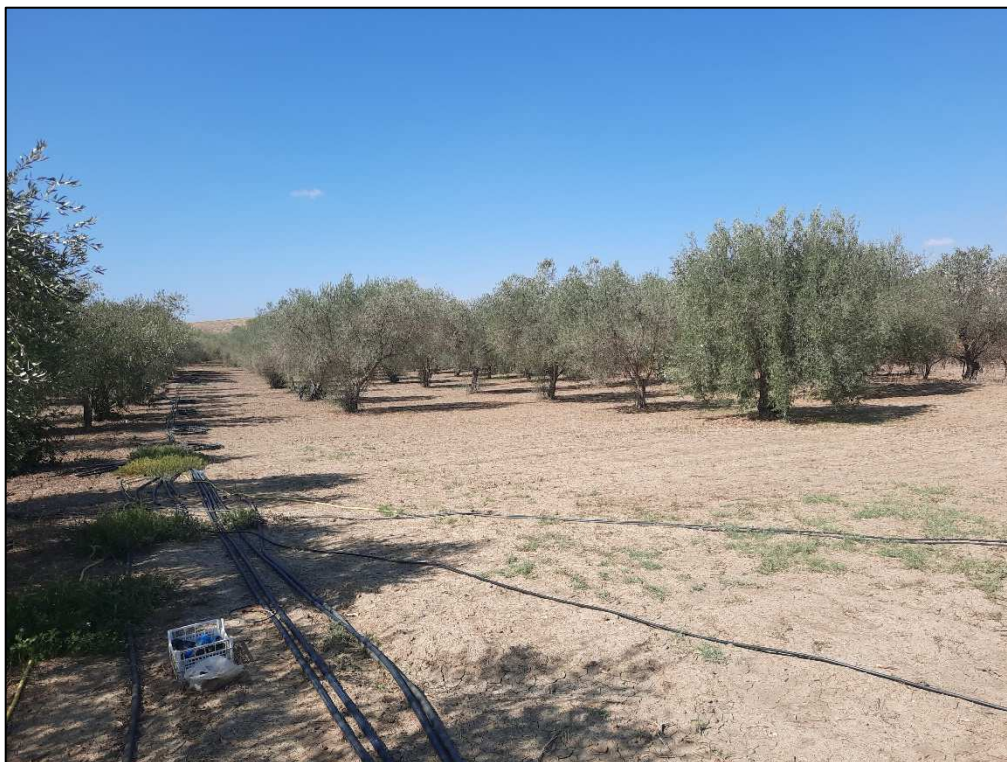
F. 61 p.lla 36 Porzione Uliveto