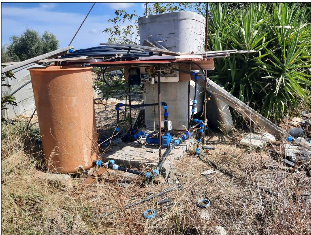
F. 61 p.lla 189 Impianto di irrigazione