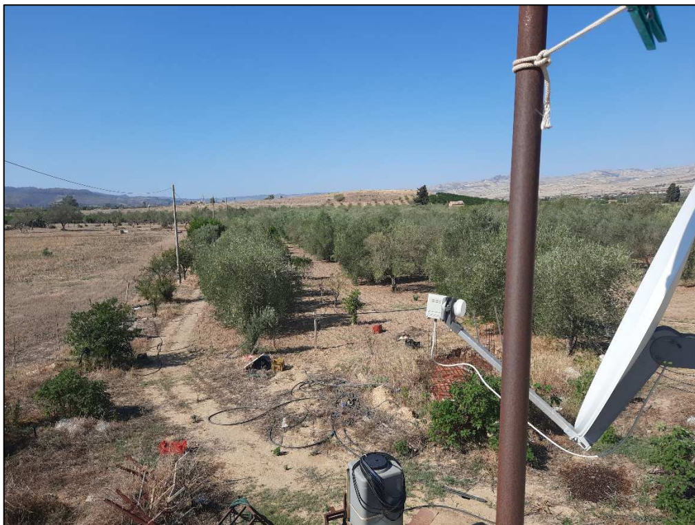
F. 161 p.lla 189 e 36 Veduta uliveto da terrazzo