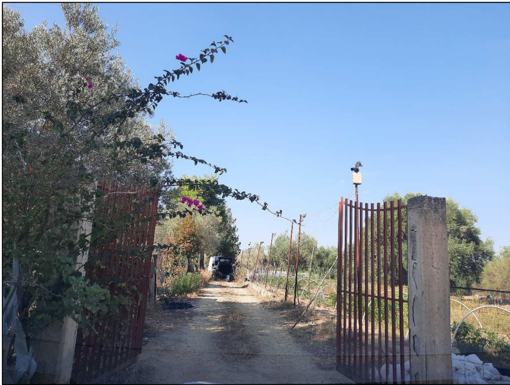
Cancello di accesso p.lla 190