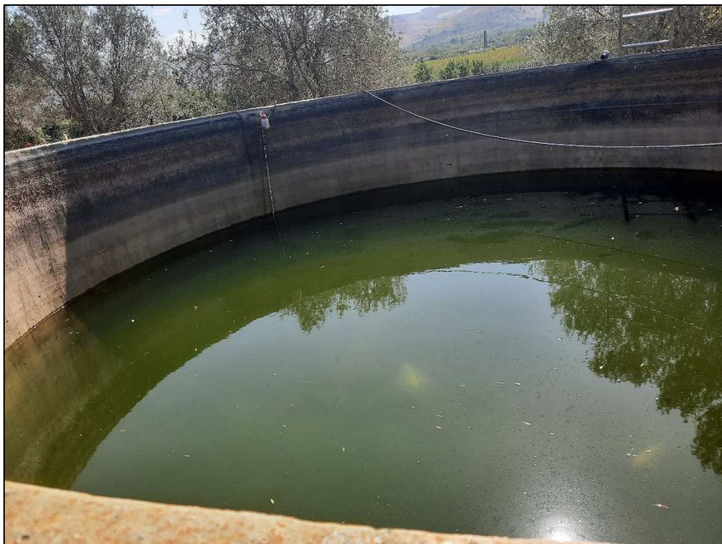
F. 161 p.lla 189 Vasca di raccolta acque