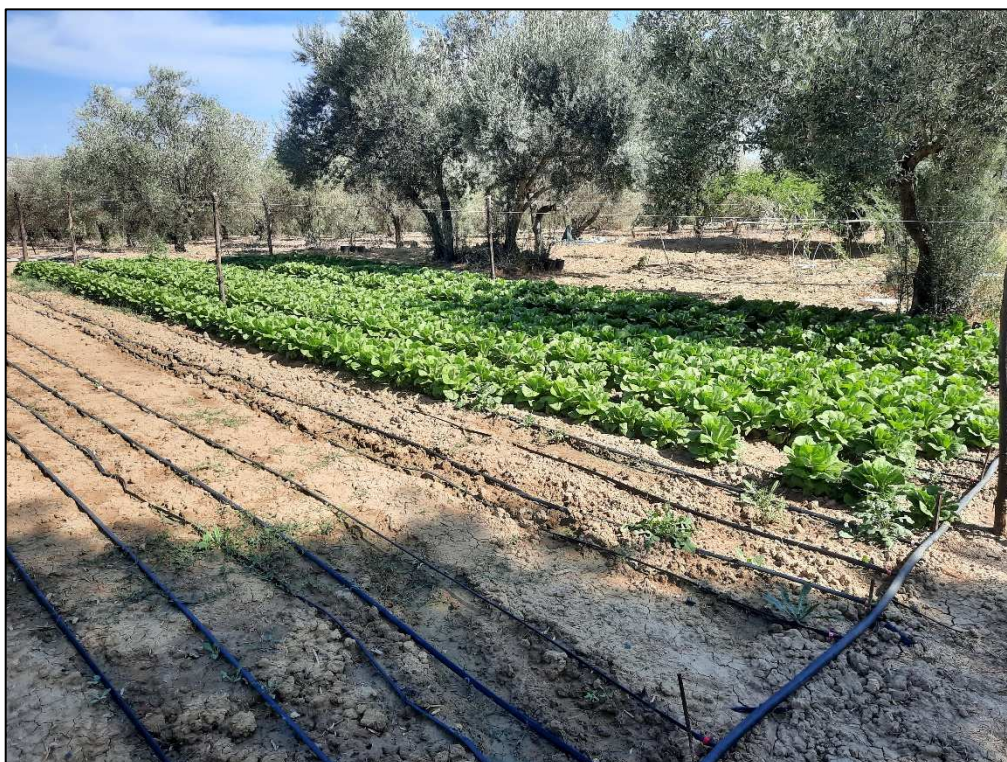
F. 61 p.lla 36 Porzione orto irriguo