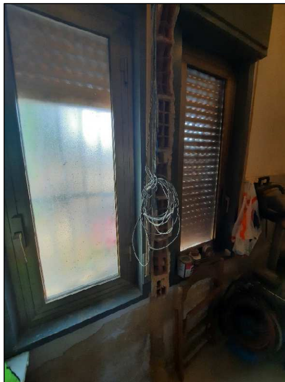
Unità immobiliare F. 61 p.lla 190 ex ripostiglio