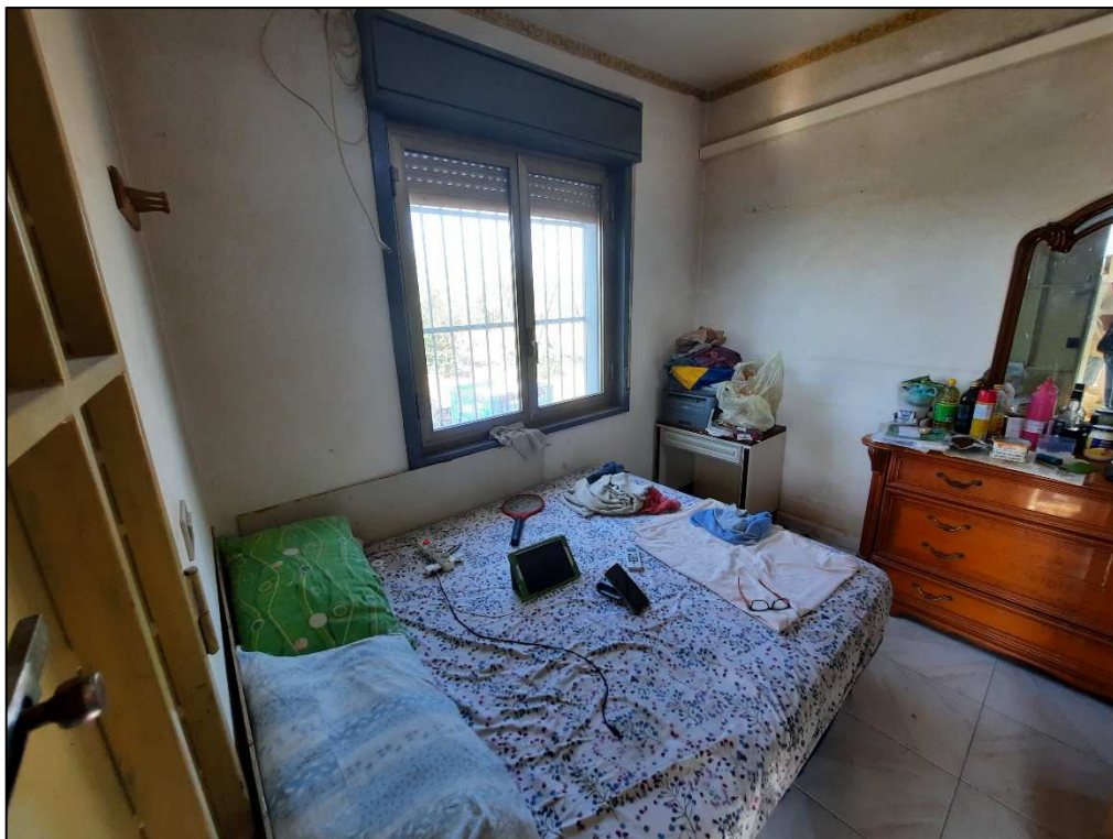
Unità immobiliare F. 61 p.lla 190 vano ingresso