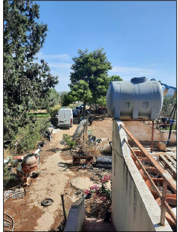
Unità immobiliare F. 61 p.lla 190 scale di accesso e terrazza