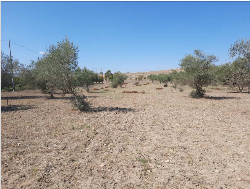
F. 161 p.lla 56 Uliveto