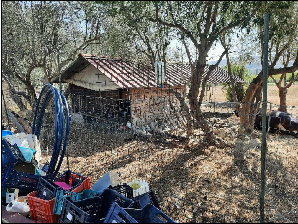
F. 161 p.lla 189 Ricovero per animali da demolire