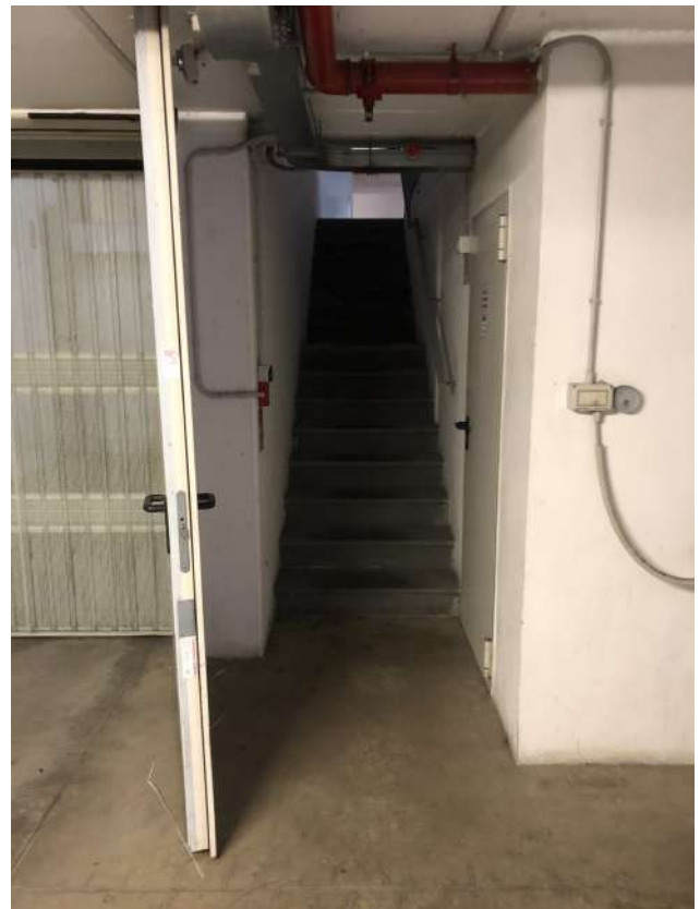
Foto 4- Piano terra scala di collegamento al piano superiore