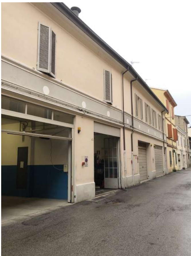
Foto 1- Prospetto via Daverio