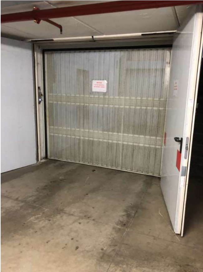
Foto 3- Piano terra monta-auto