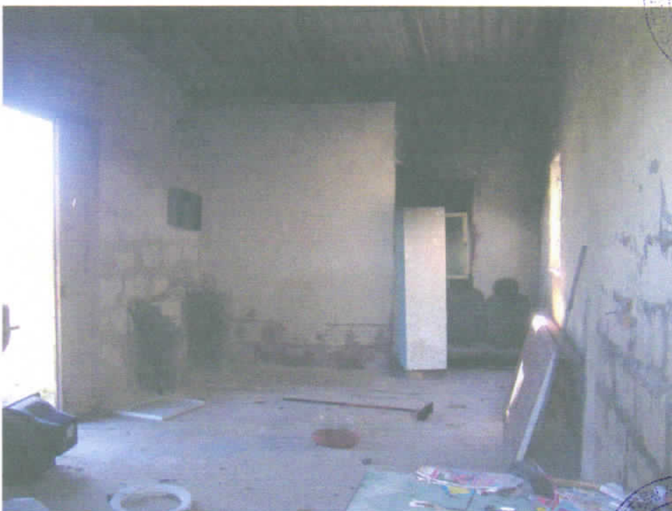
Foto n° 13 - Particolare interno del fabbricato allo stato rustico (bene n°2).