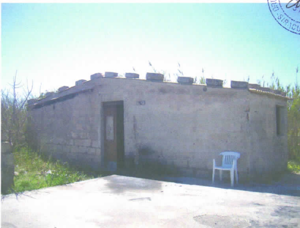
Foto n° 14 - Prospetto principale del fabbricato rustico (bene n° 2).