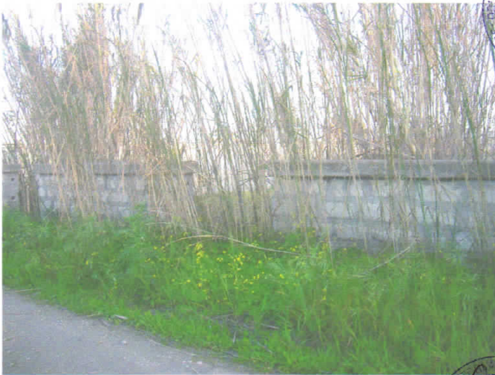
Foto n° 1 - Muro di confine con la stradella interpoderale (Nord).