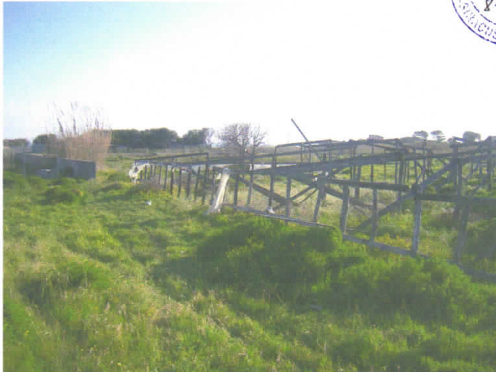
Foto n° 4 – Angolo Sud-Est del lotto su cui insistono vecchie serre in legno.