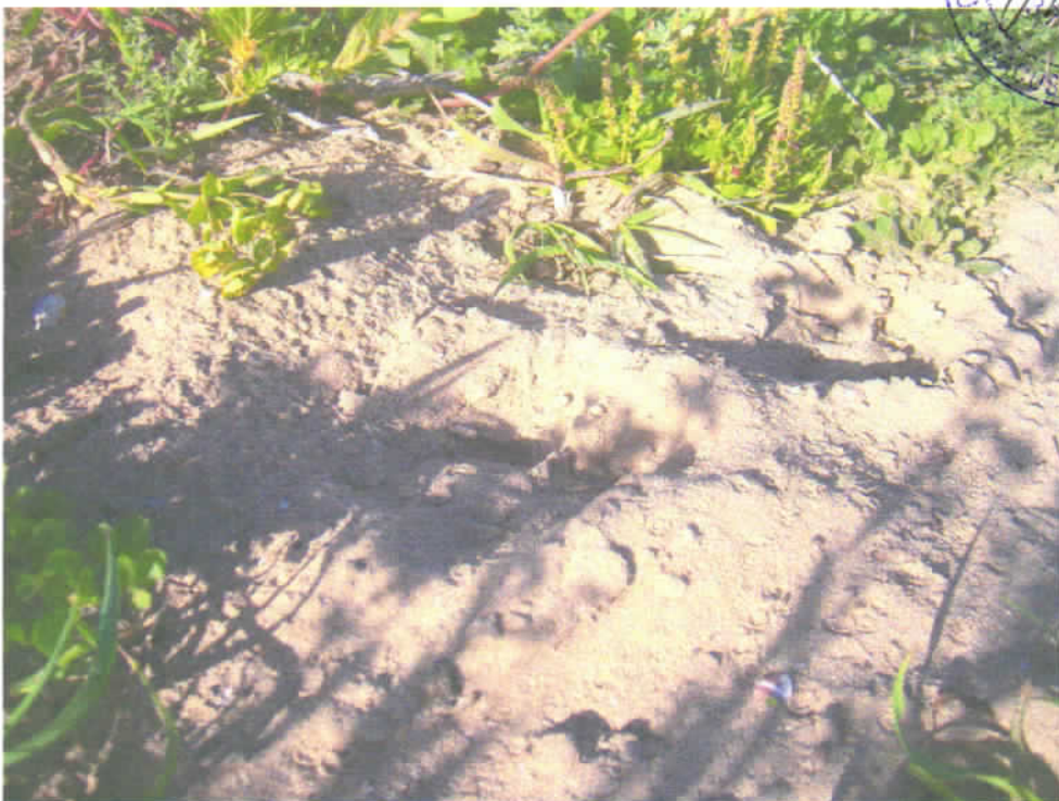
Foto n° 8 - Particolare del suolo sabbioso nella porzione più a Sud del lotto.