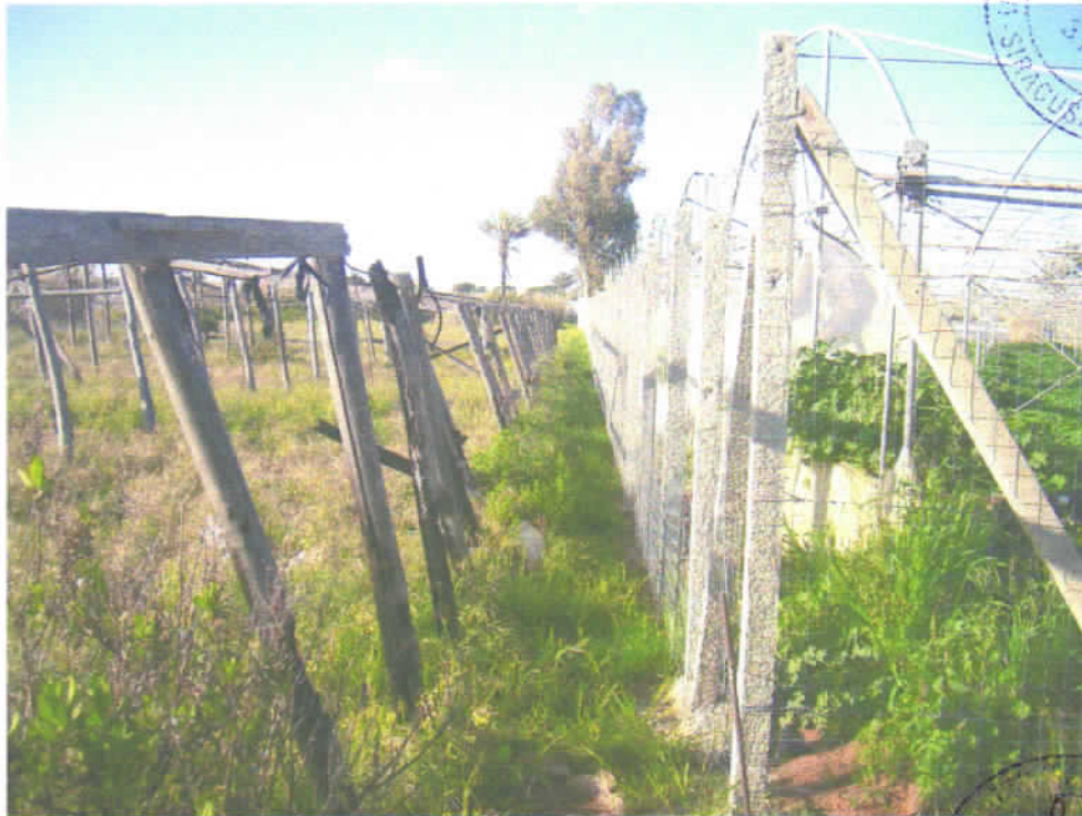
Foto n° 5 - Recinzione sul confine Est: a sinistra il lotto in esame.