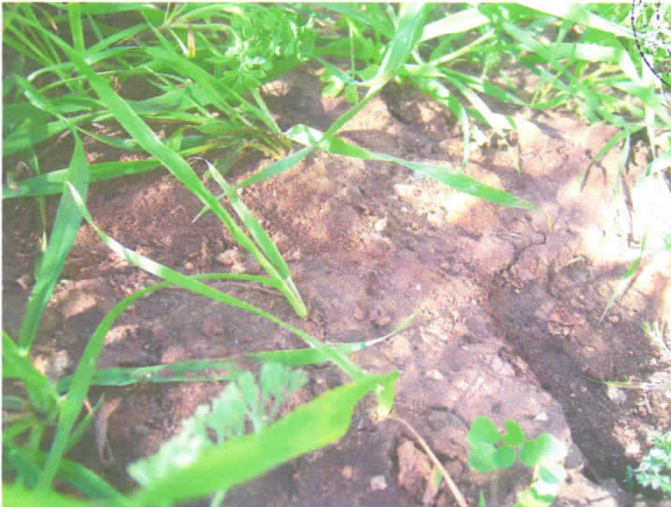
Foto n° 9 - Particolare del suolo bruno-rossastro nella porzione più a Nord del lotto.