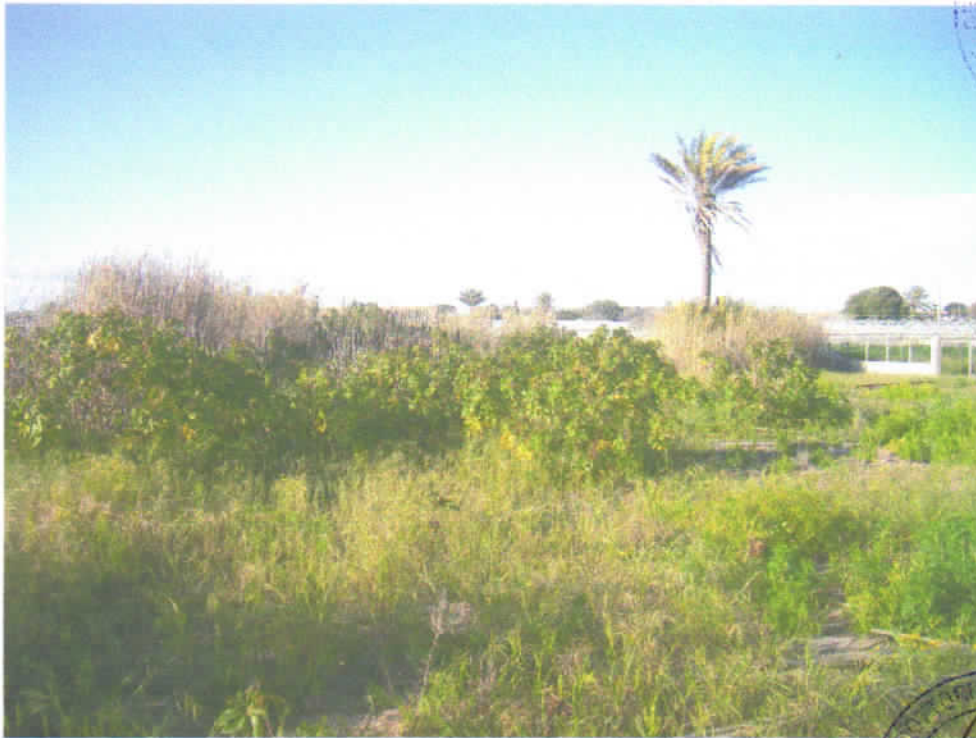
Foto n° 7 - Terreno incolto infestato da vegetazione erbacea ed arbustiva.