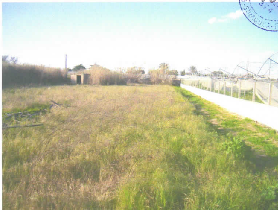
Foto n° 6 - A destra il confine Est del lotto; in fondo il confine Nord.