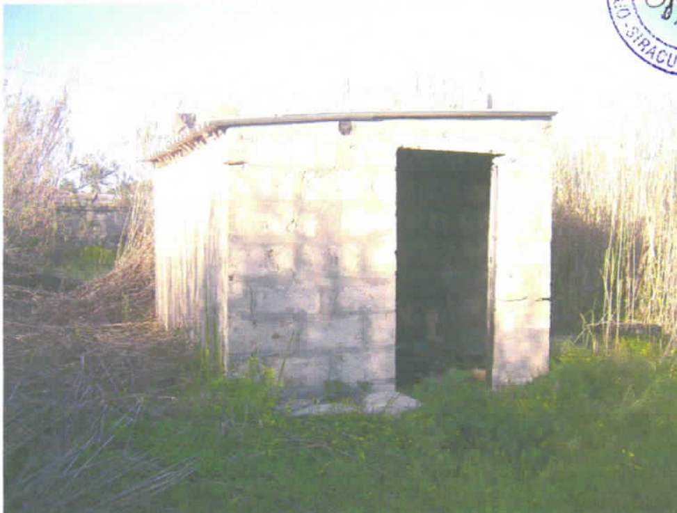
Foto n° 18 - Casotto allo stato grezzo per impianto di sollevamento (bene n° 3).