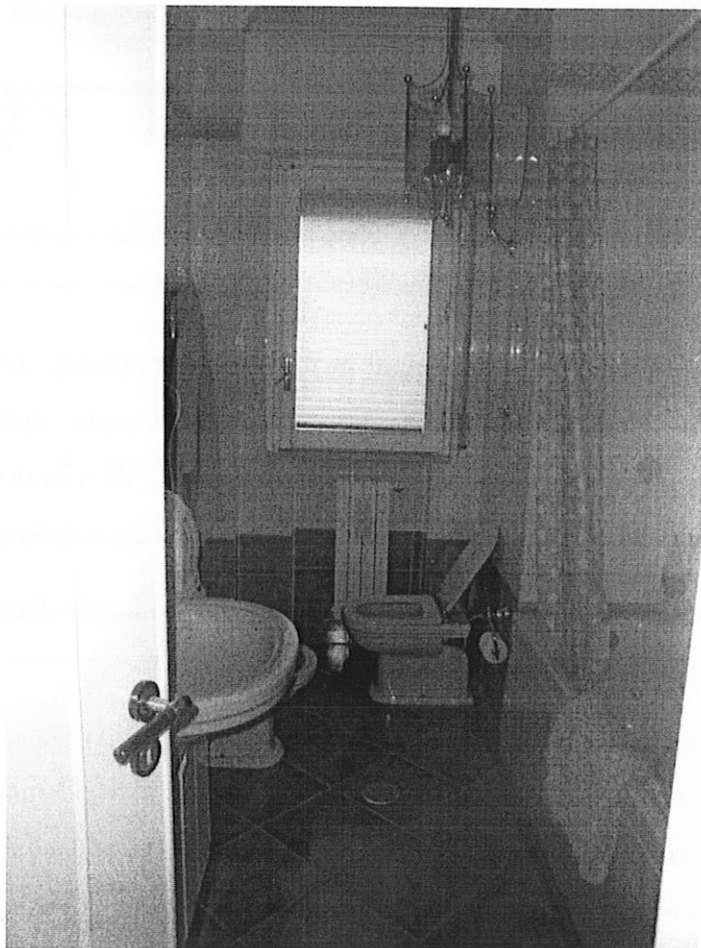
Foto 11: IMMOBILE A. Appartamento sito in Cerignola, alla Via Piano San Rocco n. 16, piano 1, interno 2, scala A1. Bagno grande.