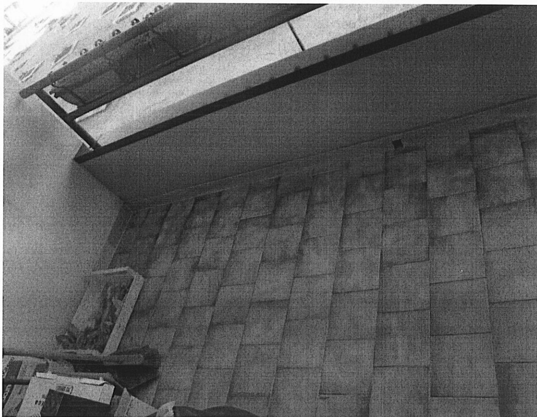
Foto 12: IMMOBILE A. Appartamento sito in Cerignola, alla Via Piano San Rocco n. 16, piano 1, interno 2, scala A1. Balcone su Piano delle Fosse.