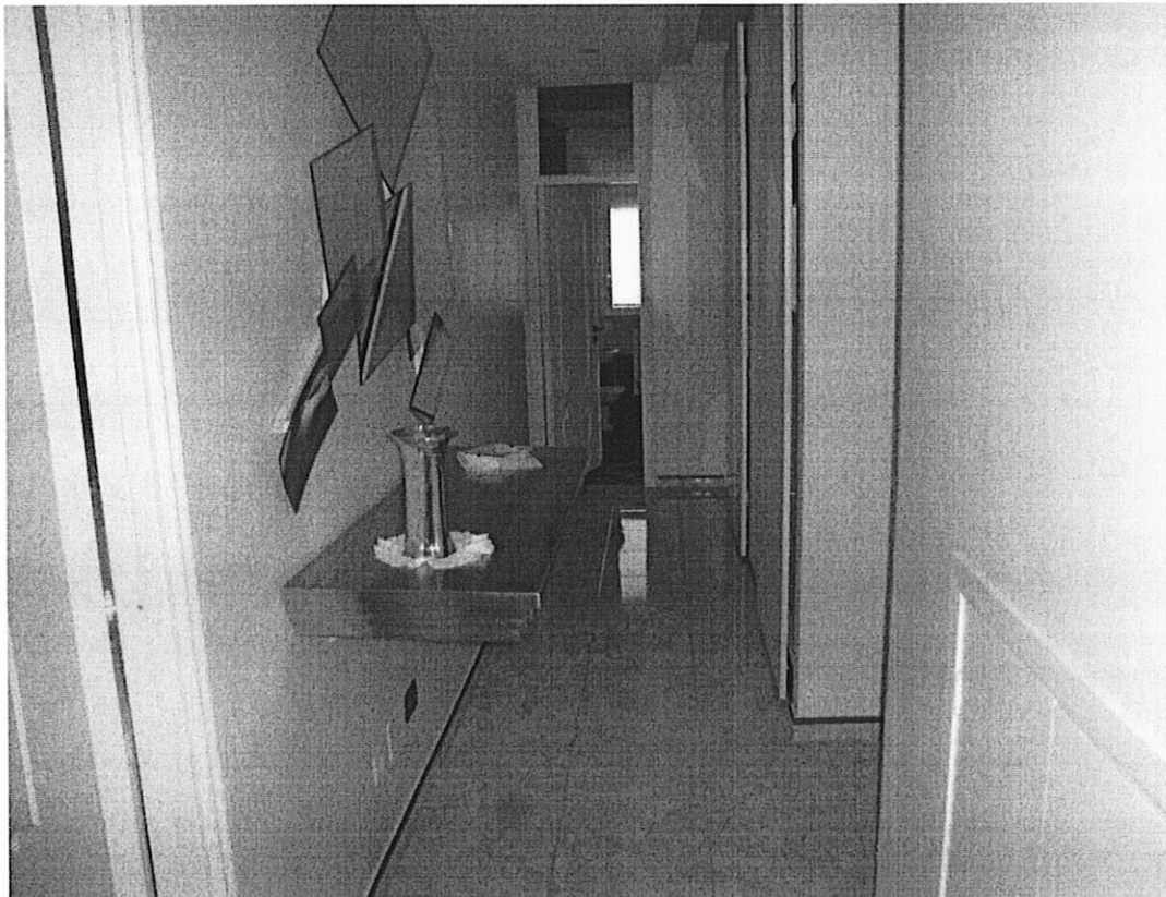
Foto 6: IMMOBILE A. Appartamento sito in Cerignola, alla Via Piano San Rocco n. 16, piano 1, interno 2, scala A1. Disimpegno.