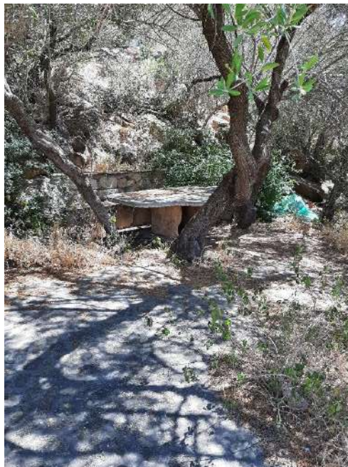
Foto 11-12-13-14: Alcuni particolari degli esterni