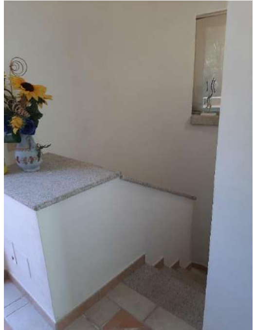
Foto 15-16-17-18: La zona giorno