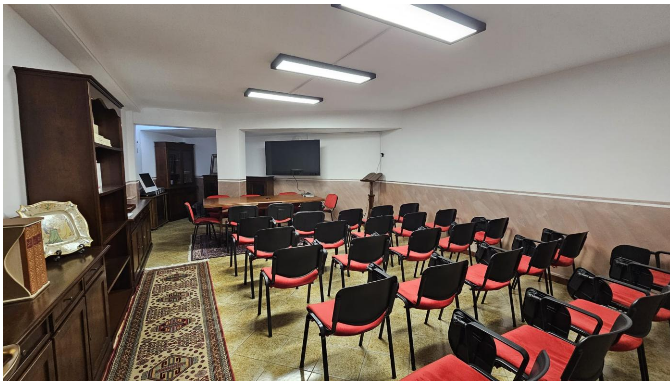
Figura 5 – sala conferenze