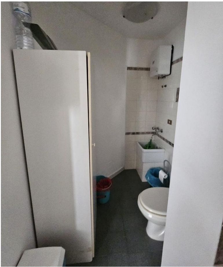
Figura 7 - bagno