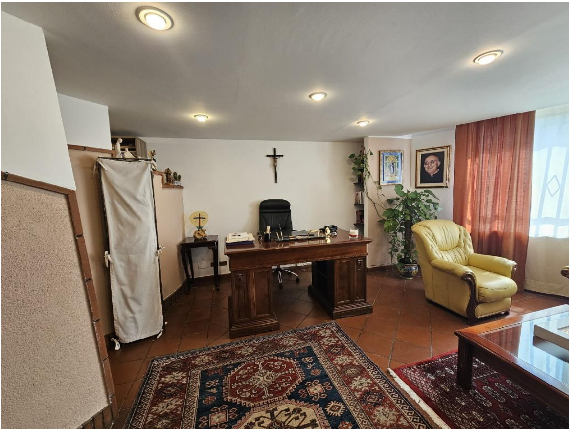
Figura 11 – vista studio