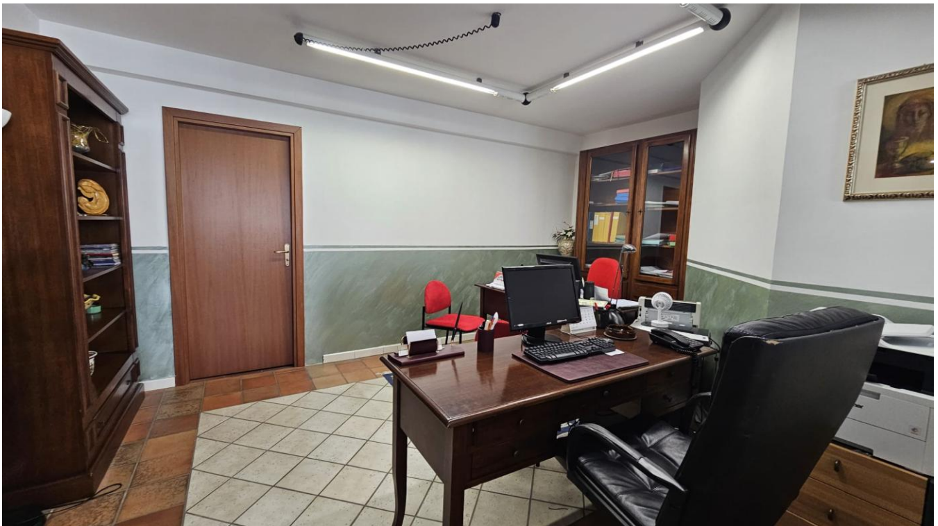
Figura 4 – area di passaggio per gli altri ambienti ed ufficio