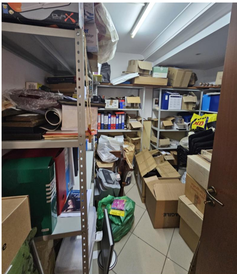
Figura 9 – interno del ripostiglio