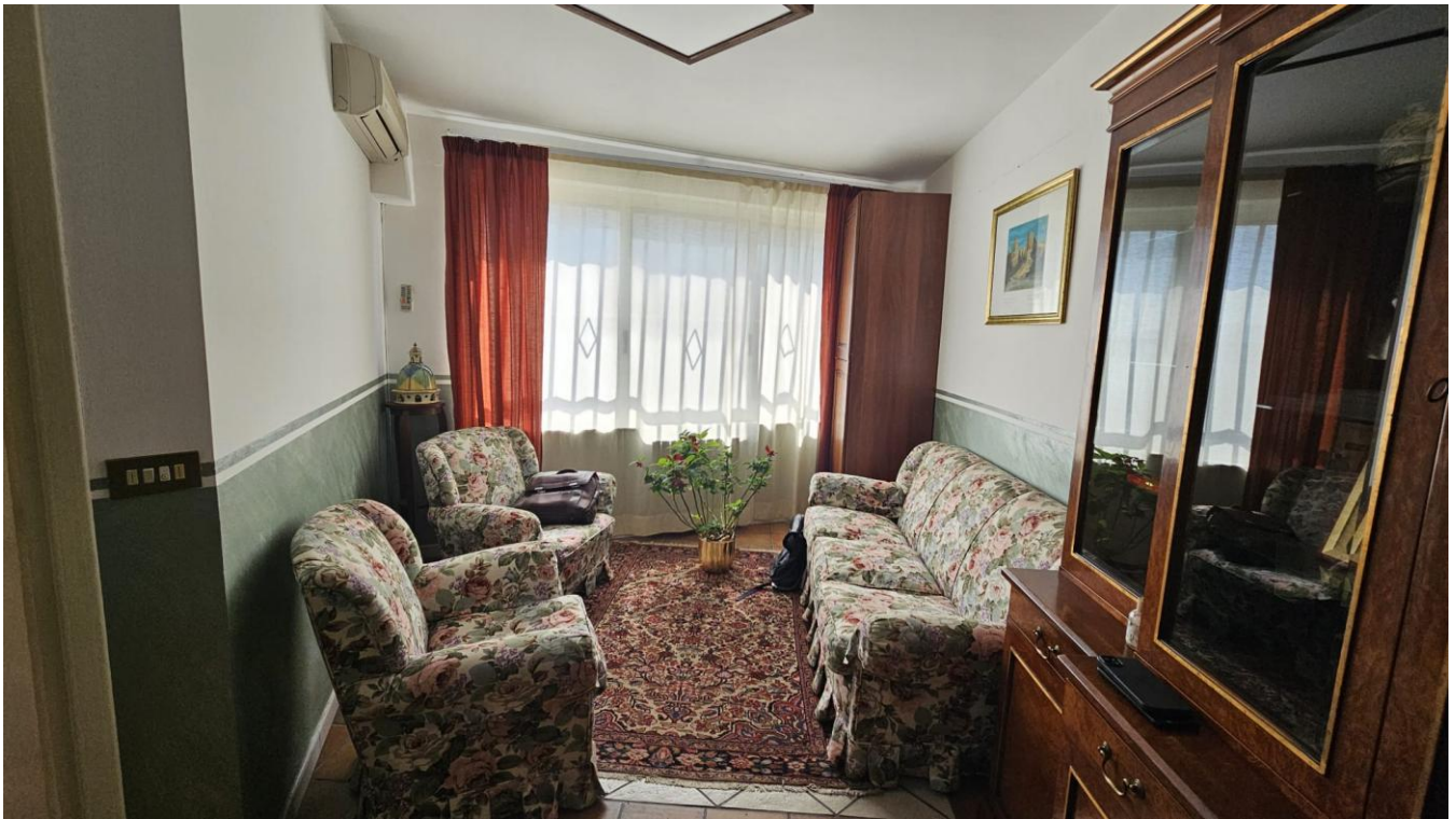
Figura 3 – salotto finestrato