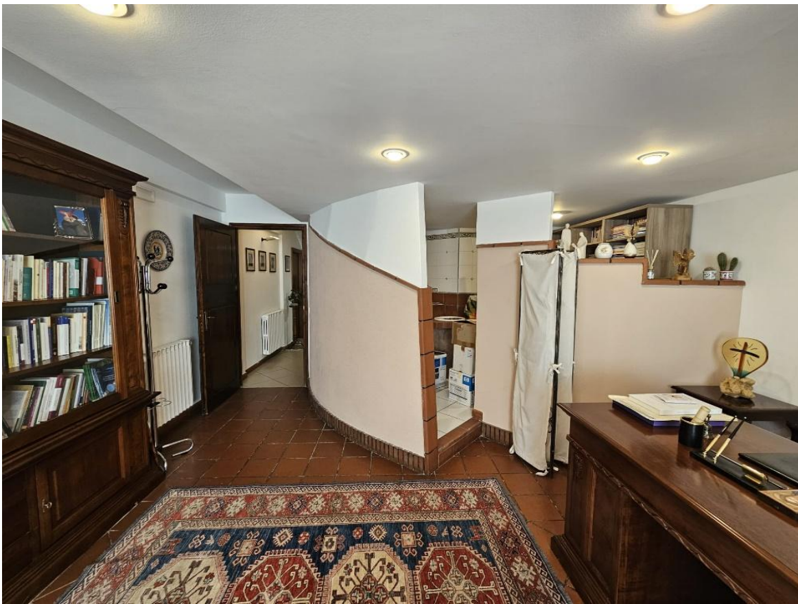
Figura 12 – vista ingresso allo studio e accesso al secondi ripostiglio