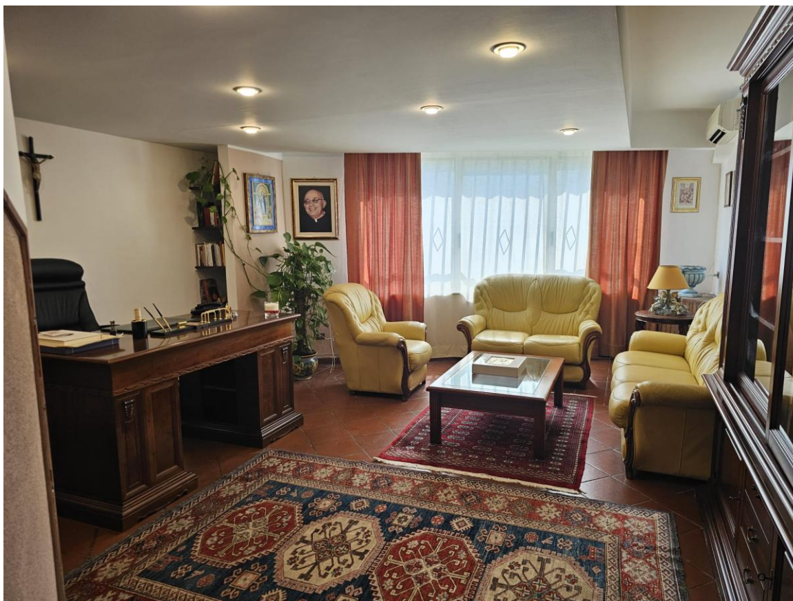
Figura 10 – vista studio