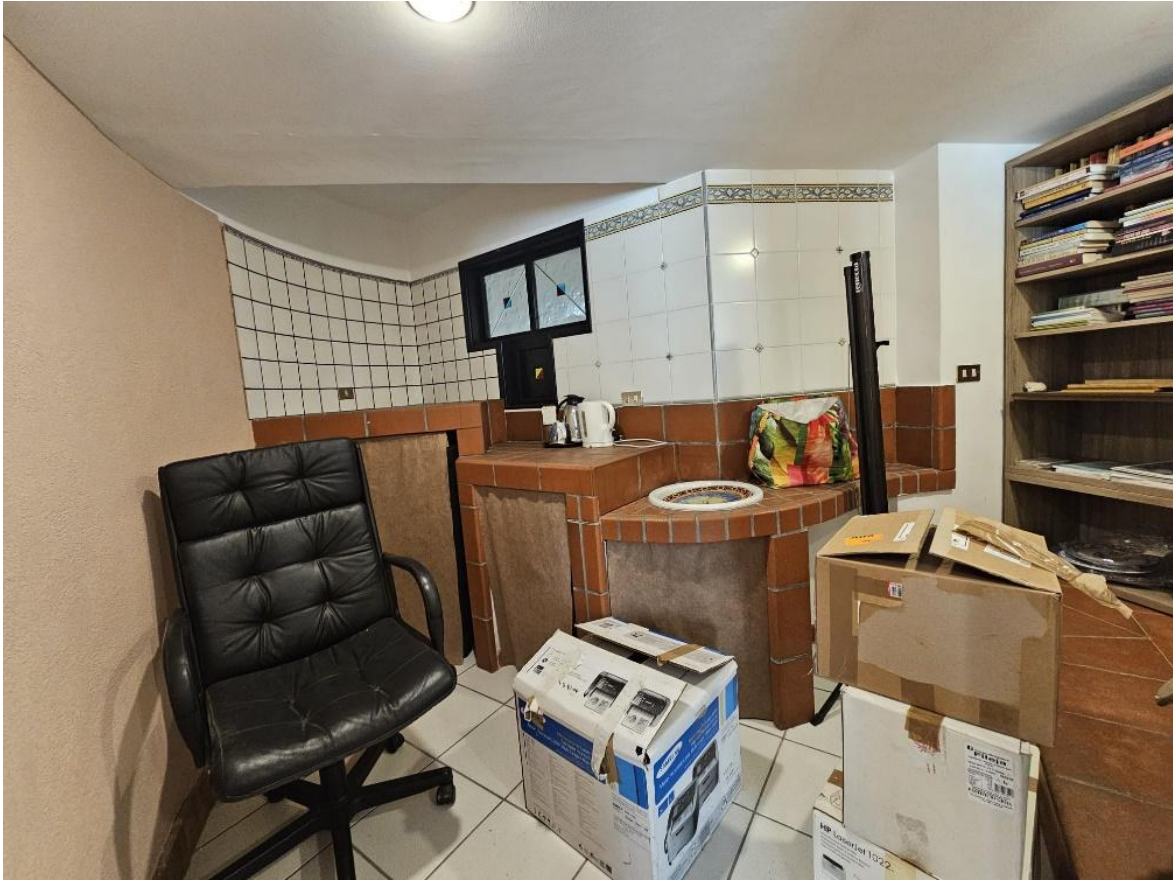
Figura 13 – interno del secondo ripostiglio