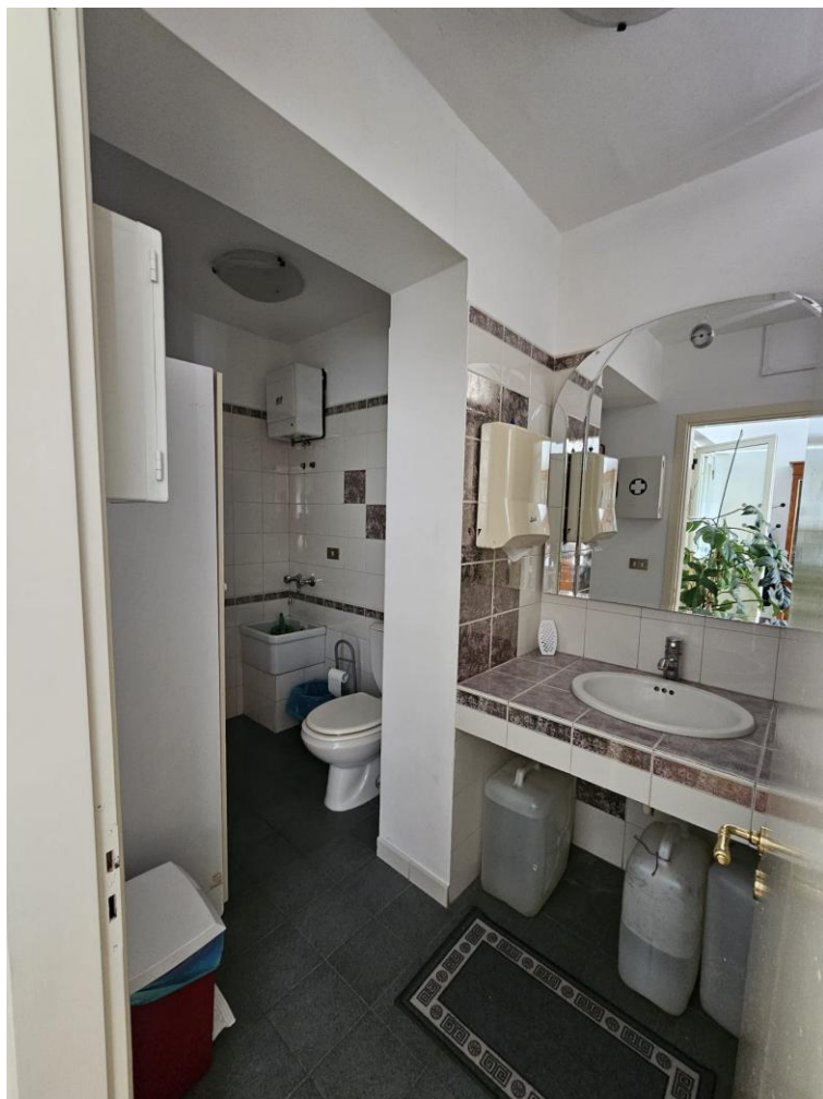
Figura 6 – antibagno