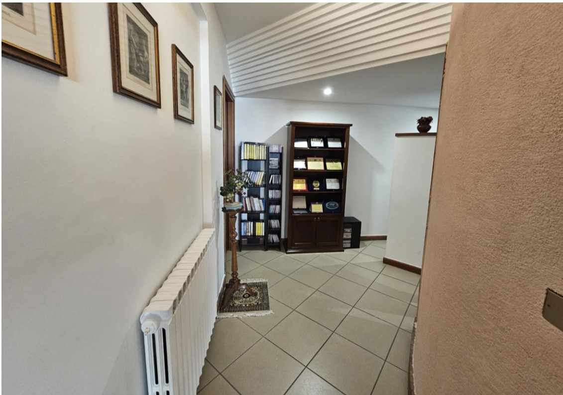
Figura 8 – disimpegno / corridoio di passaggio