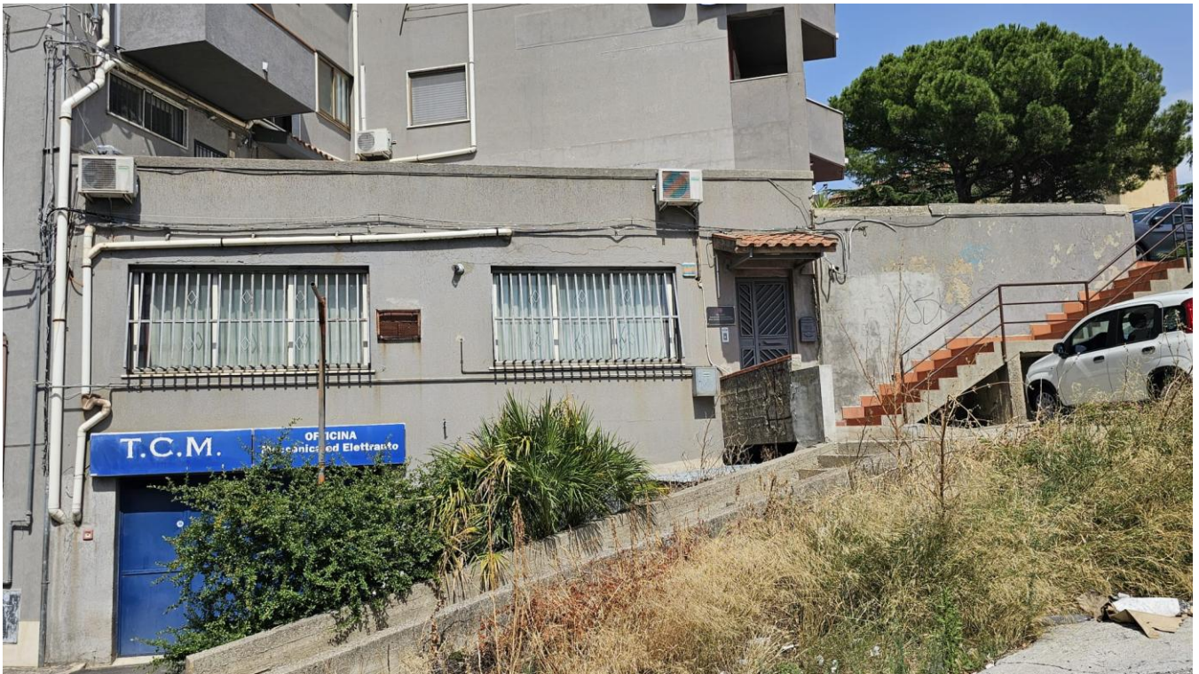
Figura 1 - prospetto principale ed ingresso all'immobile