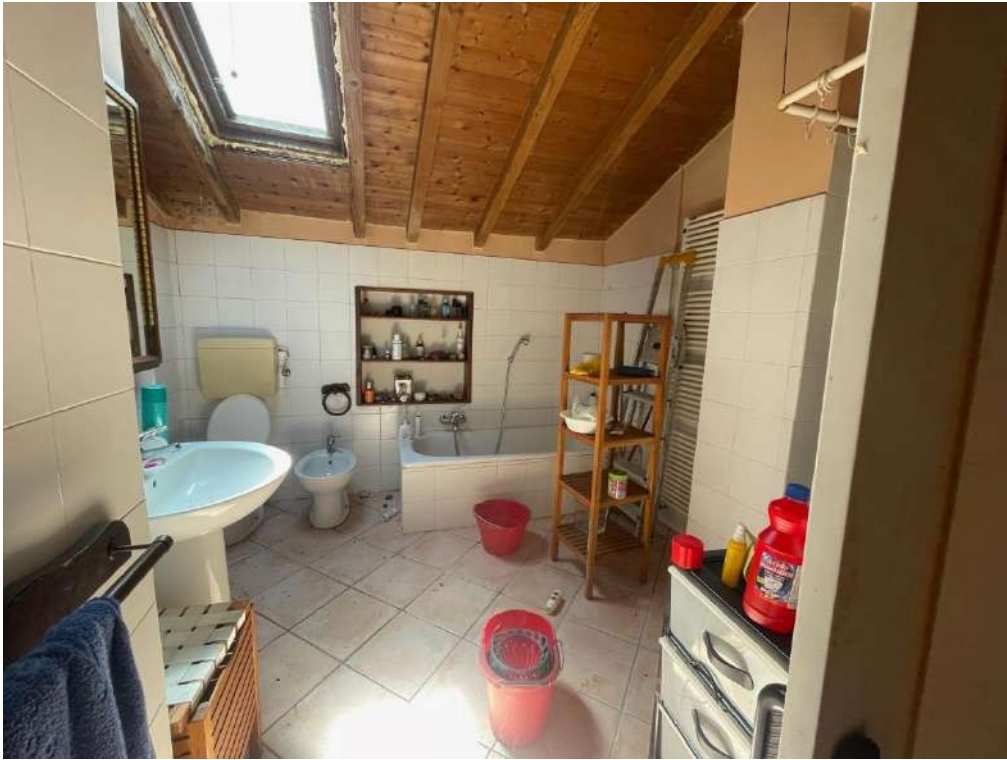
35- Piano Primo: Bagno