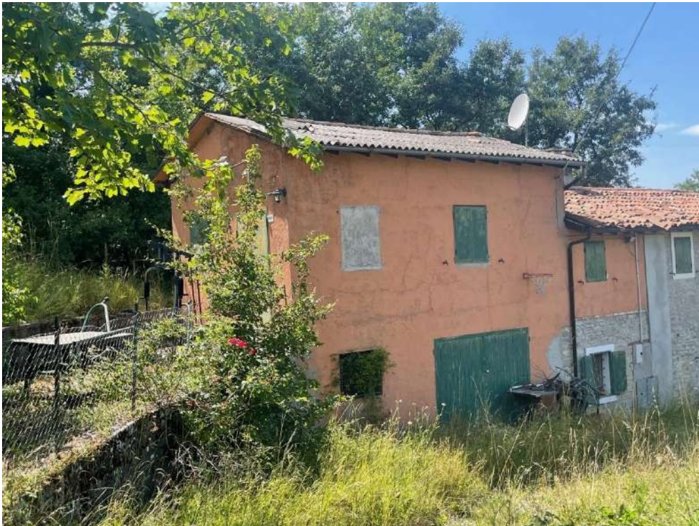
6- Vista esterna del fabbricato