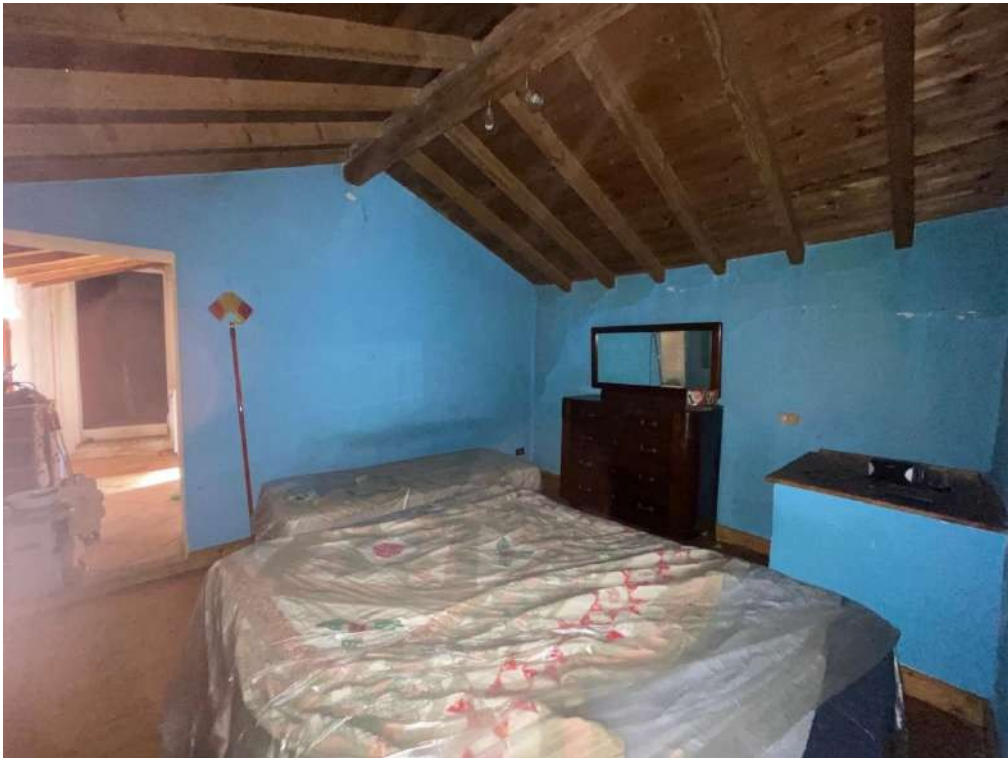
32- Piano Primo: Camera