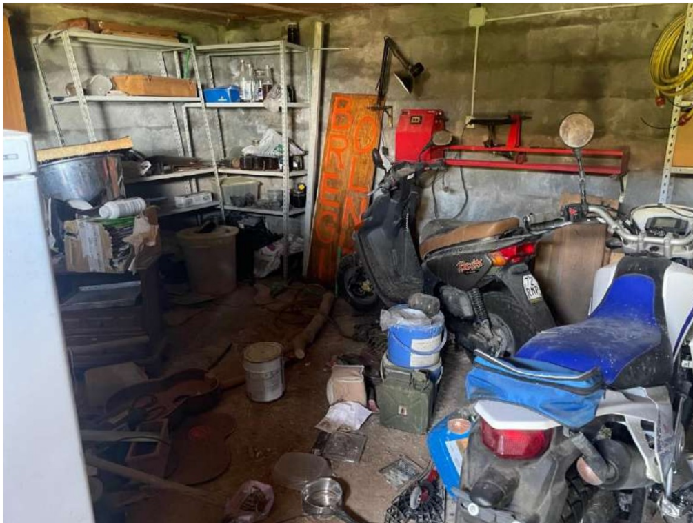
42- Piano Terra: Cantina (accesso esterno)