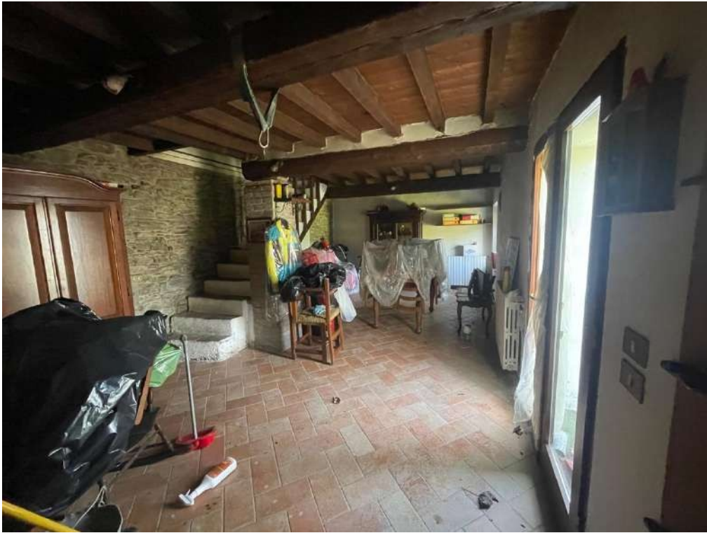
23- Piano Terra: Zona giorno