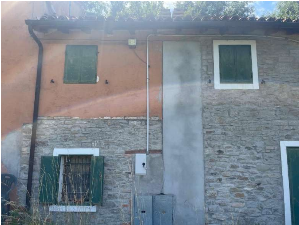
10- Vista esterna del fabbricato