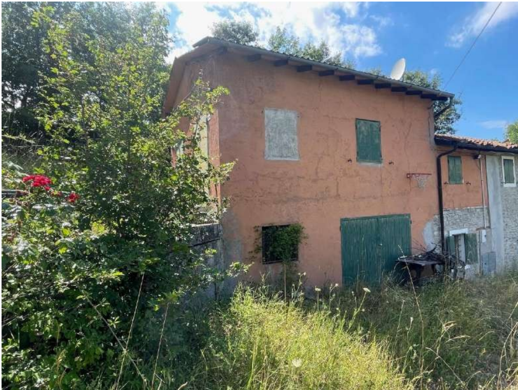
8- Vista esterna del fabbricato