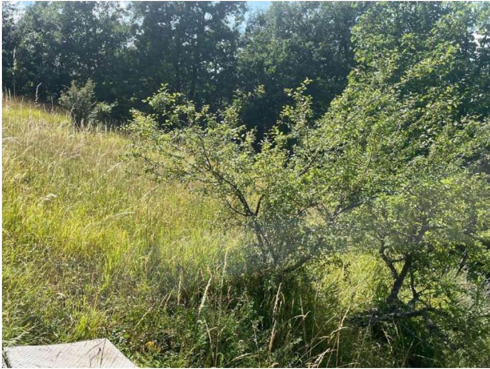
17- Vista esterna: area cortiliva