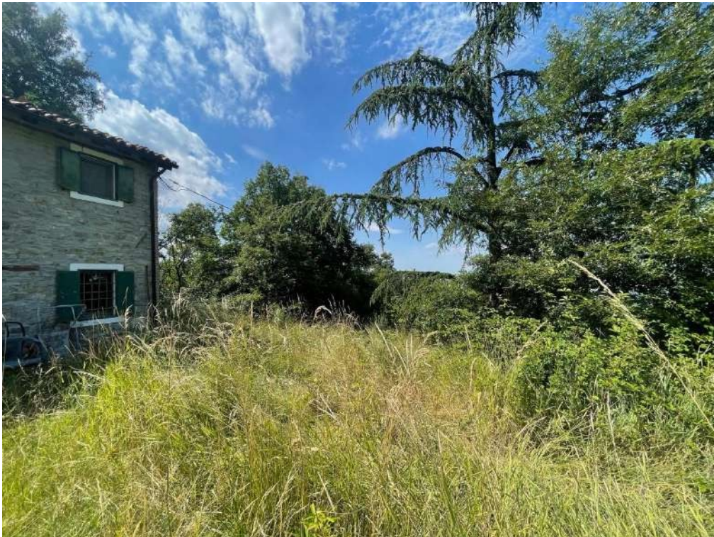
14- Vista esterna: area cortiliva