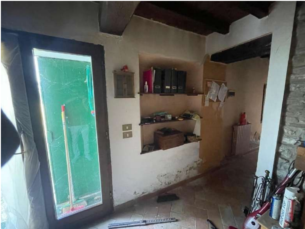
24- Piano Terra: Zona giorno