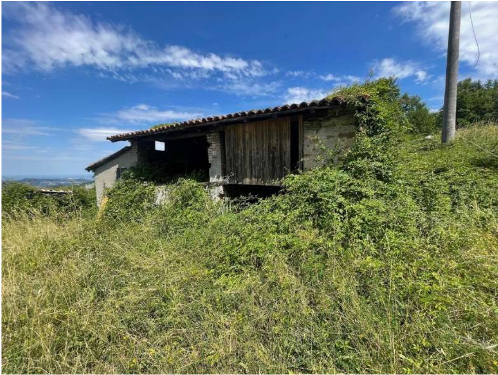
19- Vista fabbricato di servizio