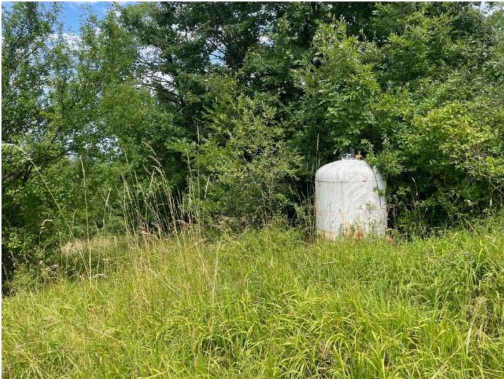
4- Vista esterna: cisterna gas