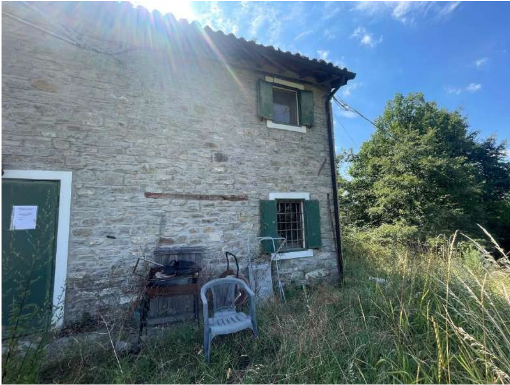
11- Vista esterna del fabbricato