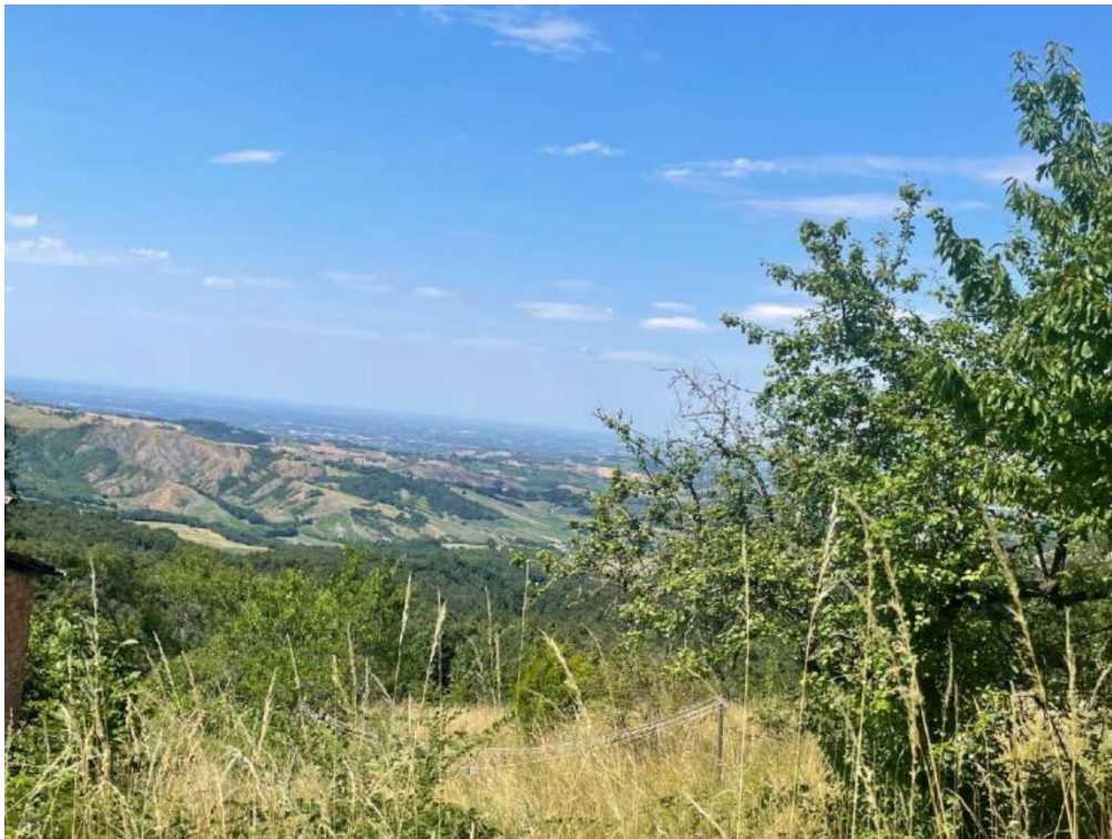
15- Vista esterna: area cortiliva