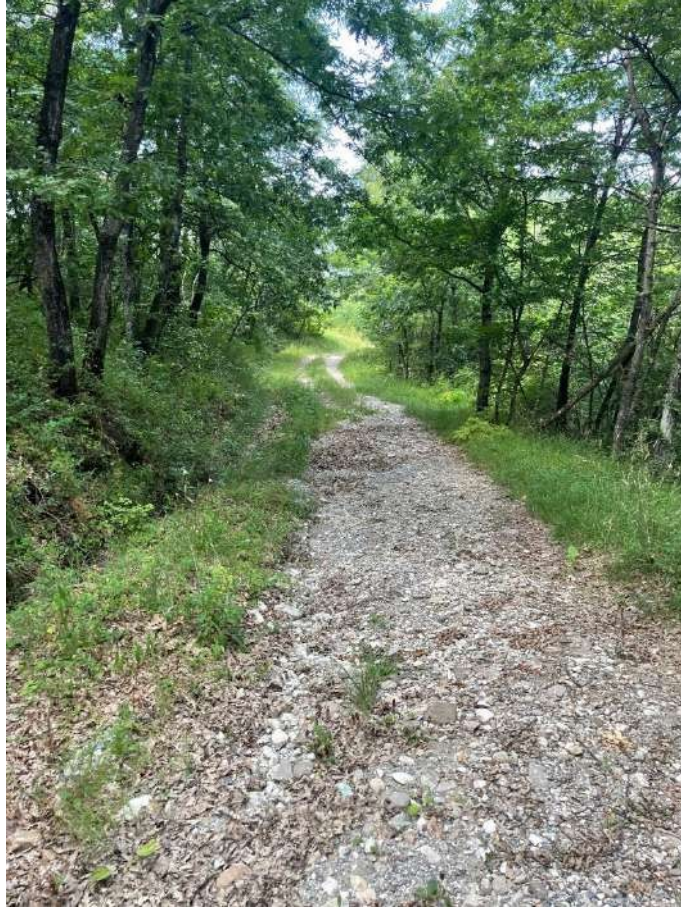
1-Vista esterna: strada di accesso alla proprietà