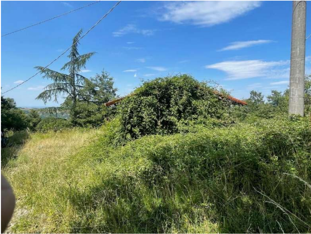
21- Vista fabbricato di servizio