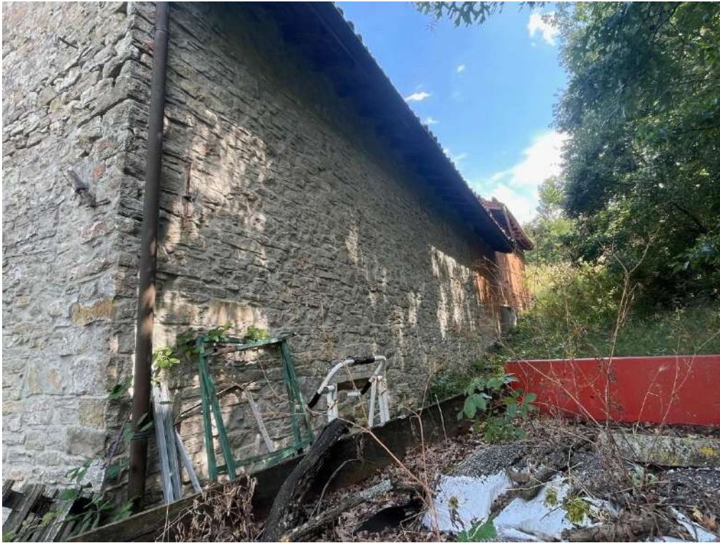
13- Vista esterna del fabbricato