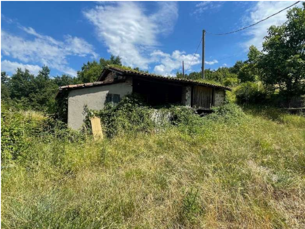
20- Vista fabbricato di servizio