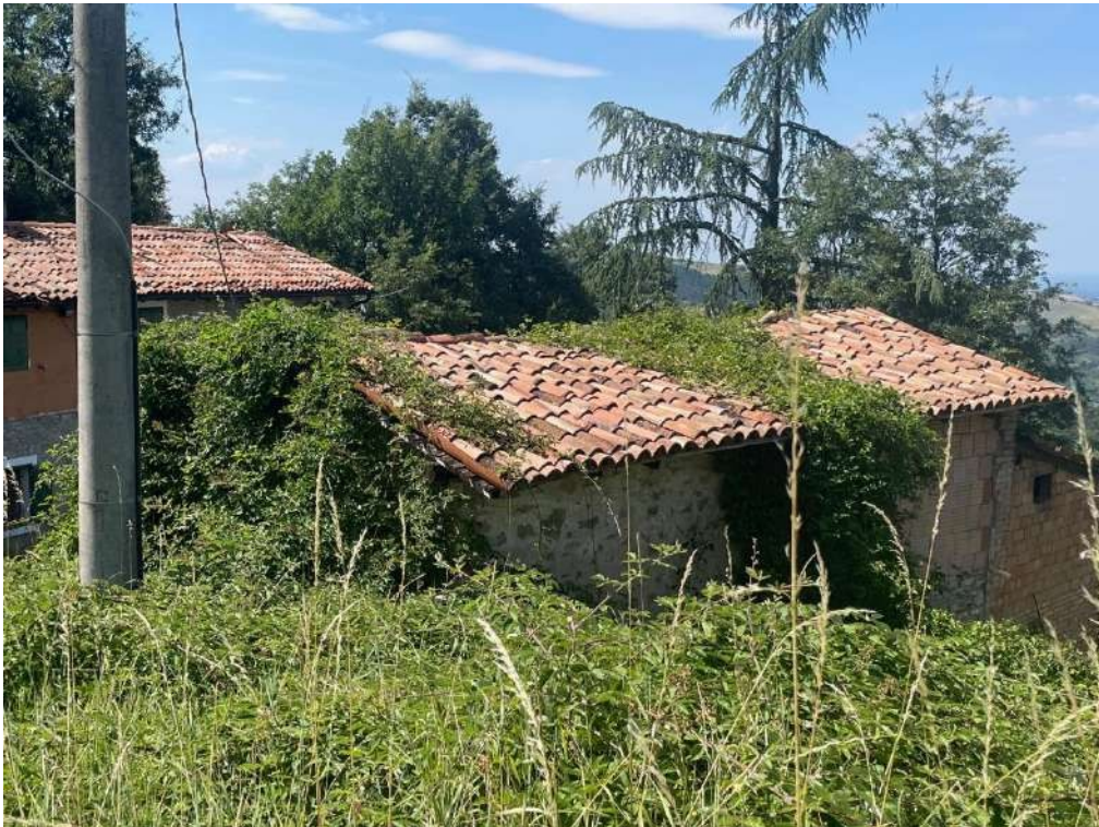
22- Vista fabbricato di servizio