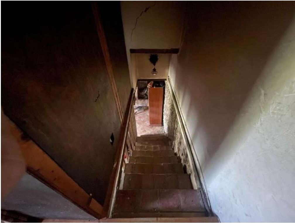
29- Piano Primo: Scala