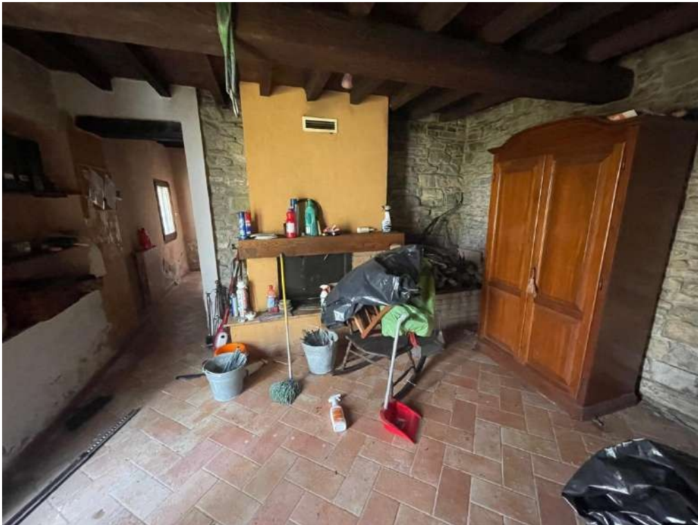
26- Piano Terra: Zona giorno