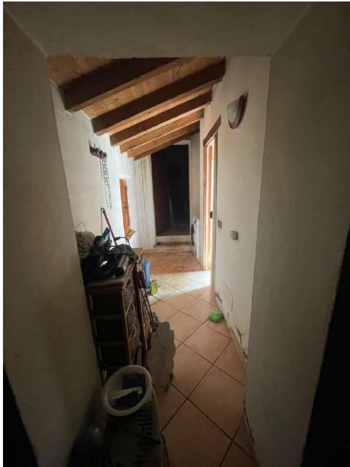
33- Piano Primo: Disimpegno