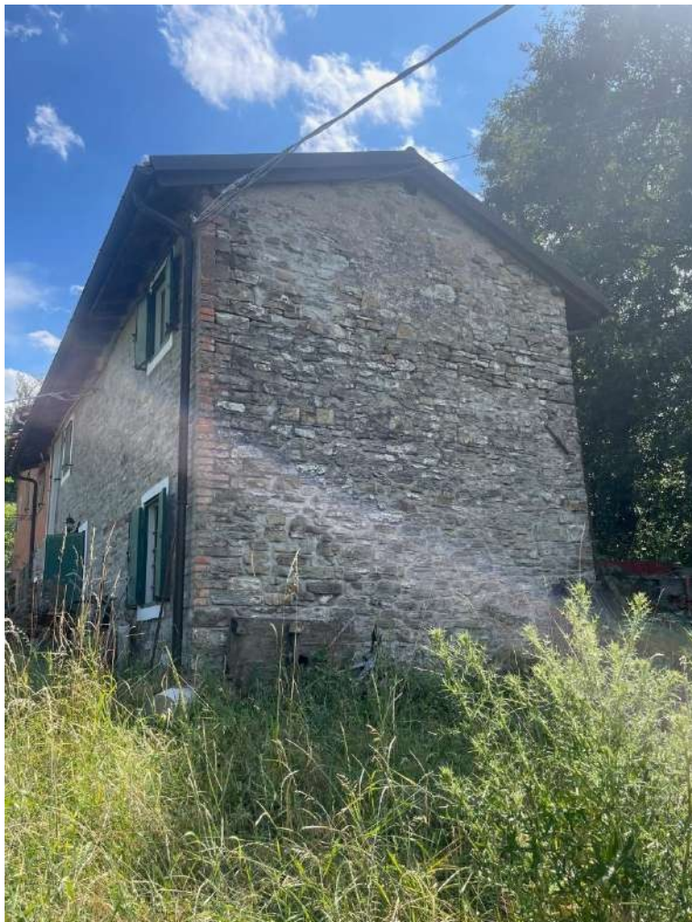
12- Vista esterna del fabbricato