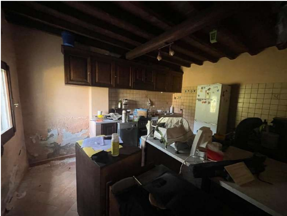
28- Piano Terra: Cucina