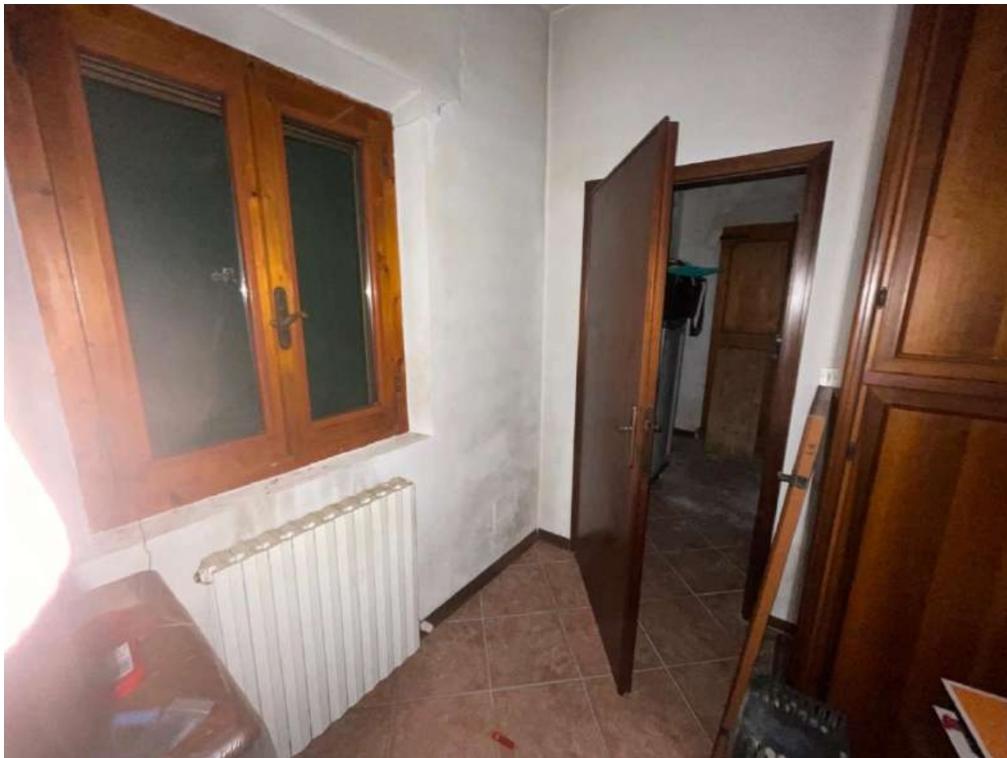
38- Piano Primo: Camera