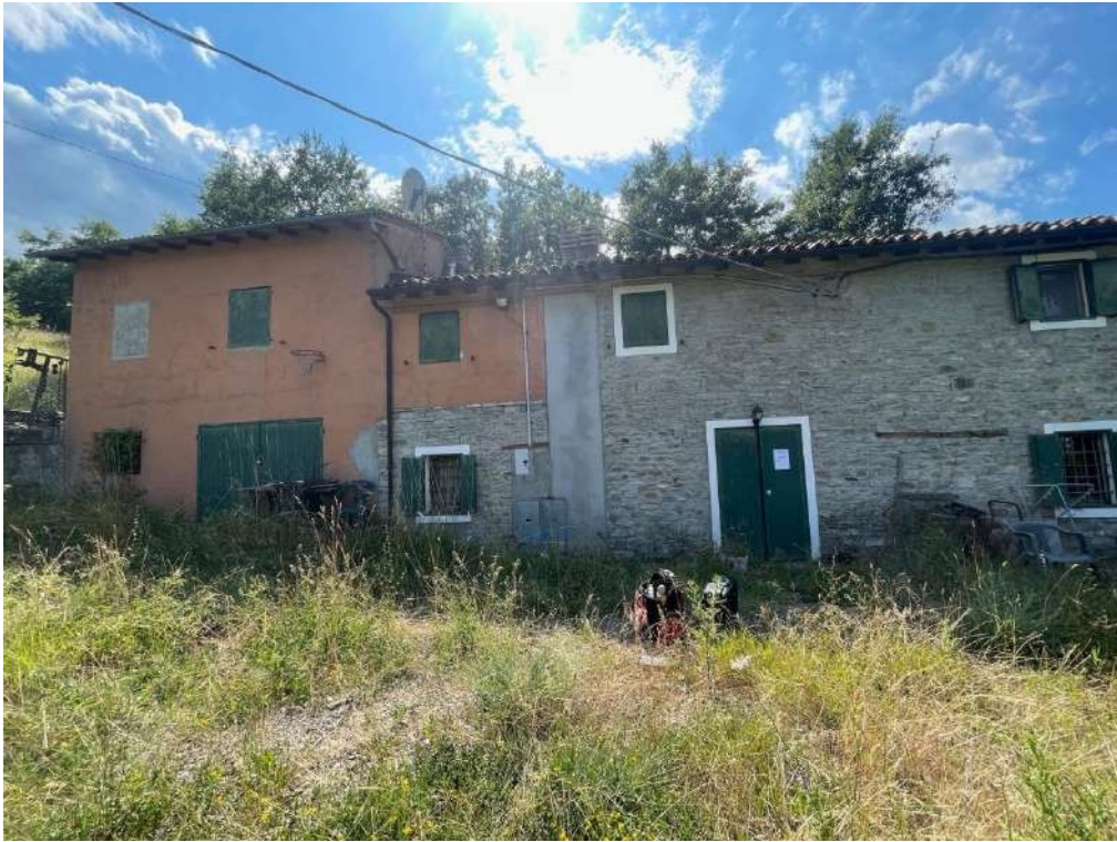
7- Vista esterna del fabbricato