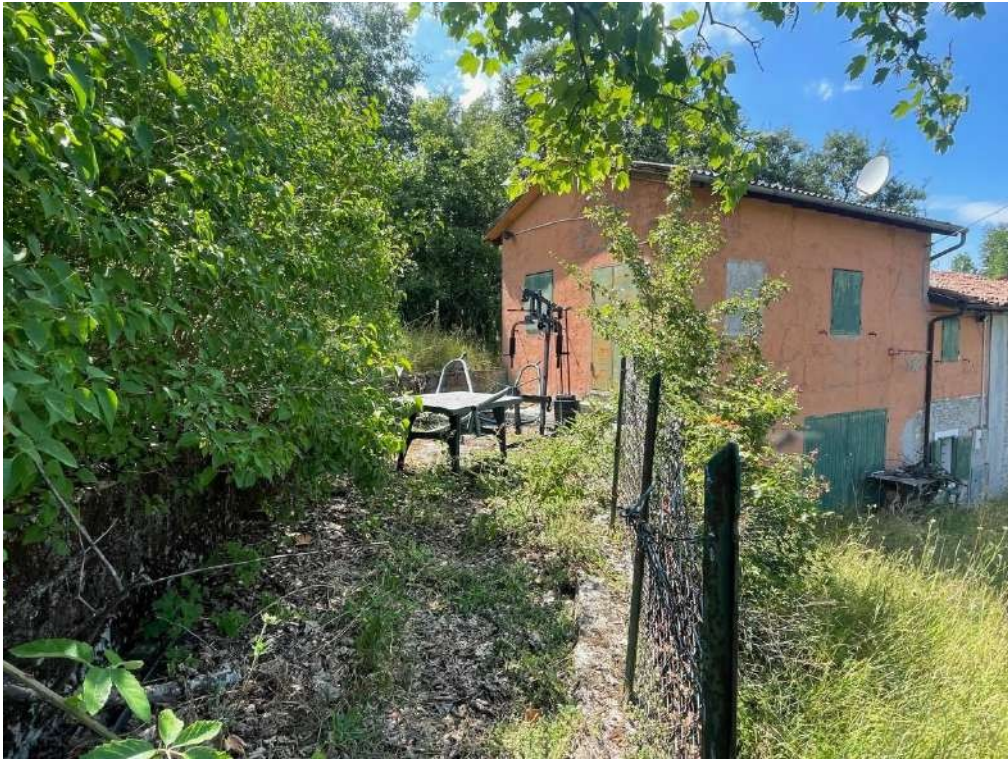
5- Vista esterna del fabbricato