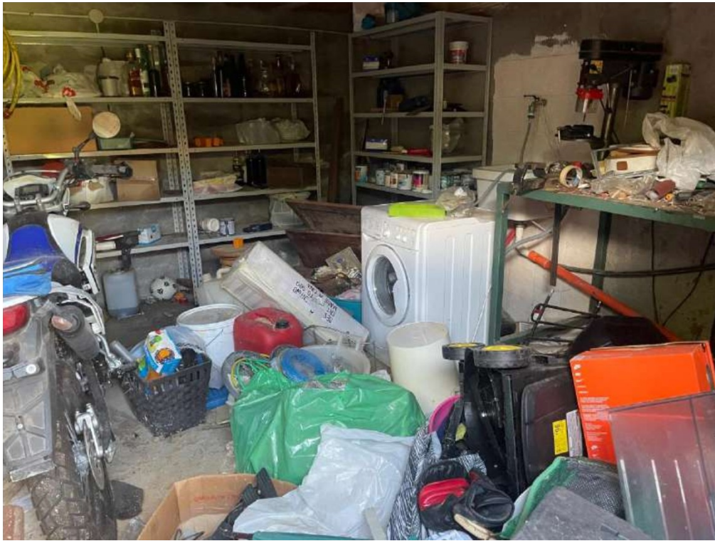
41- Piano Terra: Cantina (accesso esterno)