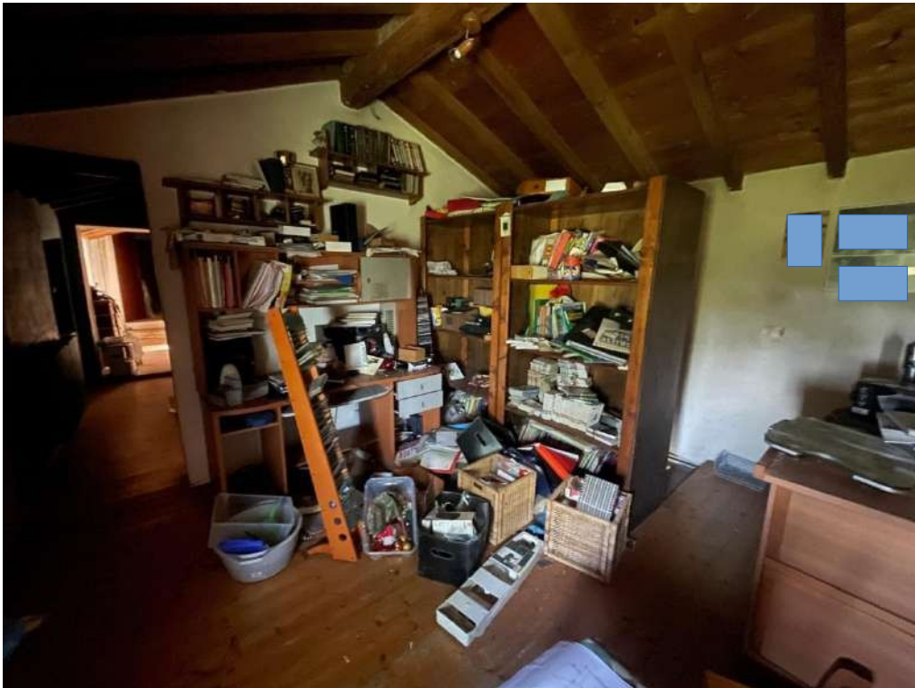
30- Piano Primo: Camera