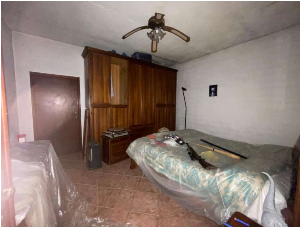
37- Piano Primo: Camera