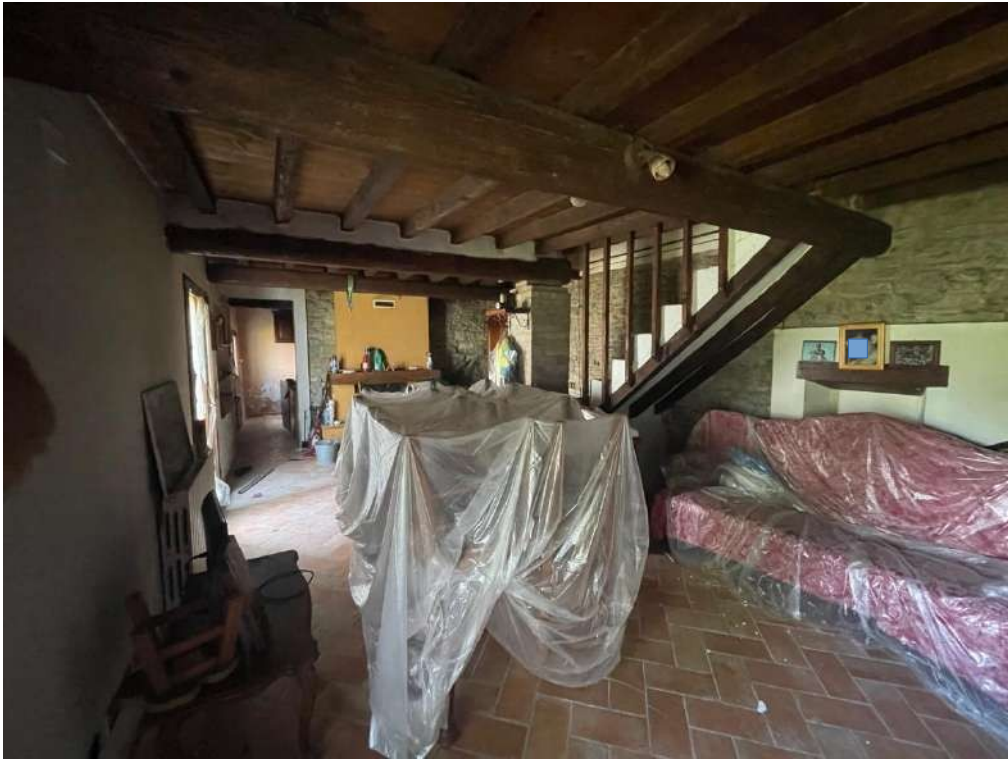
25- Piano Terra: Zona giorno