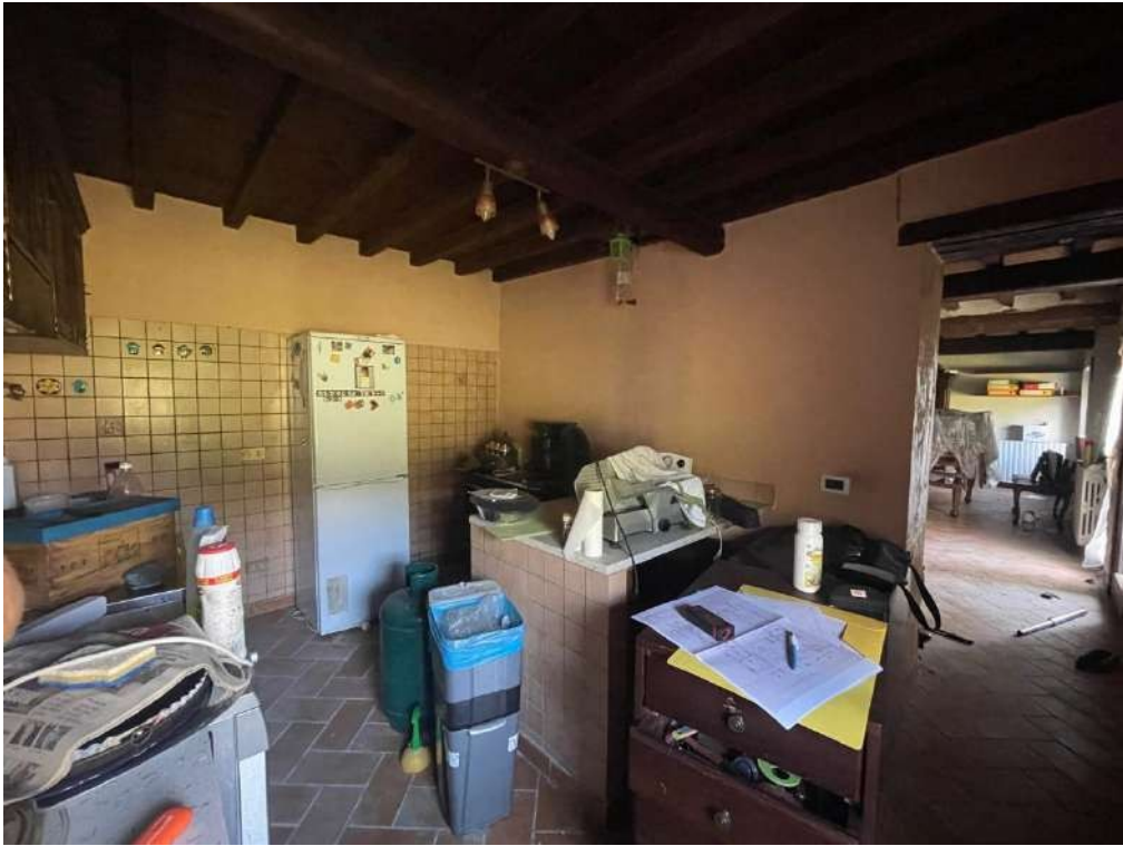
27- Piano Terra: Cucina