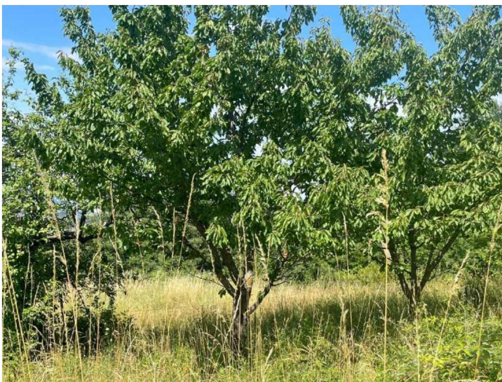
16- Vista esterna: area cortiliva