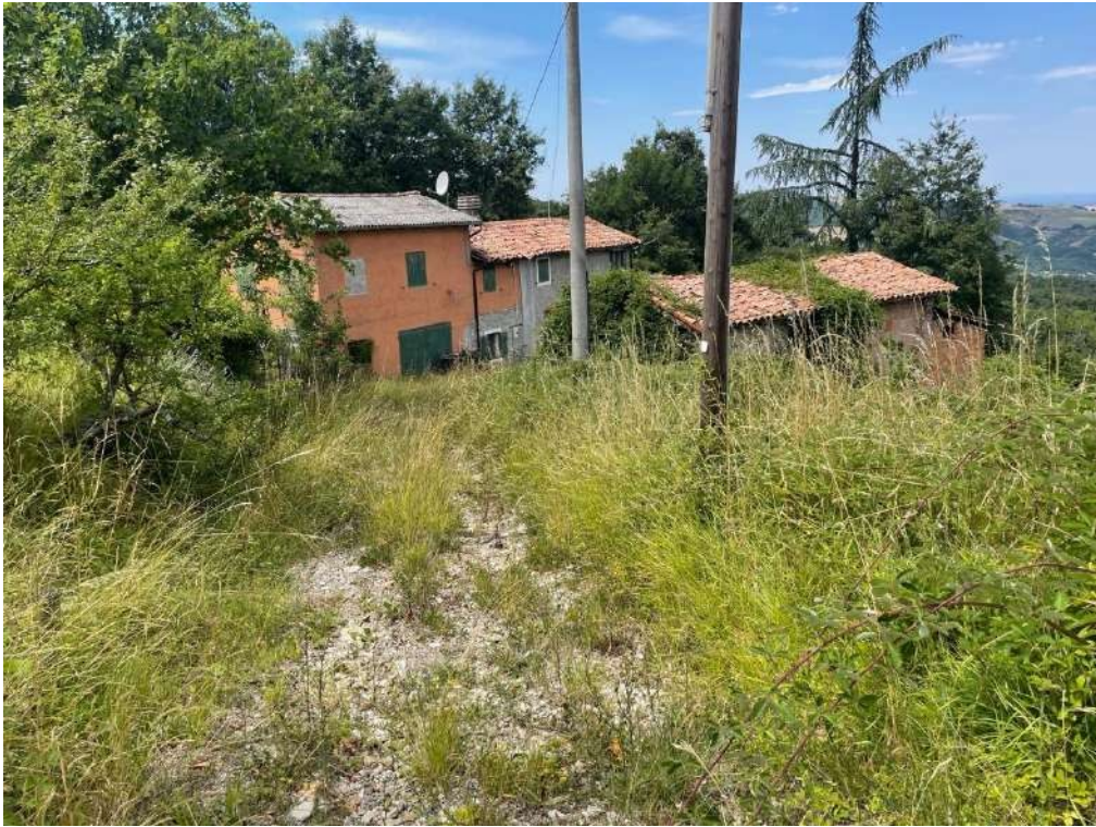
3- Vista esterna: strada di accesso alla proprietà