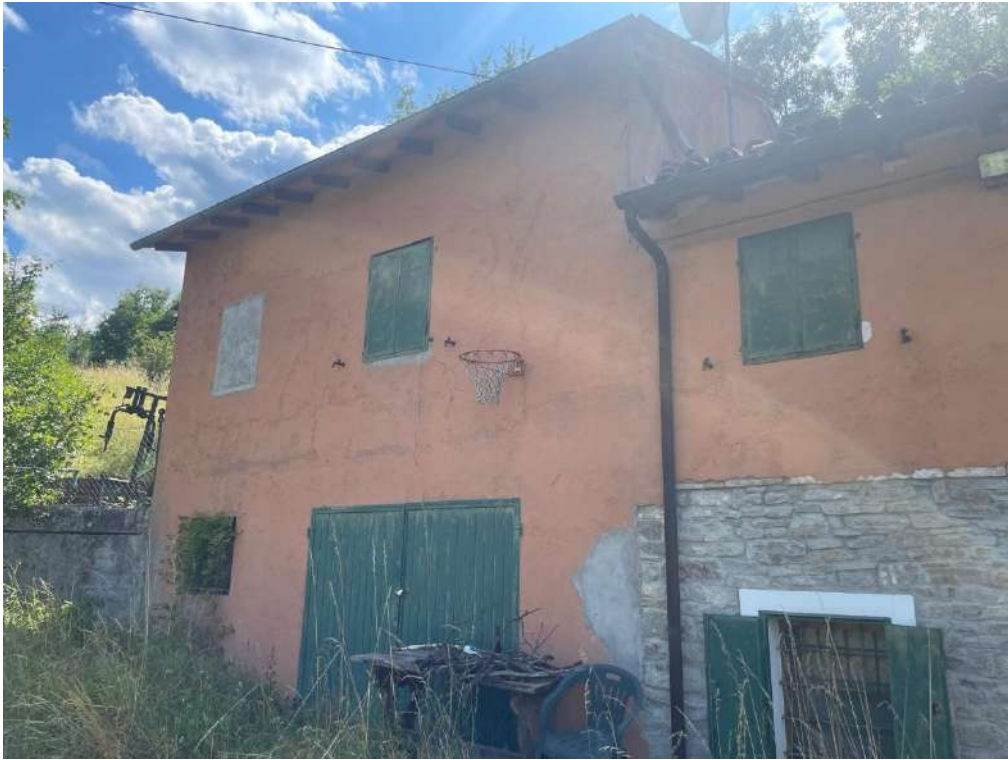
9- Vista esterna del fabbricato