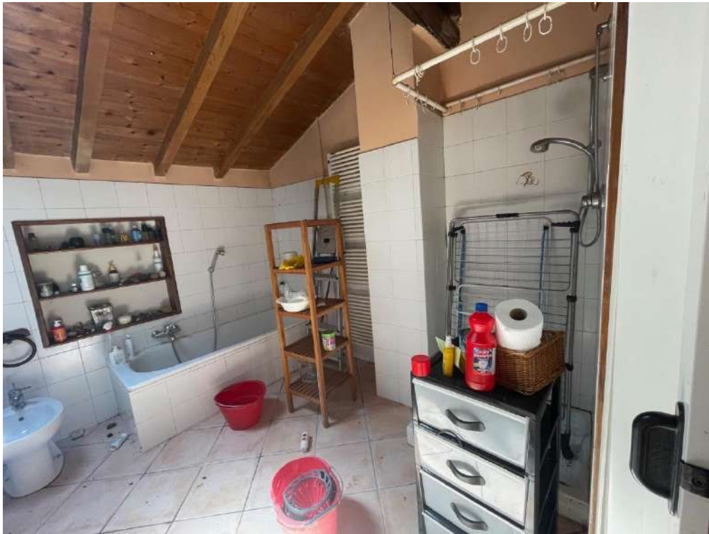
36- Piano Primo: Bagno