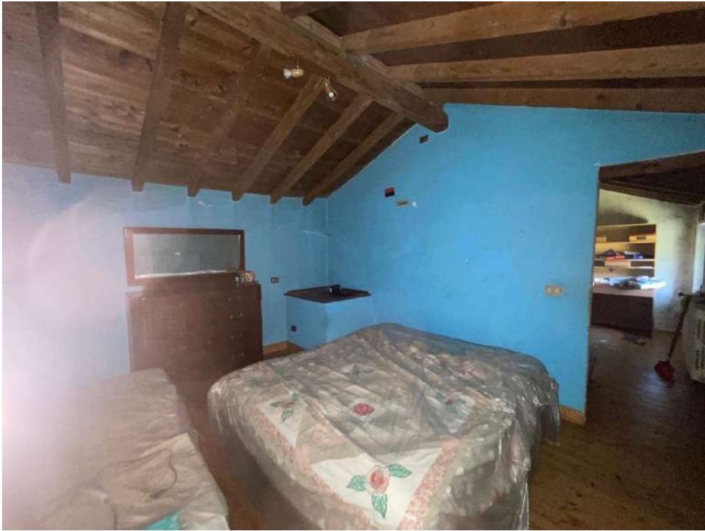
31- Piano Primo: Camera