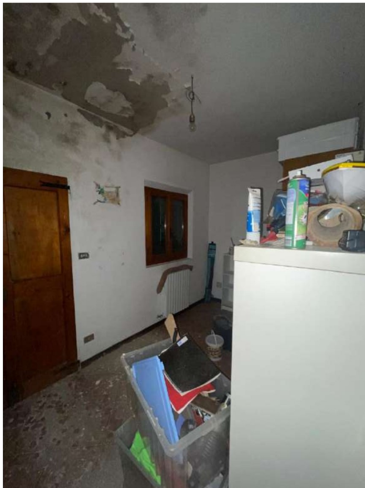
40- Piano Primo: Ingresso