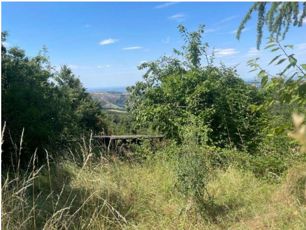
18- Vista esterna: area cortiliva