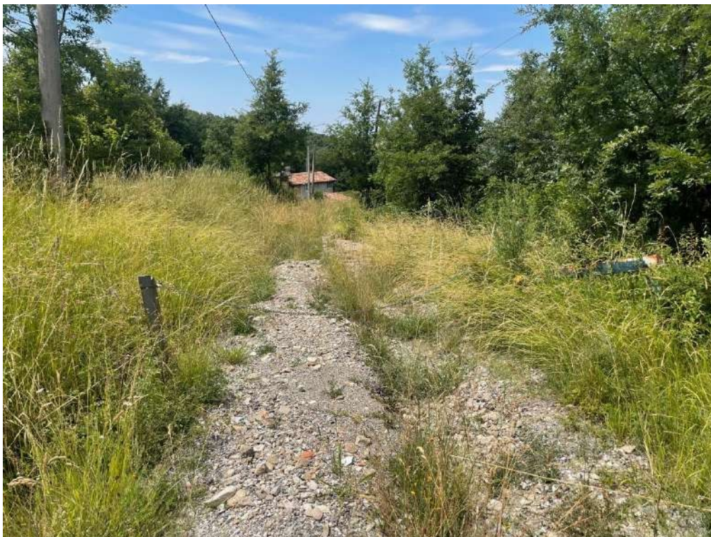
2- Vista esterna: strada di accesso alla proprietà