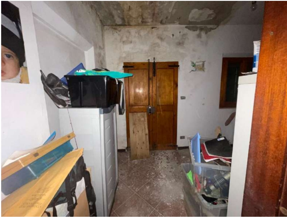
39- Piano Primo: Ingresso