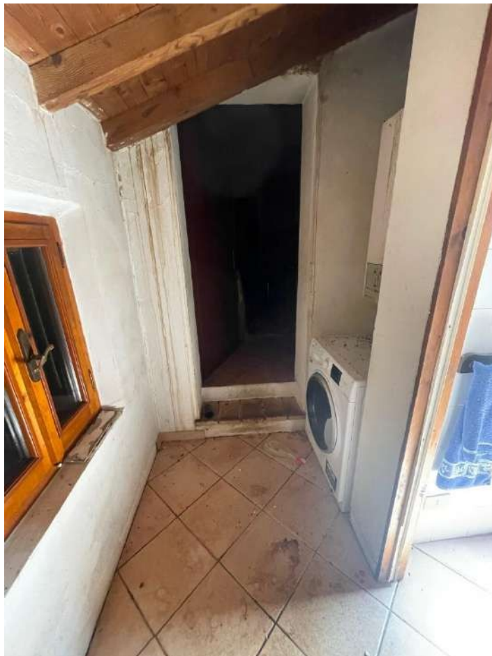
34- Piano Terra: Disimpegno