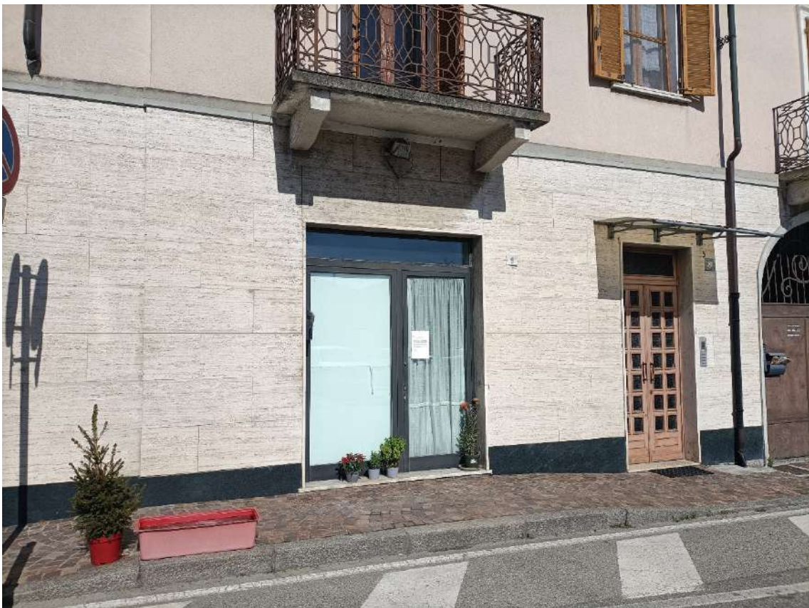
Prospetto est su Piazza Vittorio Veneto