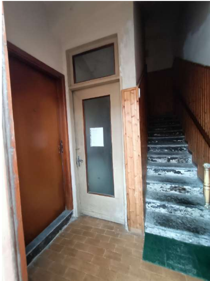
Ingresso su vano scala comune