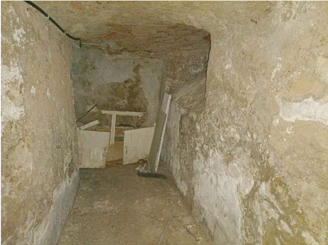
Disimpegno di ingresso