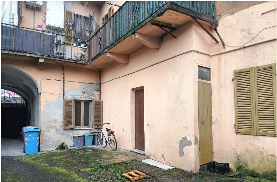
Prospetti nord e ovest su cortile comune