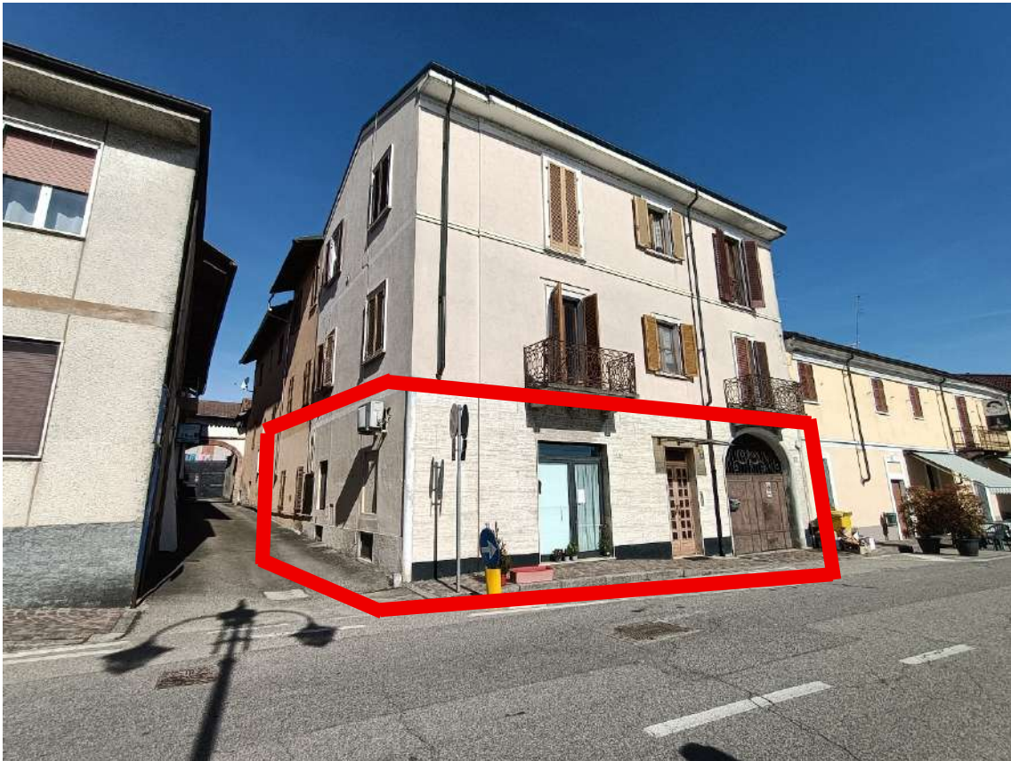
Unità immobiliare oggetto di perizia