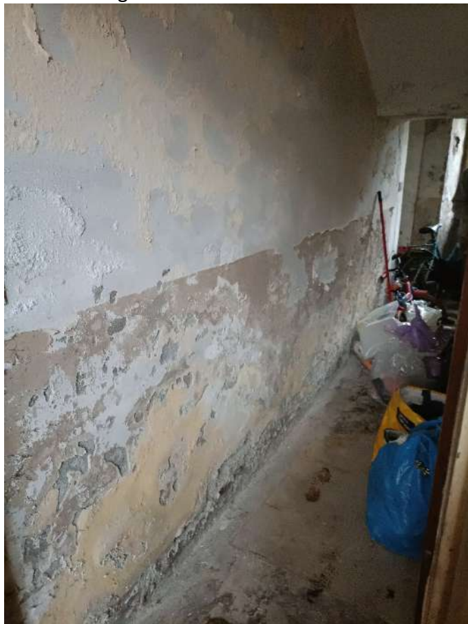
Accesso alla cantina da vano scala comune