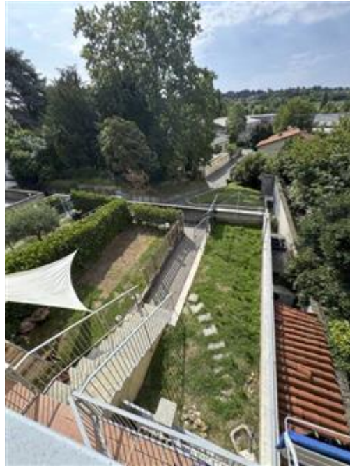
Appartamento al piano primo e secondo - Foglio MON/6, Particella 761 Sub. 702 (A/2) – Prospetto sud-est – Ingresso e giardino in proprietà