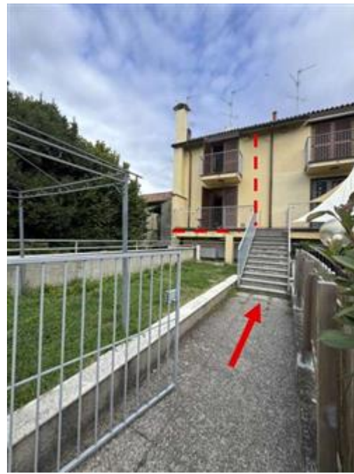
Appartamento al piano primo e secondo - Foglio MON/6, Particella 761 Sub. 702 (A/2) – Prospetto sud-est - Ingresso