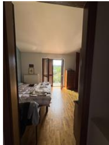
Appartamento - Foglio MON/6, Particella 761 Sub. 702 (A/2) – Piano secondo