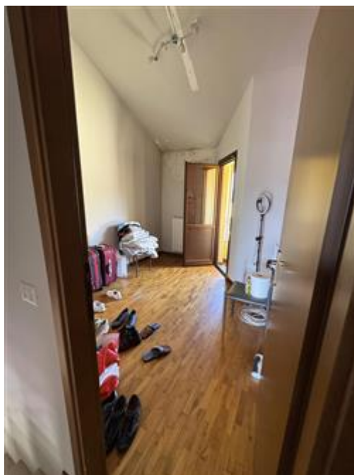
Appartamento - Foglio MON/6, Particella 761 Sub. 702 (A/2) Appartamento - Foglio MON/6, Particella 761 Sub. 702 (A/2) - Piano secondo - Piano secondo