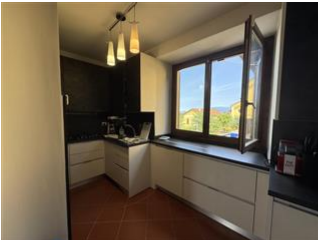
Appartamento - Foglio MON/6, Particella 761 Sub. 702 (A/2) – Piano primo