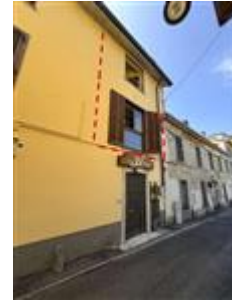
Appartamento al piano primo e secondo - Foglio MON/6, Particella 761 Sub. 702 (A/2) – Prospetto nord-ovest su via San Michele