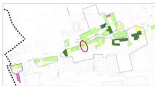
Estratto PGT (Piano di Governo del Territorio) del Comune di MONTICELLO BRIANZA - Piano delle Regole: AMBITI DEL SISTEMA URBANIZZATO ED EDIFICATO COMUNALE – NUCLEI DI ANTICA FORMAZIONE