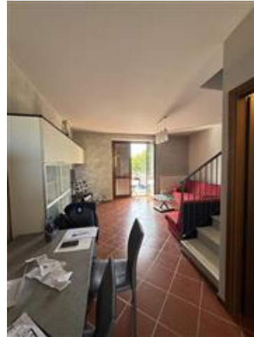
Appartamento - Foglio MON/6, Particella 761 Sub. 702 (A/2) – Piano primo