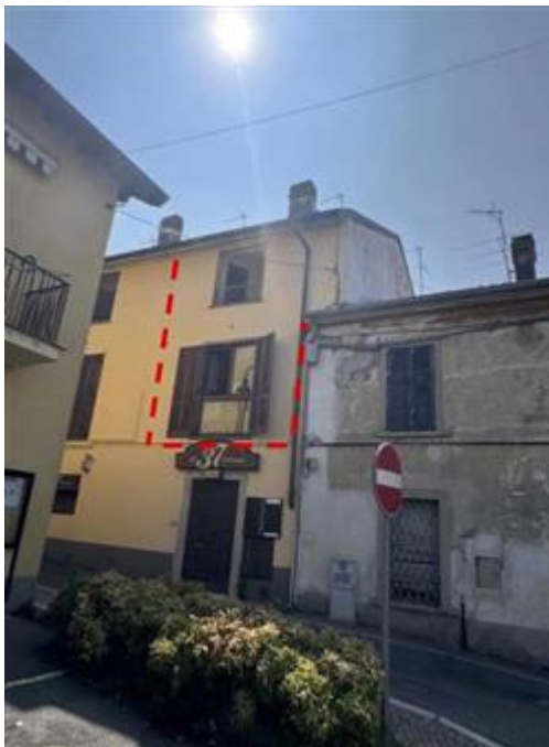
Appartamento al piano primo e secondo - Foglio MON/6, Particella 761 Sub. 702 (A/2) – Prospetto nord-ovest su via San Michele