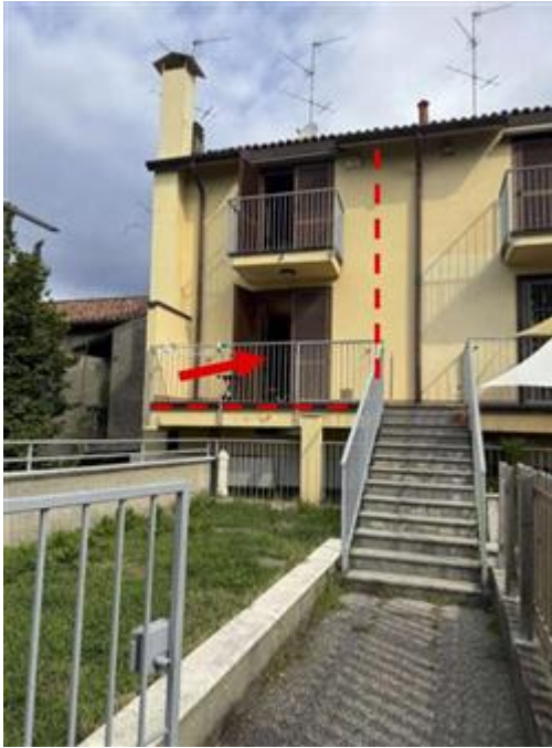
Appartamento al piano primo e secondo - Foglio MON/6, Particella 761 Sub. 702 (A/2) – Prospetto sud-est - Ingresso