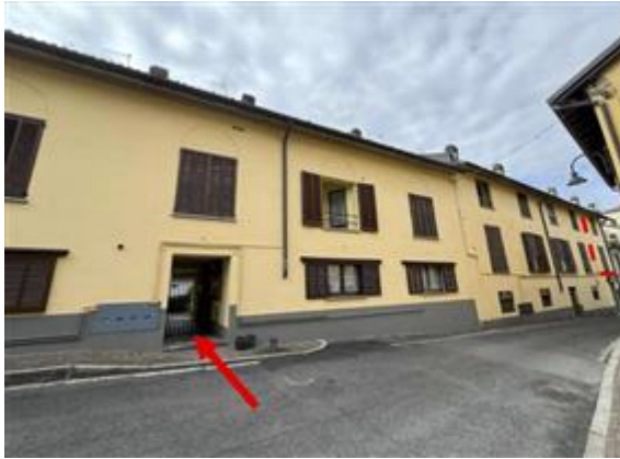
Immobile sito a MONTICELLO BRIANZA (Lecco) in via San Michele n. 35