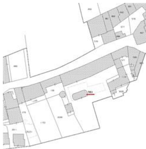
ESTRATTO MAPPA Comune di MONTICELLO BRIANZA Foglio 1, Particella 761