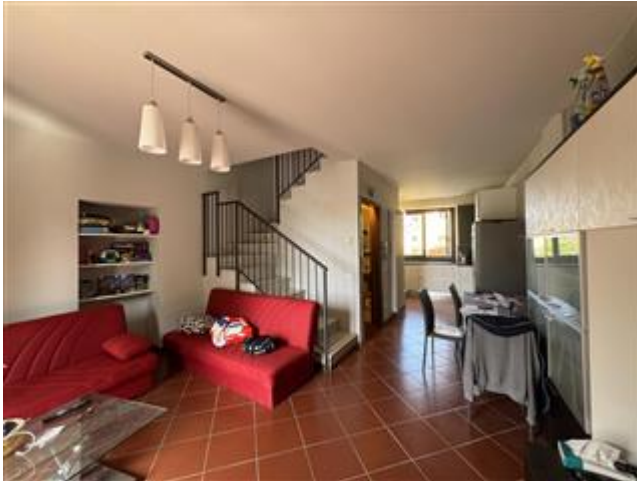
Appartamento - Foglio MON/6, Particella 761 Sub. 702 (A/2) – Piano primo