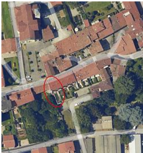
Immagine satellitare dell'immobile sito a MONTICELLO BRIANZA (Lecco) in via San Michele n. 35

I beni sono ubicati in zona semicentrale in un'area residenziale, le zone limitrofe si trovano in un'area mista (i più importanti centri limitrofi sono Monza e Lecco). Il traffico nella zona è locale, i parcheggi sono sufficienti. Sono inoltre presenti i servizi di urbanizzazione primaria e secondaria, le seguenti attrazioni storico paesaggistiche: Lecco e Lago di Como.