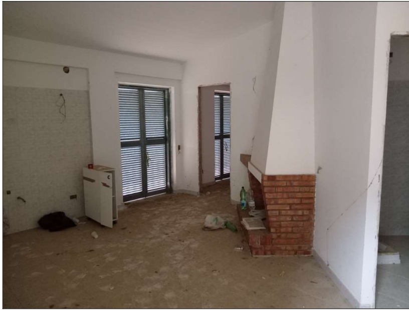
CUCINA – SOGGIORNO