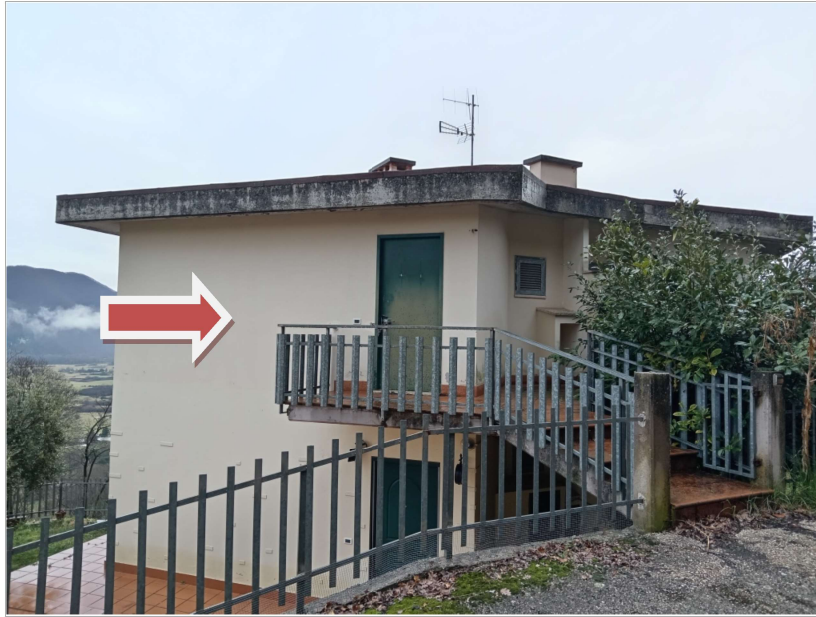
VISTA GENERALE PROSPETTO LATO NORD-EST (zona accesso)