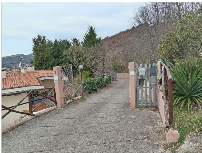
ACCESSO AL COMPLESSO DA VIA DEGLI OLEANDRI