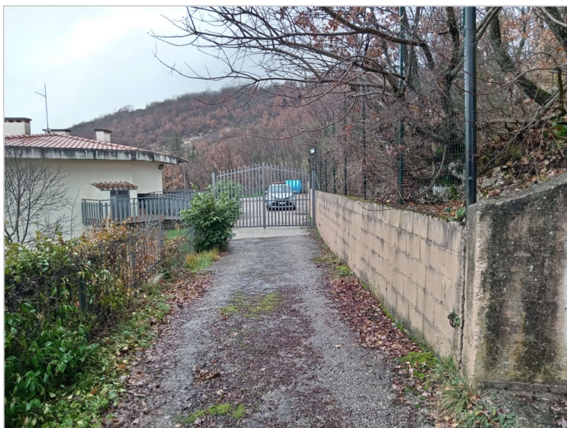
CORTE COMUNE SUB 24 (fruibilità limitata da cancello)