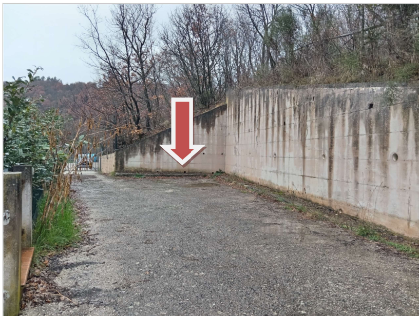
CORTE COMUNE SUB 16