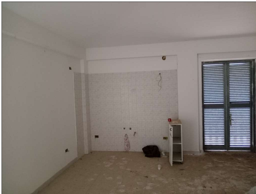
CUCINA – SOGGIORNO