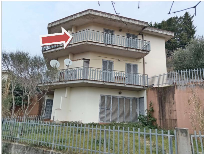
VISTA GENERALE PROSPETTO LATO SUD-EST