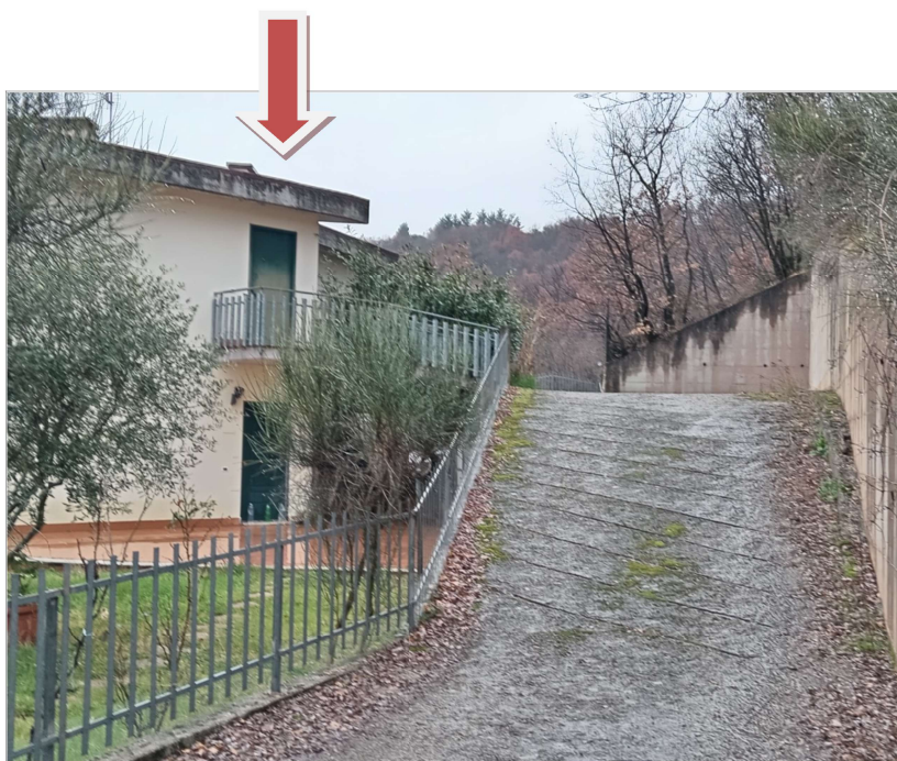
VISTA GENERALE ACCESSO DALLA CORTE COMUNE SUB 24