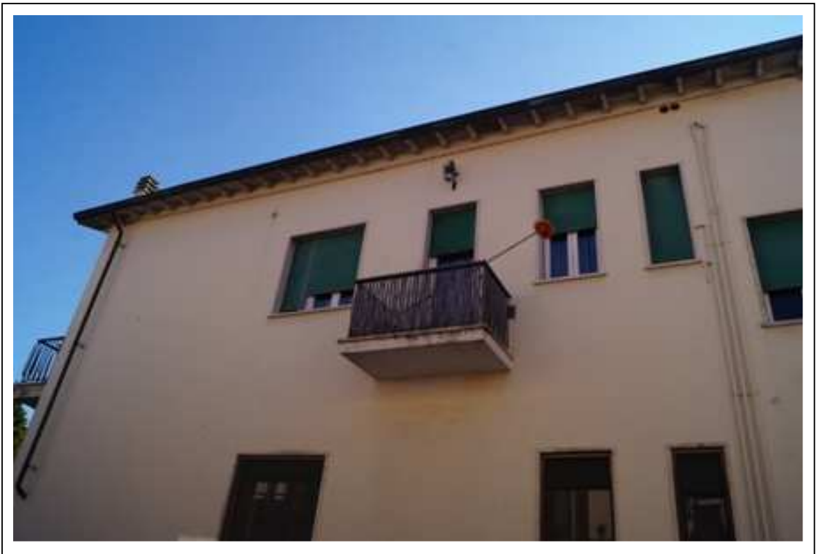
Foto prospetto ovest