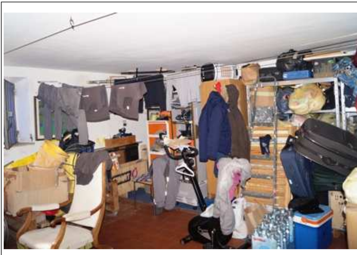
vano cantina (piano seminterrato)