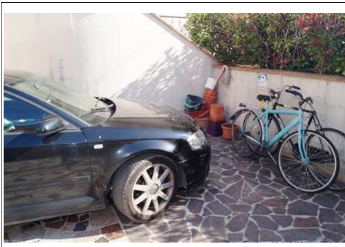
posto auto (mapp. 1150 sub 1) piano terra