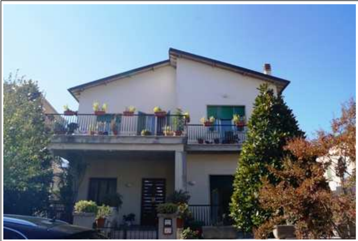
Foto prospetto nord