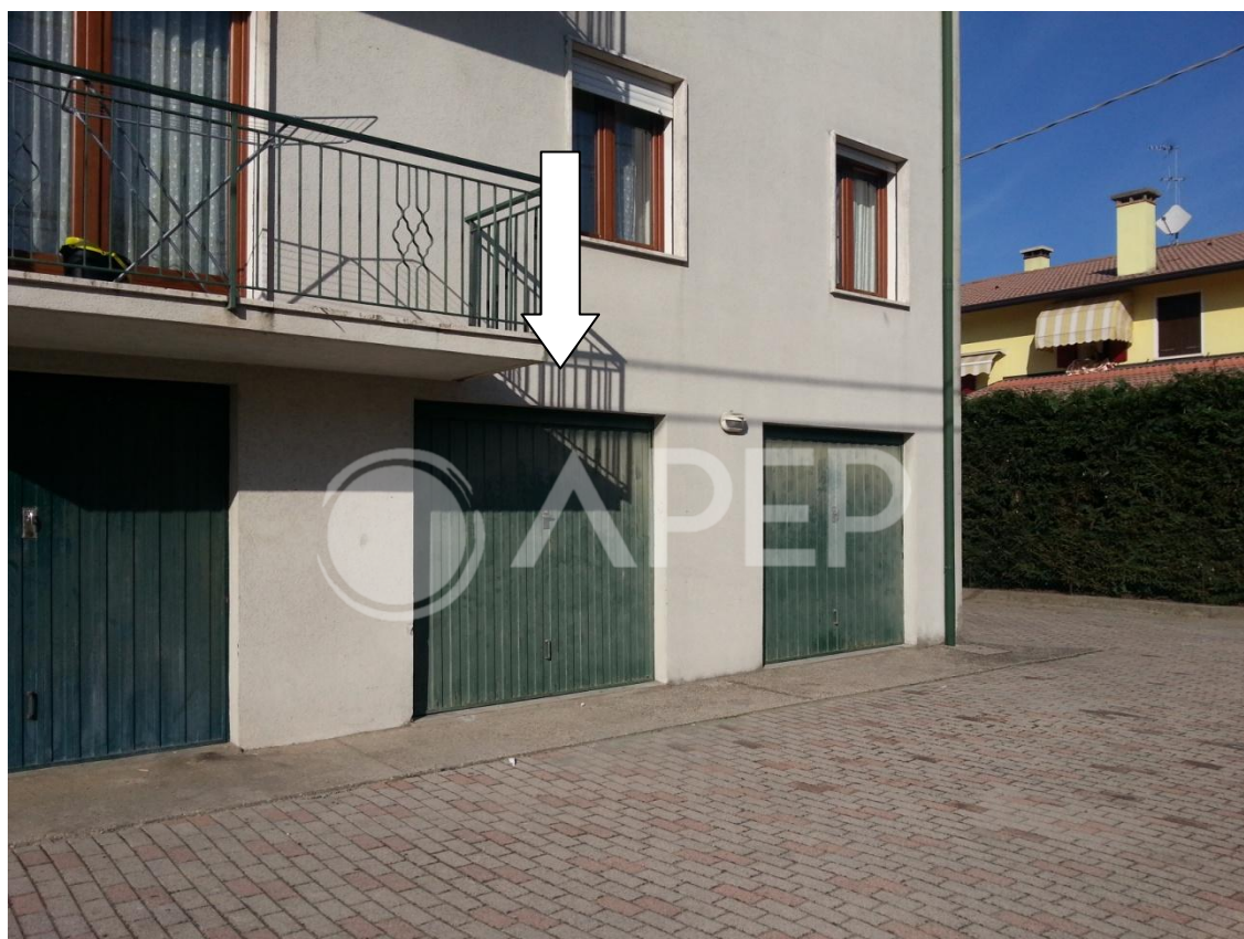
FOTO N .4 - GARAGE