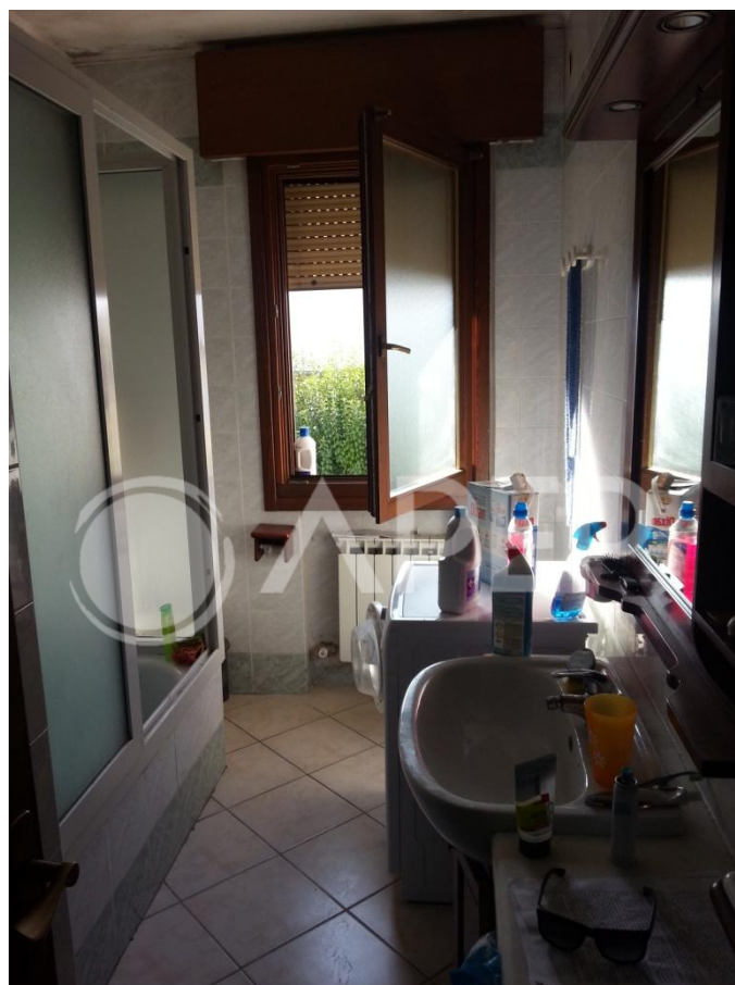
FOTO N. 10 - BAGNO