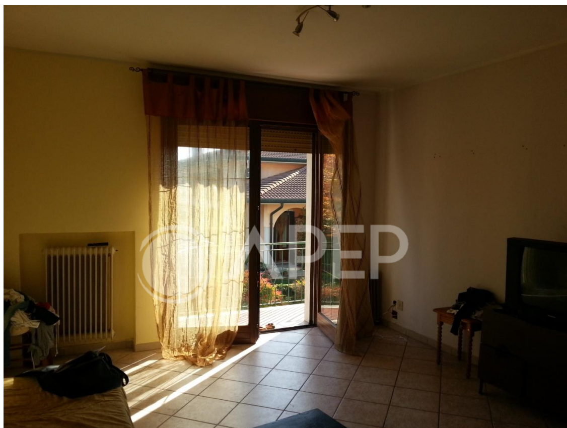
FOTO N . 7 - SOGGIORNO