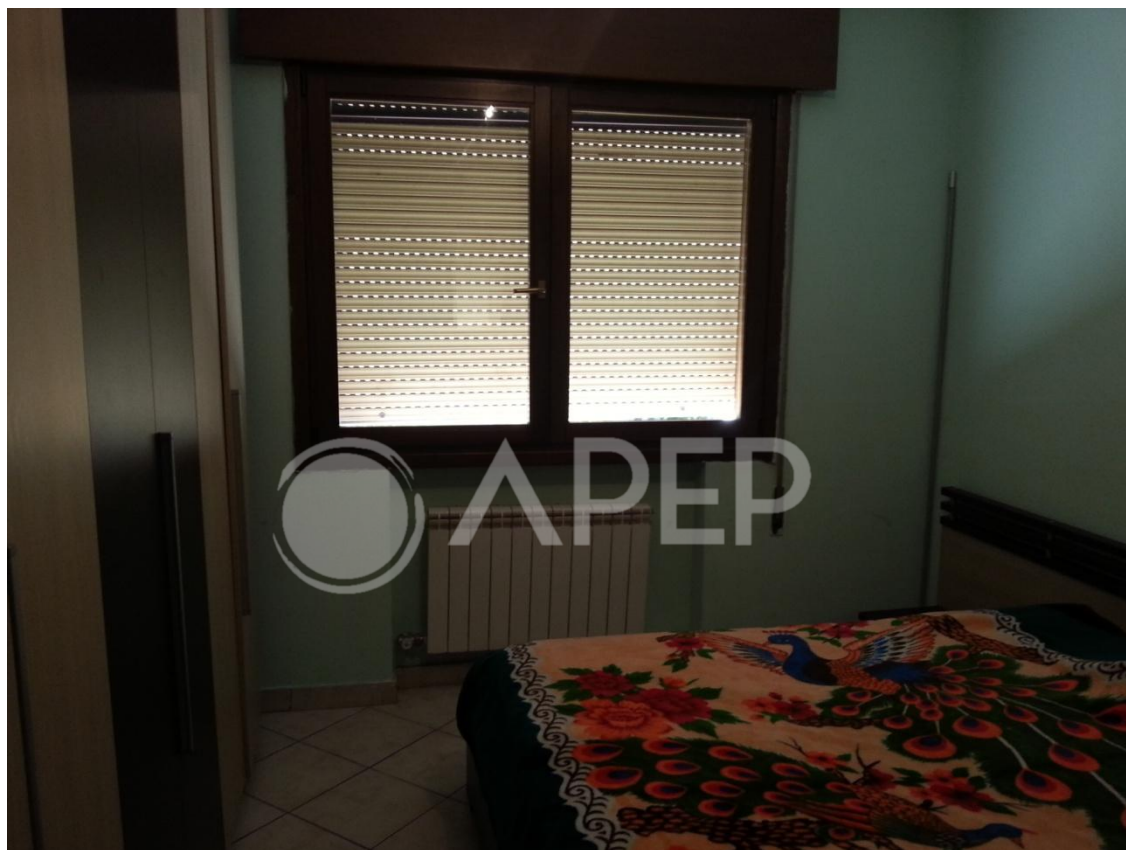
FOTO N. 11 - CAMERA 1