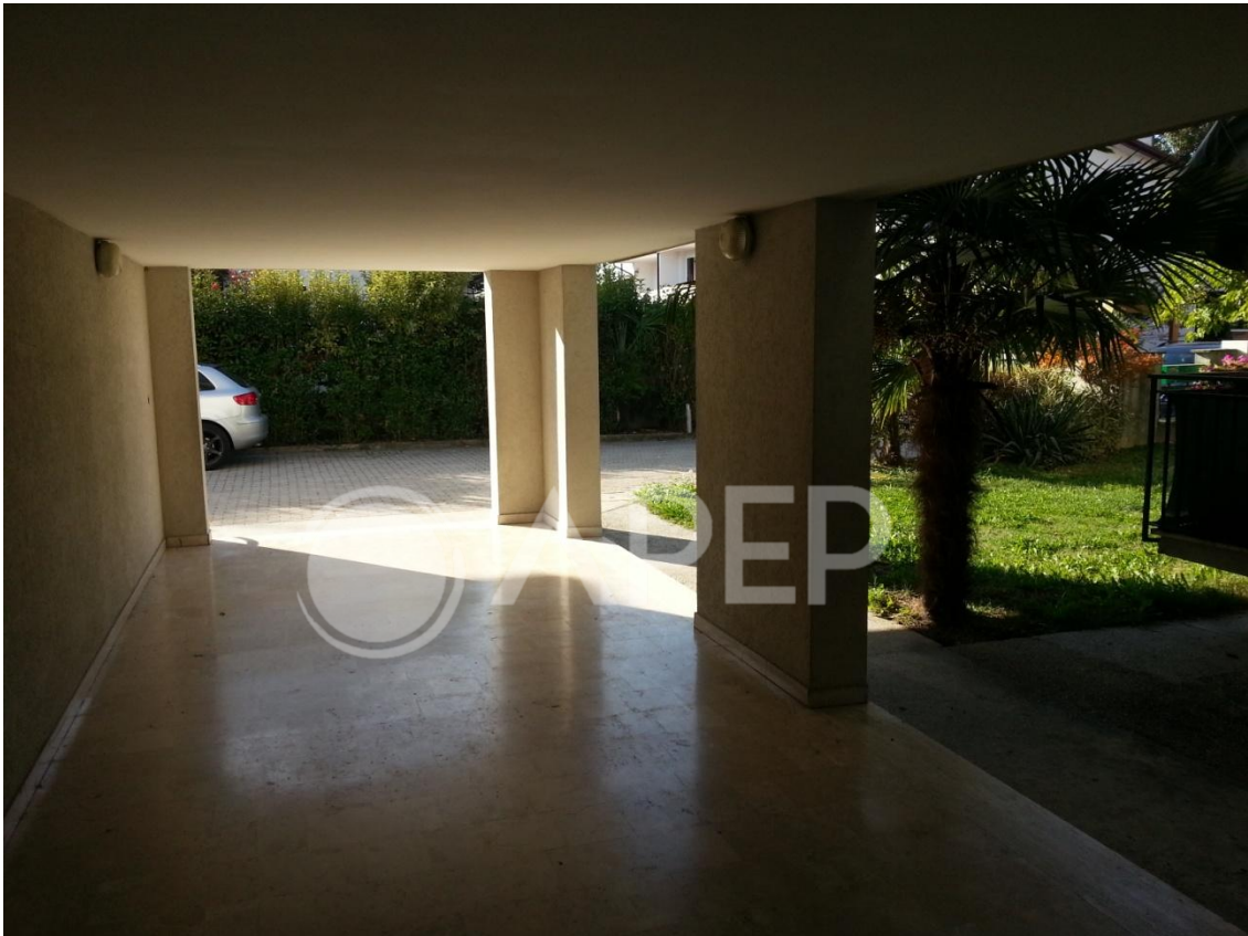
FOTO N .5 PORTICO - INGRESSO