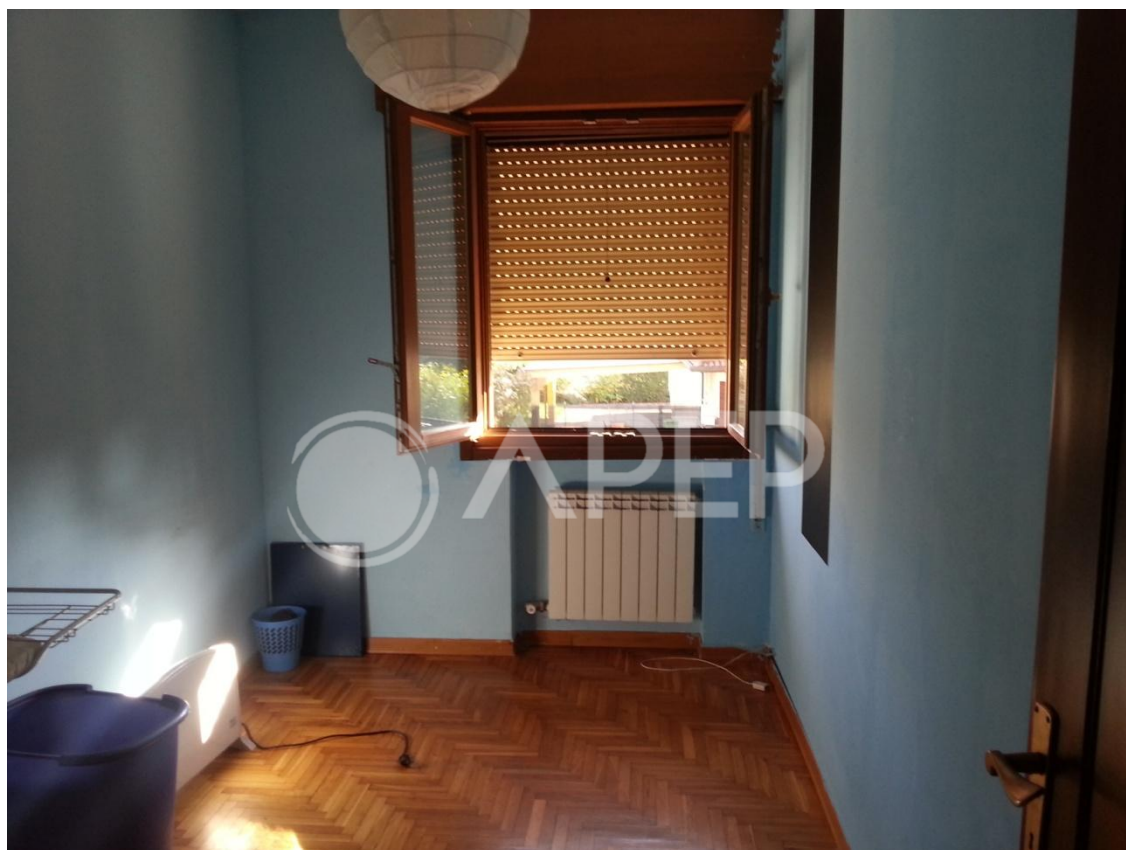
FOTO N. 12 - CAMERA 2