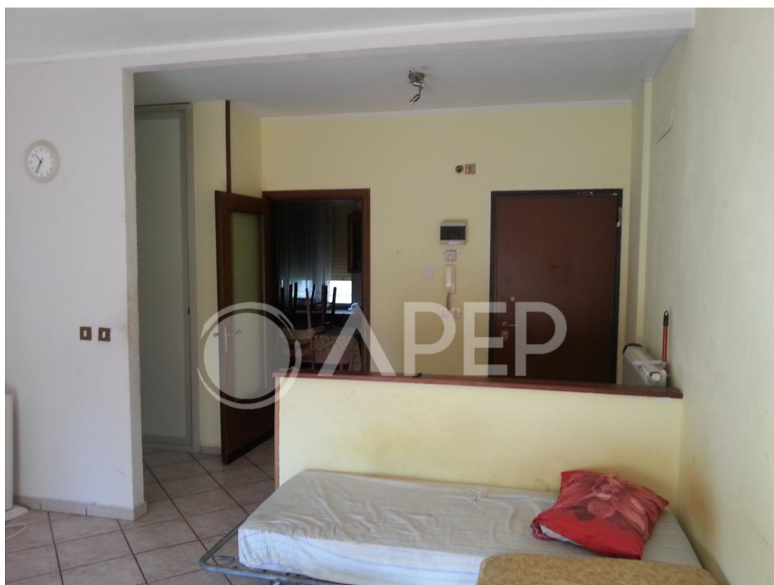
FOTO N . 8 - INGRESSO - SOGGIORNO VERSO CUCINA