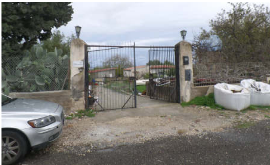
Foto n° 02. Melilli. C.da San Giuliano-Petrara: Ingresso al Lotto