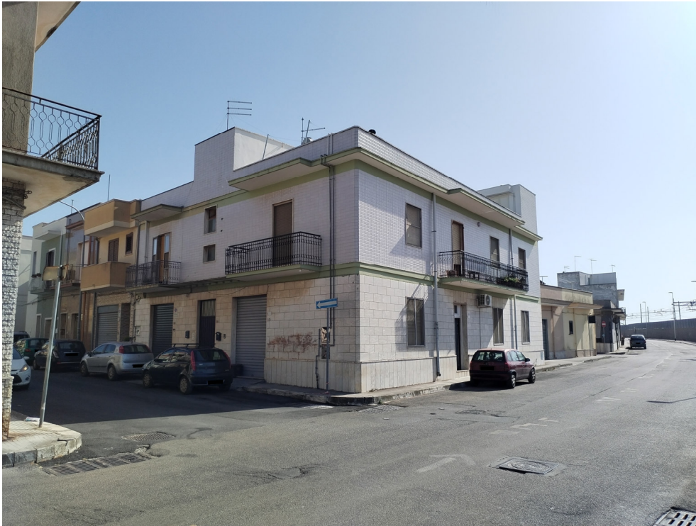
Foto n.4 – “vista esterna dell’abitazione a piano terra da viale Martin Luter King”