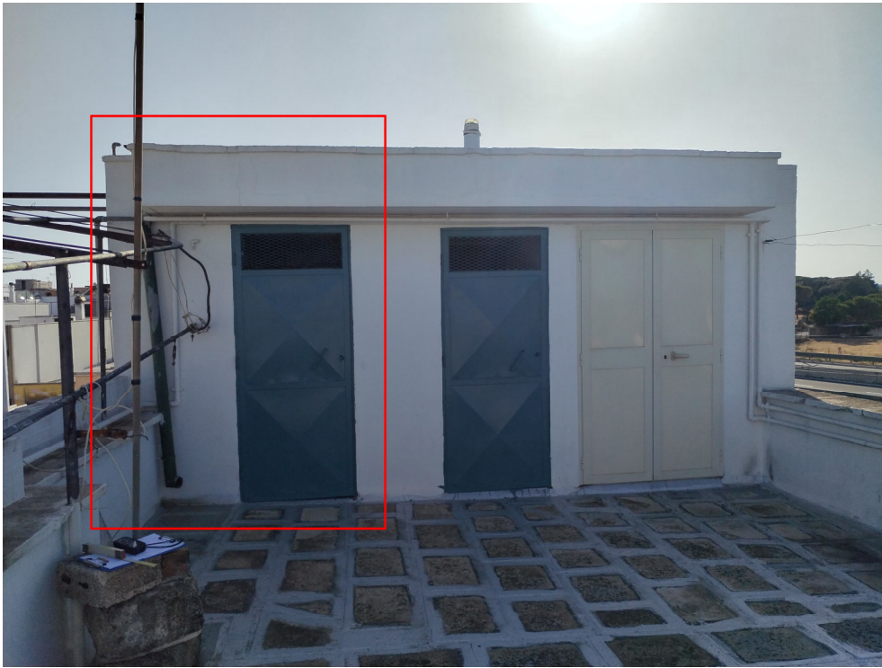
Foto n.28 – “vista interna del vano tecnico sul lastrico solare comune”