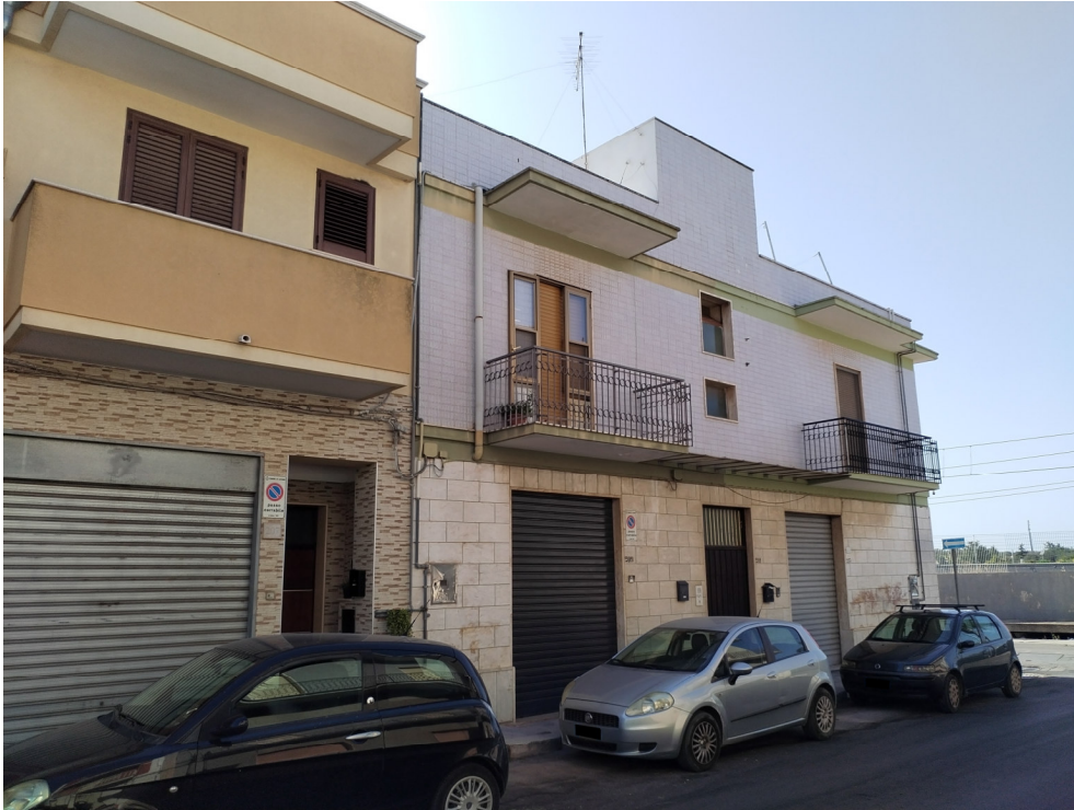
Foto n.2 – “vista esterna dell’abitazione con garage a piano terra da via M. Armando Diaz”