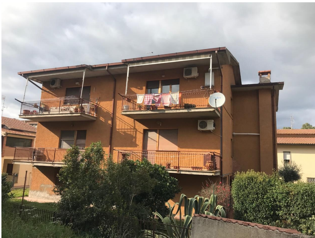
Vista esterna terrazza soggiorno