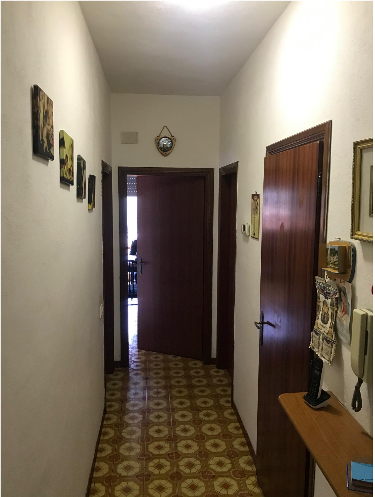
Disimpegno zona giorno