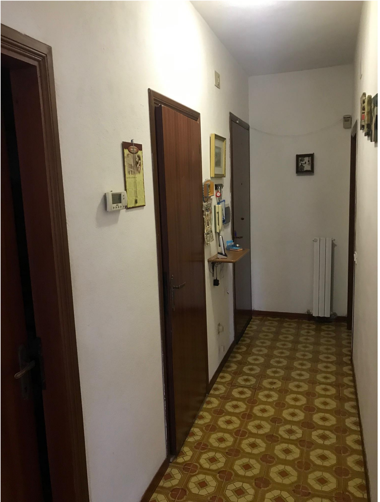
Vista disimpegno lato ripostiglio – wc – ingresso