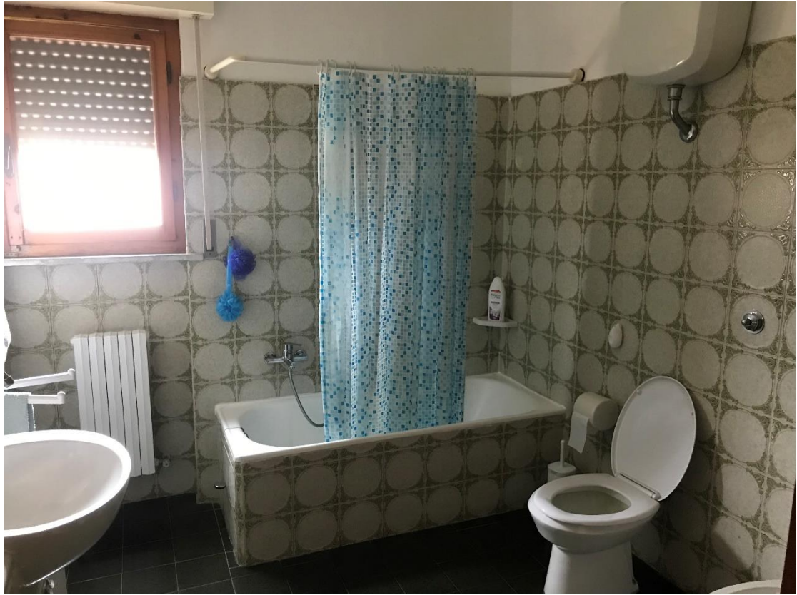
Bno con finestra