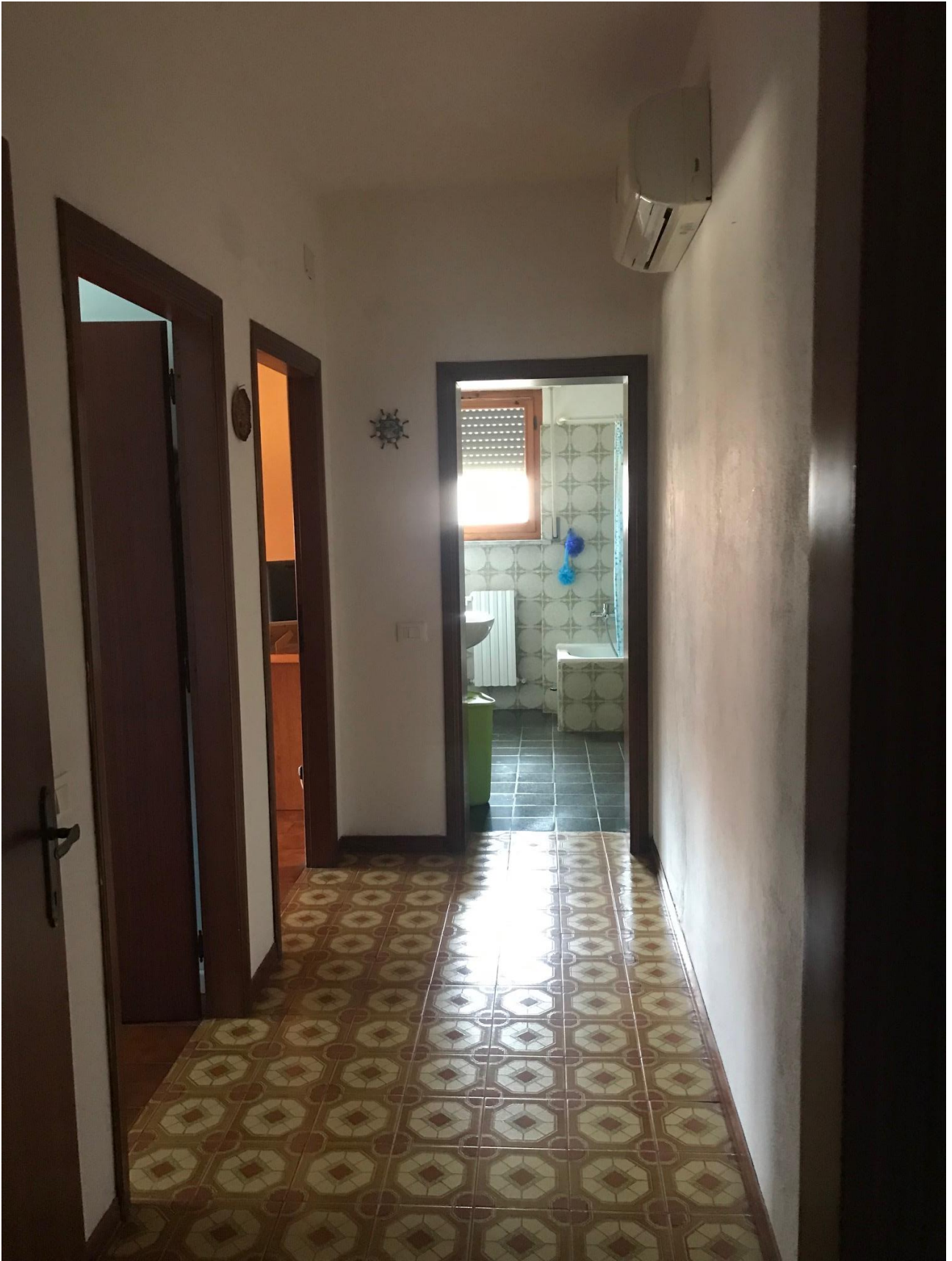
Disimpegno zona giorno