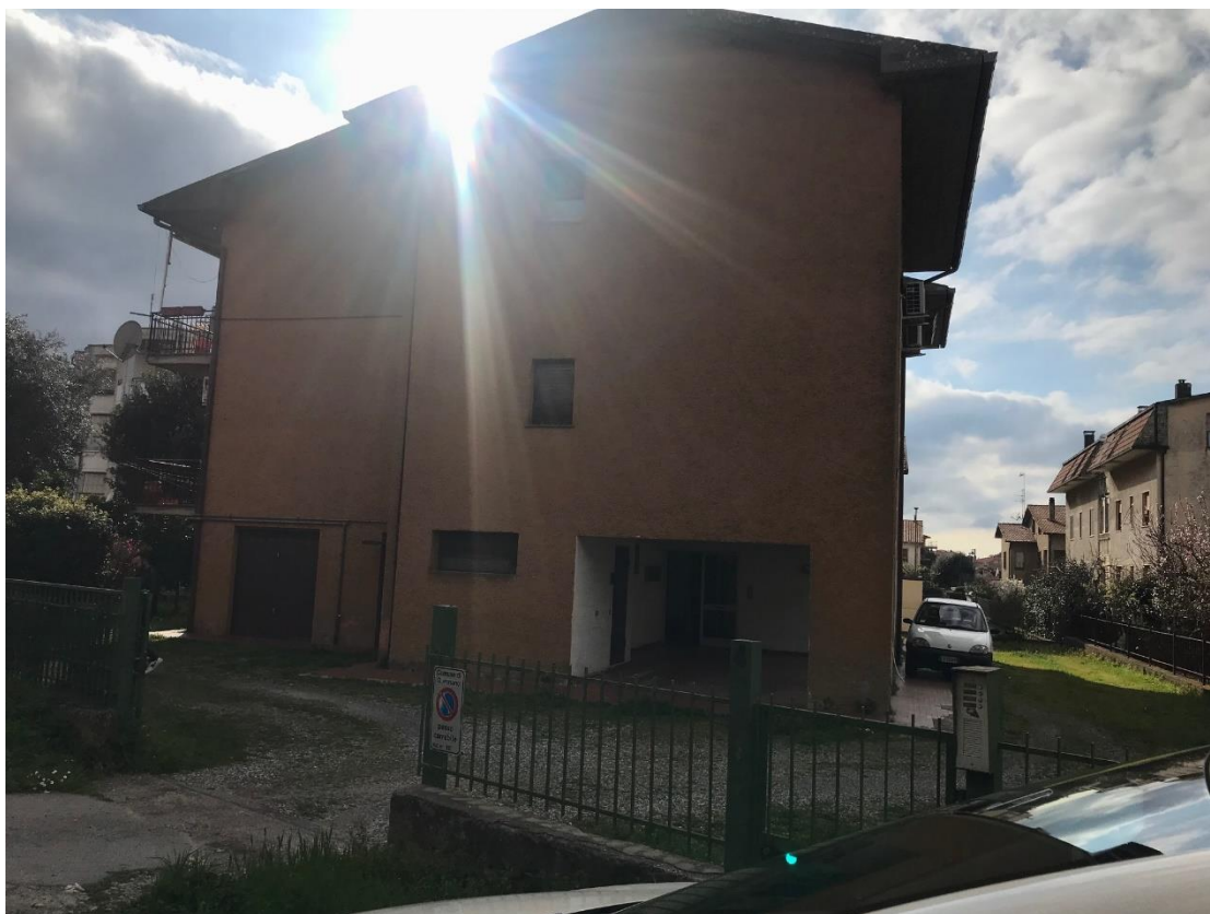
Vista esterna complessiva lato ingresso