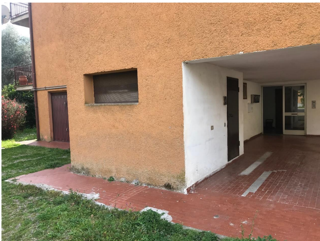
Vista ingresso e vano tecnico condominiale