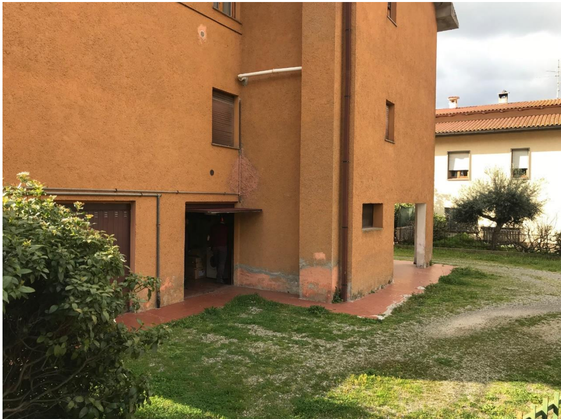
Vista ingresso garage e portico