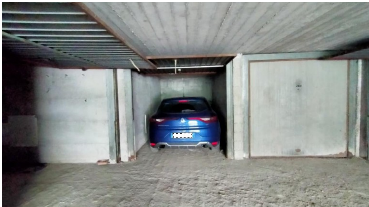
Posto auto P. terra Sub 50