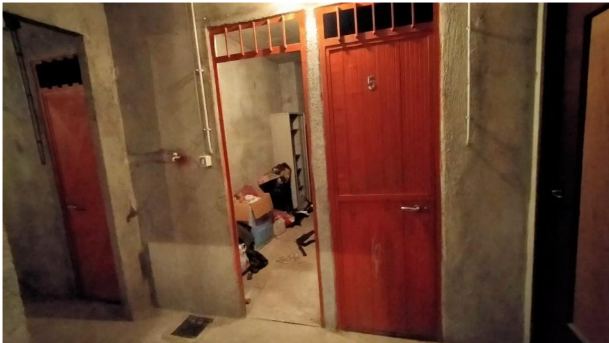
Box auto P. interrato Sub 31