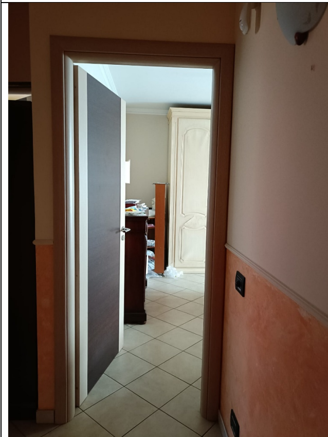
Foto 14 porta d'accesso camera padronale angolo Sud Est