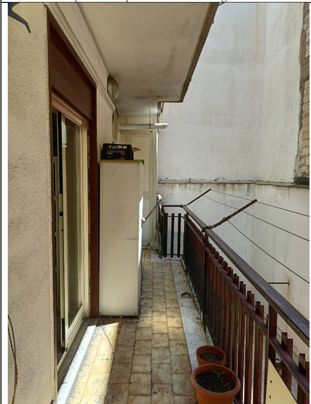
Foto 20_balcone lato Sud _ vista a Est