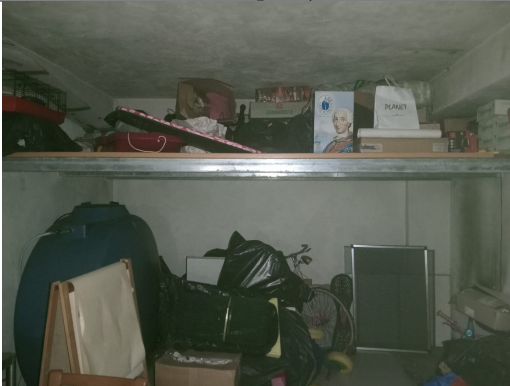
Foto 36 interno garage