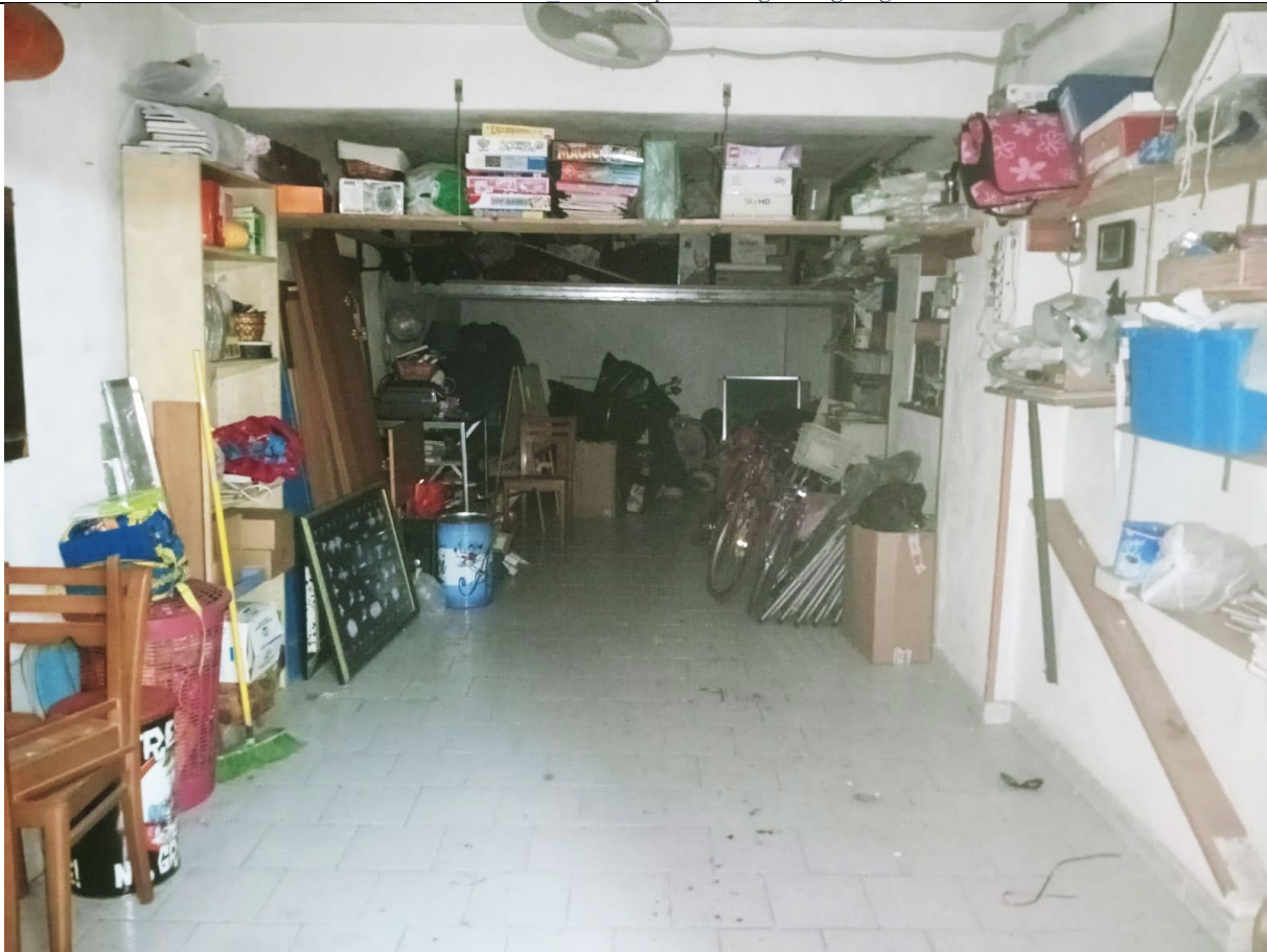
Foto 32 interno garage