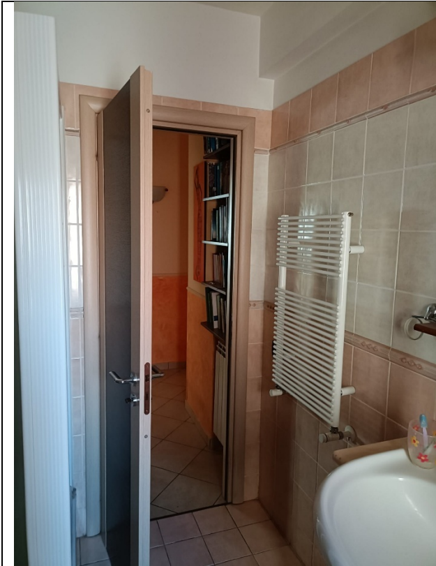
Foto 30 bagno