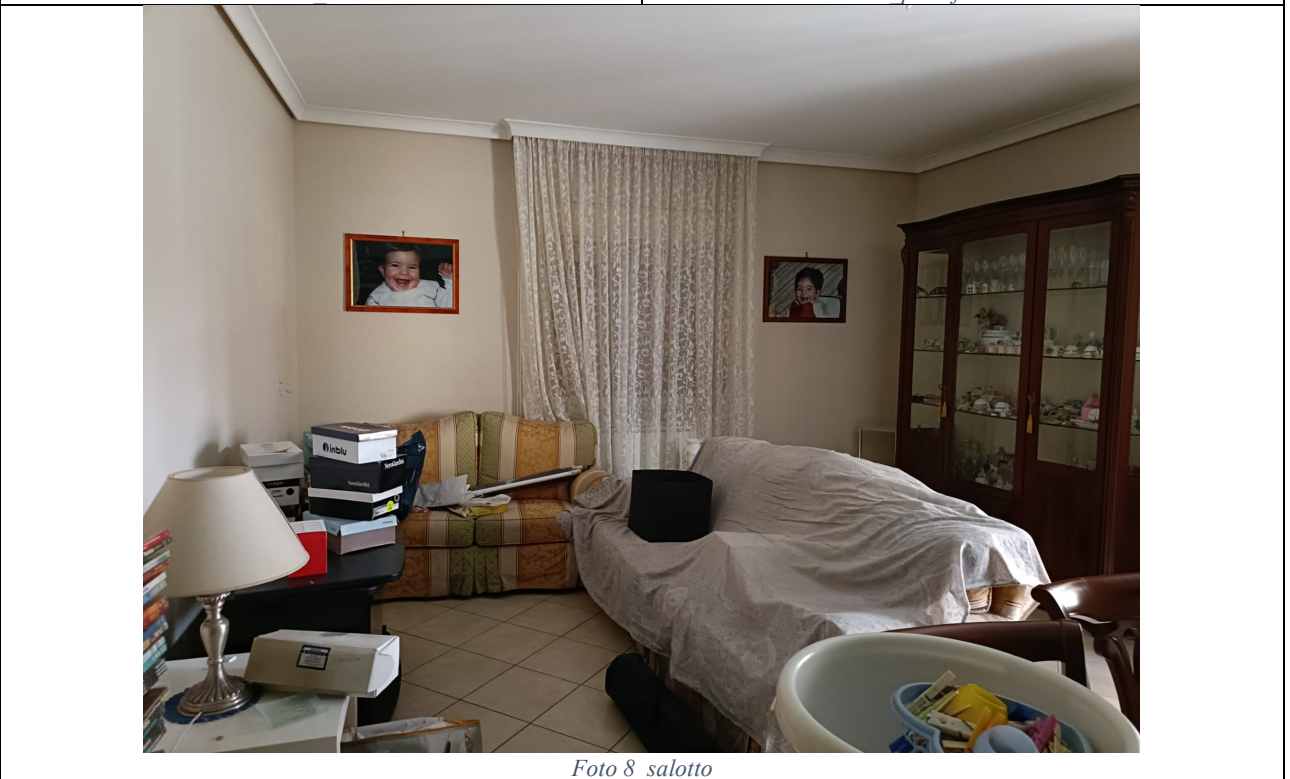
Foto 8 salotto