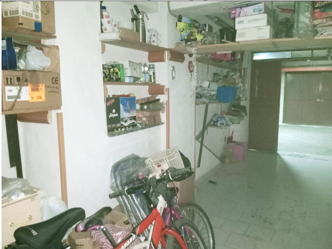
Foto 34 garage