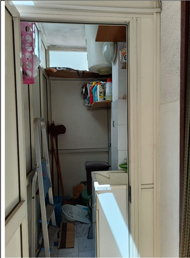
Foto 12__balcone lato sud_ dettaglio lavanderia su balcone