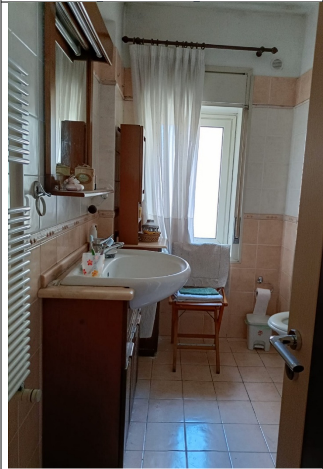
Foto 28 bagno