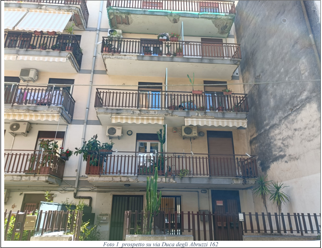
Foto 1 prospetto su via Duca degli Abruzzi 162