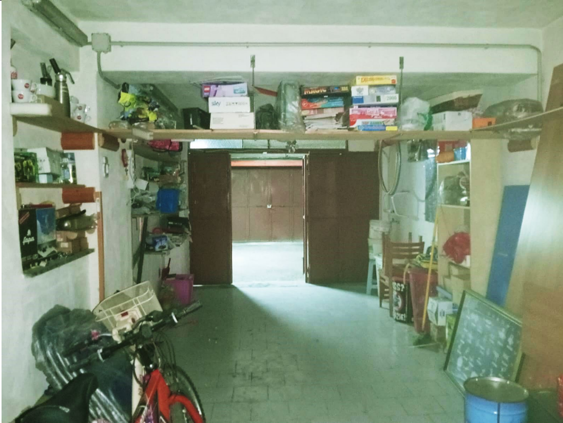
Foto 33 vista interna garage