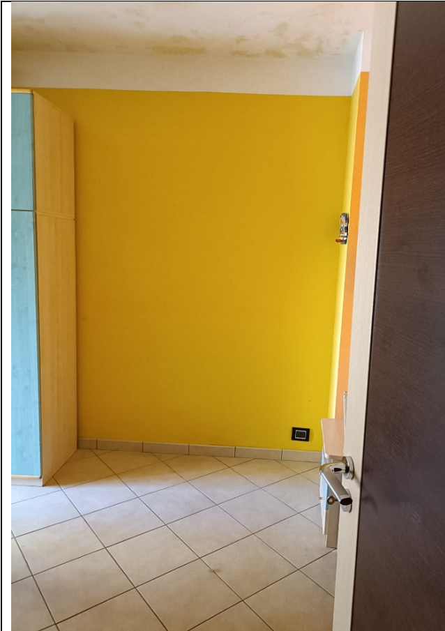
Foto 22 camera