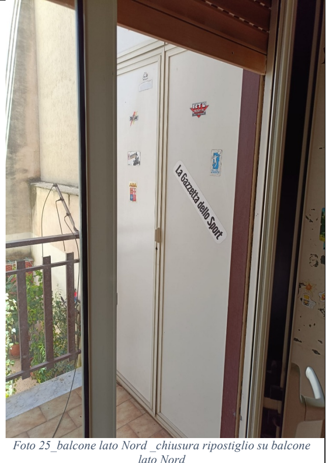
Foto 25_balcone lato Nord_chiusura ripostiglio su balcone lato Nord