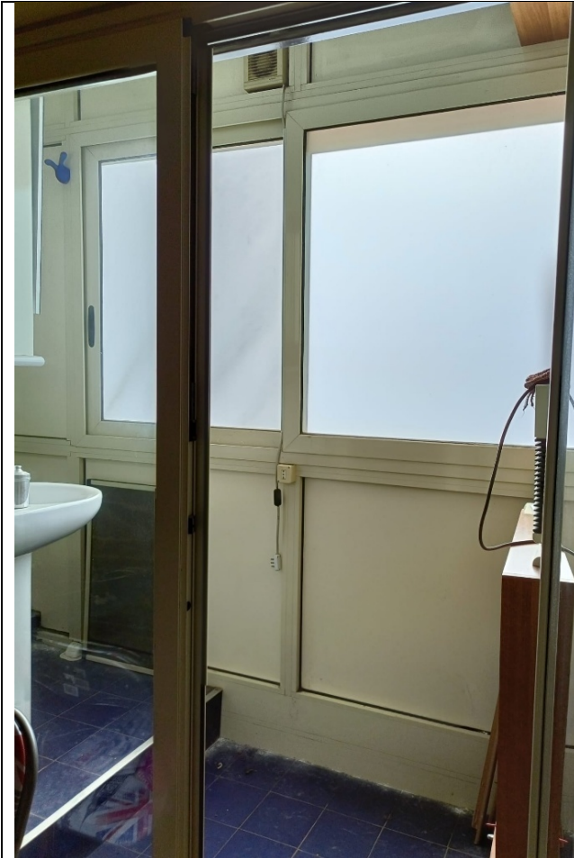
Foto 18_ chiusura del balcone lato Sud esterna alla camera padronale per realizzazione bagno