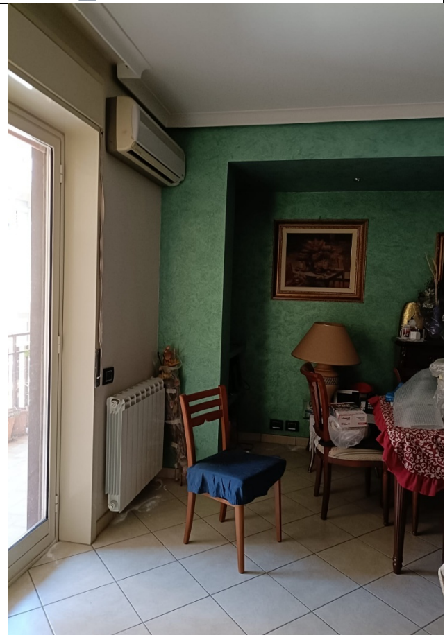
Foto 5 salotto