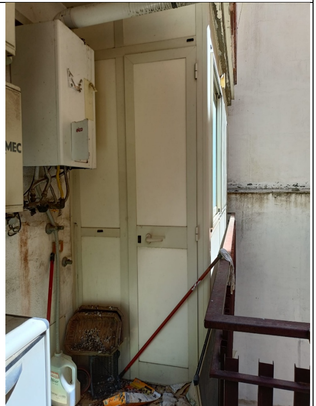
Foto 21 balcone lato Sud dettaglio chiusura per bagno