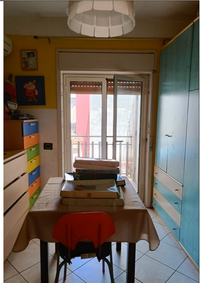
Foto 23 camera