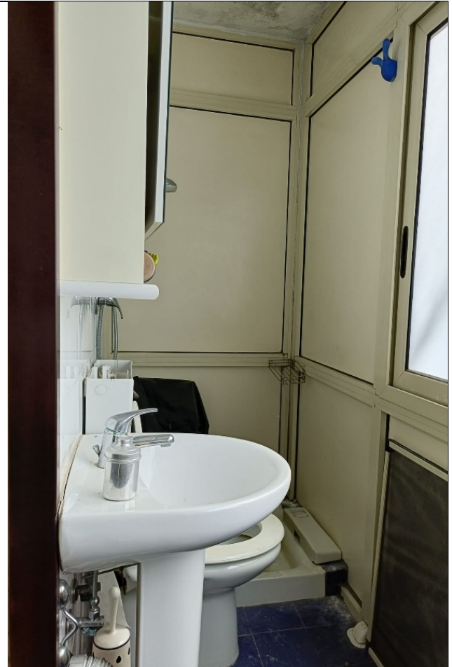
Foto 19_bagno su balcone camera padronale