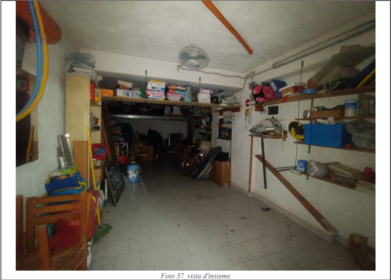
Foto 37 vista d'insieme