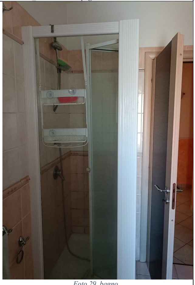
Foto 29 bagno