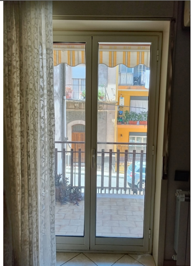
Foto 7 portafinestra salotto