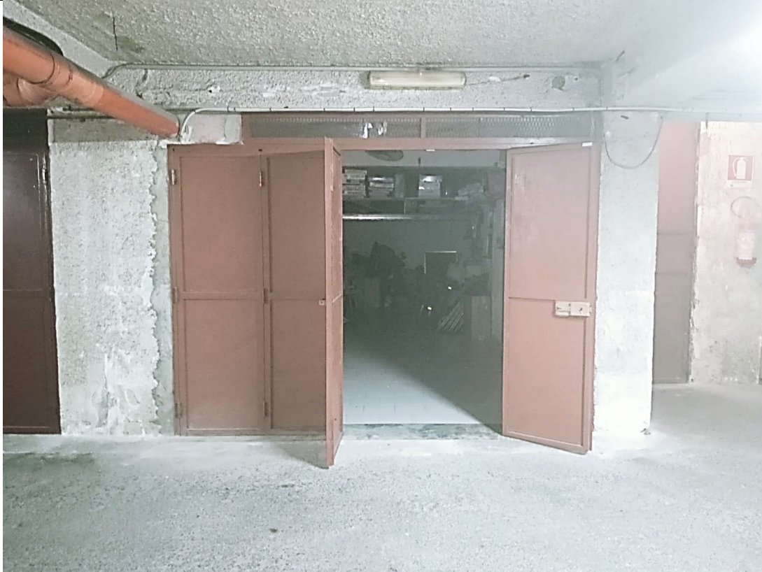
Foto 31 esterno e porta d'ingresso garage