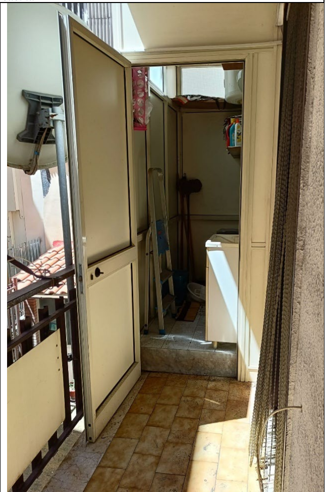
Foto 11 balcone lato Sud chiusura per lavanderia vista Ovest