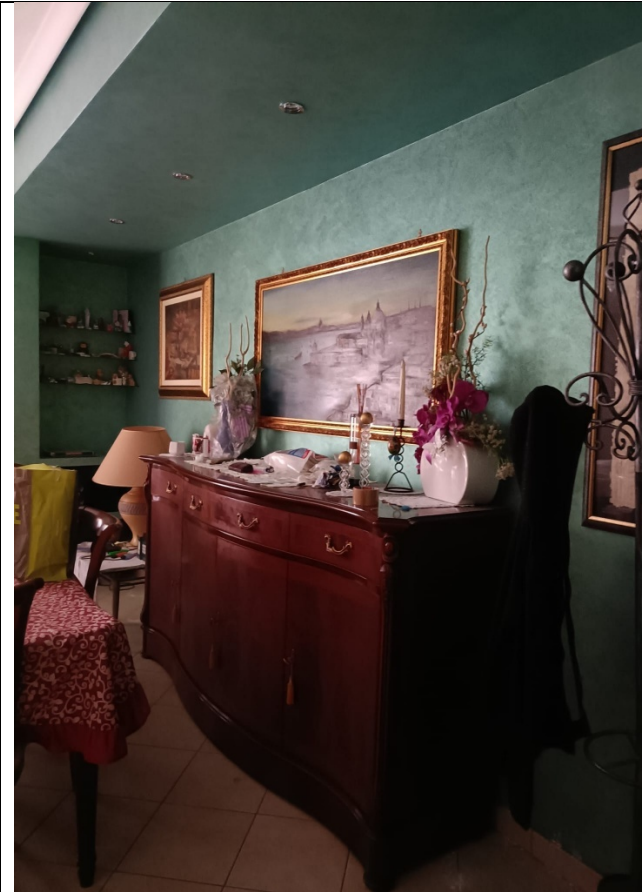
Foto 6 salotto