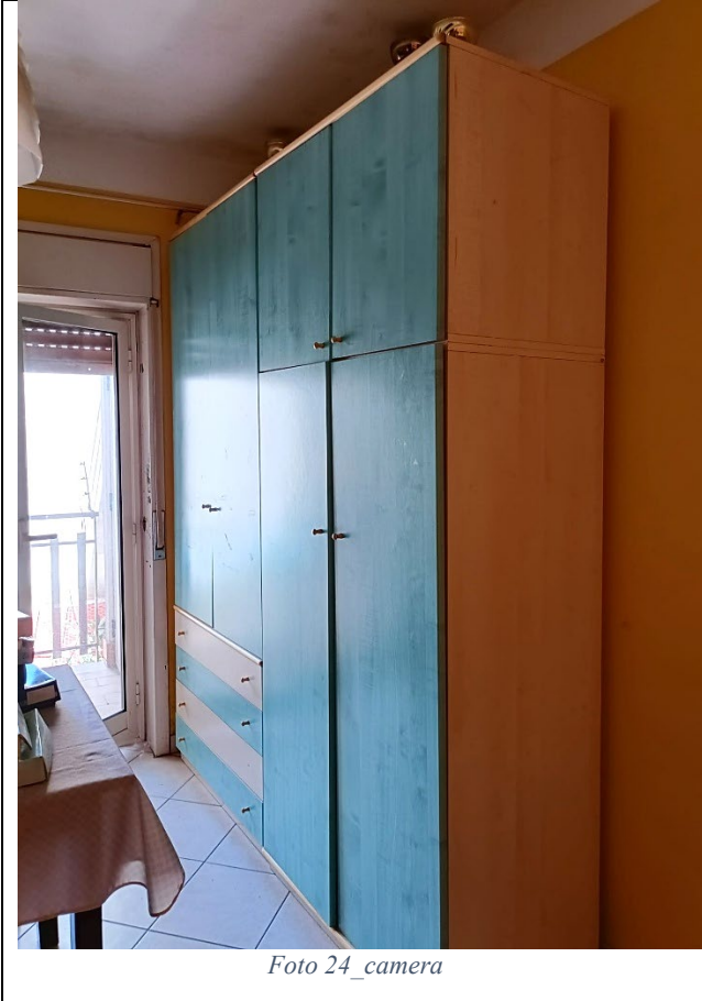
Foto 24 camera