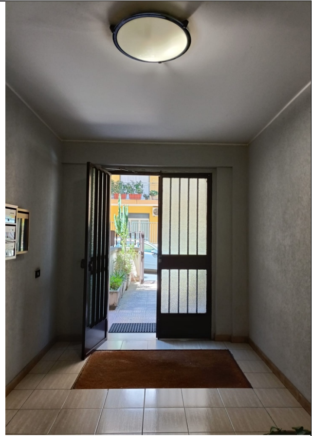
Foto 3 androne condominiale, accesso al condominio