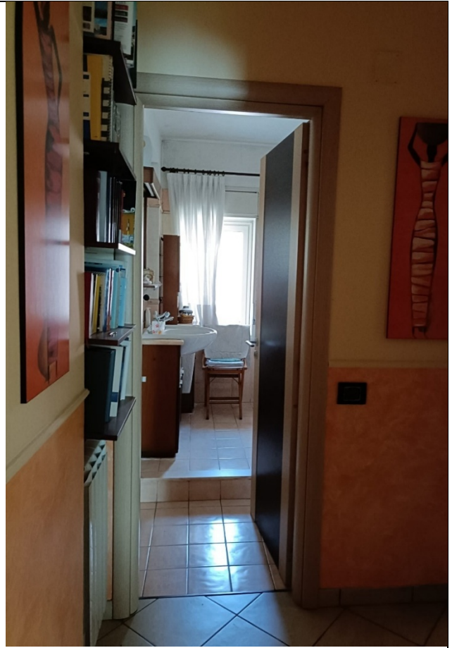
Foto 27 corridoio disimpegno verso