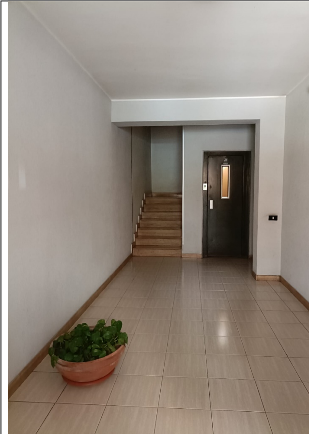
Foto 2 androne condominiale piano terra