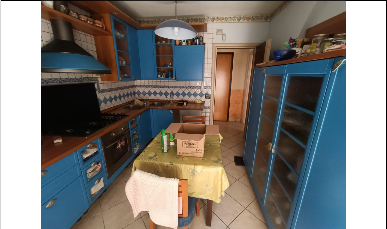
Foto 9 cucina