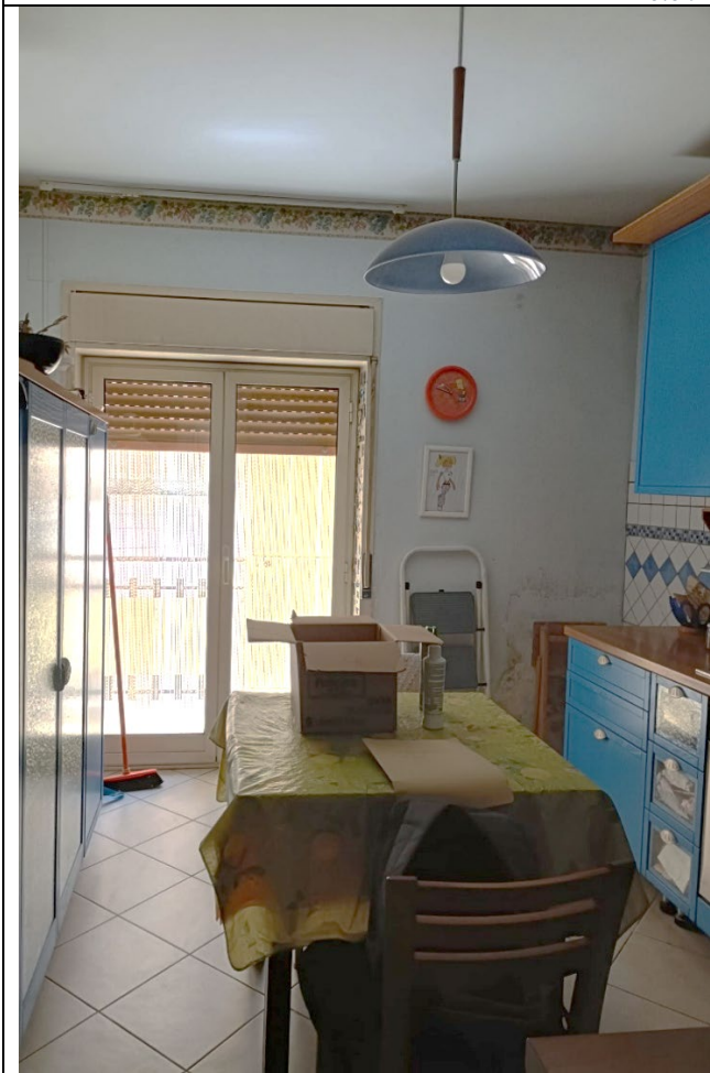
Foto 10 cucina portafinestra su balcone Sud