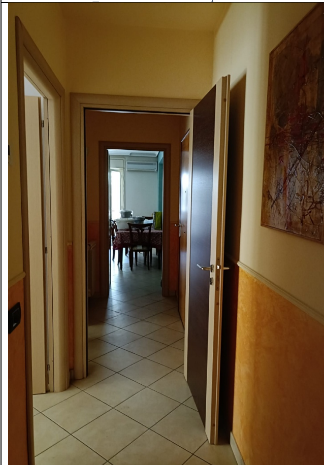
Foto 4 corridoio disimpegno verso Ovest salotto