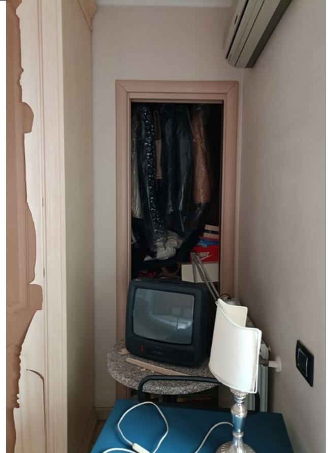
Foto 17__cabina armadio incassata in nicchia della camera padronale