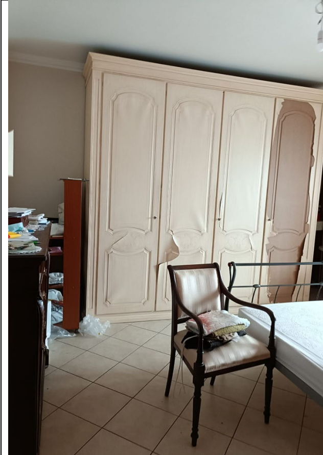
Foto 16_camera padronale