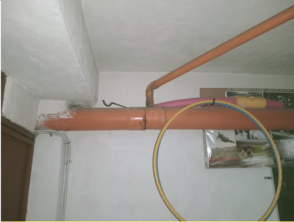
Foto 35 servitù impiantistiche