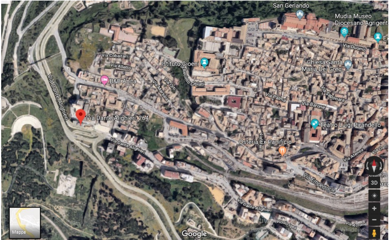
Figura 1 – Foto satellitare

L'immobile ricade nel Comune di Agrigento (AG), via Dante Alighieri 264.