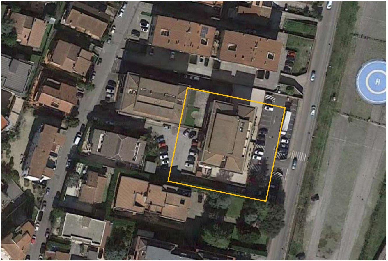
Foto 1 - Aerofotogrammetria con individuazione del bene pignorato