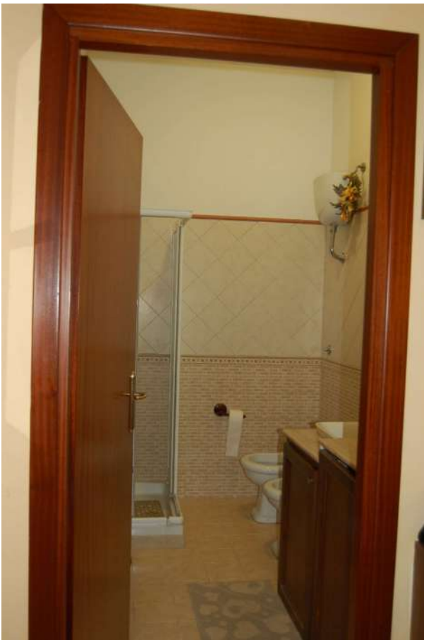
Foto 24 - Vista del bagno