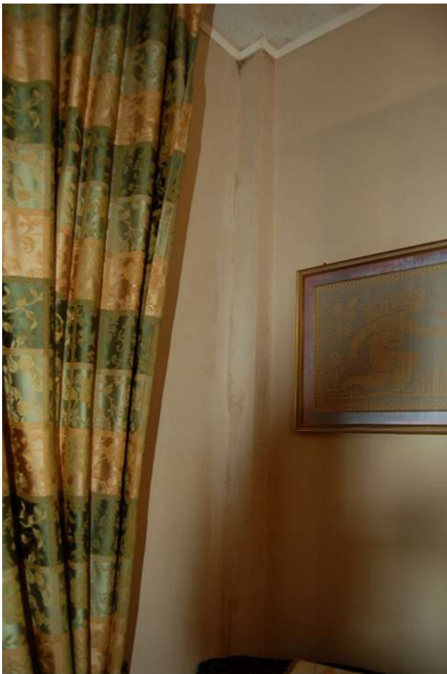
Foto 22 - Fenomeni di degrado causati da condensa superficiale