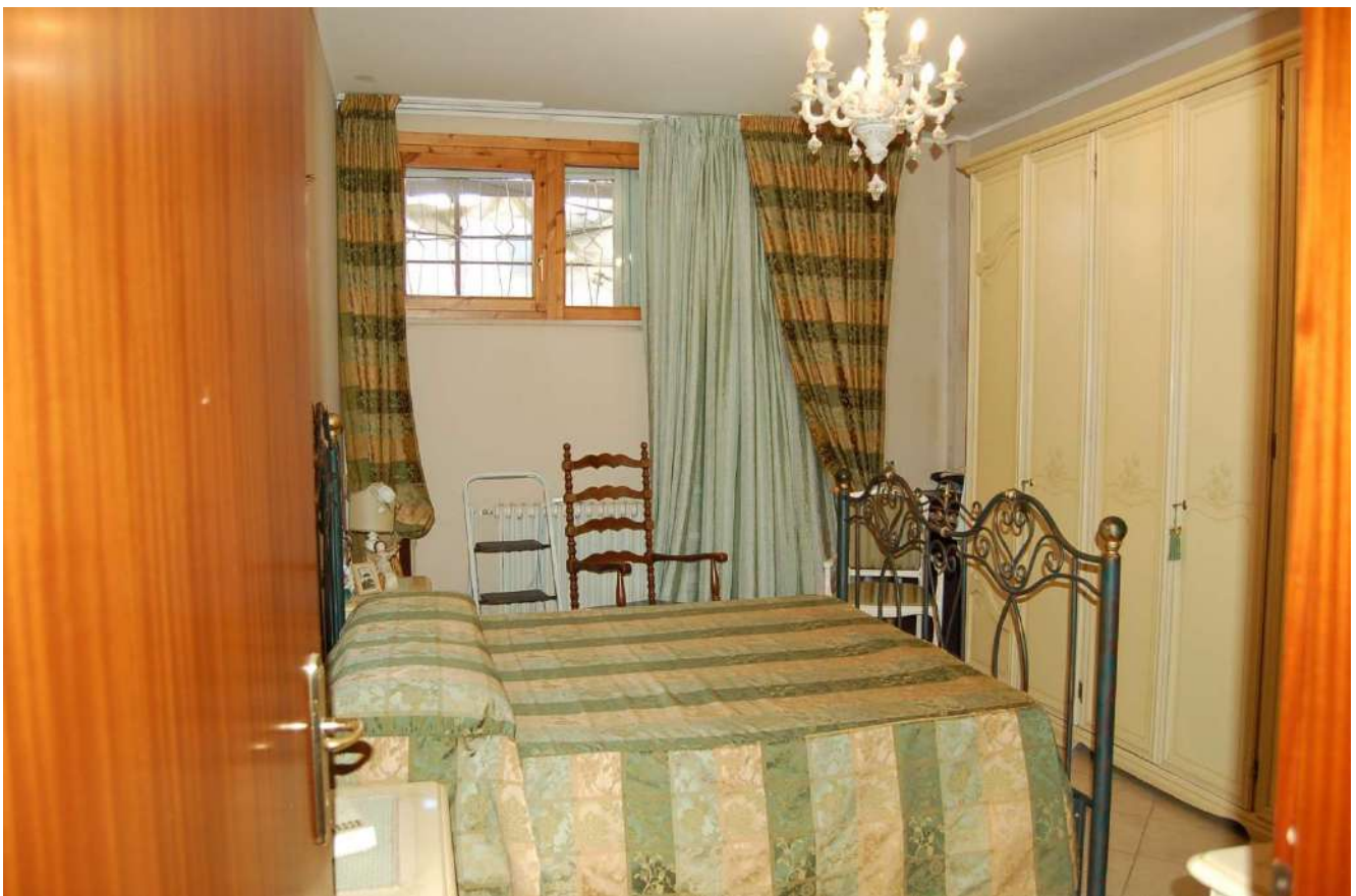
Foto 20 - Camera matrimoniale