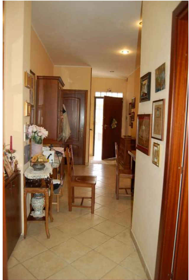
Foto 19 - Vista del disimpegno che conduce alla zona notte