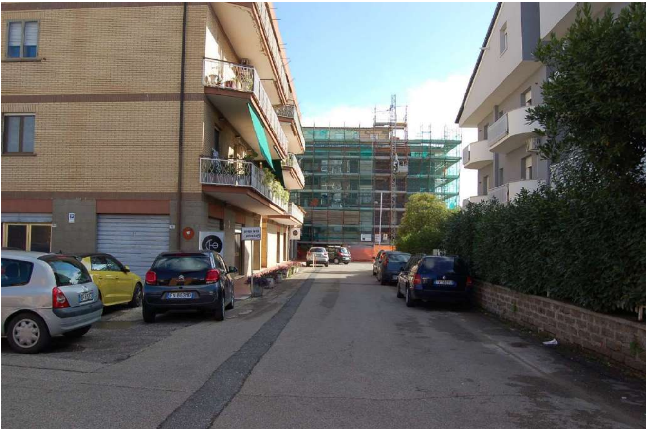
Foto 3 - S Strada d'accesso all'unità immobiliare di proprietà privata