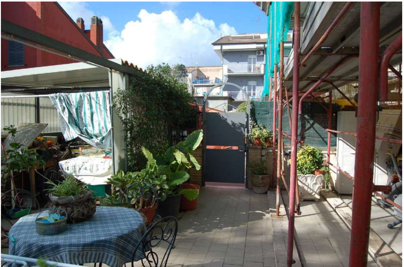
Foto 6 - Cancellone pedonale d'ingresso all'area esterna del compendio pignorato