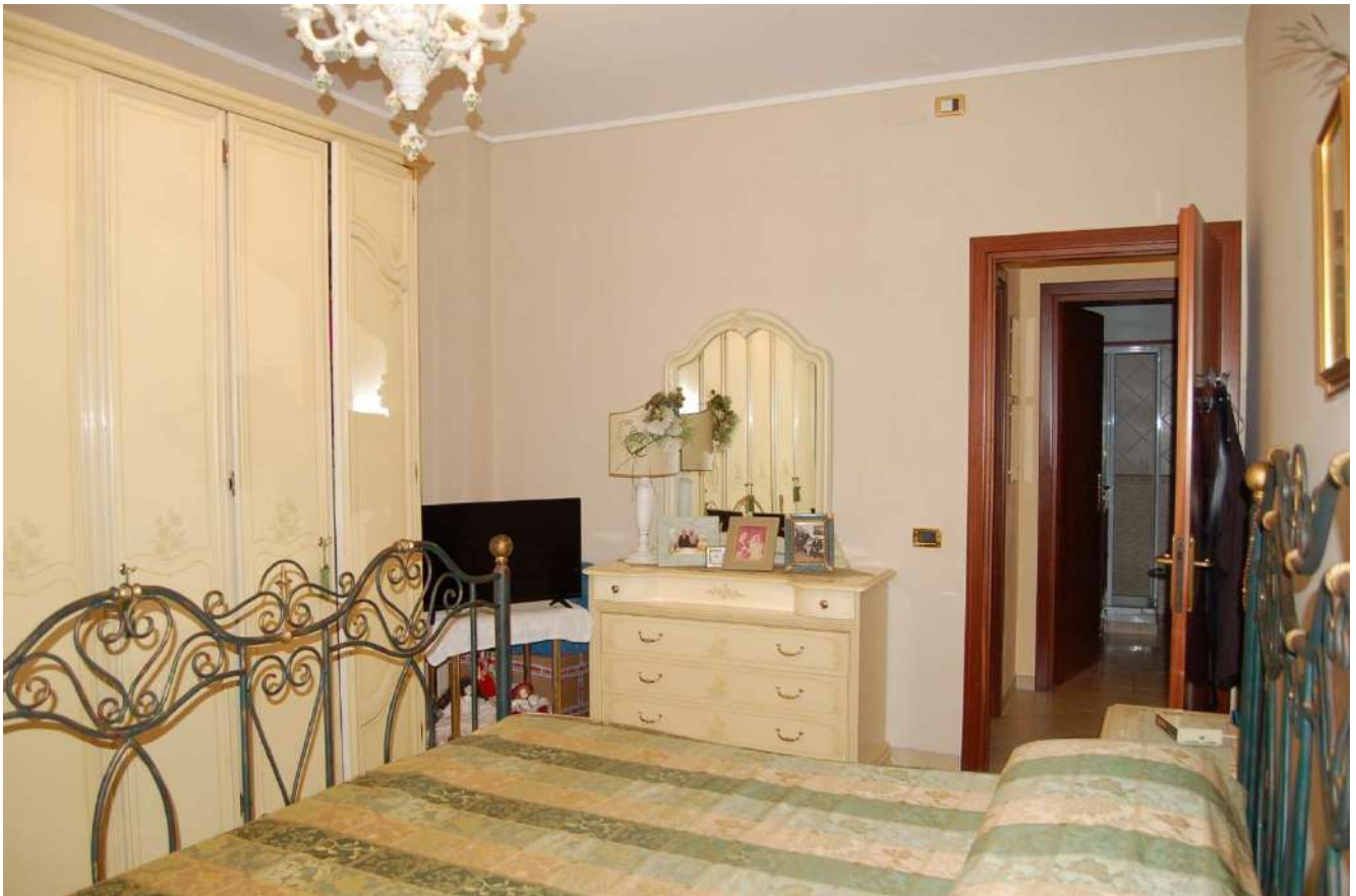
Foto 21 - Camera matrimoniale