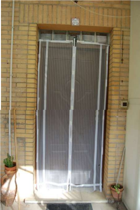
Foto 11 - Portoncino d'ingresso all'unità immobiliare