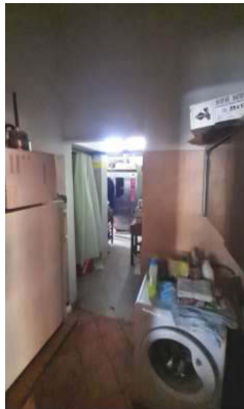
Locale di servizio