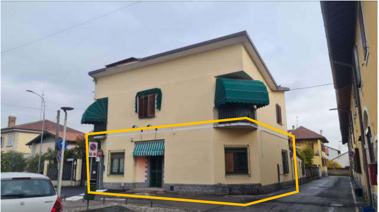
Complesso edilizio Piazza San Carlo 3 – individuazione degli immobili