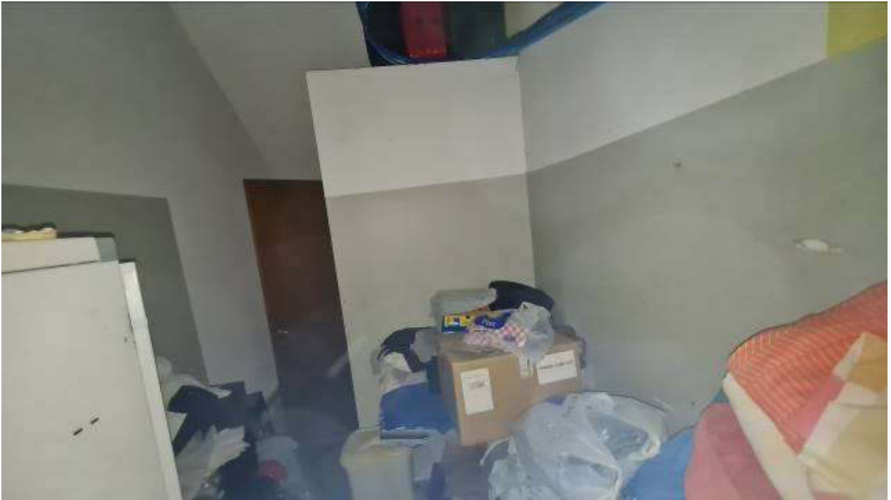
Spogliatoio e bagno di servizio