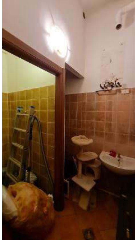
Bagni del bar