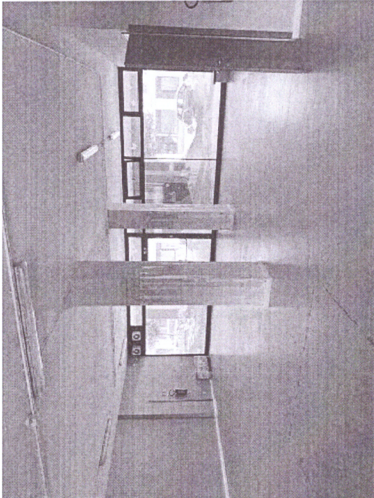
Vista interna Negozi CIV. 10 - 12 -16 - 18