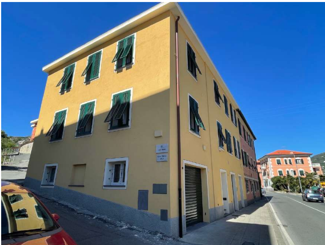
FOTO 1 – Vista edificio angolo Via Piacenza – Salita Privata Copello