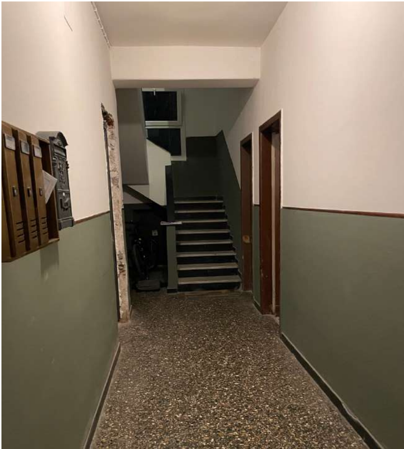
FOTO 7 – atrio civ. 369 con ingresso Lotto 3 e Lotto 4 sulla destra