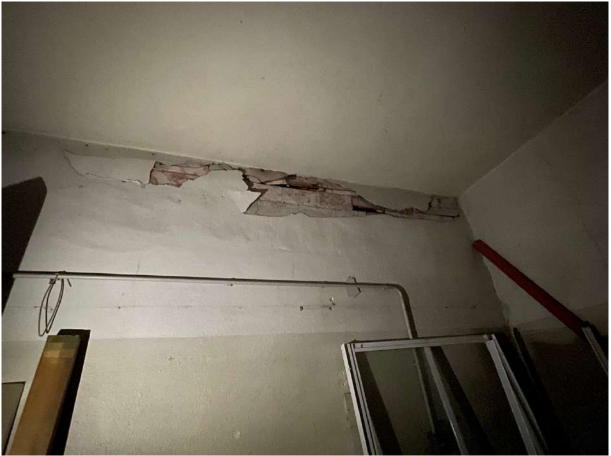
FOTO 5 - scrostamento intonaco e fessurazione muro divisorio con Lotto 4