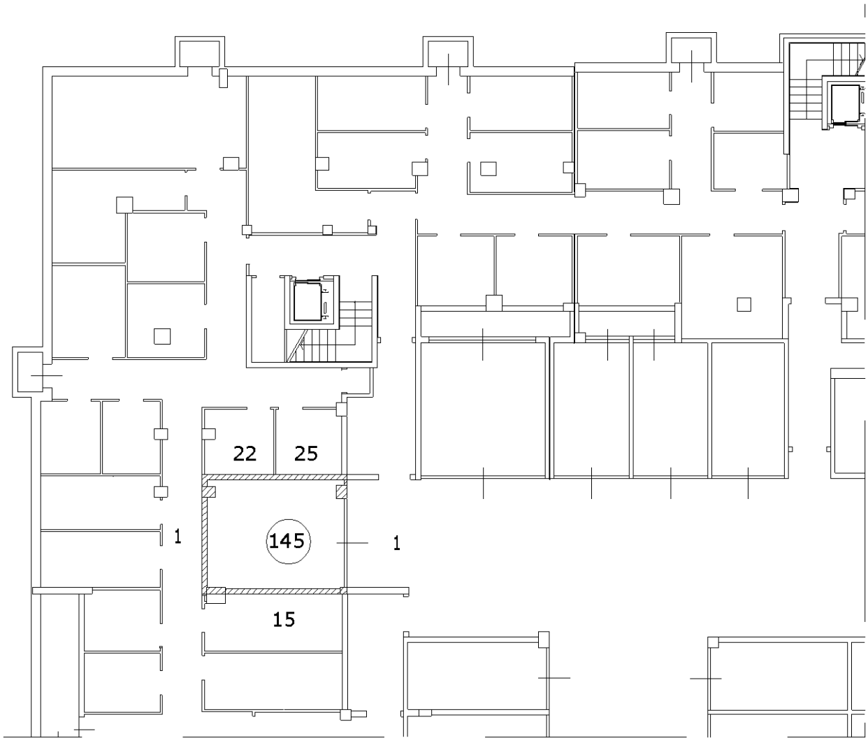
PIANO SECONDO INTERRATO BOX H=240