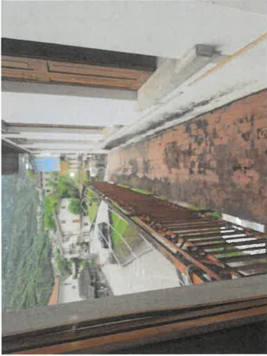
Foto n. 9 : C.F. Fg. 14 mapp. 162 sub 7 - Piano primo, terrazza fronte ovest