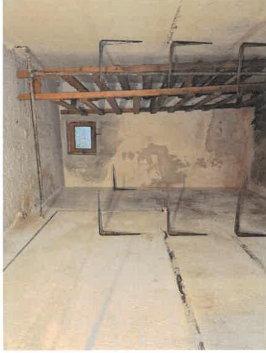
Foto n. 10 : C.F. Fg. 14 mapp. 162 sub 7 - Piano secondo, soffitta comune