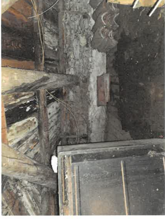
Foto n. 12 : C.T. Fg. 14 mapp. 162 sub 7 - Piano secondo, soffitta comune

Esecuzione Immobiliare n. 79/2024 a carico di DE BONA Ottorino e Marzio - Castelavazzo di Longarone (BL)