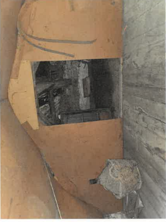
Foto n. 11 : C.T. Fg. 14 mapp. 162 - Piano secondo, soffitta comune