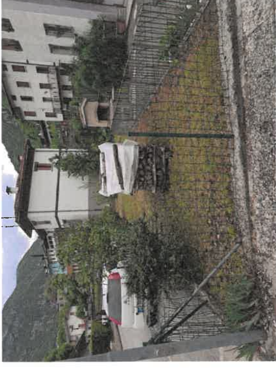
Foto n. 4 : C.F. Fg. 14 mapp. 162 - Fabbricato, corte pertinenziale