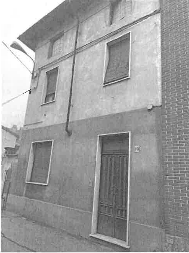
esterno su strada