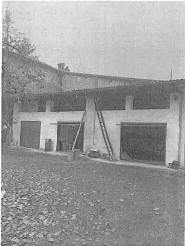
facciata esterna su corte interna