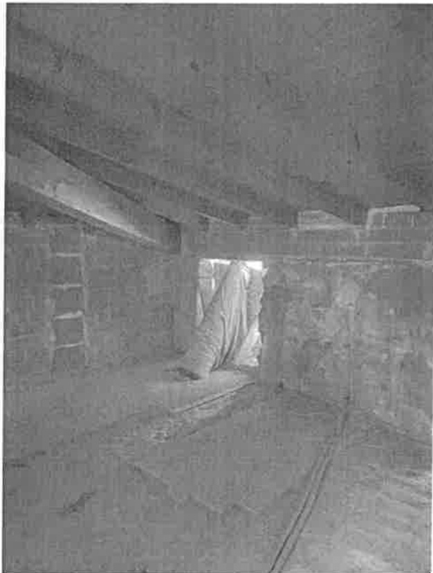
sottotetto con lavori avviati e non terminati