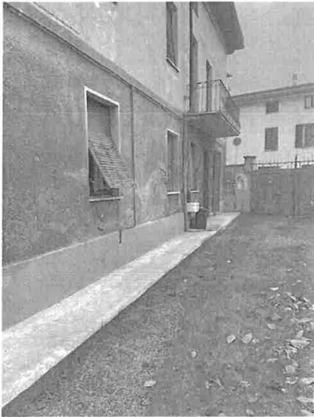
esterno su sortile interno