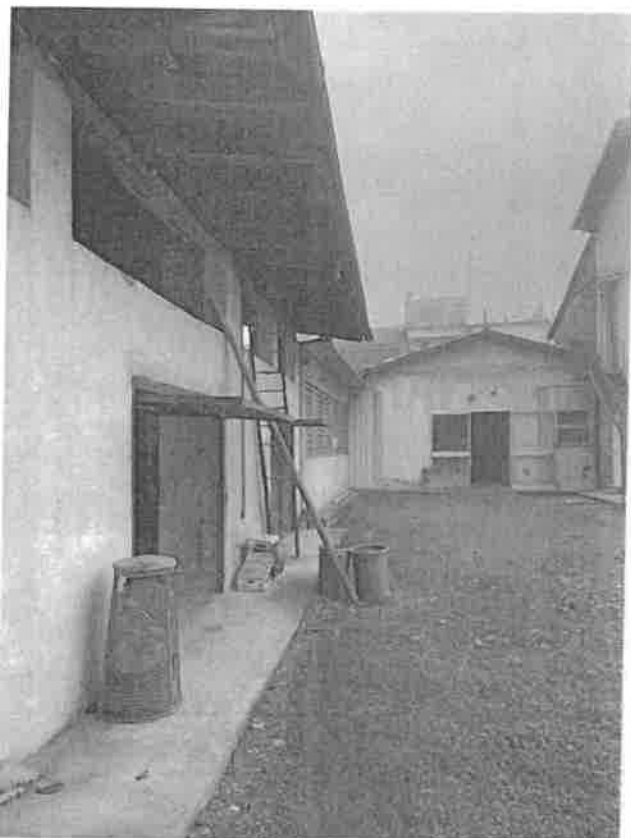
esterno su corte interna