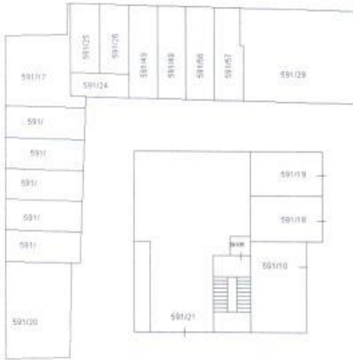
PIANO 1° SOTTOSTRADA