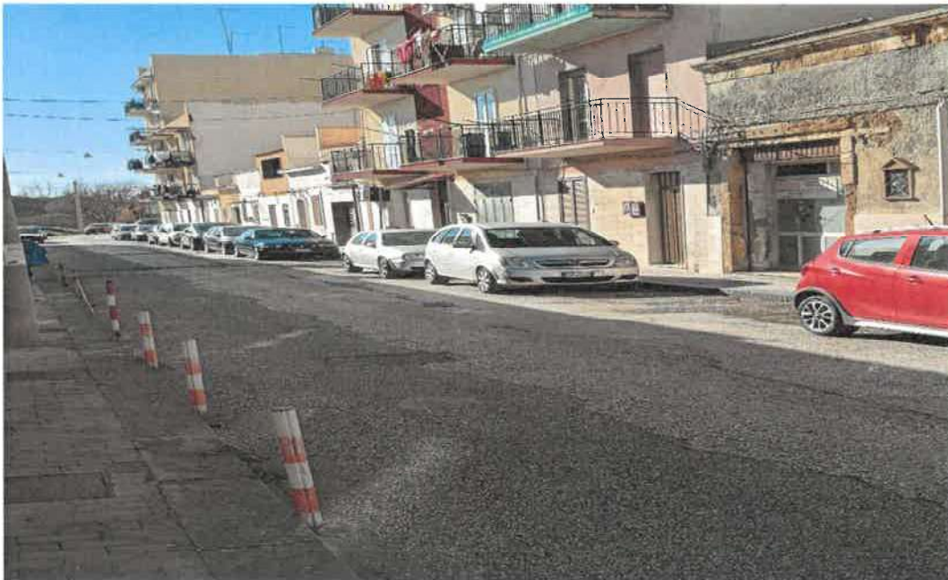
Foto n.ro 2 -via dei cordai AUGUSTA

Accesso condominiale civico 22 via Cordai- AUGUSTA