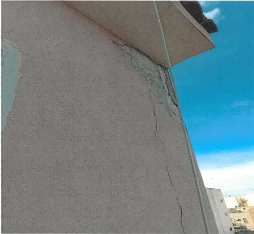
Foto n.ro 41 pilastro d'angolo del soggiorno