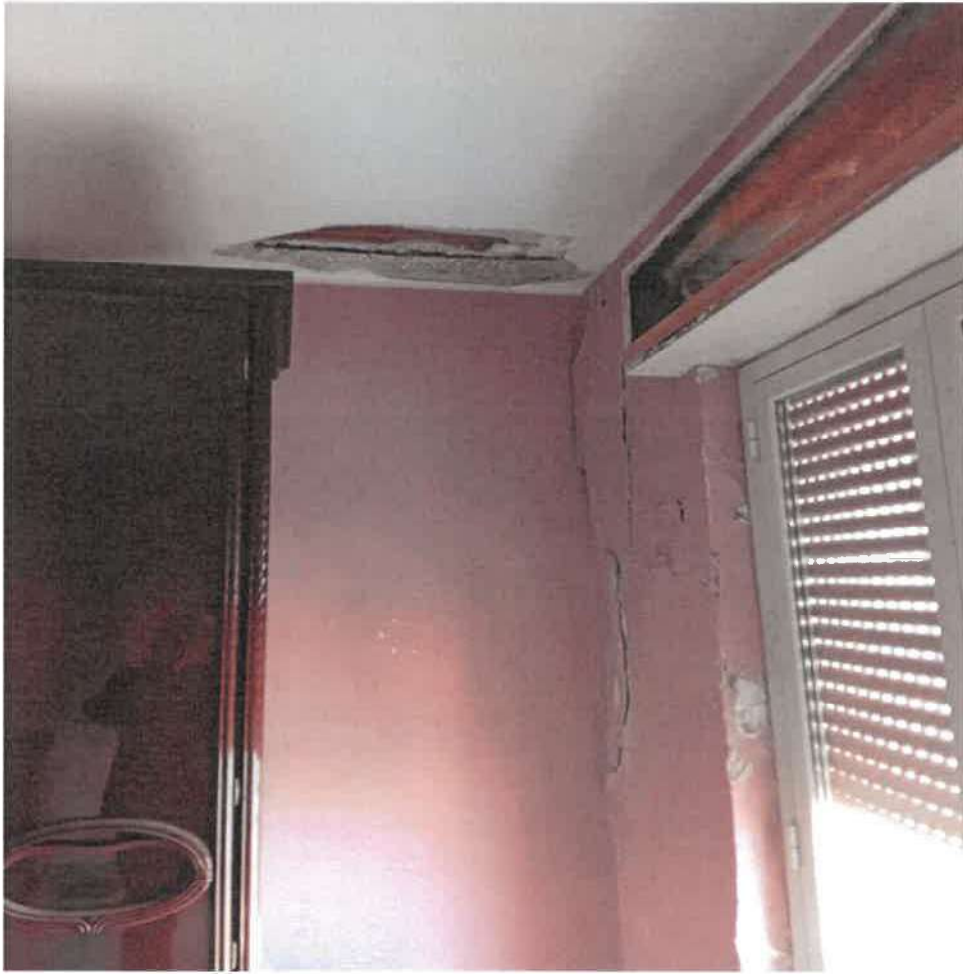
Foto n.ro 11 – salone al piano 4 (appartamento proprietà [REDACTED])