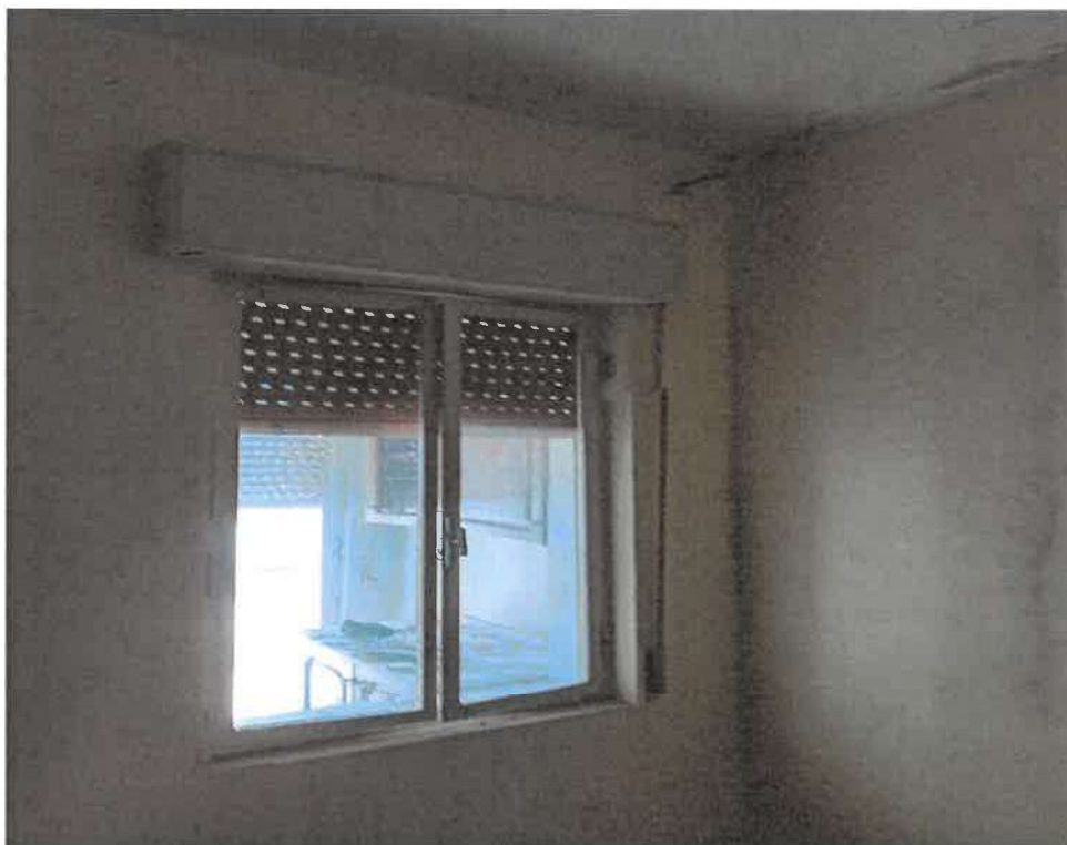
Foto 20 : la finestra della stanza da letto comunicante con la cucina