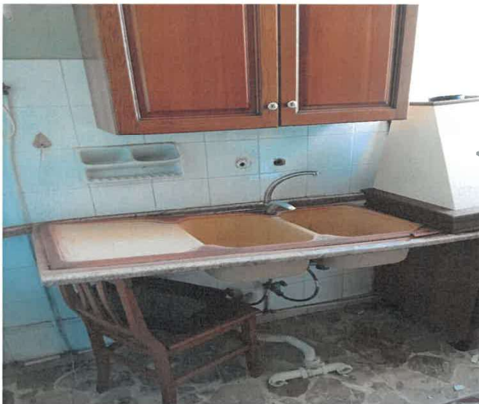
Foto n.ri 24-25 : altri dettagli locali cucina e particolari distacchi di intonaco dal soffitto