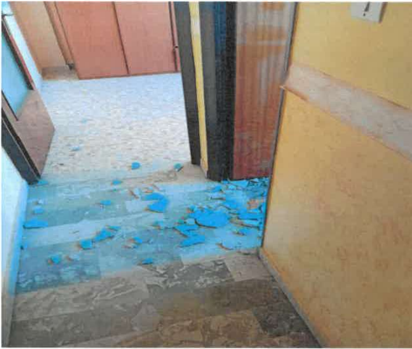
foto n.ro 29 dettagli pavimentazione e ingresso locale bagno e stanzetta