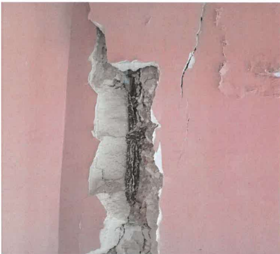
foto n.ro13, dettaglio pilastro salone