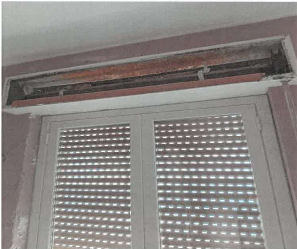
Foto n.ro 12- infissi salone