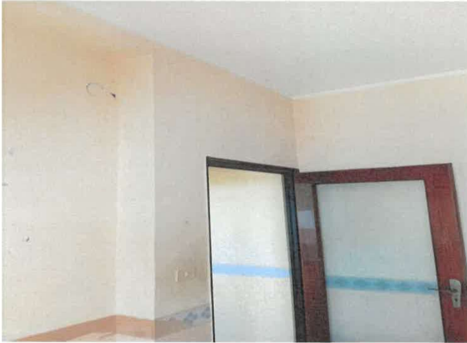
foto n.ro 37 ingresso stanza da letto piccola