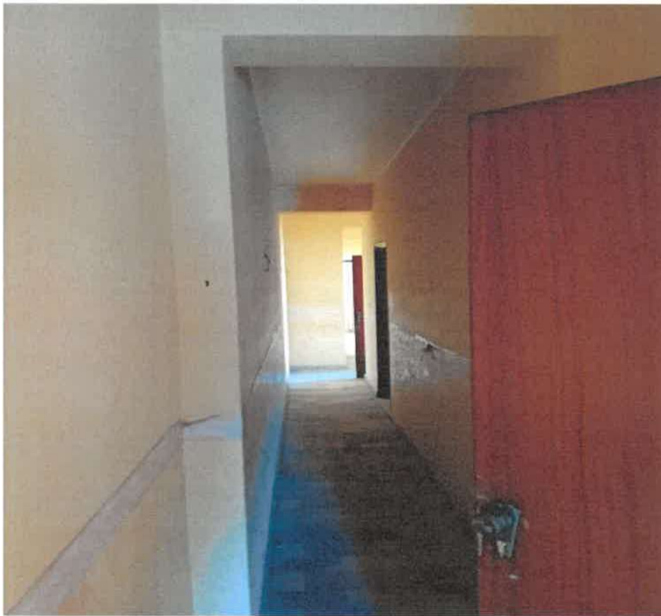
Foto n.ri 16-17 dettagli zona ingresso all'immobile e corridoio di distribuzione