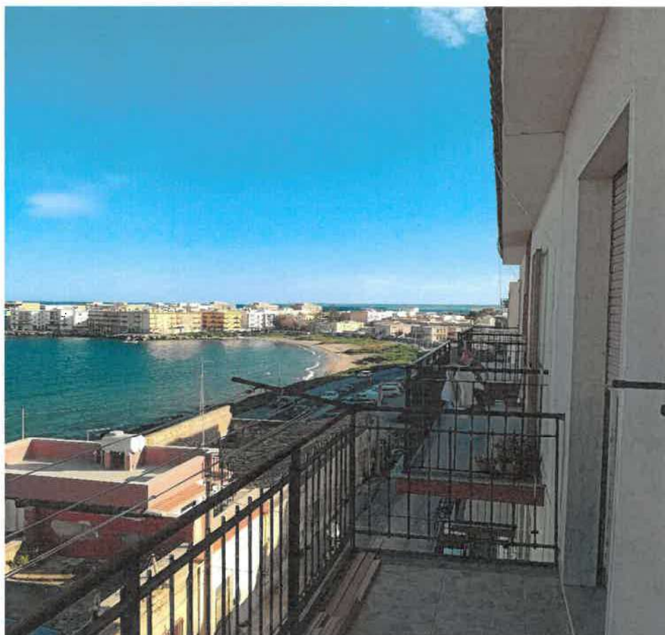
Foto n.ri 43-44 vista mare dal balcone del soggiorno