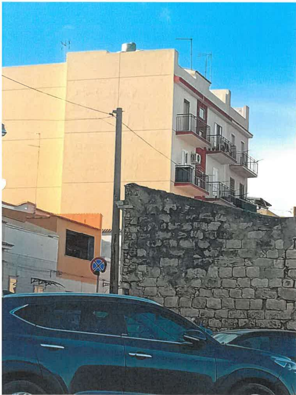
Foto n.ro 47 : vista dell'edificio di cordai 22 e di quello limitrofo, vista dal lungomare Paradiso