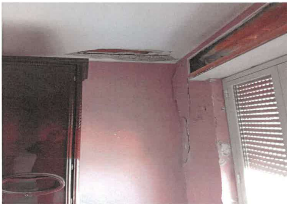
Foto n.ro 15 . dettagli salone , confine nord