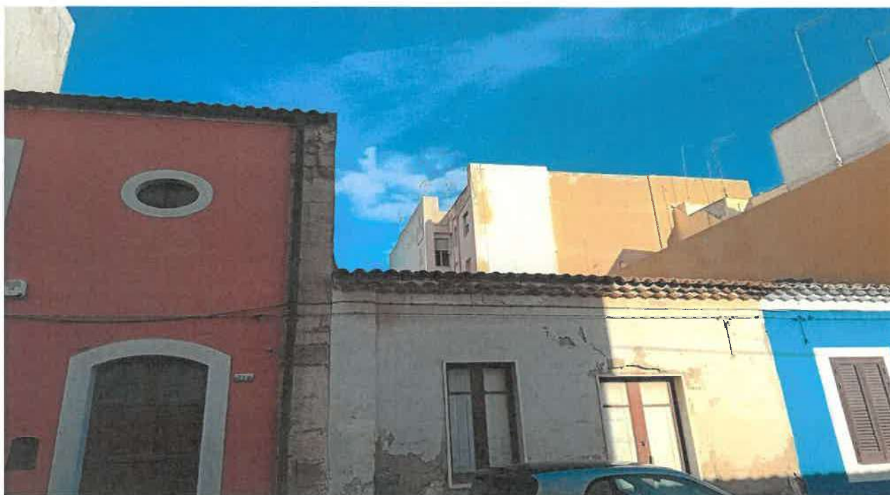
Foro n.ri 45-46 vista prospettico ovest visto dalla Via Epicarmo, parallela alla Via Cordai