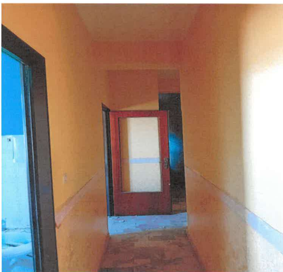
Foto n.ro 28: il corridoio che disimpegna locale wc e la stanzetta in fondo