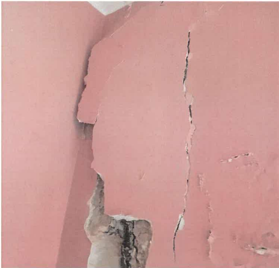
Foto n.ro 14- dettaglio copriferro pilastro ammalorato con armature in vista