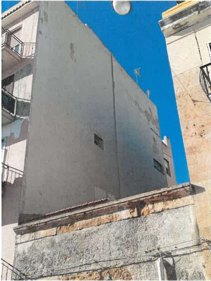
foto n.ro 5-prospetto nord