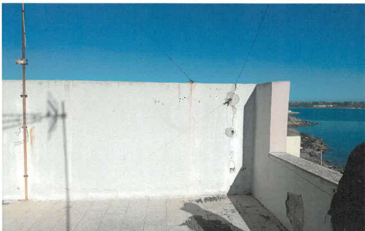
Foto n.ro 49 : il terrazzo in corrispondenza del sottostante soggiorno