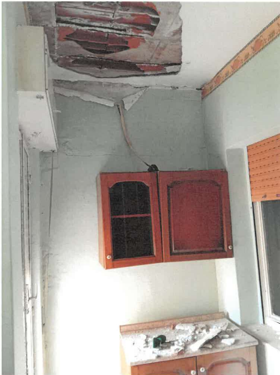
Foto n.ro 26 : distacchi intonaco per infiltrazioni dal terrazzo condominiale