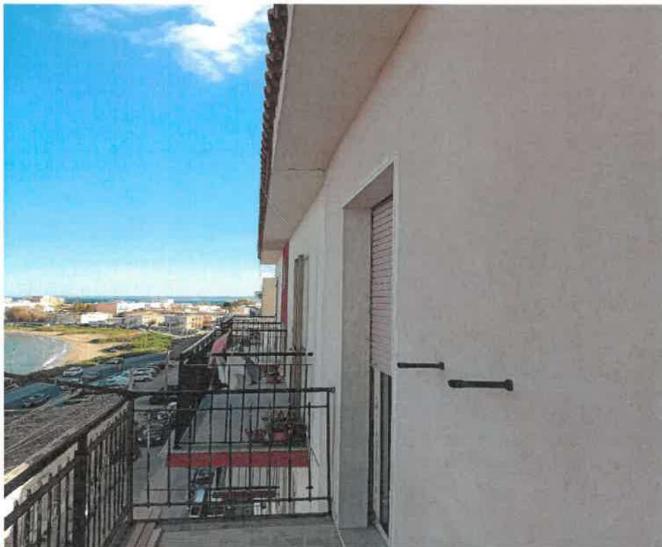
Foto n.ro 42 : l'appartamento limitrofo a sud confinante con quello di proprietà Costanzo