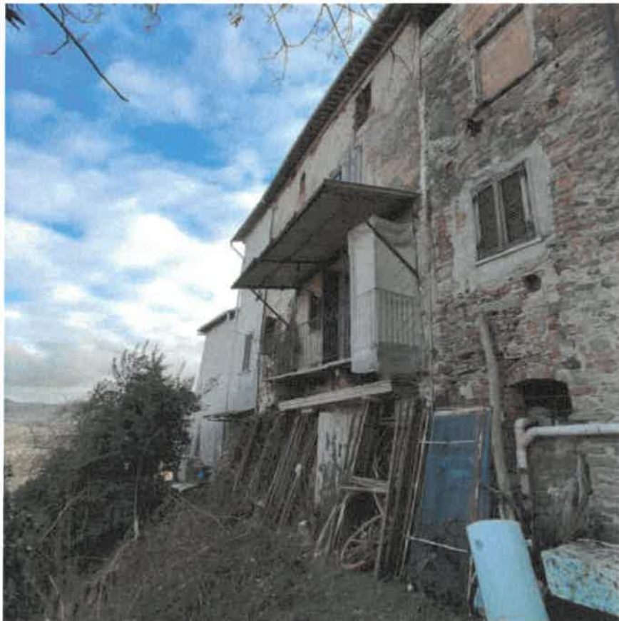
Vista della porzione di cortile pertinenziale a verde e della facciata del fabbricato di abitazione posti sul fronte Nord della proprietà