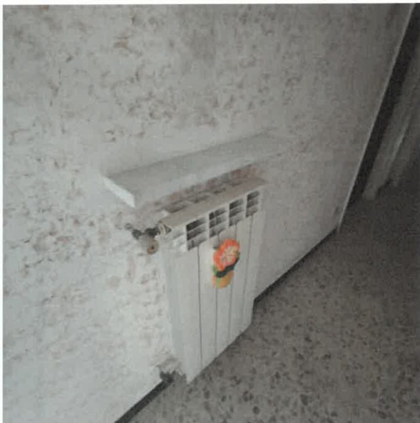
Vista generatore impianto riscaldamento e tipologia batterie radianti interne al fabbricato di civile abitazione