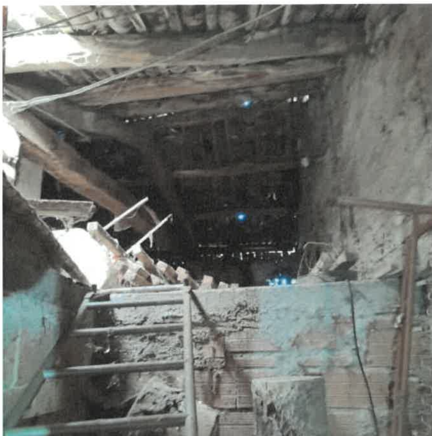
Vista interna locale sottotetto