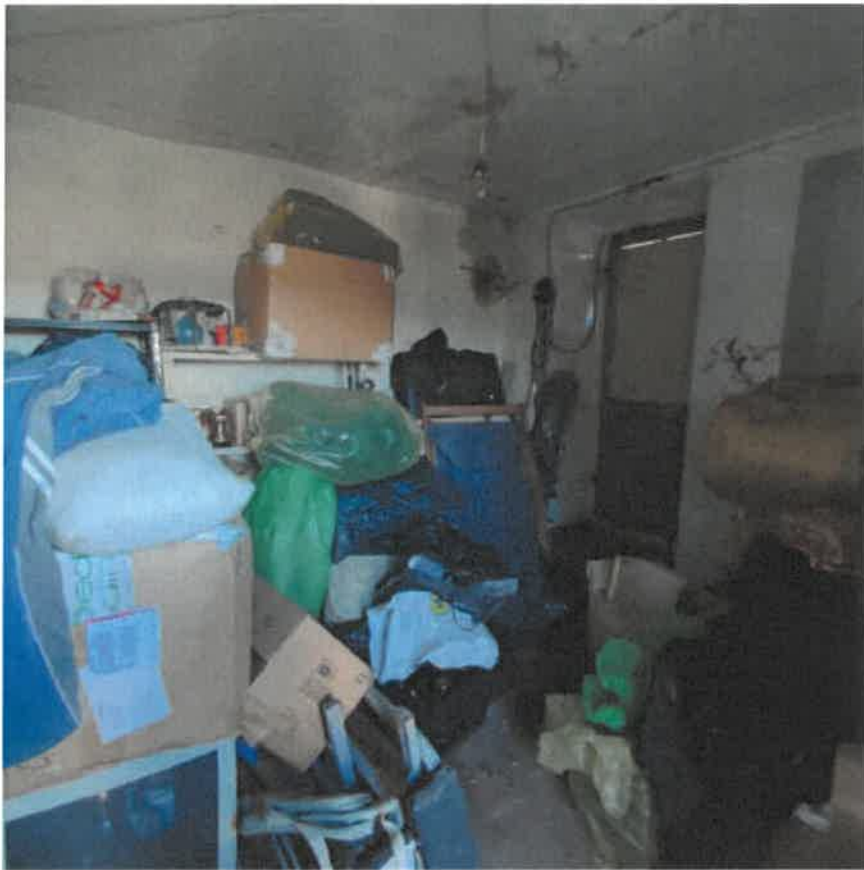
Vista interna locale sgombero in piano primo