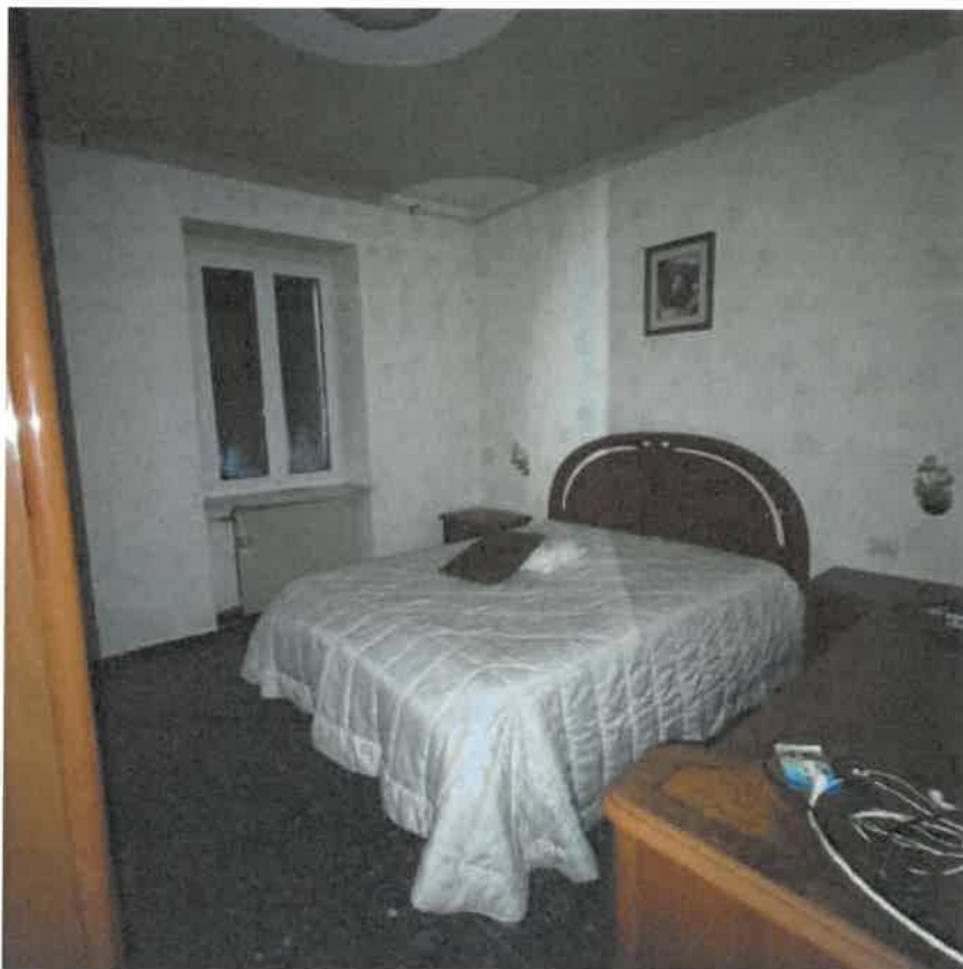
Vista interna locali camera in piano primo