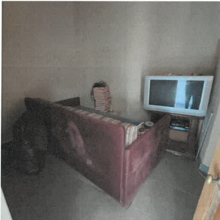
Vista locale camera in piano primo ammezzato