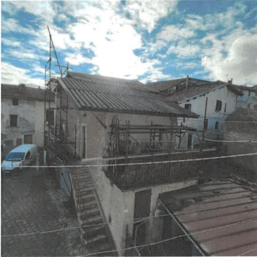
Vista del fronte Nord e risvolto ad Est del fabbricato pertinenziale in distacco