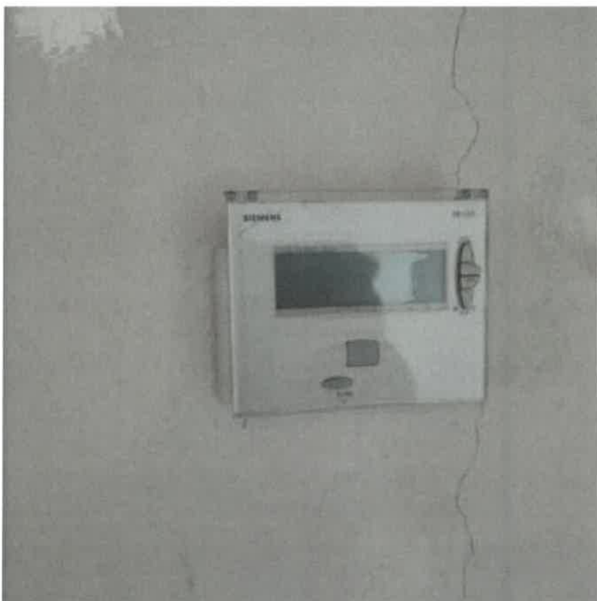
Vista particolare gruppo termostato ambiente interno al fabbricato di civile abitazione