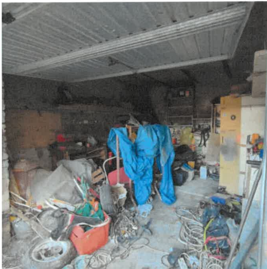
Vista interna del locale box in piano terra con accesso sul fronte Est dal cortile pertinenziale