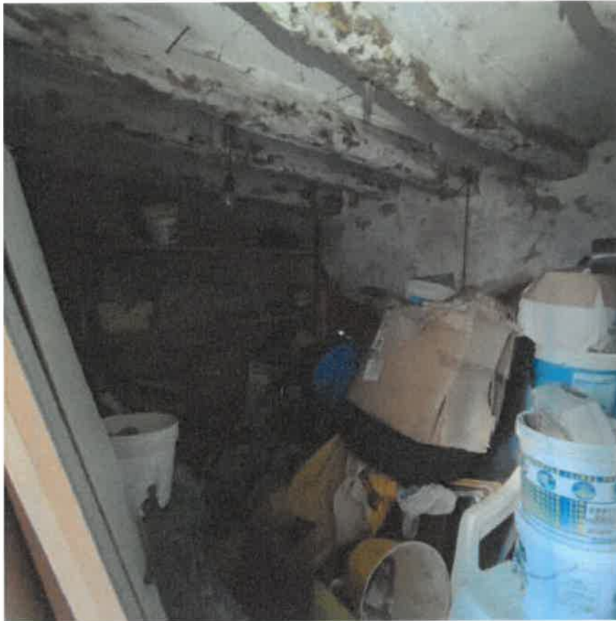
Vista interna locale ripostiglio in piano terra con accesso sul fronte Ovest direttamente dalla strada pubblica