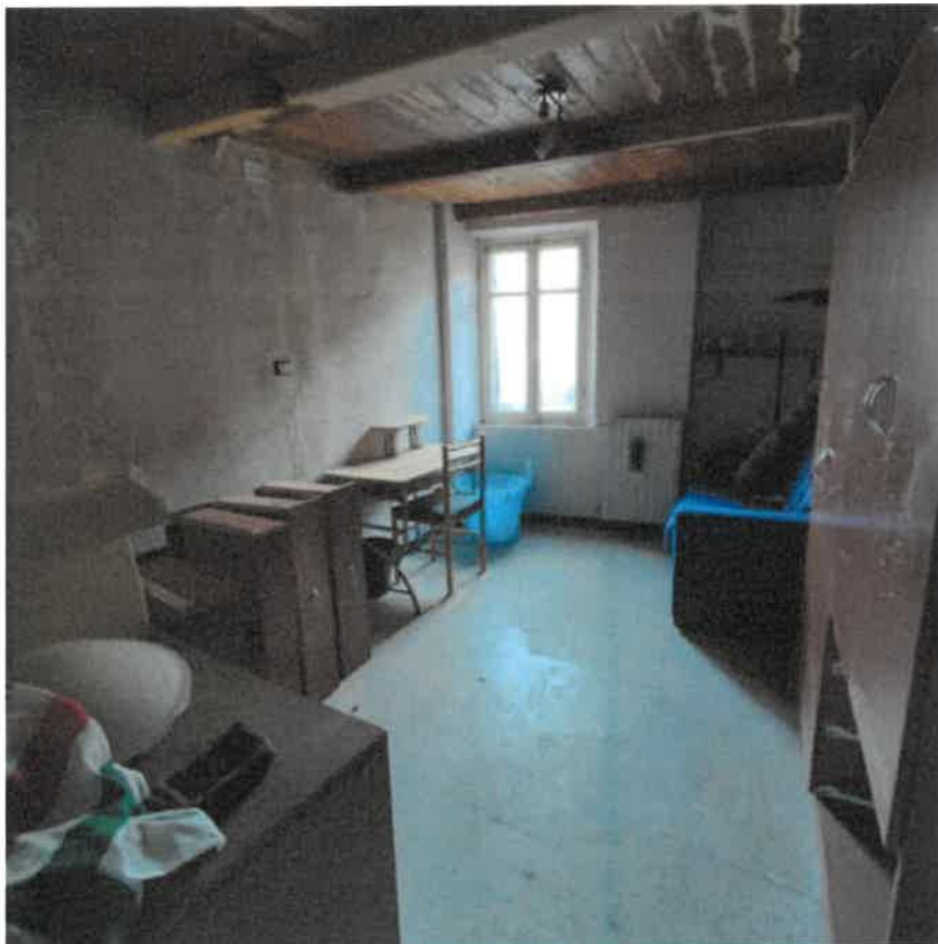
Vista interna locale soggiorno e sala