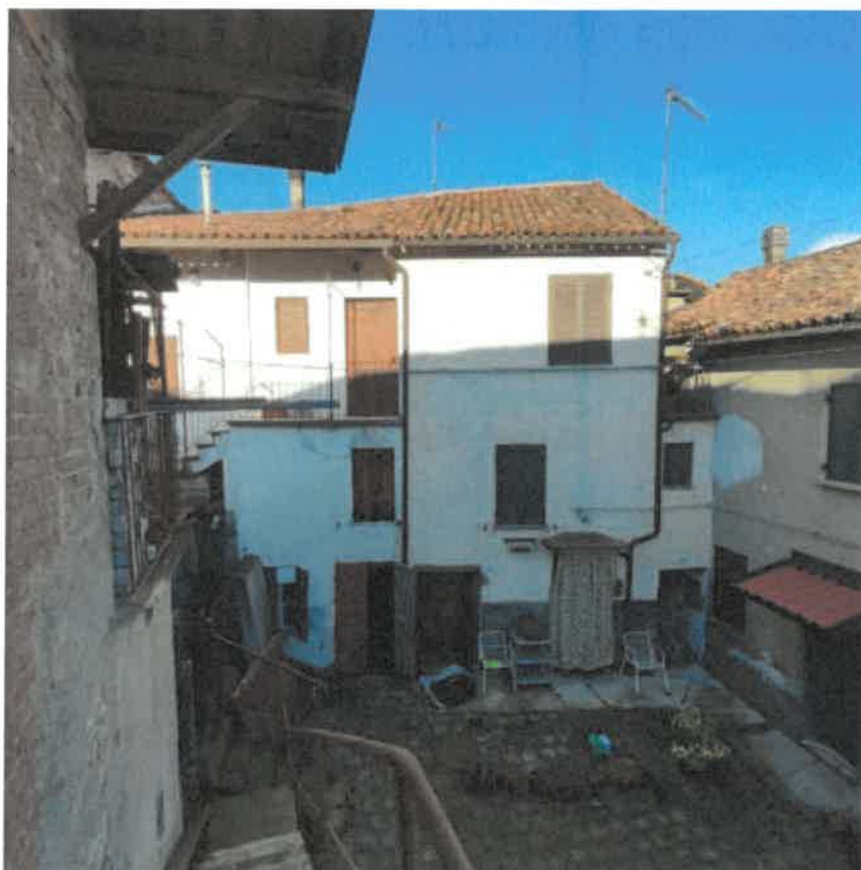
Vista dal cortile pertinenziale del fronte Sud del fabbricato di abitazione