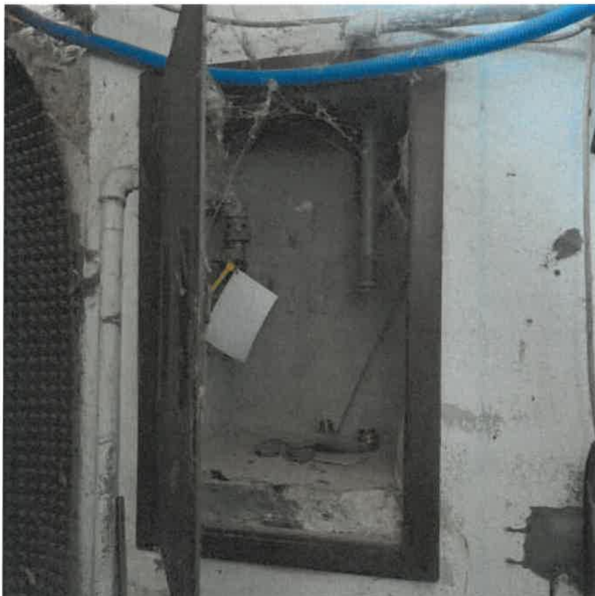
Vista particolare contatore impianto gas – metano