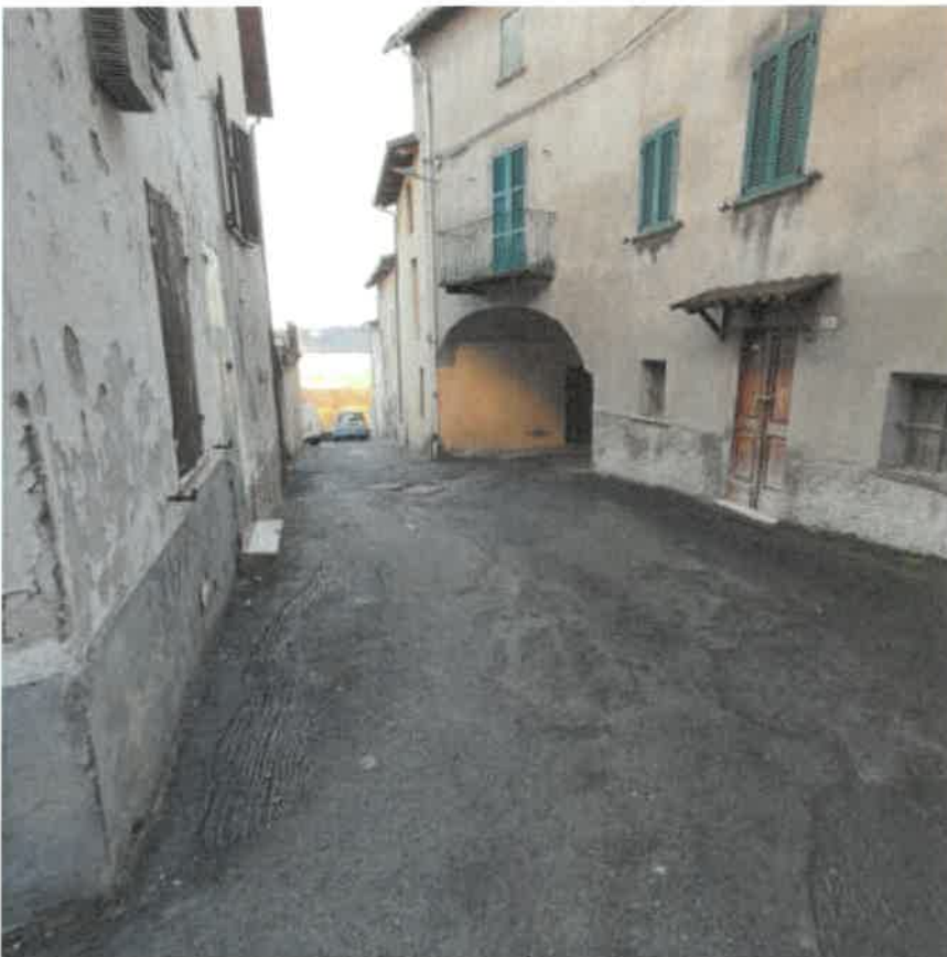
Vista dalla sede stradale pubblica – Via Osvaldo Caldano – dell'accesso carraio alla proprietà posto sul fronte Sud