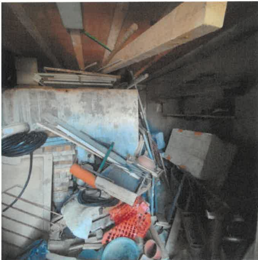
Vista interna del locale cantina in piano seminterrato con accesso dal cortile pertinenziale posto sul fronte Sud