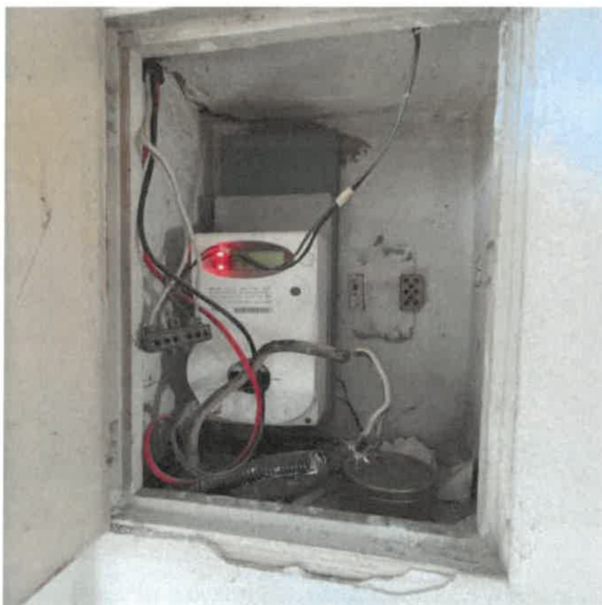
Vista particolare contatore luce – forza