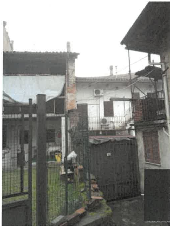
Vista dalla sede stradale pubblica - Via Osvaldo Caldano – dell'accesso pedonale alla proprietà posto sul fronte Ovest