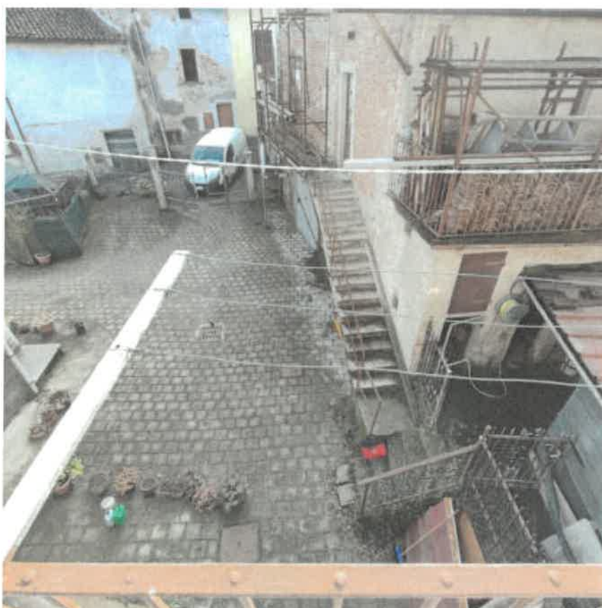
Vista della porzione di cortile pertinenziale posta sul fronte Sud