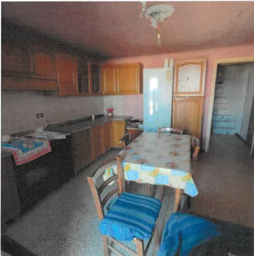
Vista interna locale cucina in piano terra rialzato