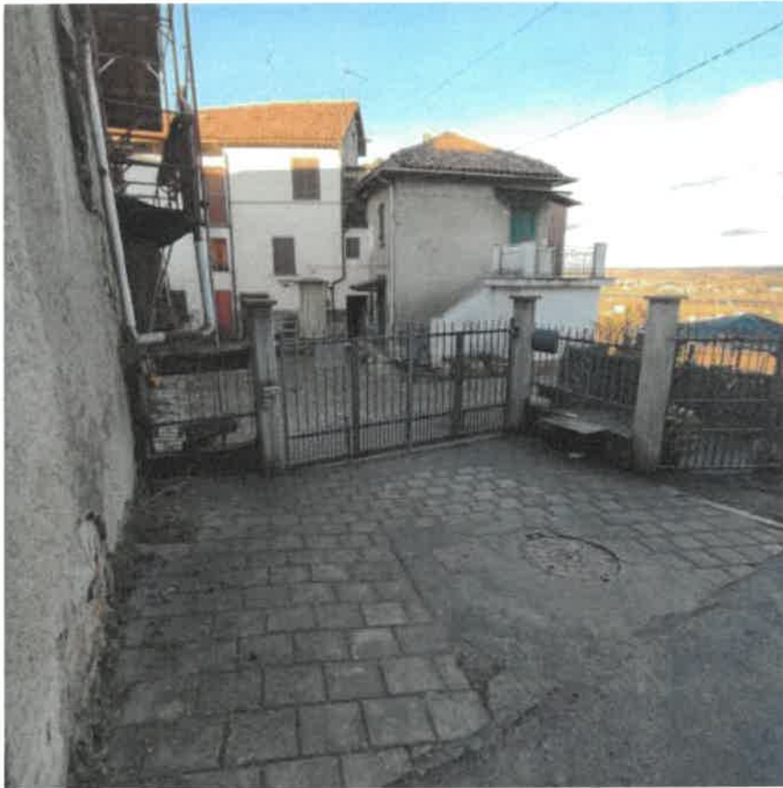
Vista del cancello carraio posto sul fronte Sud della proprietà