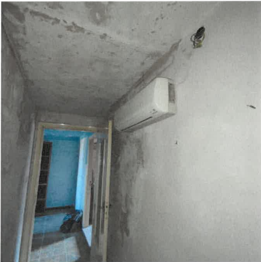
Vista interna vano scala e disimpegno in piano terra rialzato