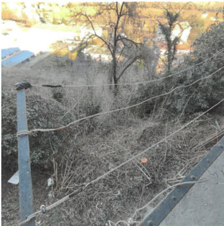
Vista della porzione di cortile pertinenziale a verde posta sul fronte Nord in parte non accessibile