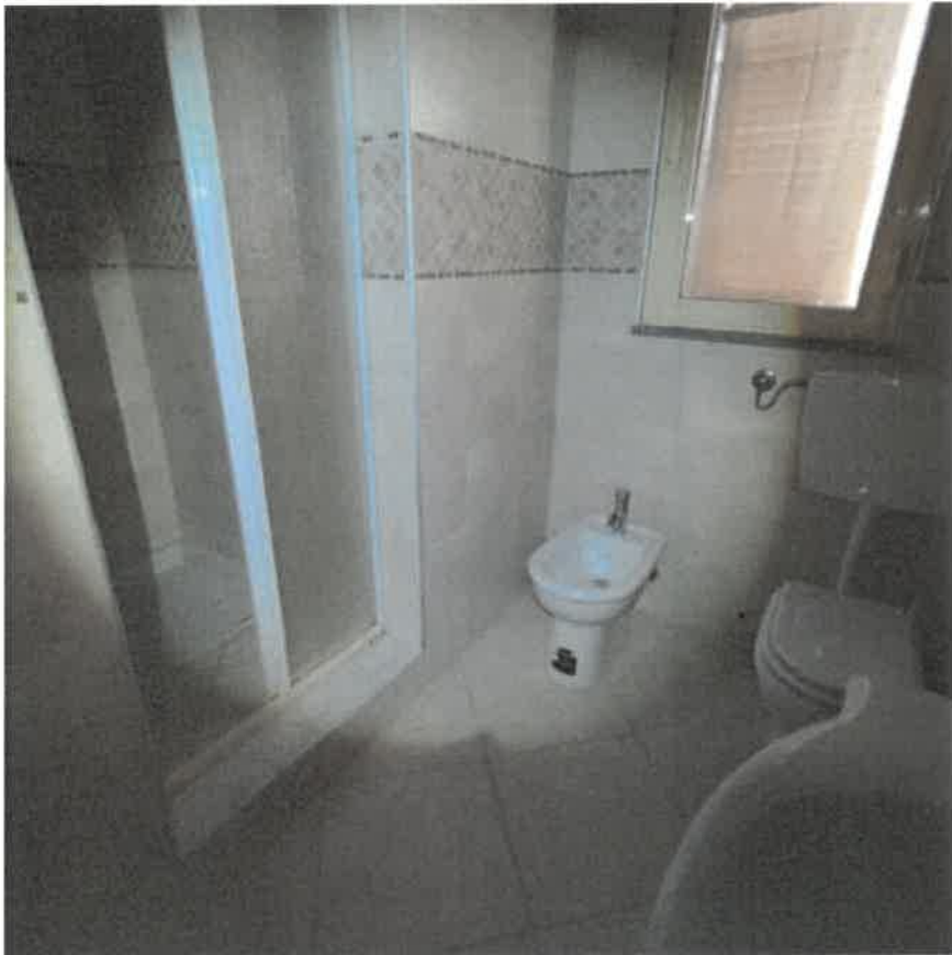
Vista interna locale bagno in piano primo