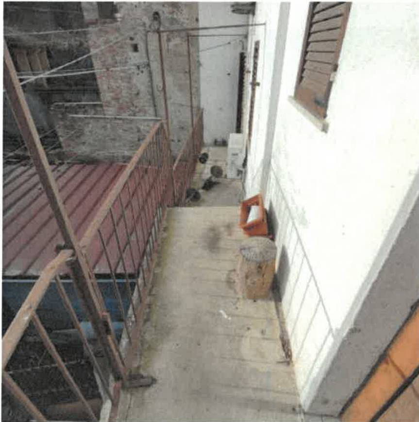
Vista balcone pertinenziale – quota piano primo - in fregio al fronte Sud del fabbricato dal quale viene praticato l'accesso al piano sottotetto