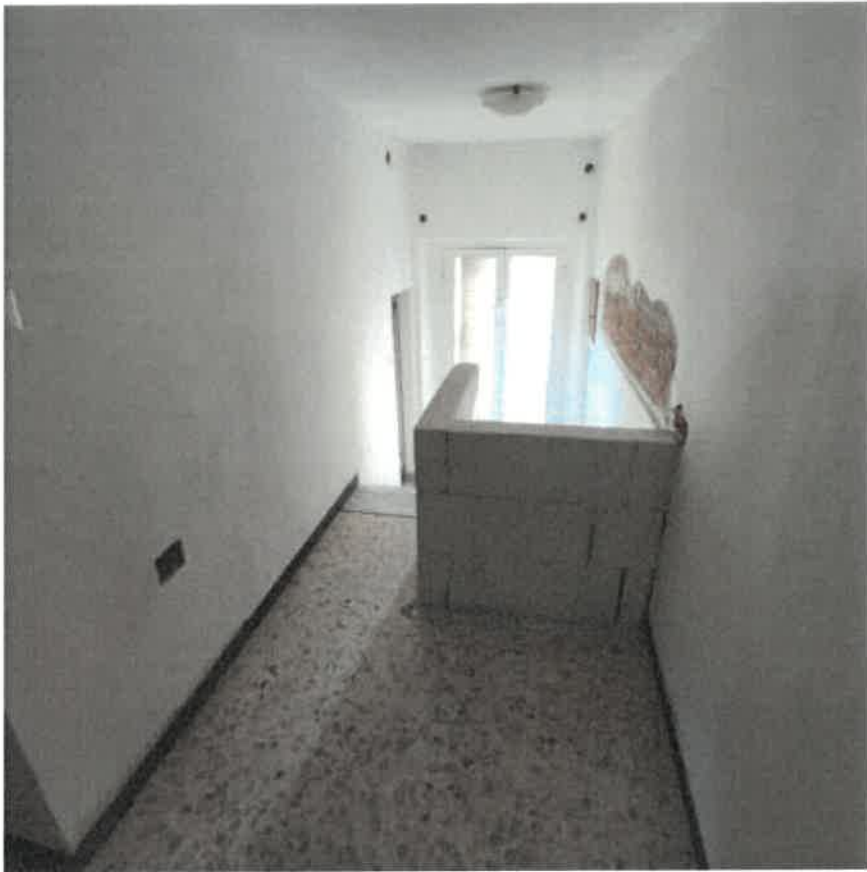
Vista interna vano scala e disimpegno in piano primo