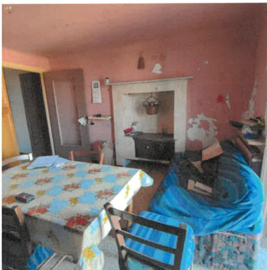
Vista interna locale cucina in piano terra rialzato Vista particolare ammaloramenti interni delle rifiniture