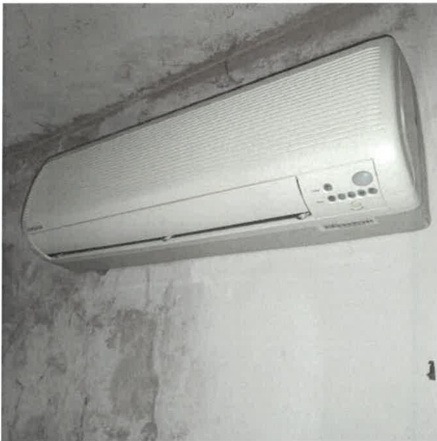
Vista impianto climatizzazione a servizio del fabbricato di civile abitazione