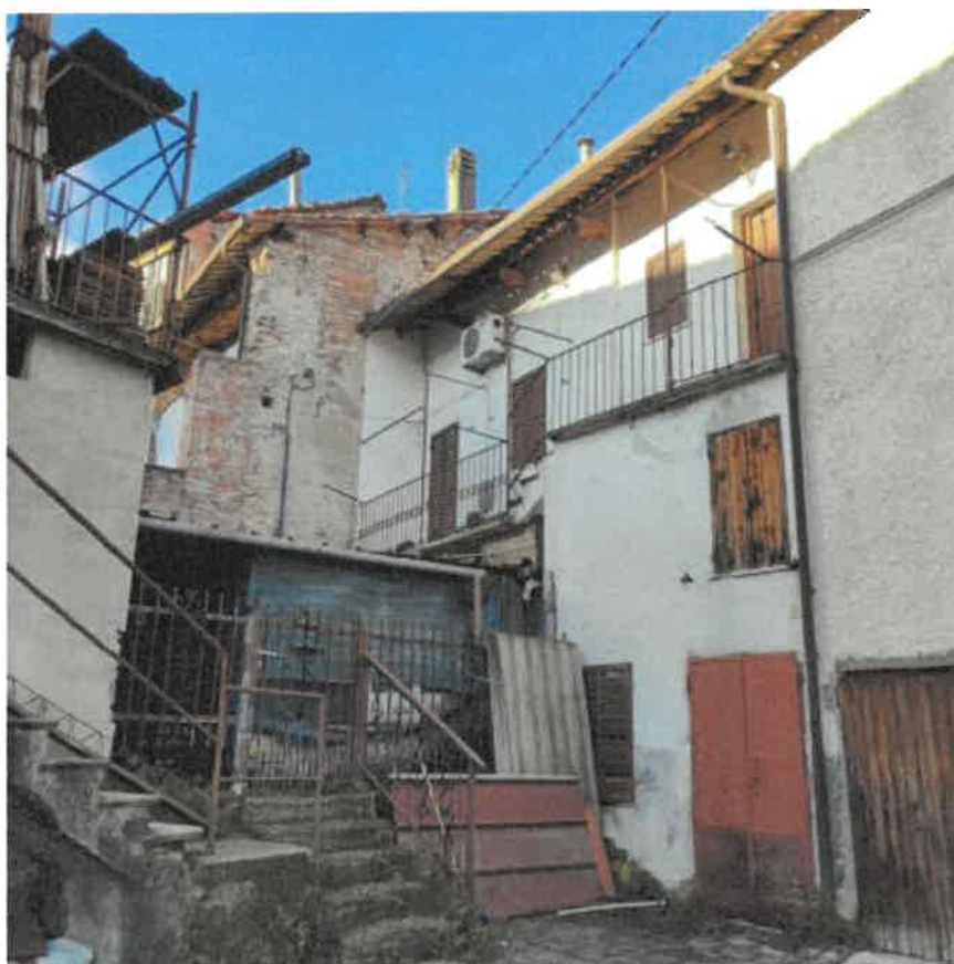
Vista dal cortile pertinenziale del fronte Sud del fabbricato di abitazione