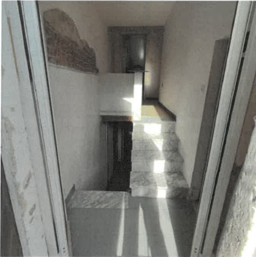
Vista interna vano scala di collegamento quota piano terra rialzato / primo