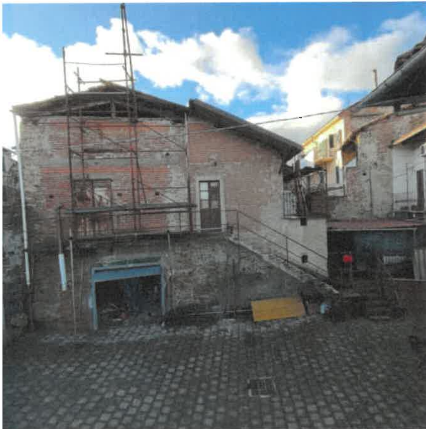
Vista dal cortile interno del fronte Est fabbricato pertinenziale in distacco