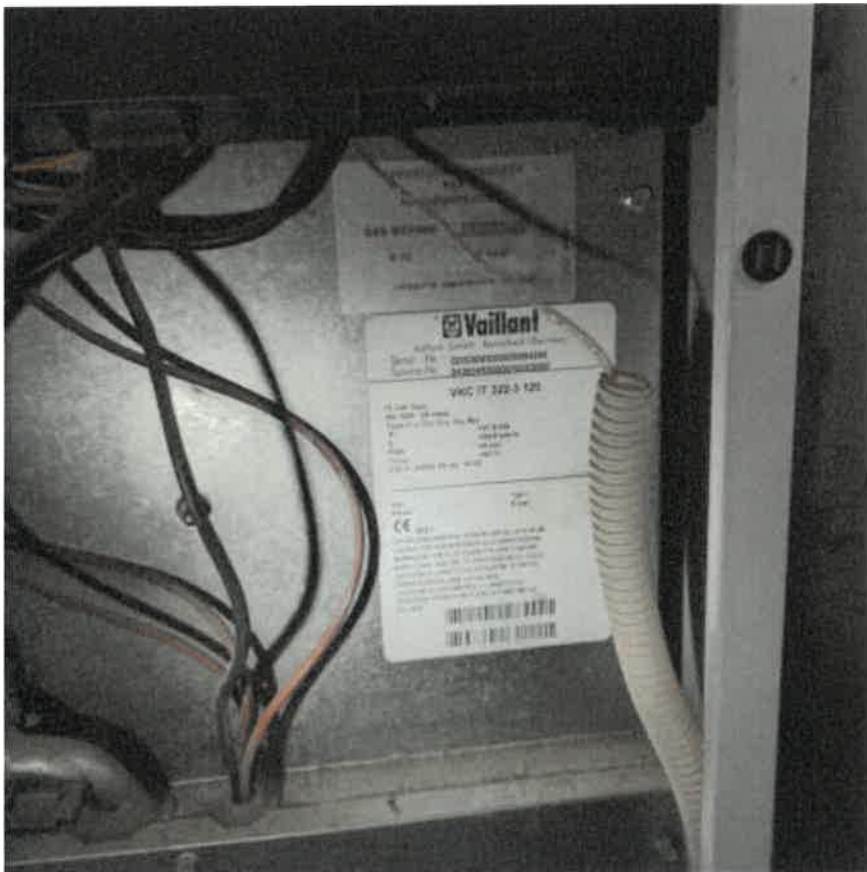
Vista interna del locale centrale termica in piano terra