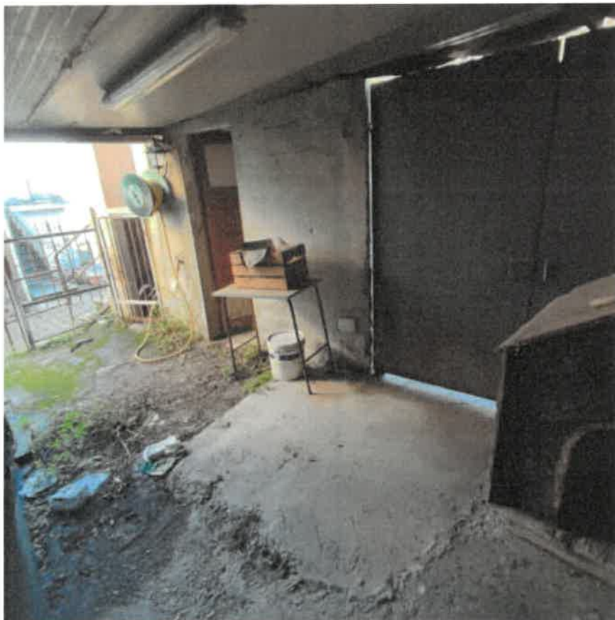
Vista interna dell'accesso pedonale alla proprietà posto sul fronte Ovest