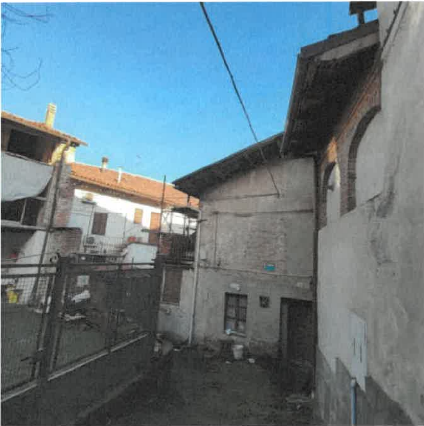
Vista dalla sede stradale pubblica del fronte Ovest del fabbricato pertinenziale in distacco