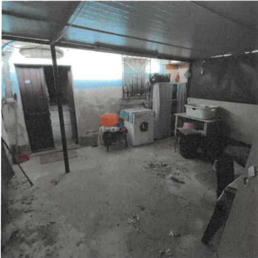
Vista interna dal cortile pertinenziale dell'area antistante al portoncino di accesso alla U.I.U. abitativa