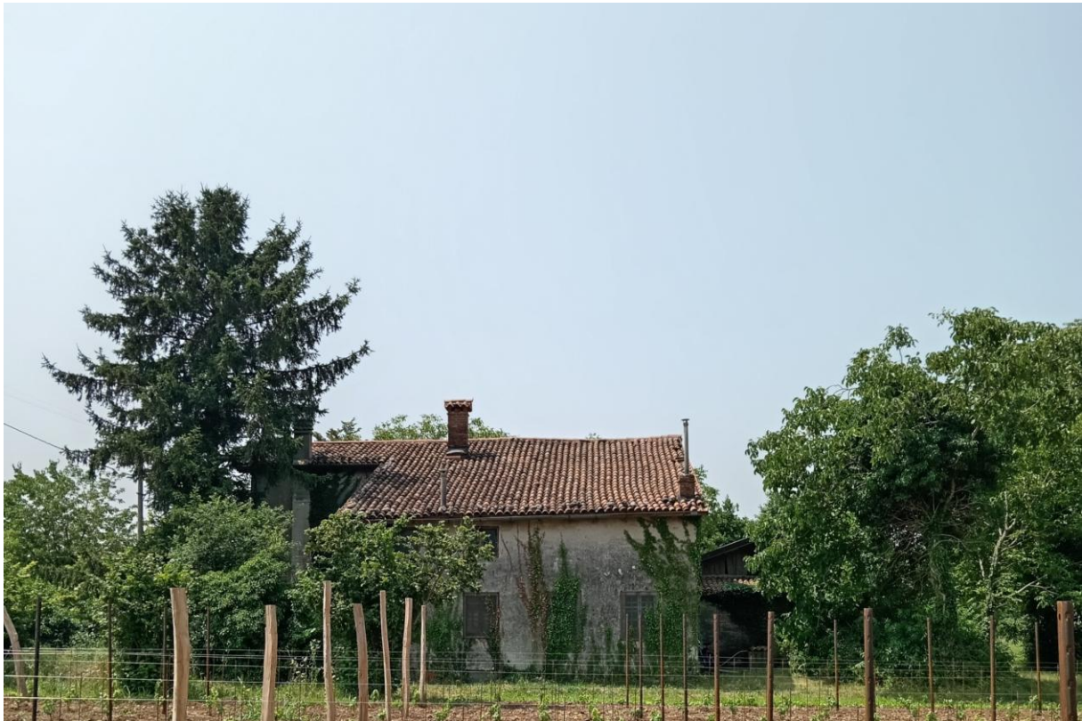
Fotografia n. 6 – Facciate a Sud-Est e Nord-Est