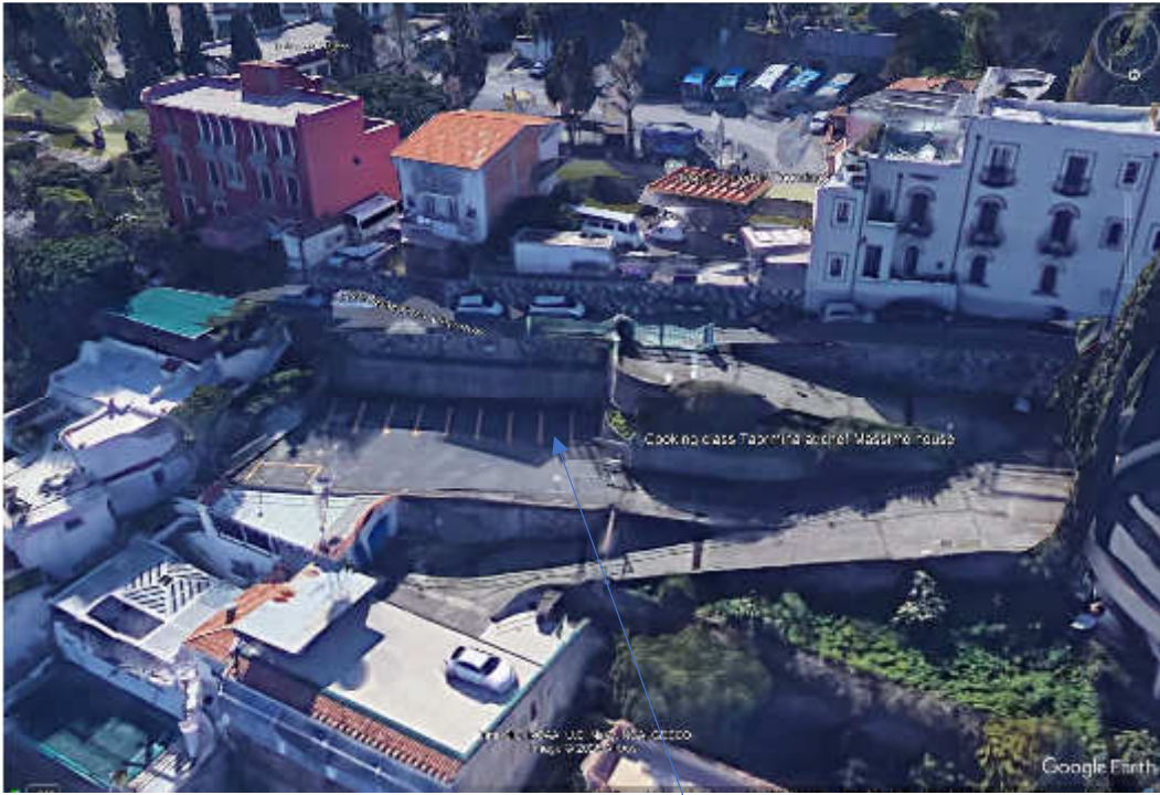
Foto nr. 1 : foto aerea estratta da Google Earth – parcheggio oggetto della presente -