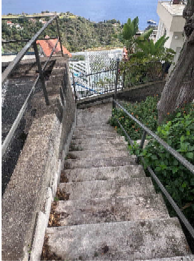
Foto nr. 13: accesso all'immobile consentito da un corpo scala condominiale