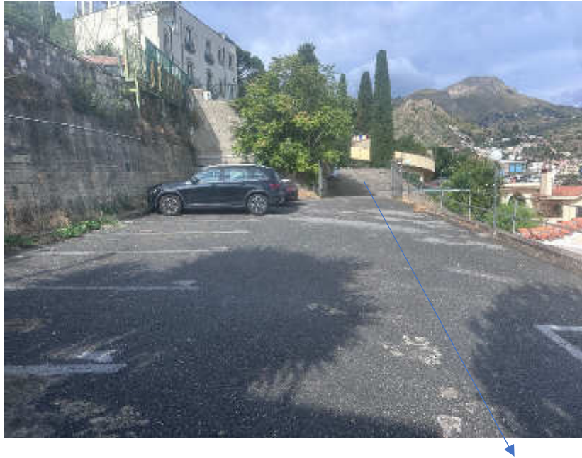
Foto nr. 3 : area di parcheggio ove ricade il sub 11 e la rampa di accesso all'area