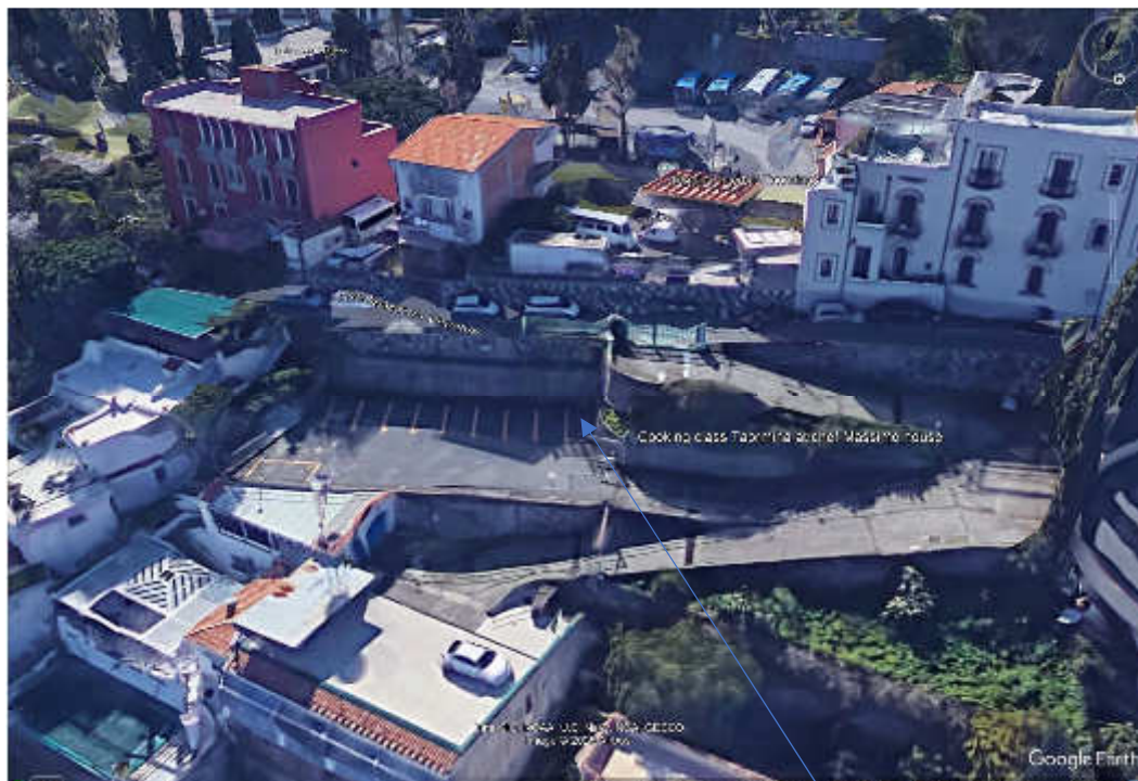
Foto nr. 1 : foto aerea estratta da Google Earth – parcheggio oggetto della presente -