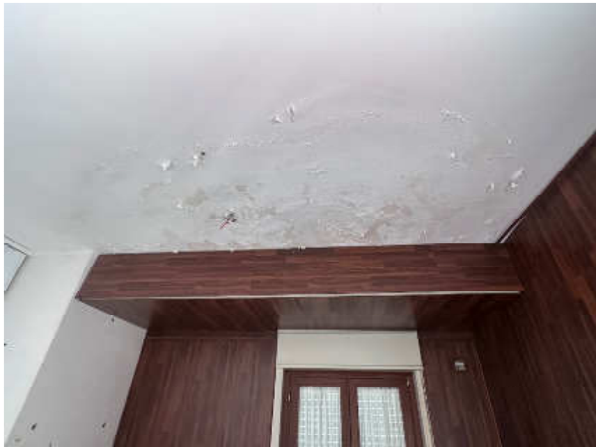
Foto nr.10: particolare dell'infiltrazione di umidità proveniente dal terrazzo soprastante