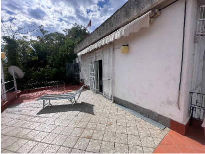
Foto nr.9 : particolare del terrazzo lato mare e della facciata dell'immobile