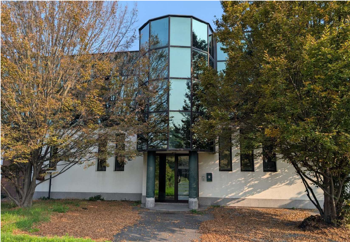
IMMAGINE 1 - Prospetto su via Delle Fabbriche Nuove – entrata blocco uffici