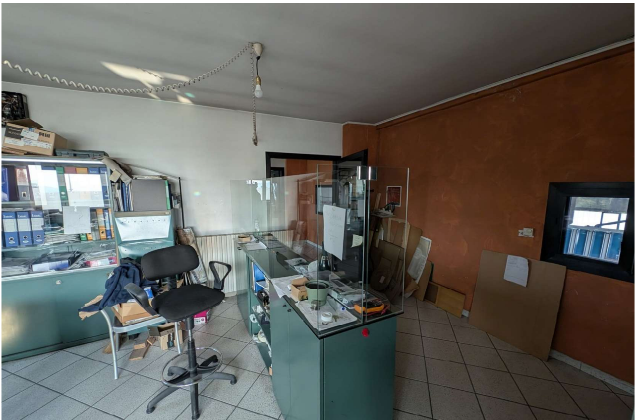
IMMAGINE 12 - Blocco Uffici - Piano Primo - Ufficio (lato est)