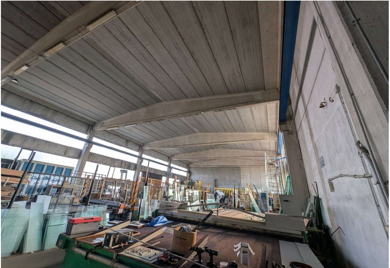
IMMAGINE 6 - Interno del capannone artigianale / produttivo (verso est)