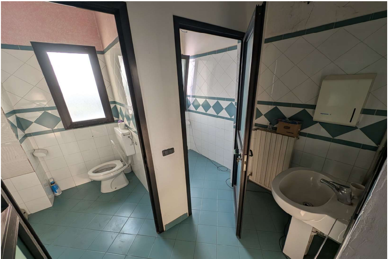
IMMAGINE 17 - Blocco Uffici - Piano Primo - Bagni