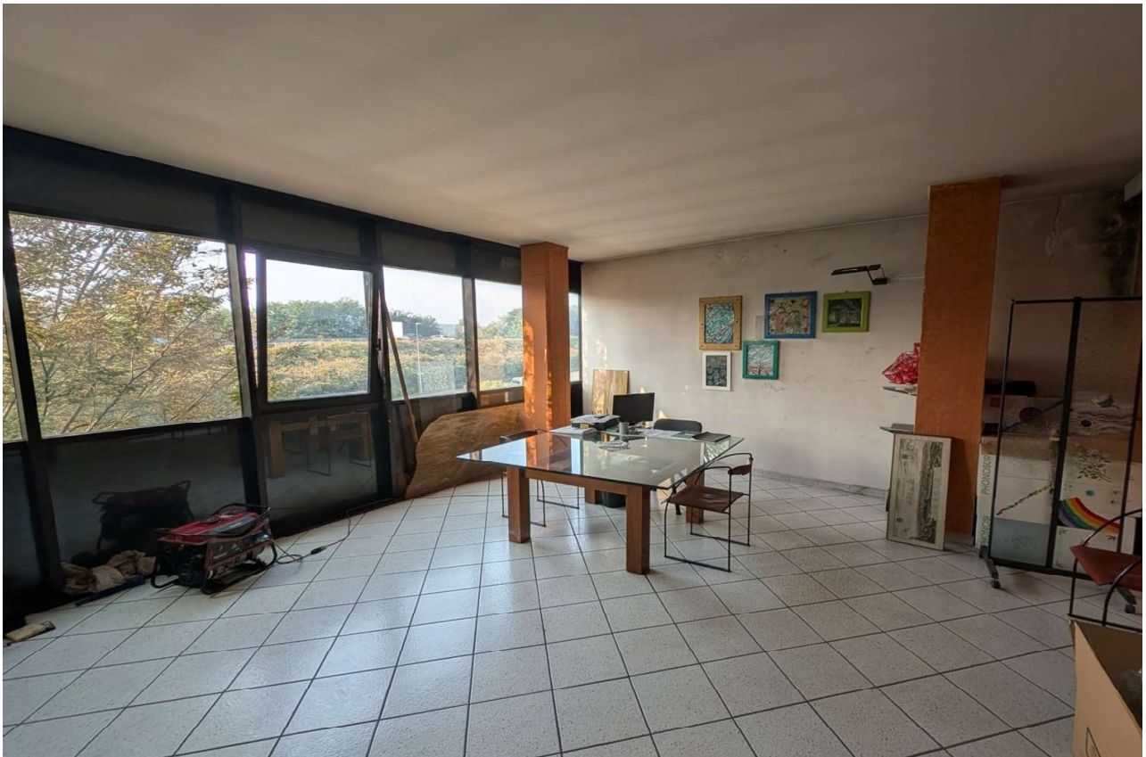
IMMAGINE 10 - Blocco Uffici - Piano Primo - Sala riunioni (lato ovest)