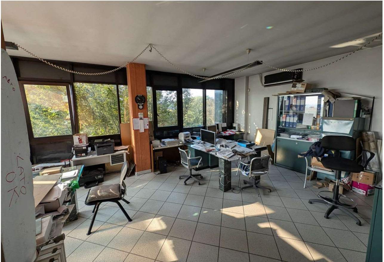
IMMAGINE 13 - Blocco Uffici - Piano Primo - Ufficio (lato est)