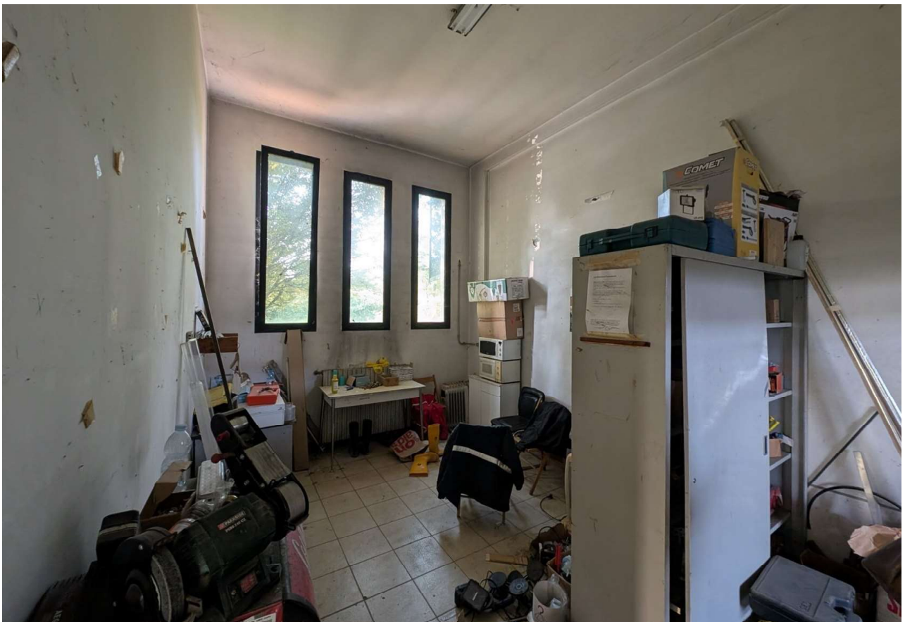
IMMAGINE 7 - Blocco Uffici - Piano Terreno - zona mensa