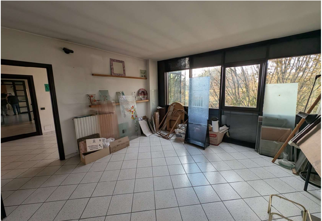
IMMAGINE 11 - Blocco Uffici - Piano Primo - Ufficio (lato ovest)