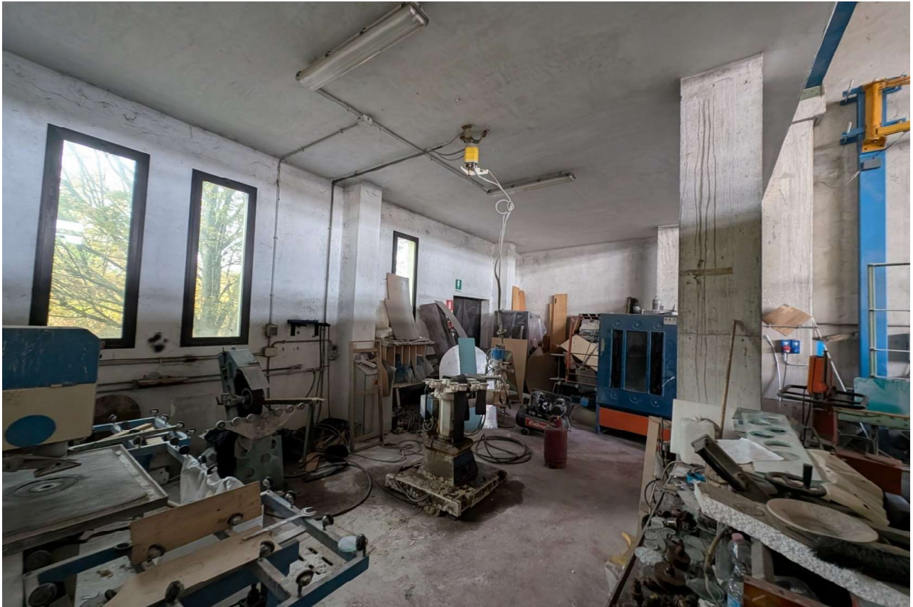
IMMAGINE 7 - Blocco Uffici - Piano Terreno - laboratorio