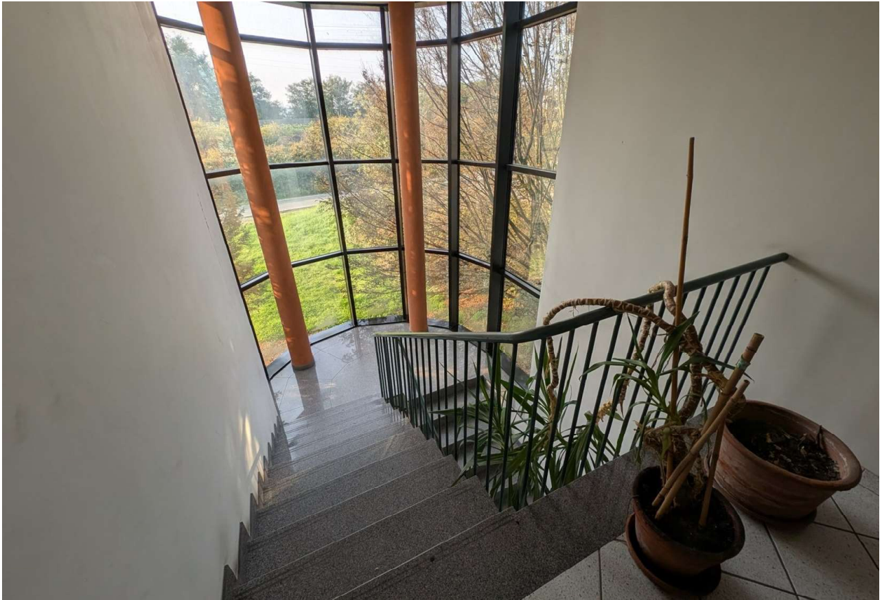
IMMAGINE 9 - Blocco Uffici - Vano scala dal piano primo