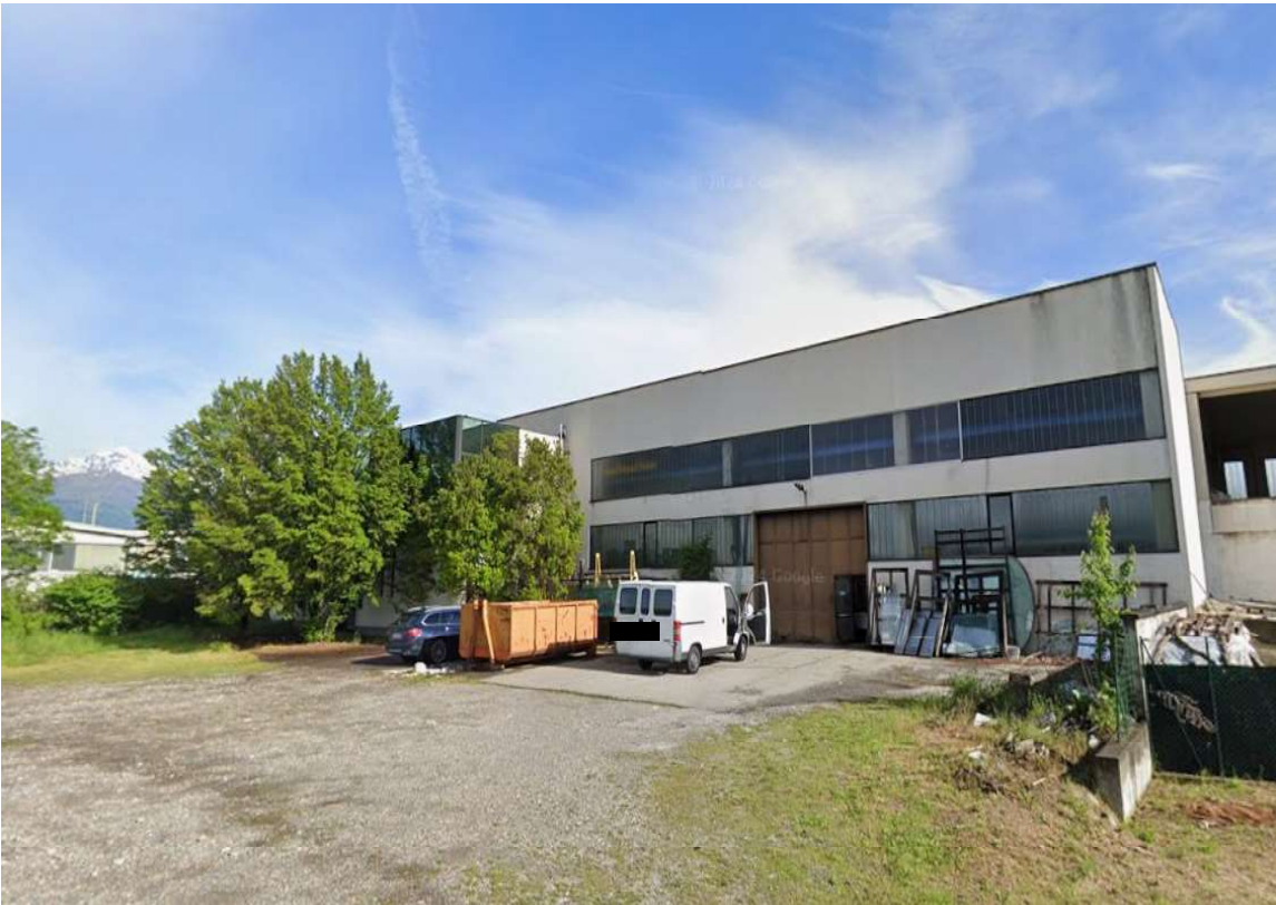
IMMAGINE 2 - Prospetto su via Delle Fabbriche Nuove – area cortilizia sulla pubblica via