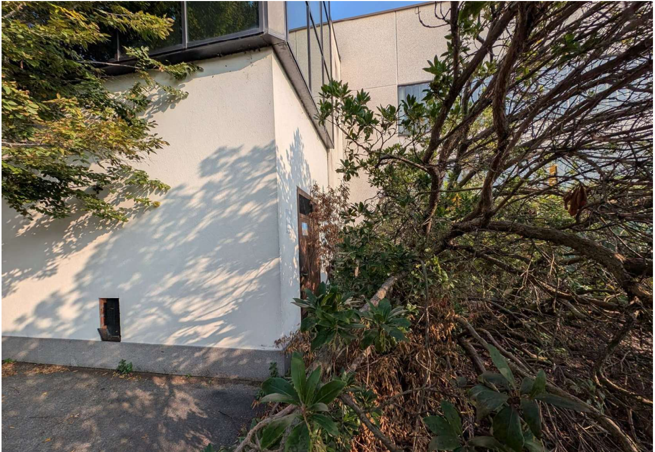
IMMAGINE 3 - Prospetto su via Fabbriche Nuove (con albero caduto che non permette accesso al locale tecnico)