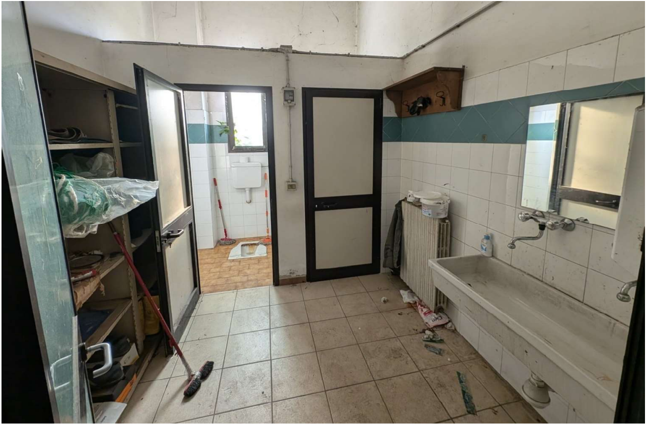
IMMAGINE 7 - Blocco Uffici - Piano Terreno - bagni