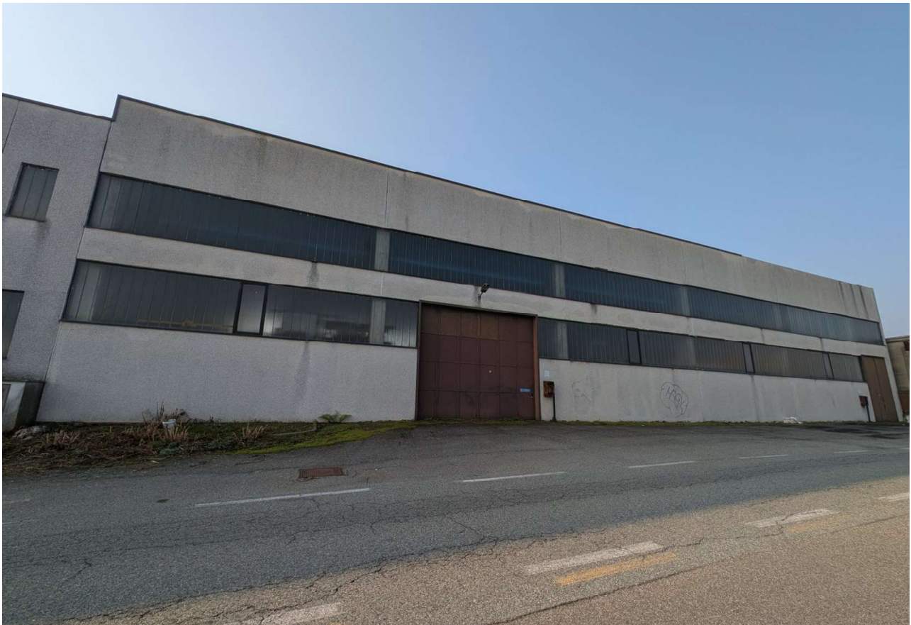
IMMAGINE 4 - Prospetto su via Del Maglio