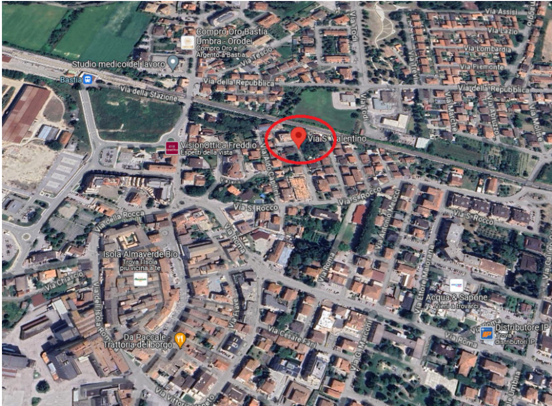
Foto aerea con ingrandimento dell'immobile sito in Bastia Umbra via San Valentino, n. 2