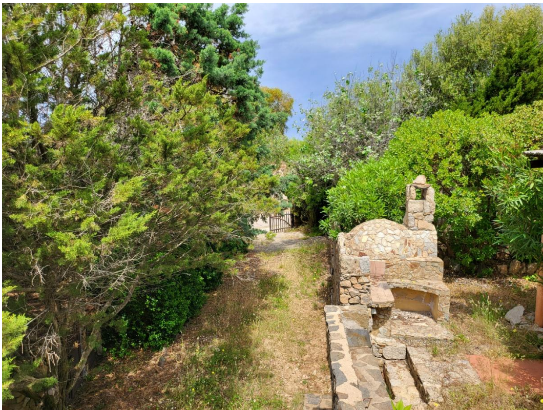
Foto 3- Vista sul percorso di accesso all'immobile e Barbecue