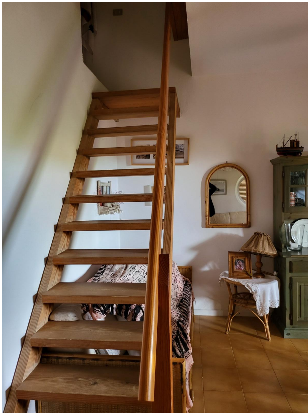
Foto 11- Scala di accesso al piano superiore