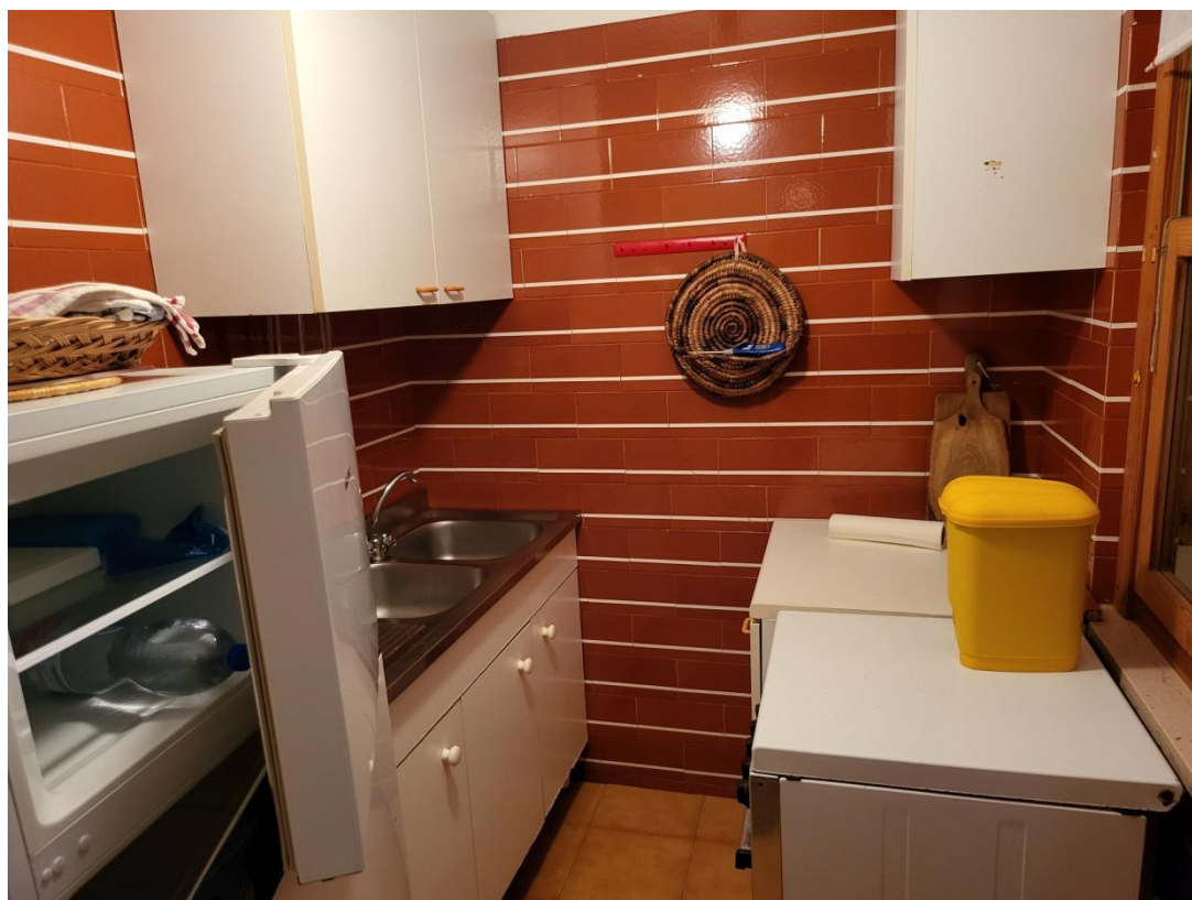
Foto 7- la cucina