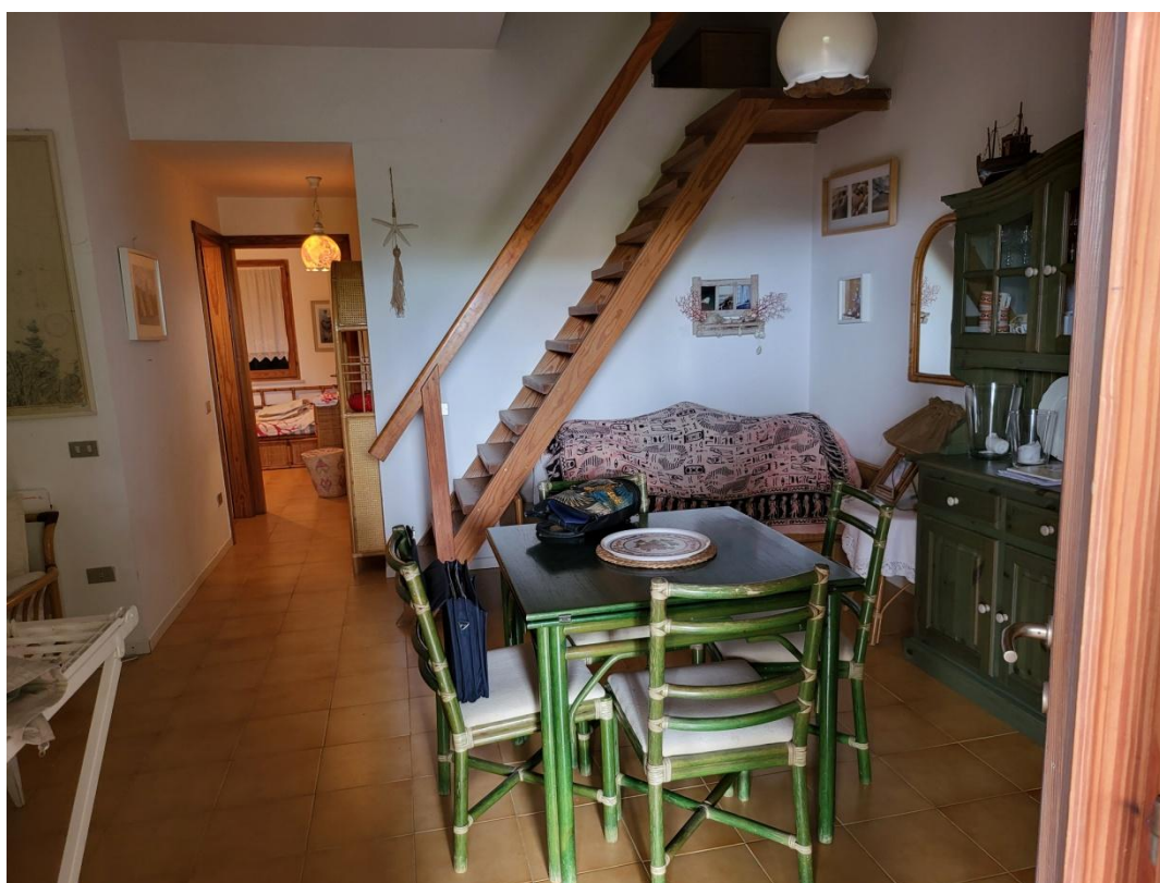
Foto 4- il soggiorno visto dall'ingresso