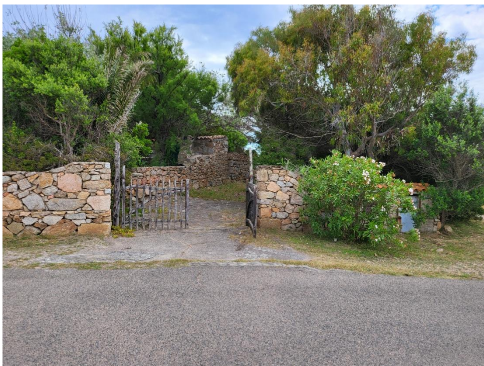
Foto 1- Accesso alla proprietà da via delle Ginestre