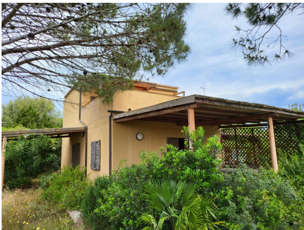
Foto 2- Vista dell'immobile dal lato giardino