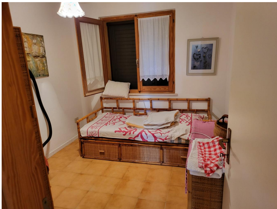
Foto 9 e 10 - Camere al piano terra