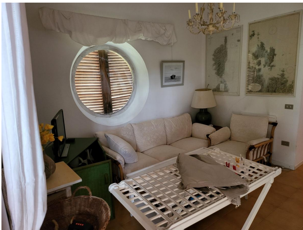
Foto 5- il soggiorno