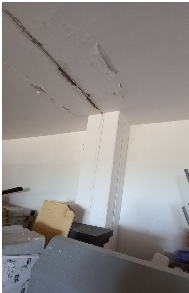
SUB 80 (P.LLA 25) – LOTTO 1