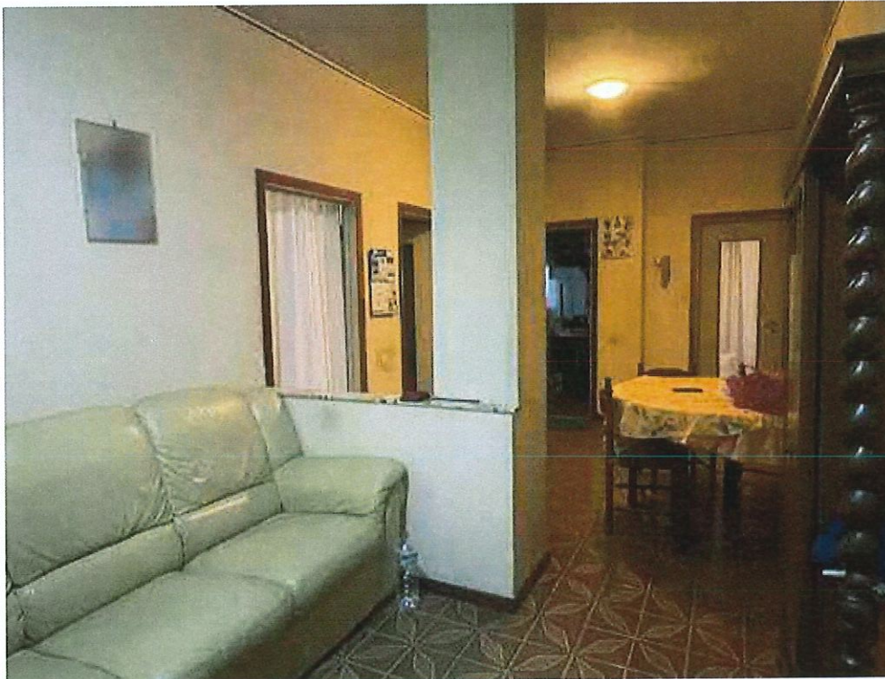
Ingresso e disimpegno