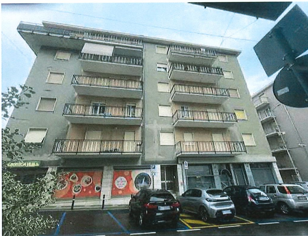
Ingresso da via Angelo Giuseppe Roncalli, 9