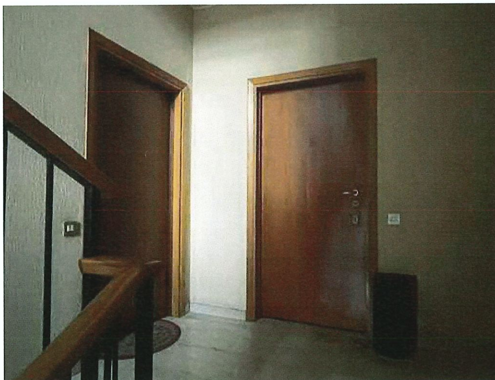
Porta di accesso all'appartamento al piano primo