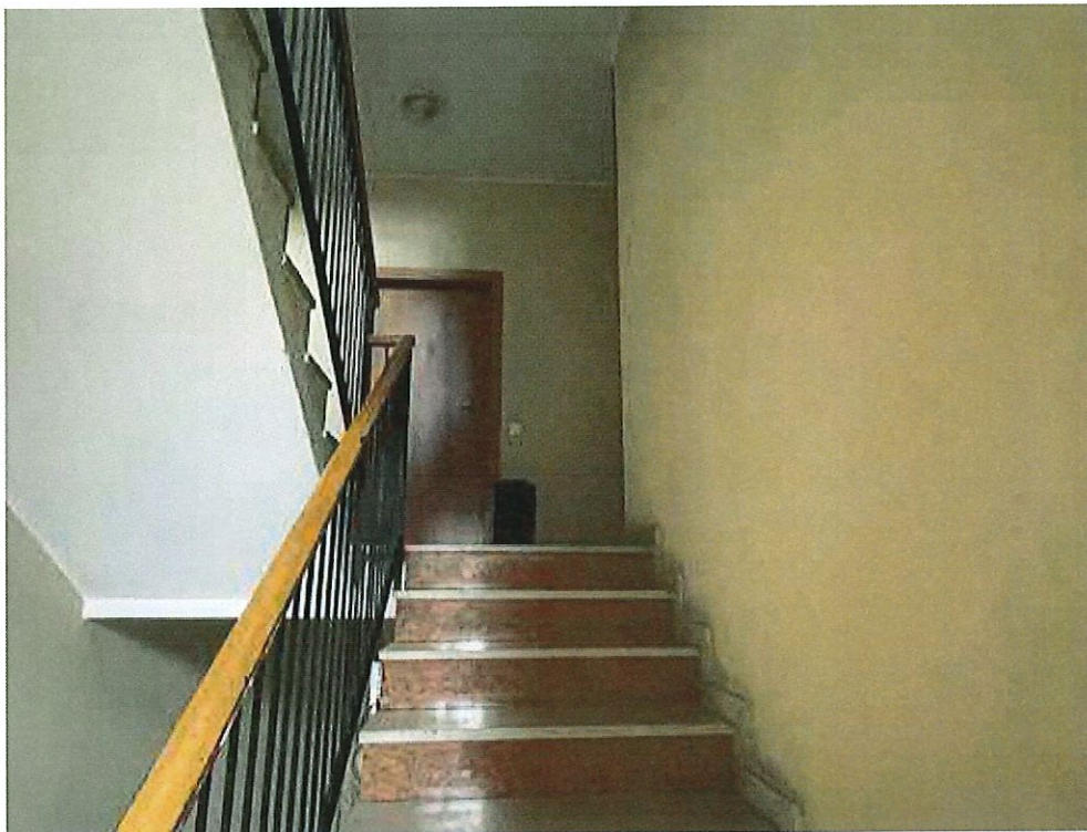
Scala comune di accesso