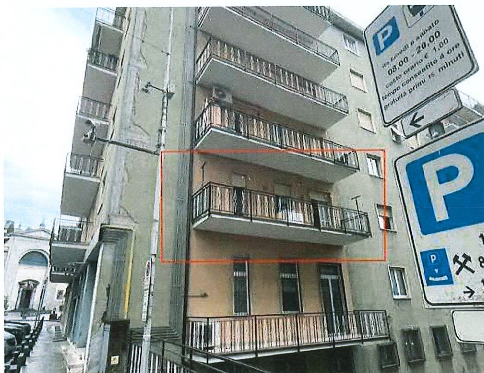
Balcone al piano primo