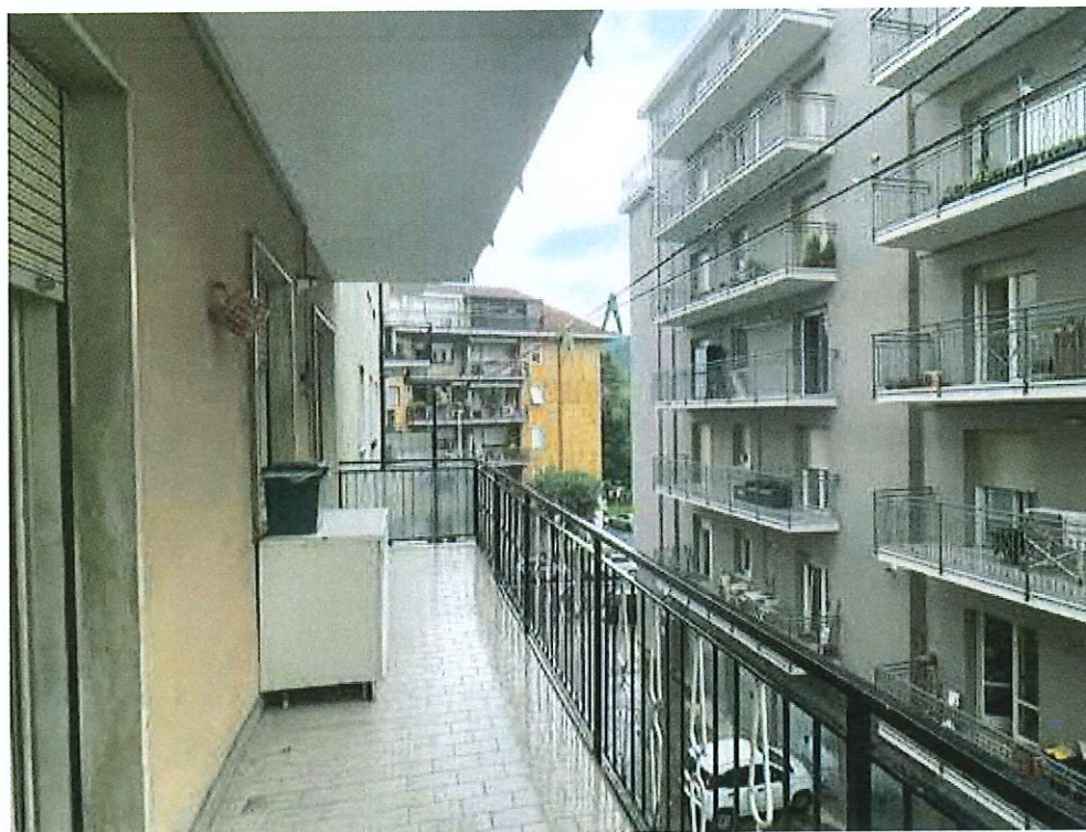
Balcone al piano primo