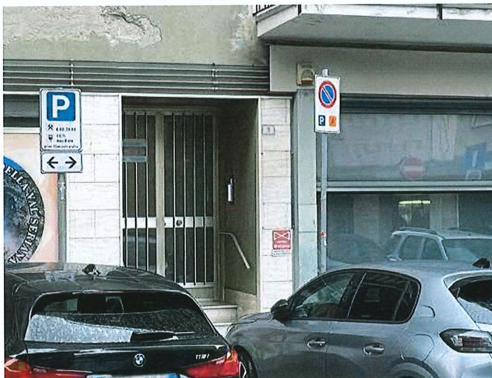
Ingresso da via Angelo Giuseppe Roncalli, 9