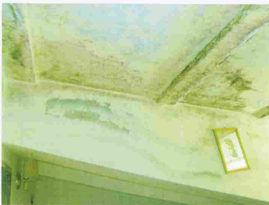
Foto n° 50 – Locale Camera n. 2; vista delle tracce di umidità nel soffitto.