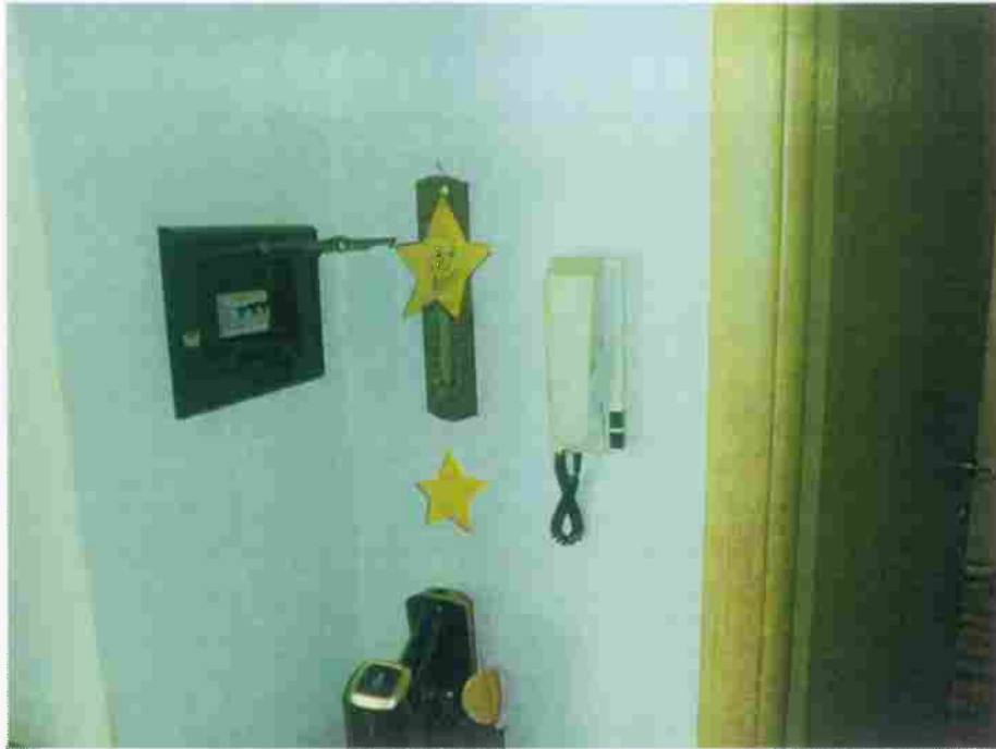
Foto n° 31 – Locale Ingresso-Soggiorno-Cucina; posizione del quadro elettrico e del citofono.