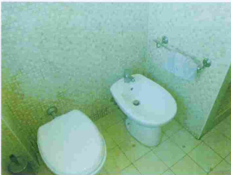
Foro n° 43 – Bagno.