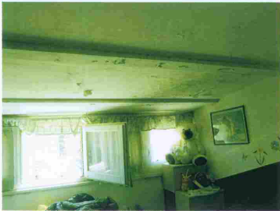
Foro n° 54 – Locale Camera n. 1; vista delle tracce di umidità nel soffitto.