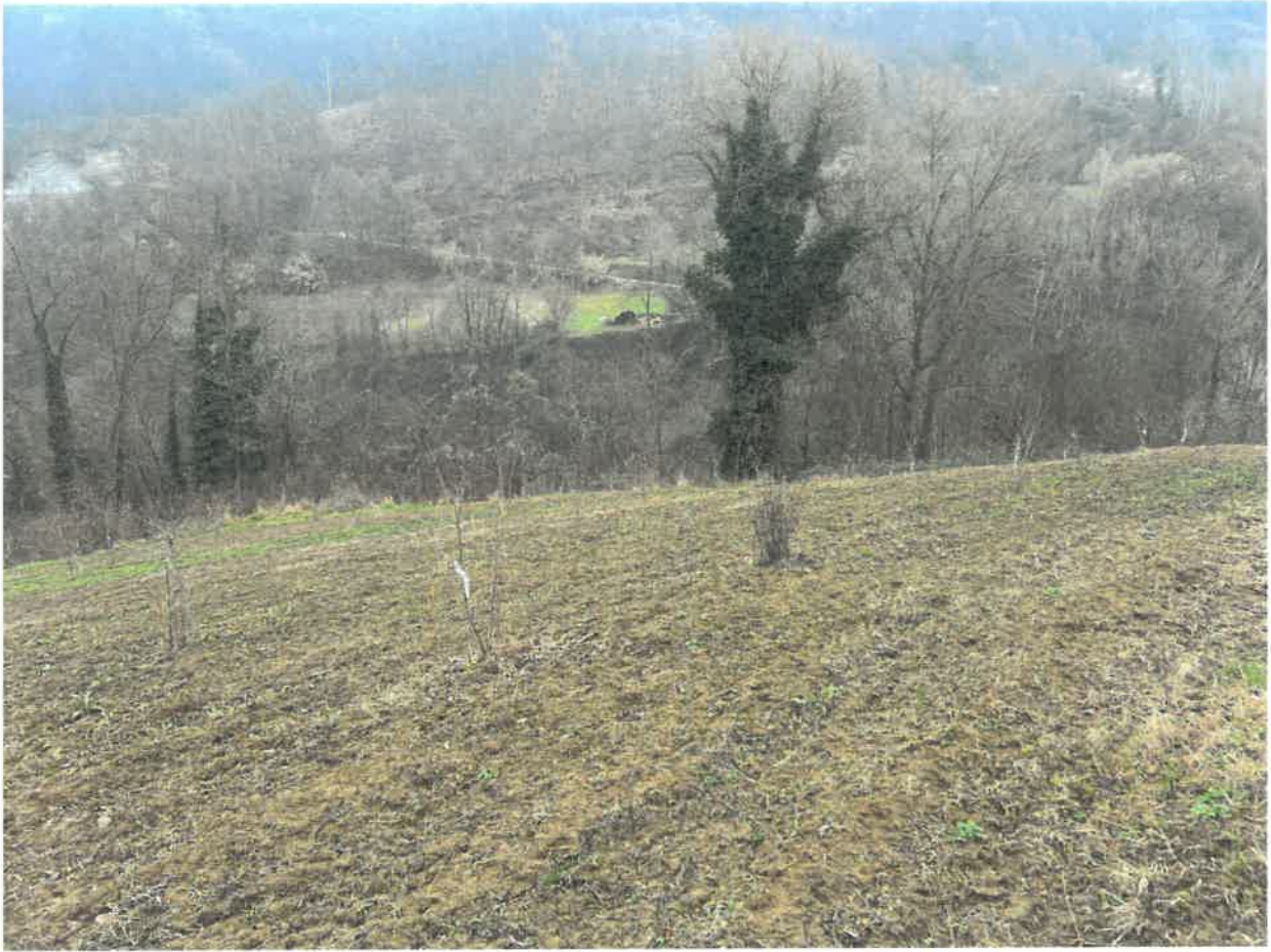
Figura 1 F 12 nm 41 impianto di nocciolo