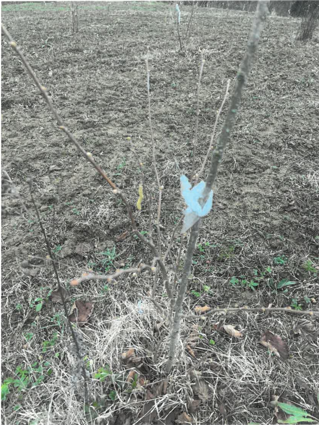
Figura 2 dettaglio nm. 41

NB: i terreni boscati non sono raffigurabili con fotografie che non sarebbero rilevanti, si rimanda alle vedute aeree