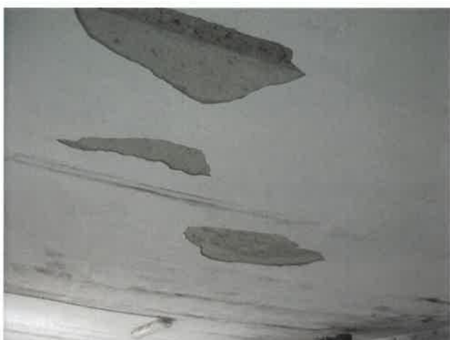
Distacco intonaco zona lavorazione piano terreno Lotto 2