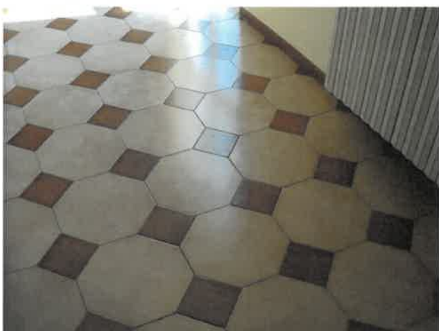
Pavimentazione zona uffici Lotto 2