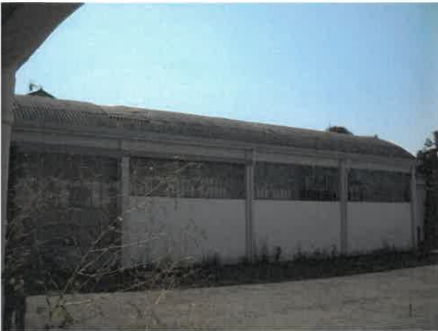
Capannone a volta lato cortile - Lotto 2