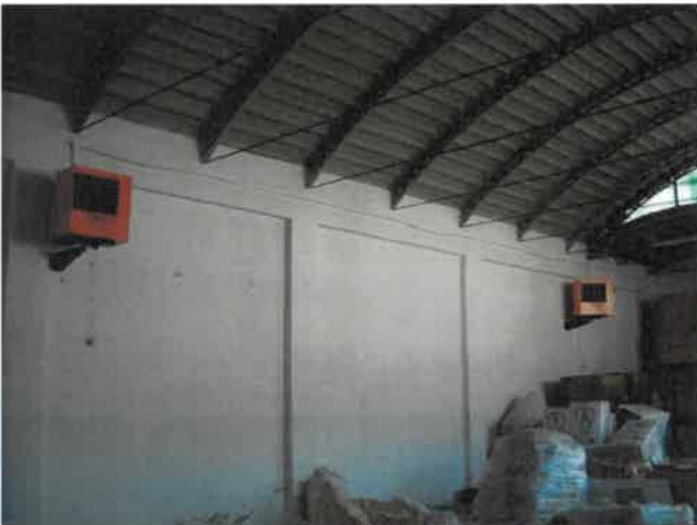
Interni capannone a volta Lotto 2