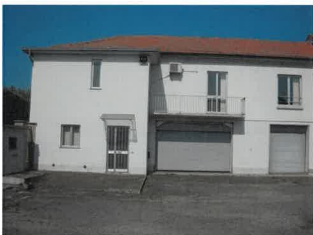
Locali produttivi zona rimesse ed uffici Lotto 2