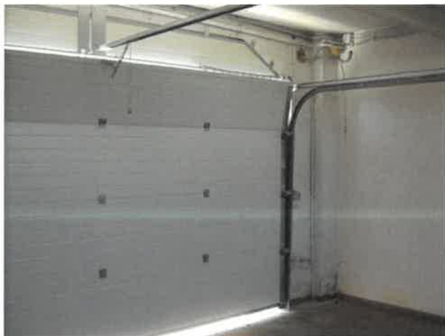
Basculante motorizzato piano terreno Lotto 2