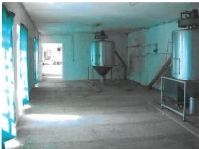
Zona lavorazione piano terreno Lotto 2