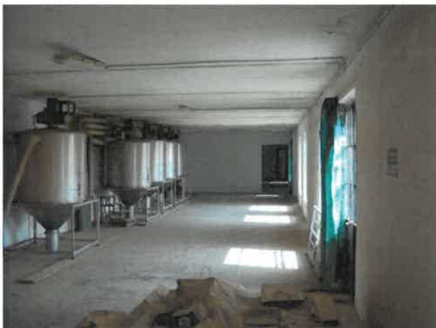
Zona lavorazione piano primo Lotto 2