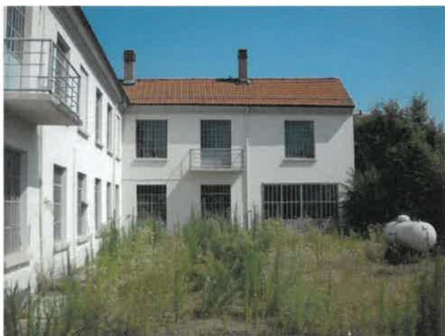
Prospetto su cortile interno locali produttivi Lotto 2