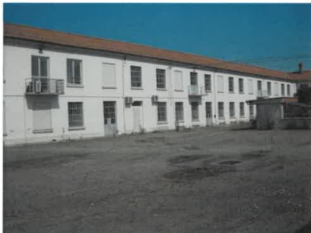
Locali produttivi da cortile mappale 865 sub.6 - Lotto 2