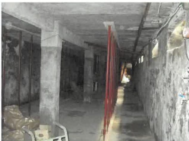
Piano interrato puntellato sottostante zona lavorazione Lotto 2