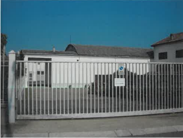
Capannone a volta lato strada mappale 865 sub.6 - Lotto 2