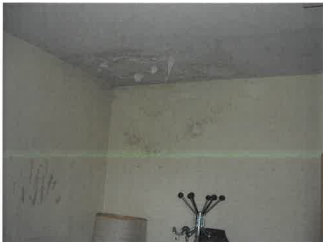
Infiltrazione zona uffici piano primo Lotto 2