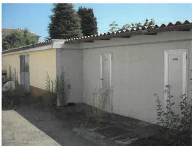
Blocco servizi esterno Lotto 2