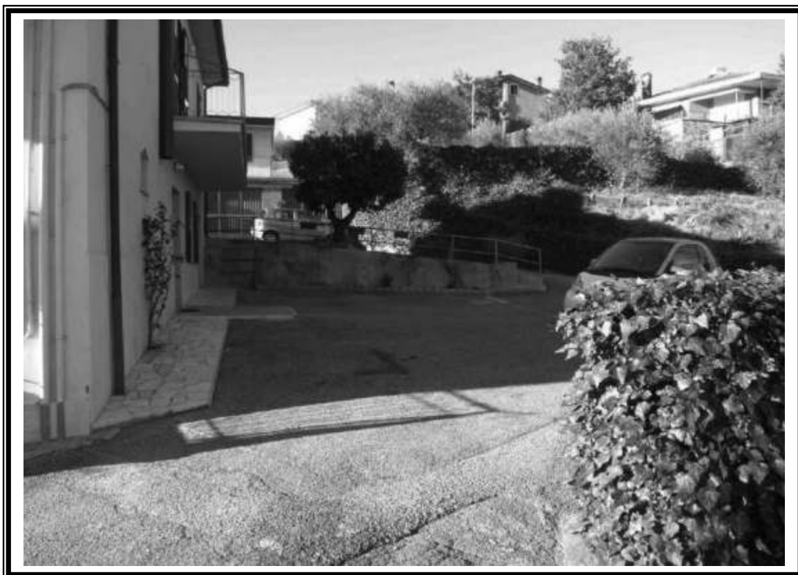
vista di lato U.I. abitativa al piano terra