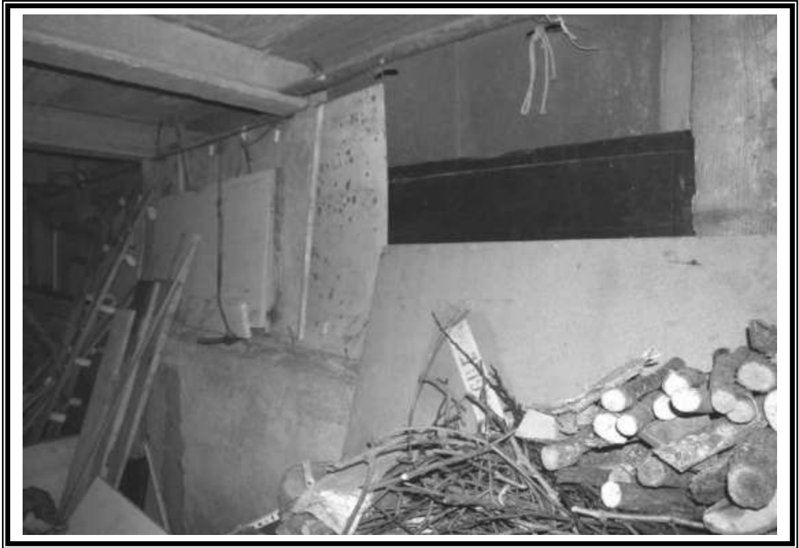
Corpo di fabbrica garages