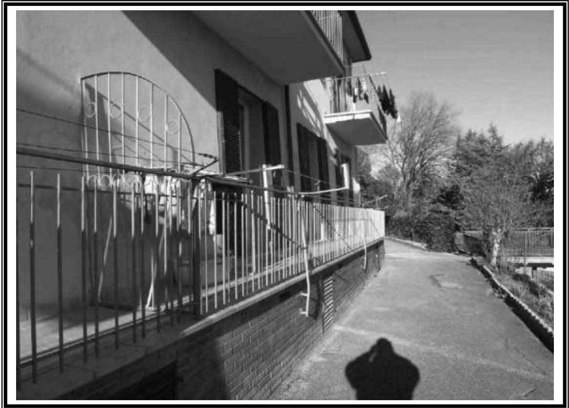
Terrazzo esclusivo U.I. al piano terra