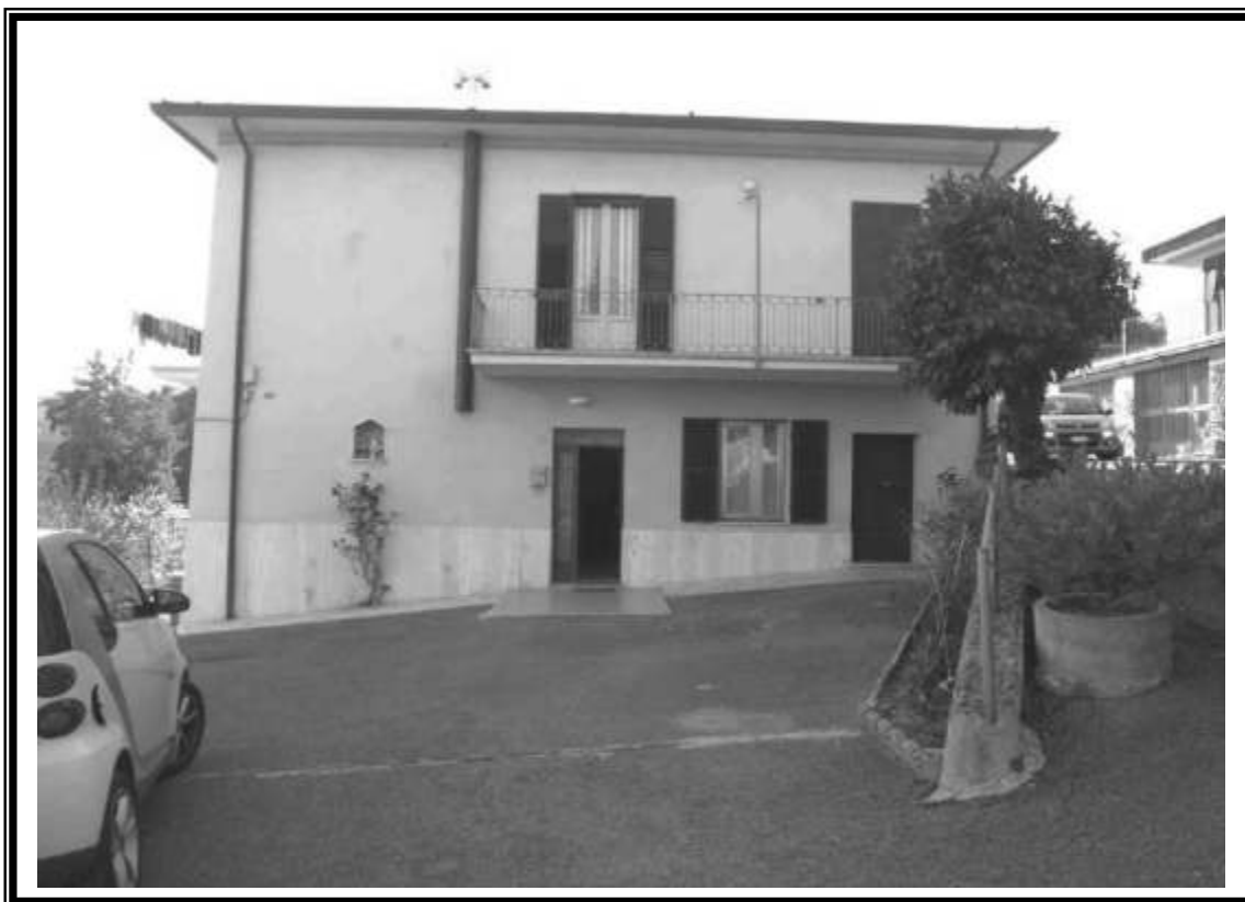
Ingresso al p.terra dalla corte comune appartamento fg. n.220 particella 212 sub.1 FOTO N. 02