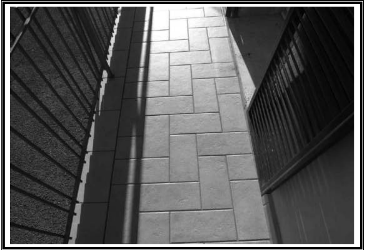
Lastrico di accesso e scala locale fondo particella 985 sub.2