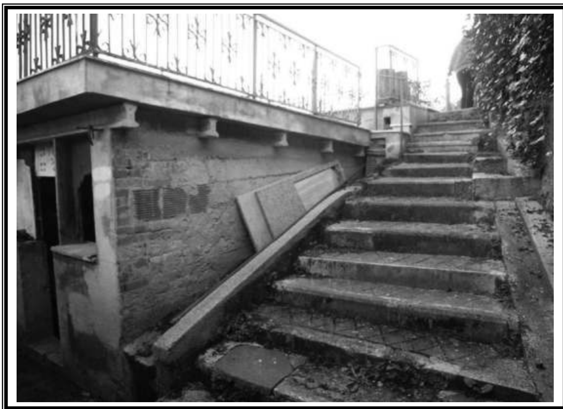
Corpo di fabbrica ospitante due fondi